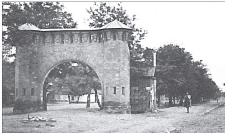
Крепостные ворота в старом городе