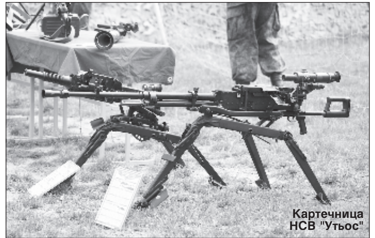
Картечница НСВ "Утьос"

течницата "Калашников" и голямокалибрена картечница НСВ "Утьос". "Ясно е, че в светлината на своята санкционна политика американците просто се срамуват да