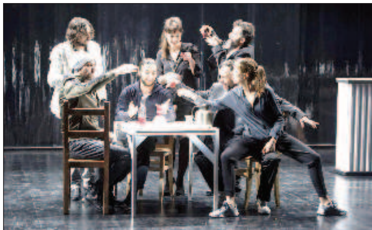
Сцена от постановката на Лакаскад "На дъното". "За първи път се потапям в мрачния свят на дъното - казва Лакаскад. - Това е първото произведение в историята на театъра, където бедняците и отхвърлените са герои. Целта на този спектакъл е да покаже цялата политическа, социална и човешка мощ на пиесата, отразяваща една епоха, която се връзва с нашата"

Френският режисьор Ерик Лакаскад ще представи през ноември в Москва спектакъла "На дъното" на Горки. Това ще стане в рамките на Биеналето на театралното изкуство, каза на пресконференция в ТАСС директорът на биеналето Елмира Шчербакова. "Имаме прекрасен специален проект "Дати". Всяка година се честват юбилеи, става нещо интересно. Тази година Ерик Лакаскад показва спектакъла "На дъното", защото честваме 150 години от рождението на Максим Горки". Това ще стане на 20 и 21 ноември.