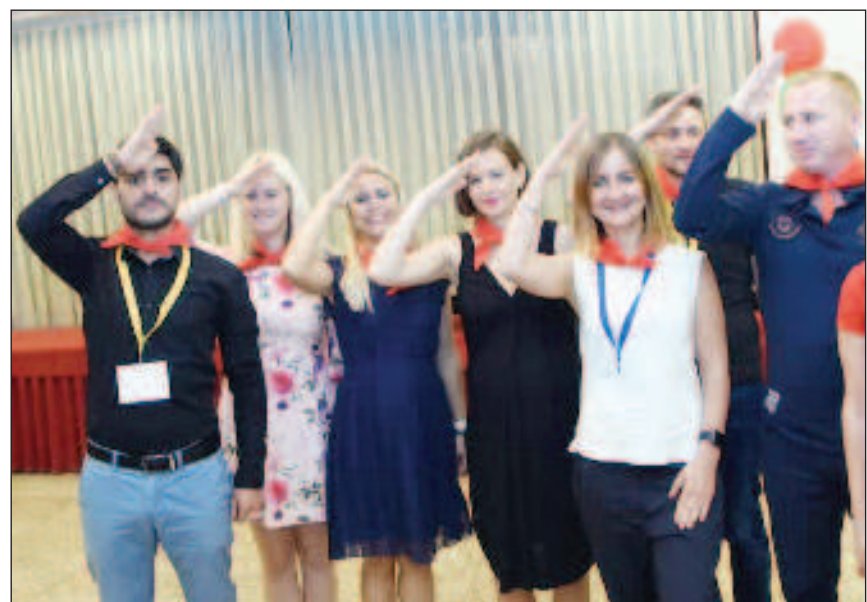
Завершился день вечеринкой в пионерском стиле, который раскрыл всесторонние таланты участников форума