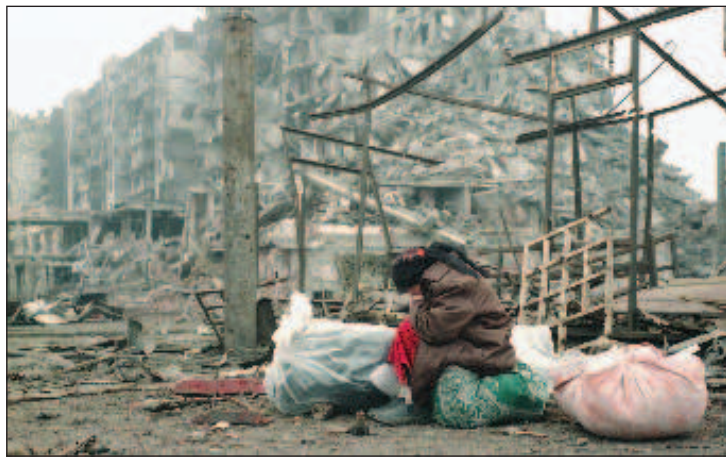
Грозный - 1998 года

сущих гарнизонную службу частей. Сама крепость и прилегающая к ней территория были обнесены рвами. Постройки в Грозной были деревянными или турлучными (состоящими из вкопанных в землю шестов, переплетенных лозой или хворостом и обмазанных глиной), редко саманными (построенными из глинистого кирпича, состоящего из смеси глины, песка и соломы), все постройки имели крыши из камыша.