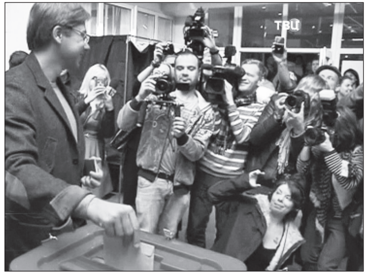
Голосует мэр Риги Нил Ушаков

Помимо "Согласия", по данным ЦИК, в парламент также прошли "Кому принадлежит государство" (получили 14,25 процента голосов), Новая консервативная партия (13,59 процента), объединение "Для развития/За!" (12,04 процента), национальное объединение "Все для Латвии! - Отчизне и свободе/Движение за национальную независимость Латвии" (11,01 процента), Союз зеленых и крестьян (9,91 процента), который