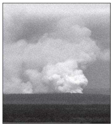
Пожар на складе боеприпасов под Ичней в Черниговской области

Интенсивность взрывов на складе значительно снизилась, передает Интерфакс. По состоянию на 7:00 утра она составляла два-три ра-