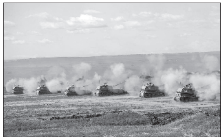
Артилерийските подразделения създават огневи вал пред настъпващите войски

Огневият вал беше създаден със силите на шест гаубични дивизиона, дивизиони реактивни системи за залпов огън "Смерч" и "Ураган", самоходни артилерийски установки "Акация", "Гвоздика", "Мста-С" и минохвъргачна батарея, съобщиха още от пресслужбата на Южния военен окръг. Артилеристите са поразили повече от 150 цели на услов-