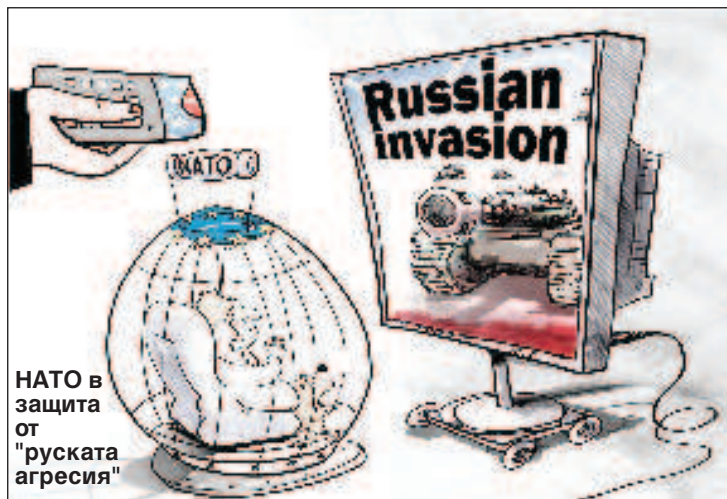
НАТО в защита от "руската агресия"

ративното мероприятие светая светих на съвременната английска литература - Хари Потър. Съобщени на лековерните поданици на Нейно величество, че Кремъл води "мощна тайна кампания", за да замъгли неукрепналите мозъчета на малолетните британчета. За целта руски сайтове, маскирани като фенове на фантастичния литературен герой и борци за правата на гейовете, привличат любители и без те да забележат "хитрата руска следа", им внушават да участват в улични демонстрации и други протестни действия, насочени срещу държавата.