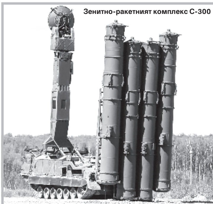
Зенитно-ракетният комплекс С-300

рече това "някакви неадекватни движения", вместо нормално сътрудничество между двете страни. "Това обаче не е изборът на Русия", резюмира Клинецвич.