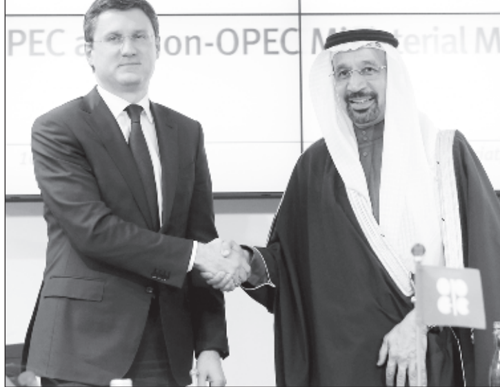
Александър Новак и саудитският му колега се договарят за увеличаване на добива на петрол

равим хъб, без да се договорим с руснаците, че част от "Турски поток" ще мине през България, или ще дойде директна тръба, което вече е почти илюзорно. Тоест, влизаме в голям сложен комплекс от въпроси, които не могат бъдат реша-