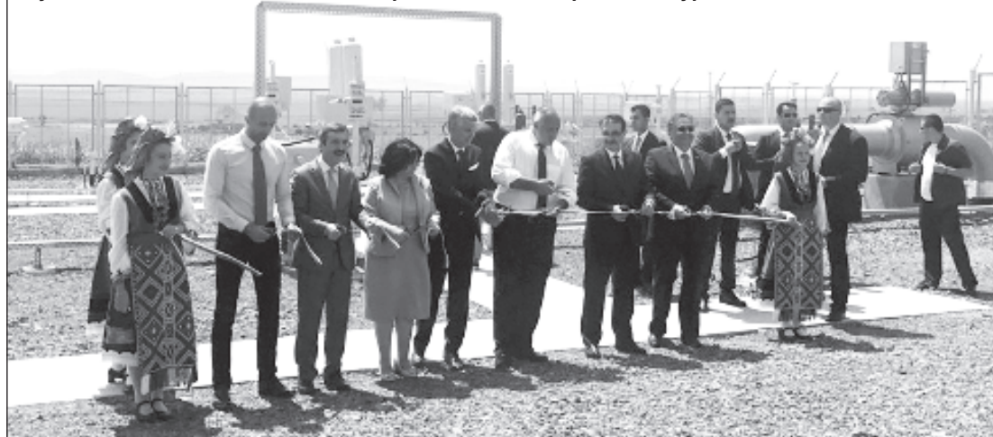
Бойко Борисов и Теменужка Петкова режат лентата на отсечката в участъка Лозенец-Недялско на транзитния газопровод от Турция

цена може да бъде предоговаряна. По новите условия "Булгаргаз" вече може да иска промяна на цената на всеки 2 години, вместо на 4 години, както беше досега. Това обаче става при строго определени условия - когато цената за България се различава от тази на границата на Германия, Франция и Италия", каза тя. Петкова добави, че сега българската газова компания правела анализ на енергийния пазар, за да прецени действията си.