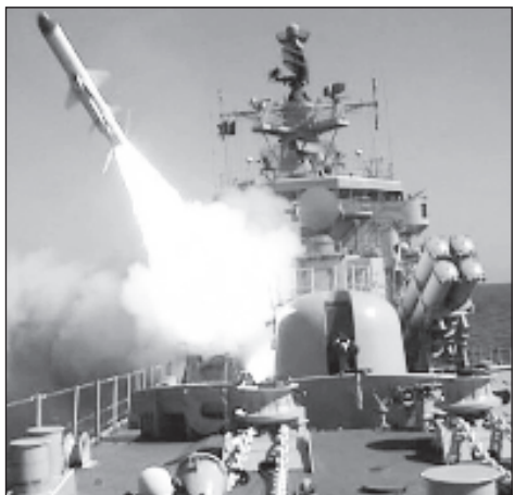
Изстрелване на ракета "Калибър-НК" от кораб от Каспийската флотилия

"Ракетните кораби "Дагестан" и "Татарстан" изпълниха задача по поразяване с ракети на важни обекти на условия противник на остров Чечен по време на двустранно командно-щабно учение", отбеляза Астафиев. Той уточни, че две крилати ракети "Калибър-НК" са прелетели около 100 морски мили (180 километра) и са поразили успешно мишените, изработени във вид на здания с размери 10 на 10 метра. Действието на моряците е наблюдавал командващия войските на Южния военен окръг Александър Дворников.