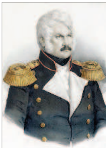
Генерал Алексей Ермолов

"крепость" в голове возникает картинка средневекового замка. Ничего похожего в Грозной не было. Она представляла собой правильный шестиугольник, каждый угол которого выдавался вперед бастионом с амбразурами для двух орудий. Валы крепости были земляные, укрепленные палисадами. Внутри цитадели располагались помещения для хранения оружия и боеприпасов, казармы и караульные помещения для не-