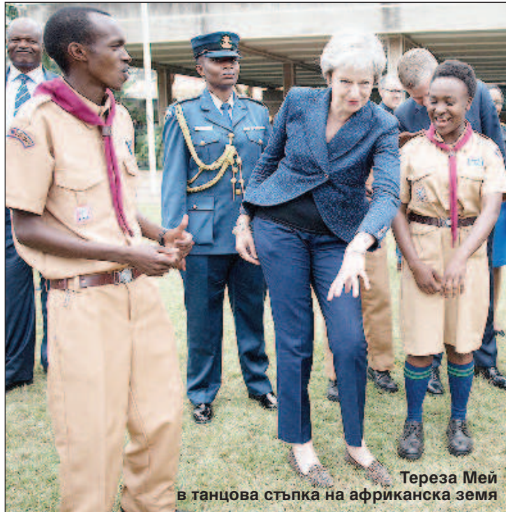
Тереза Мей в танцова стъпка на африканска земя

Тук-там се забелязва и здрав разум, който засега обаче се проявява само в хумористичните жанрове. Американското сатирично издание News Thump например писа, че самата Тереза