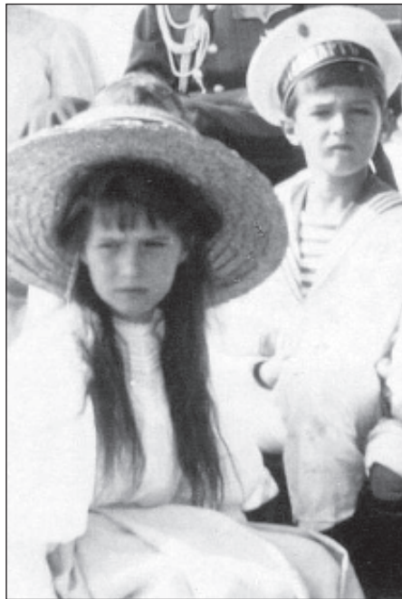
Анастасия и Алексей Романовы