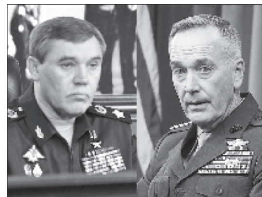
Валерий Герасимов и Джоузеф Данфорд

"Разговорът беше посветен на въпроси, представляващи взаимен интерес в Сирия,