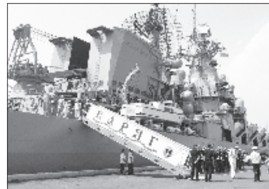
Ракетният крайцер "Варяг"

Основна цел на похода е демонстрирането на Андреевския флаг в Азиатско-Тихоокеанския регион и по-нататъшното развитие на военноморското сътрудничество със страните от региона.