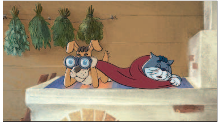
"Завръщане в Простоквашино"

Трябва да отбележим, че общият брой гледания в интернет на сериите на анимационния филм "Завръщане в Простоквашино", чиято премиерата се състоя през април 2018 година, е над 32 милиона - съобщава пресслужбата на "Союзмульт-