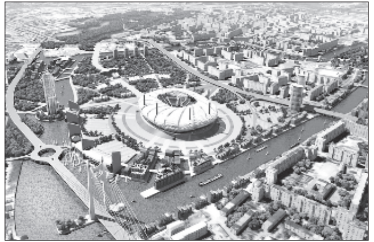
Остров Октябрьски в Калининград