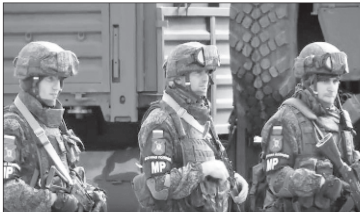
Руски военни полицаи в Сирия

Представителят на военната полиция добави, че първият маршрут на патрулирането преминава по тиловата граница на зоната на отговорност близо до Манбидж. Военните полицаи са изминали няколко десетки километра в северната част на провинцията през градовете Мелмиран, Аджам, Еланли и Елибафар, а след това маршрутът ще се променя регулярно.