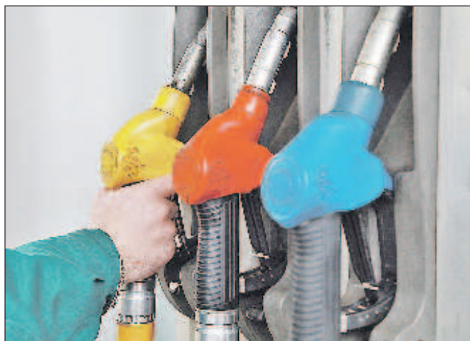
Счетная палата прогнозирует скачок цен на бензин

- о запрете скидок и промоакций на них. Все это в сумме может привести к подорожанию сигарет в рознице на 15%.