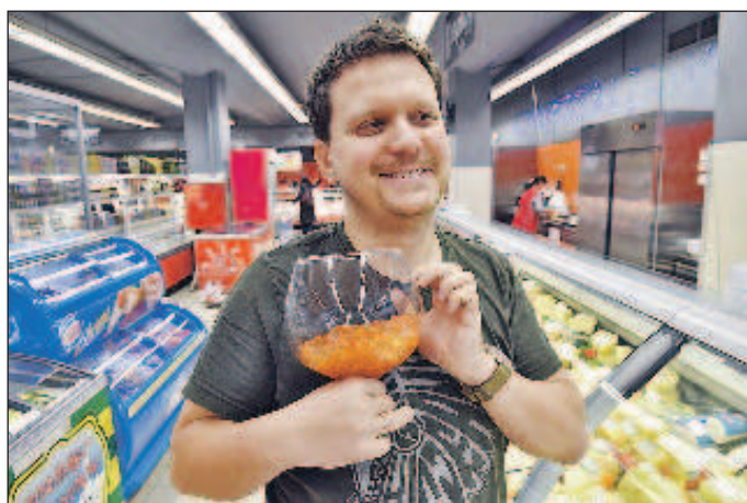
То ли выпить подешевевшего вина, то ли поесть подешевевшей икры...

Одной из причин может стать плановое повышение акцизов на топливо с 1 января