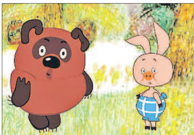
- А мясо, Пятачок, для того дорожает, чтобы в год Свины свиному не ели!