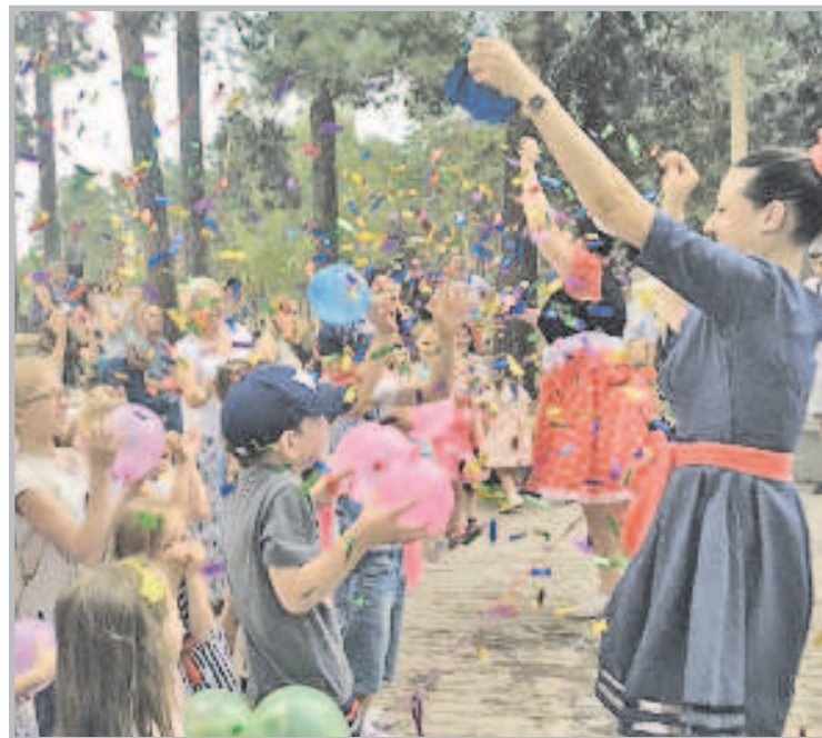
15 июня в Воронежском парке «Алые паруса» прошёл праздник «Один к одному». Несколько десятков близнецов и двойняшек показали музыкальные номера, приняли участие в модном показе и конкурсах. В финале праздника участники разрезали большой, приготовленный своими руками торт и искупались в мыльных пузырях.

Если сравнивать с классическими методами производства, то просто изготовление двух так называемых прессформ для заливки корпуса и крышки обошлось бы в 200 с лишним тысяч рублей. «На сегодняшний день продано порядка девяти тетрадей. Мелкосерийное производство пока не запустили, но это в планах. В ближайшее время мы хотим организовать длительное тестирование тетради. У нас уже очень много желающих, причем не только из разных регионов нашей страны, но и из-за рубежа, в том числе и наши ближайшие соседи - одна из школ Казахстана. Все хотят взять тетрадь, попробовать ее в работе, сравнить с их методами обучения», - говорит разработчик.