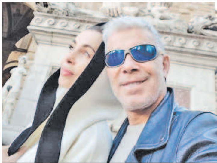
Олег и Марина Газмановы

Каждая поездка в Крым для Олега Газманова еще и повод для ностальгии. Впервые он здесь оказался более пятидесяти лет назад, когда был еще школьником. Уже тогда его можно было назвать счастливым человеком: Олег приехал на