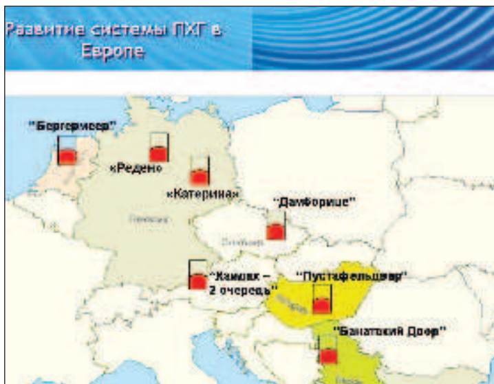
Газови хранилища в Европа

беше пуснат в експлоатация през 2012 г. Миналата година по него Европа получи 58,8 млрд. куб. м руски газ. В момента неговият дял на европейския пазар е около 37 процента. Напоследък в сътрудничество с "Газпром" бяха разширени някои подземни газови хранилища (ПХГ) в Германия, а Сърбия, Унгария, Босна и Херцеговина сега са гарантирани от хранилището "Банатски двор", изградено също с руско участие. Тази година европейските ПХГ се зареждат с ускорени темпове. В определена степен това се дължи