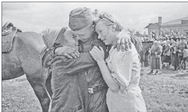
Прощание с солдатом

сказал: вы посмотрите, какой страшный закат“, рассказывает Людмила Удовиченко, встретившая воскресенье 22 июня во Владивостоке.