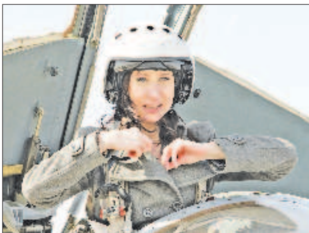
За едно място в Краснодарското военновъздушно училище кандидатстават седем момичета

По-рано се съобщаваше, че за първите потоци военни летци-девойки се предвижда възможността да слушат единствено в транспортната авиация.