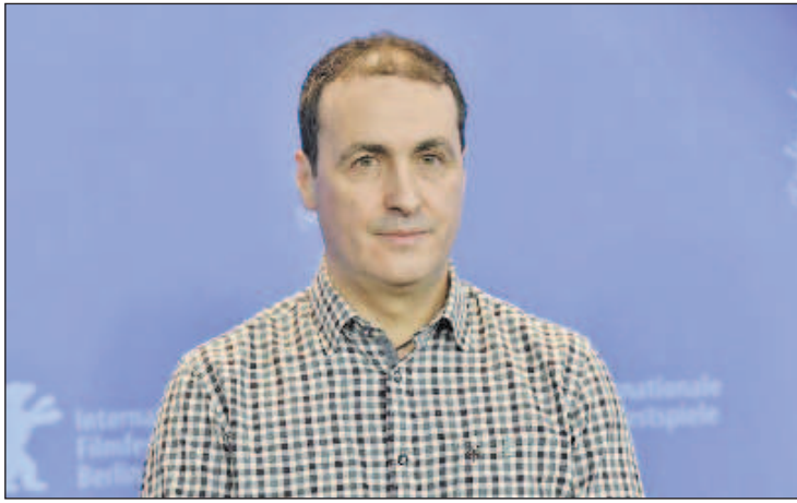
Режисьорът на „Ага“ Милко Лазаров

„Ага“ е български игрален филм от 2018 година на режисьора Милко Лазаров, който работи над филма цели пет години. Филмът прави дебюта си в официалната селекция на фестивала „Берлинале“ на 23 февруари 2018 година и печели голямата награда на фестивала в Сараево същата година. По този начин български филм се