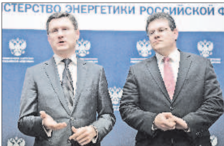
Александър Новак и Марош Шефчович

Украйна иска гарантирани обеми на транзита, което е крайно неизгодно за Русия. По сегашния договор Русия е длъжна да прокара по украинския газопровод 110 млрд. куб. м годишно, а тя изнасяше с 25-30 млрд. куб. м по-малко. Това стана в резултат на