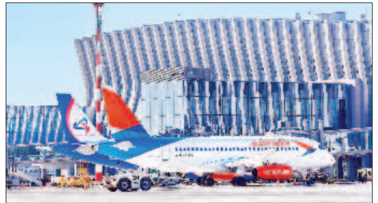
"Арестуваните" руски самолети на летището в Симферопол

Преди това през септември бяха арестувани 65 самолета. Но поради това, че от 2014 година авиосъобщенията между Украйна и Русия са прекратени, няма физическа възможност да се арестуват самолетите от властите на Украйна.