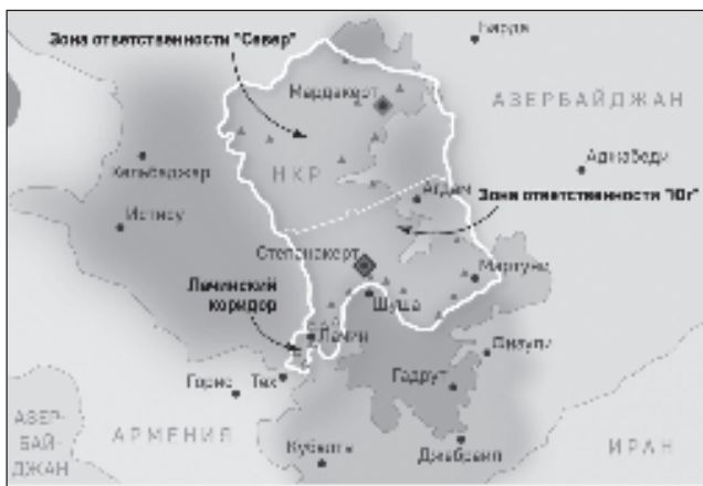
Карта на разполагането на руските миротворчески сили

то ведомство за прехвърлянето на личния състав, военната техника и материалното имущество за миротворческия контингент са използвани самолетите Ил-76 и Ан-124.