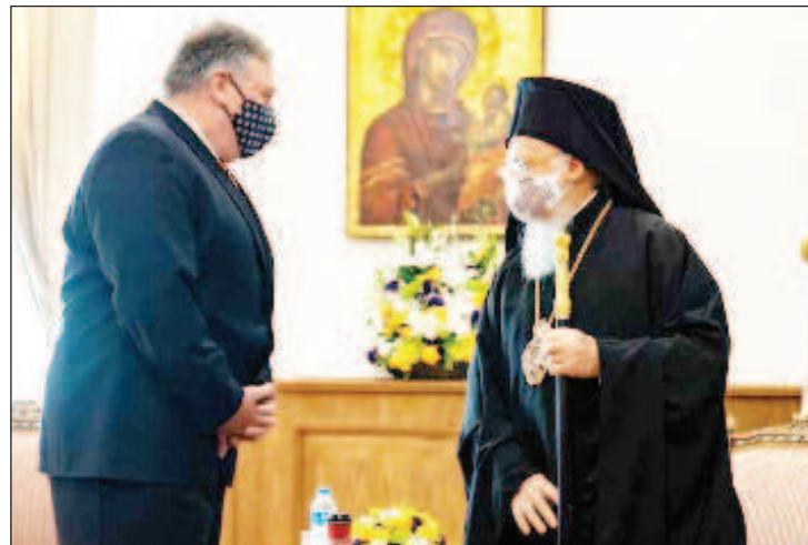
В Истанбул Помпео се среща само с вселенския патриарх

Реакцията на Турция не закъсня и тя бе сервирана типично по ориенталски маниер - с дебел намек. След Париж отвъдокеанският пътник пристигна в Истанбул, където се очакваше да го срещнат Ердоган и външният му министър Чавушоглу, за да бъдат нахокани за прекалените си амбиции, както Помпео бе обещал на Макрон. Уви, домакините не се появили. Упълномощени лица заявиха, че графикът им се е променил. Трябваше да се разбира, че Анкара няма намерение да се съобразява с чиновника от отиващата си американска администрация. По улиците на мегаполиса го