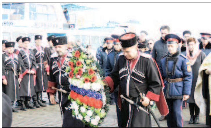
В Крыму отметили 100-летие исхода Белой армии

чом спасения от большевизма" был назван Крым. Только наиболее дальновидные искали пути спасения и скупали валюту. Для большинства же людей поражение 8-11 ноября стало как гром среди ясного неба. Люди знали, что ожесточенный бой неизбежен, но верили, что наступление Красной Армии разобьется об оборонительные линии Перекопа. Даже командование Белой армии, которое обладало намного более полной информацией об обстановке,