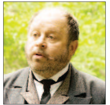
"Сыщик Путилин". В главной роли сыщика

В 2000-ом Ильин появился в роли заботливого слуги барина Гринёва в картине "Русский бунт", в 1998-ом он сыграл Семёна Лямкина, работая на съёмках кинокомедии "Хочу в тюрьму", а в мелодраматической картине "Стрелец неприкаемый" актёр появился в образе журналиста Германа. У Никиты Михалкова он снялся в "Сибирском цирюльни-