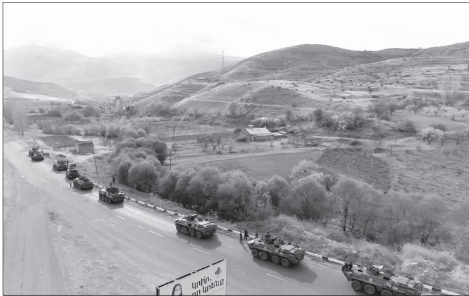
Колона руски миротворци на път към Нагорни Карабах

Според официалния представител на военно-