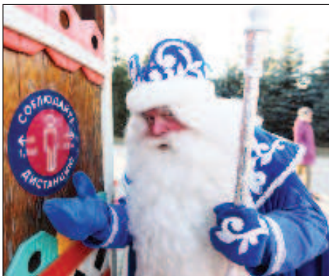
Дядо Мраз спазва противоепидемиологичните норми

На рождения ден на зимния вълшебник Дядо Мраз - 18 ноември, в гората на имението му в Москва се появи "Приказна пътека". Всъщност това е мини парк, чиято мисия е да предизвика интерес към четенето. В него са заселени 65 персонажа, сякаш излезли от страниците на любими книги - "Вълшебникът от изумрудния град", "Алиса в страната на чудесата", "Лешникотрошачката и кралят на мишките", "Пепеляшка", "12-те месеца", "Елхата". "Дълго разсъждавахме кого да заселим тук - разказва за "Российская газета" стопанинът на имението, главният зимен дядо на Москва. - Би било неправилно да поставим тук само Медената питка и Вълкът от "Ну, погоди!". Затова населението на приказната гора се получи разнообразно. Алиса посреща гостите, Лешникотрошачката се е затаила наблизо, а малко по-далеч е "паркирана" каретата от тиква, в която всеки може да влезе и да се почувства знатна особа. А от височина ги гледа Януари от известната приказка на Маршак. По външен вид Януари прилича на Дядо Мраз. Само че добрият старец е висок метър и 88 см., а Януари е около два и половина метра. Впрочем, почти всички приказни герои тук, направени от художествен бетон, са с такива размери. При това са спазени всички противопожарни и епидемиологични норми. Всяка фигура тежи около 500 кг.