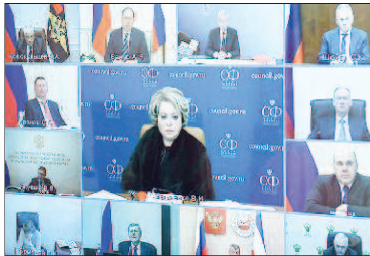
Председателят на Съвета на Федерацията Валентина Матвиенко на заседанието на 18 ноември