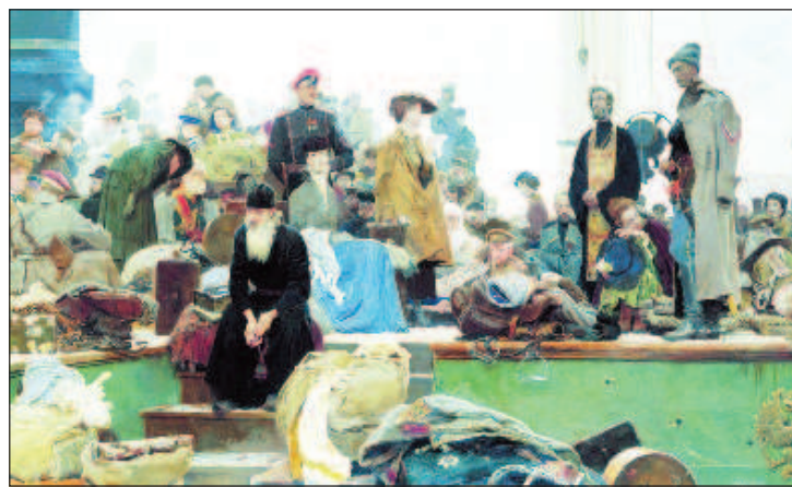
Исход из Крыма

В ночь с 11 на 12 ноября, когда рухнули последние ру-