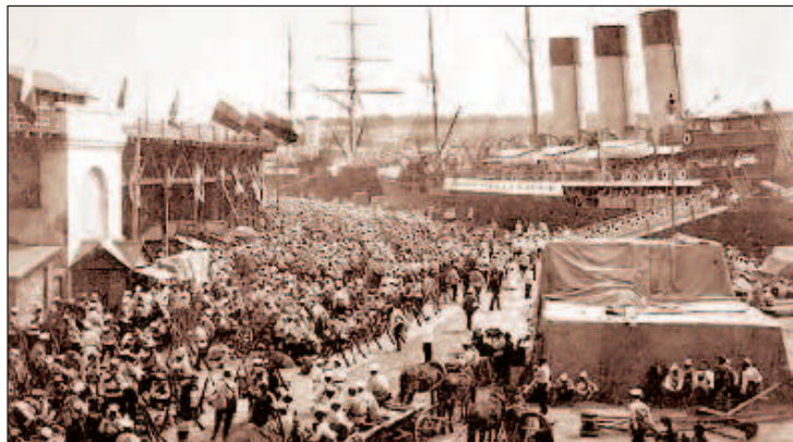
Белая армия покидает Родину из Феодосии

10 ноября после совещания Врангеля с Кутеповым было принято решение начать эвакуацию тылов. Для решения этой задачи были реквизированы все коммерческие суда в портах, независимо от национальной принадлежности. На них стали грузить лазареты, некоторые центральные учреждения. Через французского