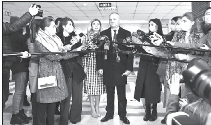
Игорь Додон проиграл прежде всего из-за агрессивной тактике, которую избрал штаб Санду

На президентских выборах в 2020 году партия Санду вновь выдвинула ее кандидатуру. "Чтобы очистить парламент, нам нужен и честный президент. Нам нужен президент, который не назначает коррумпированных и ском-