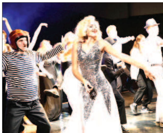
Кадр от кинофестивала на ВГИК