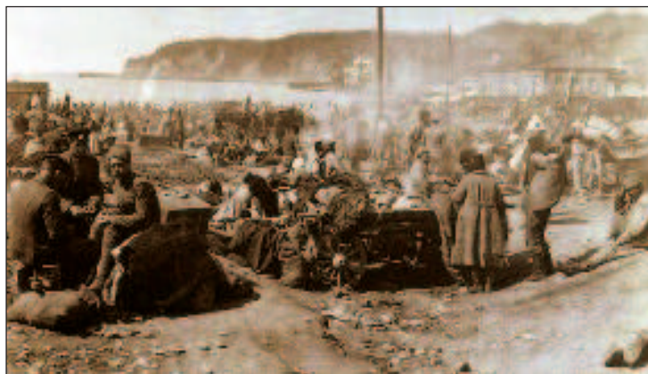
Перед уходом в Туапсе