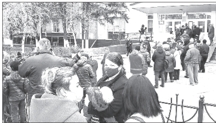
Явка на выборах составила 52,78%