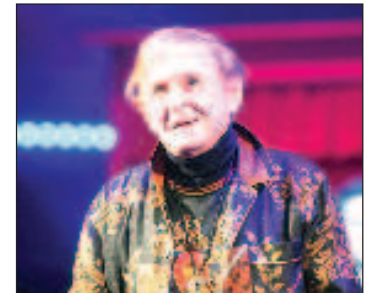
Роман Виктюк на творческата си вечер "Мне от любви покоя не найти...", Москва, 2020 г.

Президентът Владимир Путин изрази съболезнования във връзка с кончината на Роман Виктюк. Той го нарече истински майстор и съзидател с особена вътрешна свобода, позволяваща му да чути остарелите стереотипи и да върви по свой творчески път. "Неговите таланти