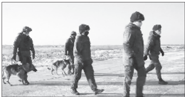
Руски сапъори със служебни кучета търсят и унищожават взривоопасни предмети, изпълняват и други инженерни задачи в Нагорни Карабах

Във вторник руското Министерство на отбраната съобщи за прехвърляне със самолети Ил-76 на Военнотранспортната авиация на Въздушно-космическите сили (ВКС) от аеродрома Уляновск-Восточни до Нагорни Карабах на военнослужещи, специална техника и оборудване на инженерно-сапъорно подразделение от миротворческата бригада на Централния военен окръг.