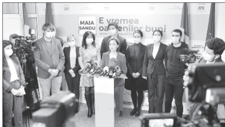
Санду взяла у Додона реванш за поражение четыре года тому назад

прометировавших себя людей судьями. Нам нужен президент, который объединяет общество, подает пример дружим, который уважает людей", - заявила она.