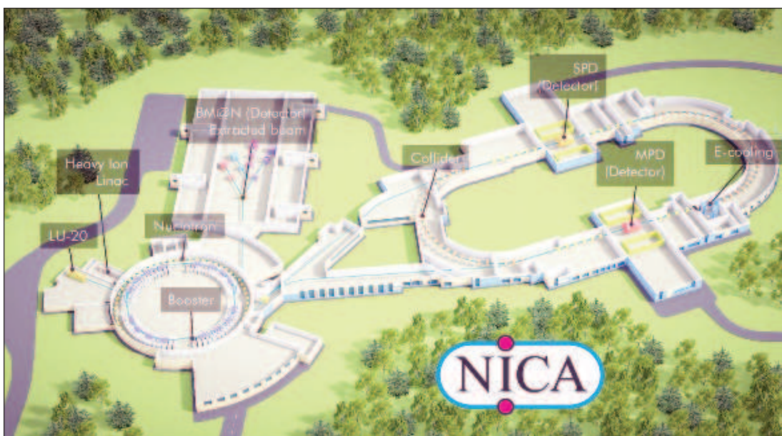
Схема на ускорителния комплекс на мегапроекта NICA

"В основата на проекта NICA са идеите на теоретиките от Дубна, а именно, че в определен диапазон на плътности и температури и с определени лъчи на сблъсквания се тежки ядра, трябва да се търсят ефектите от фазовите преходи в