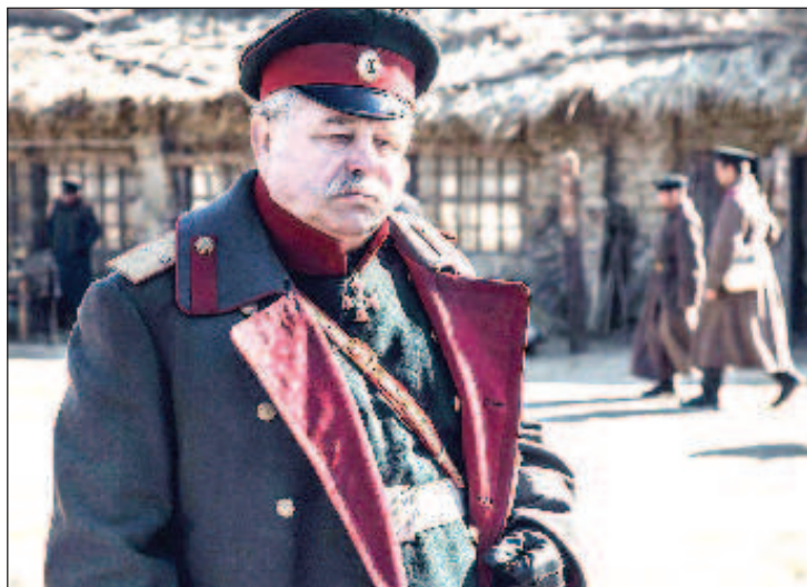
"Анна Каренина" - седой генерал