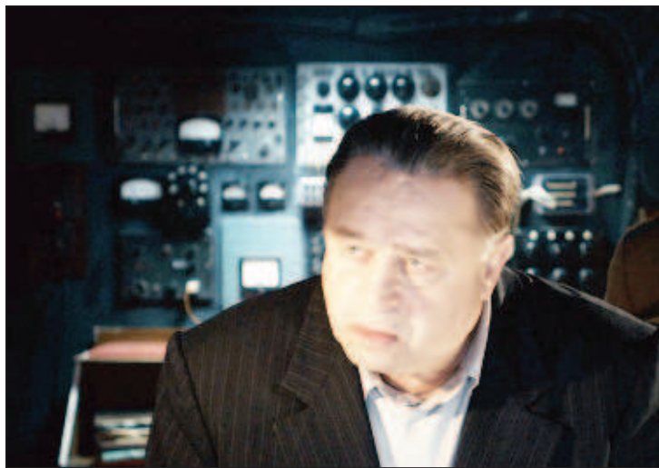
"Время первых" главная роль - Сергей Павлович Королёв