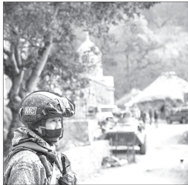
Руски миротворци се грижат за сигурността на посетителите на древния християнски манастир Дадиванк

Според Конашенков с посредничеството на руските миротворчески