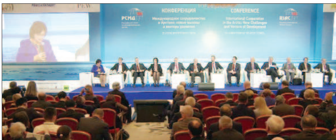
В Русия се състоя Международната конференция "Сътрудничество в Арктика"

Дипломатът констатира, че много от проблемите в реги-