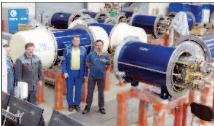
През юни 2020 г. специалистите от Обединения институт за ядрени изследвания (ОИЯИ) в Дубна са разработили и тествали успешно първите магнити за колайдера NICA

Освен това подобно съоръжение ефективно ще "изгаря" ядрените отпадъци, а това, което в крайна сметка ще остане от тях, ще отиде за дългосрочно съхранение и след 500 години няма да бъде по-опасно от въглищна пепел. За сравнение: отпадъците от съвременните атомни електроцентрали остават смъртоносни хиляда пъти по-дълго време.