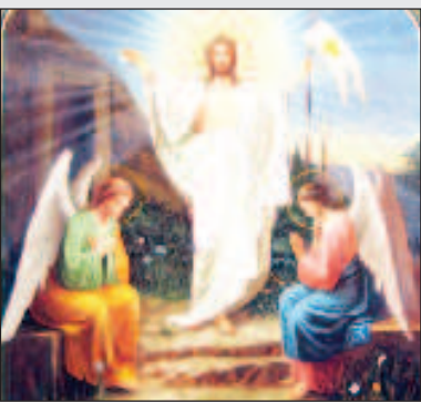
Что помнить в канун Пасхи Стр. 12