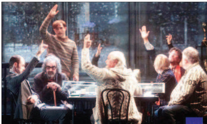
Сцена от спектакля "12"

Според сюжета 12 съдебни заседатели решават дали е виновно чеченско момче в убийството на баща му. Първоначално решението им се струва еднозначно, но се намира човек, който пръв се решава да изкаже про-