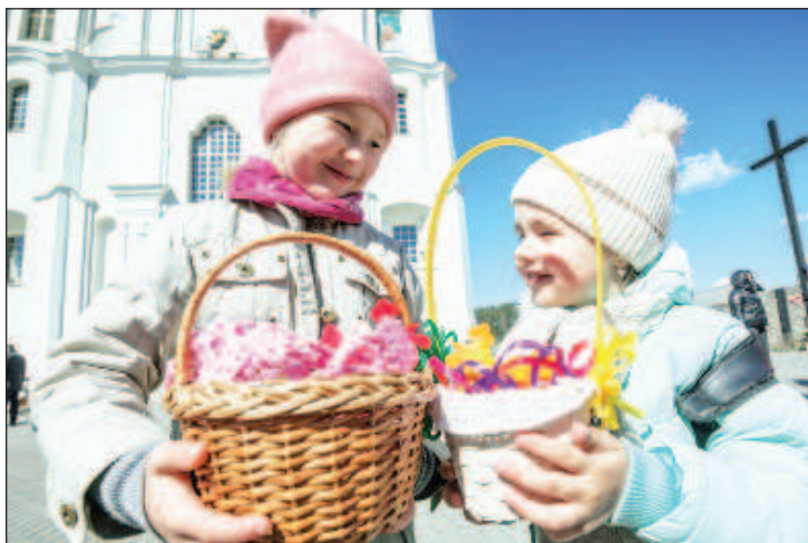
В Великую Субботу в продолжение всего дня в храмах совершается освящение куличей, пасок и яиц

верг совершается служба, которую можно было бы назвать "Моление в Гефсимании". Мы выходим на середину храма, точно в Элеонский сад. Мы читаем двенадцать Страстных Евангелий, вспоминая как Христа