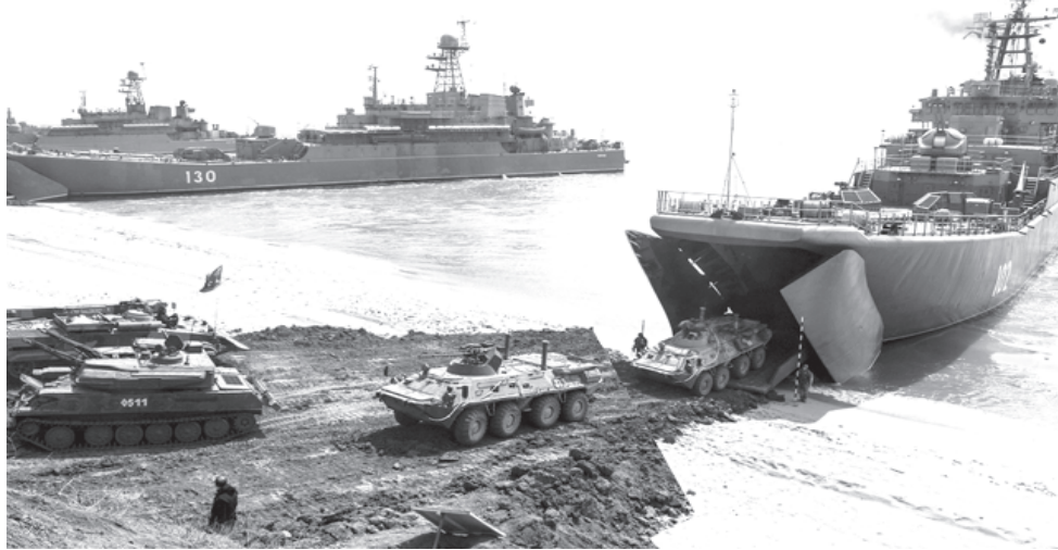
На крайбрежието на полигона Опук бяха натоварени подразделенията и техниката на морската пехота

В края на миналата седмица на полигона Опук премина основният етап на ученията на Южния военен окръг и Въздушнодесантните войски, които се извършиха в рамките на внезапна проверка на бойната готовност. В тях участваха над 10 хиляди военнослужещи и 1200