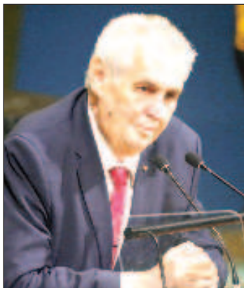
Президентът на Чехия Милош Земан

Да напомним, че Чехия обвинява Русия заради взривовите в складовете във Върбетице, където се съхраняват оръжие и боепри-