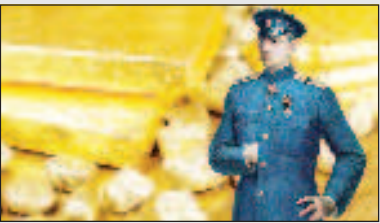
Как чехи украли русское золото Стр. 8