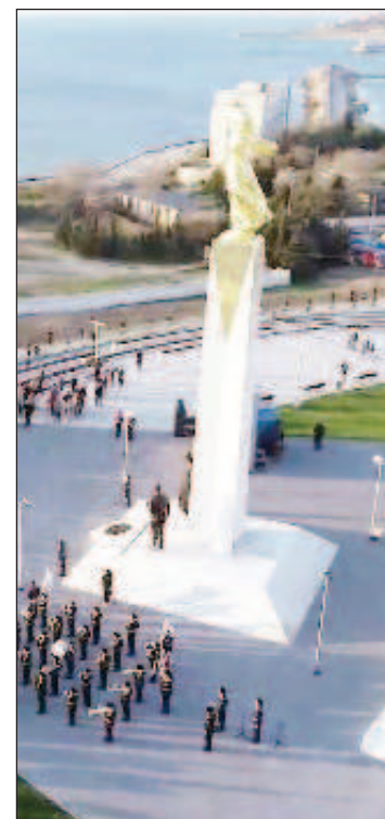
Новият паметник в Севастопол

"Ние сме единен народ и Русия за нас е една" - гласи надпис върху постаментта