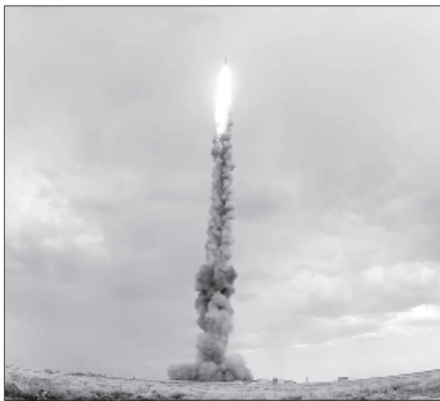
Моментът на пуск на новата противоракета

Системата за противоракетна отбрана е на въоръжение във Въздушно-космическите войски и е предназначена за защита от удари със средства за въздушно-космическо нападение.