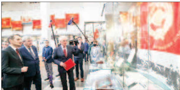
Сергей Наришкин (първият вляво) на откриването на изложбата

Председателят на Руското историческо дружество, директор на Службата за външно разузнаване Сергей Наришкин откри изложбата "Помнит мир спасенный...": поздравителни телеграми и послания советскому народу в связи с Победой над фашизмом" в Централния музей на Въоръжените сили на РФ. На изложбата са представени повече от 150 исторически източници - телеграми от лидери на различни държави, дипломатически послания от всички краища на света, писма на граждани от ос-