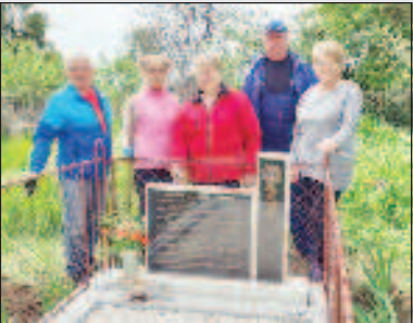
Вечная память и Слава! Стр. 5