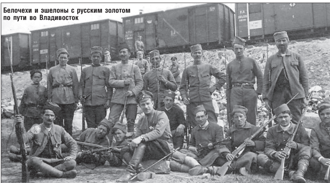
Белочехи и эшелоны с русским золотом по пути во Владивосток

дней передали адмирала большевикам, которые его казнили.