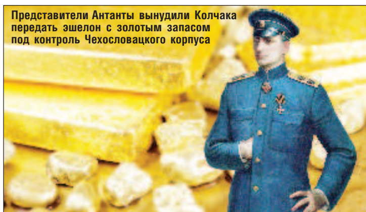
Представители Антанты вынудили Колчака передать эшелон с золотым запасом под контроль Чехословацкого корпуса

ранных дел доктора Эдварда Бенеша в том, что он покрывает преступления чехословацких legionеров в России. В своем страстном эмоциональном выступлении Лодгманн заявил, что "legionеры участвовали в разорении русского народа", по-видимому, это выражалось в том, что они "похитили большую часть царского золота".