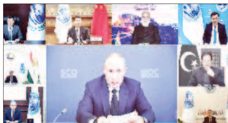
Последната среща на ШОС на високо равнище през 2020 г. се състоя по видеовръзка поради пандемията

В рамките на руското председателство продължи и развитието на културно-хуманитарните връзки, прокарването на общите морални и етични ценности, разширяването на взаимодействието в сферите на образованието, здравеопазването, екологията, културата, туризма и младежките контакти. Бяха осъществени и серия мащабни мероприятия, посветени на 75-годишнината от победата във Втората световна война. На трето място, Русия работи за задълбочаване външнополитическата координация на страните членки с цел съгласуване на общи позиции по актуални международни и регионални въпроси и формулиране на съвместни инициативи главно в рамките на ООН,