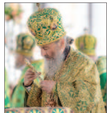
Блаженнейший Митрополит Онуфрий

18 апреля 2021 года пресс-секретарь Президента Украины Юлия Мендель в программе "Взгляд с Банковой" (телеканал "Дом") прокомментировала результаты встречи президентов Украины и Франции. Рассказывая о видении ближайших шагов по урегулированию конфликта на Донбассе, она выразила надежду на проведение обмена пленными в формате "всех на всех" на Пасху.