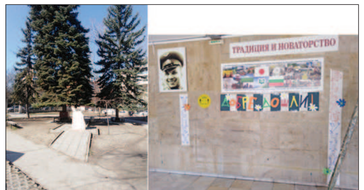
В 138-о училище, което навремето носеше името "Юрий Гагарин", пазят паметта за първия човек, полетял в Космоса - при входа има негова снимка, запазена е и алеята на космонавтите с плочата, върху която са изписани имената на посетителите училището космонавти

През 1993 г. името на патрона на училището "Юрий Гагарин" е било заменено с