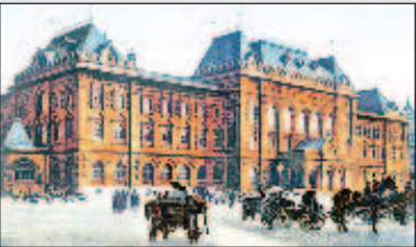
27 апреля - День российского парламентаризма Стр. 6