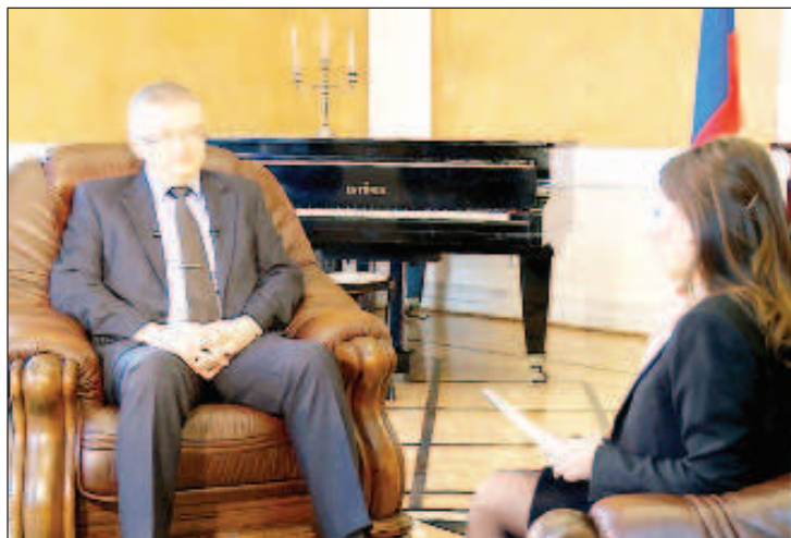
Заради влошените руско-полски отношения напоследък посланикът на РФ в Полша Сергей Андреев стана търсен от много руски и чуждестранни медии

"От 2014 г. в полското политическо и информационно пространство не спира русофобската кампания. От страна на официални лица всеки ден се сипят открито оскърбителни антируски изказвания, водещите политически сили се състеза-