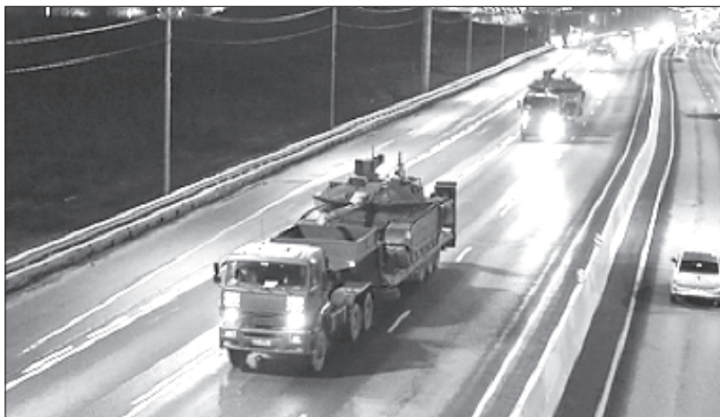
Верижната техника, която ще участва в парад на Червения площад, пристигна в Москва със специален транспорт

ната отбелязват, че първа в Москва е пристигнала колона от над 200 единици колесна техника: бронирани автомобили "Тигър", бронетранспортьори БТР-82А и "Бумеранг", ракетни комплекси "Искандер-М" и "Ярс", зенитни ракетно-оръдейни комплекси "Панцир-С", ЗРС "С-400", бронирани автомобили "Тайфун" от различни модификации, както и техниката на обслужващите групи.