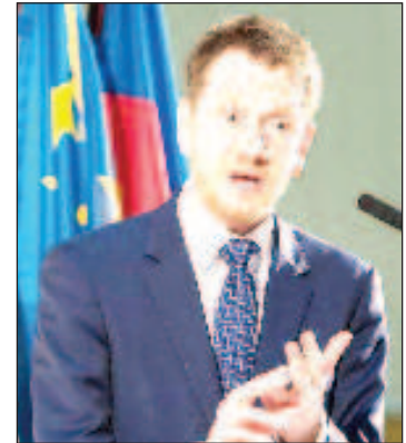
Министър-председателят на Саксония Михаел Кречмер

По думите на немския парламентарист външнopolитическите решения на Прага са подчинени на натиска към тази страна, който не може да бъде откъсан. "Ние обаче трябва да