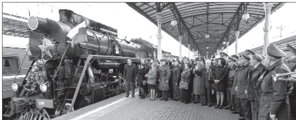
Изпращането на влака "Мы - армия страны! Мы - армия народа!"

На спирките по пътя на влака ще работят пук-