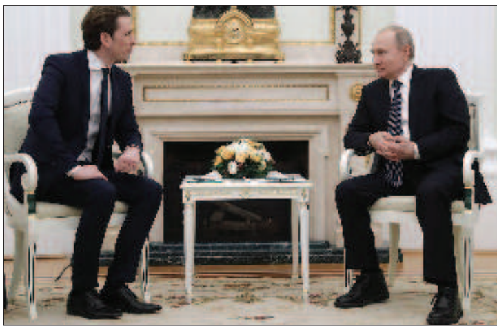
В телефонен разговор Себастиан Курц предложи на Владимир Путин домакинството на Виена на евентуална руско-американска среща на най-високо равнище

В беседата, която се е състояла по инициатива на Виена, са били разгледани някои актуални въпроси на