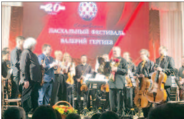
Валерий Гергиев посрещна 68-я си рожден ден на сцената в зала "Зарядье" в Москва

Откриването в Москва бе с два концерта с различни програми и с участието на пианиста Даниил Трифонов. На рождения си ден, който тази година съвпадна с Великден, Валерий Гергиев дирижира изпълнението на музика на Антон Брукнер. "Това съвпада вече за трети път, но моят рожден ден не е голямо събитие, а това, че отбелязваме такъв празник и това, че Москов-