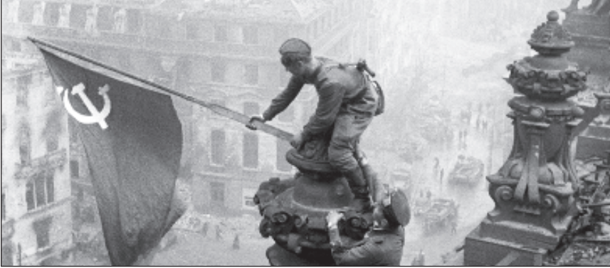
Снимката "Знамето на победата над Райхстага" стана емблема на края на Втората световна война

Евгений Халдей (1917 - 1997 г.) е роден в Юзовка (Донецк). Той посвещава почти целия си професионален живот на фо-