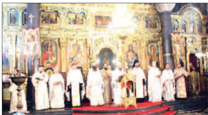
Пасхальная вечерня в Софийском митрополищем кафедральном соборе Святой Недели (Кириакии)

Далее в праздник Светлого Христова Воскресения 2 мая в Софийском митрополищем кафедральном соборе Святой Недели (Кириакии) была совершена пасхальная вечерня, называе-