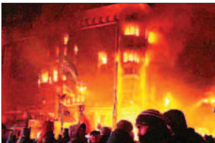
2 май 2014 г. Десетки млади хора загиват в зданието на Дома на профсъюзите, подпален от украинските радикали

леднат в очите на онези, които почувстваха върху себе си какво се е променило в Украйна след майданния преврат и да чуят техните разкази от първо лице - отбелязва Полянски. - Надяваме се, че нашите западни колеги, традиционно защитавщи Киев, ще намерят мъжество да участват в ме-