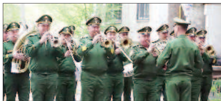
Военният оркестър на ЗВО поздравя ветераните във Воронеж

Мини паради се състояха и в Чечня, Дагестан и други региони на Русия. Така днеш-