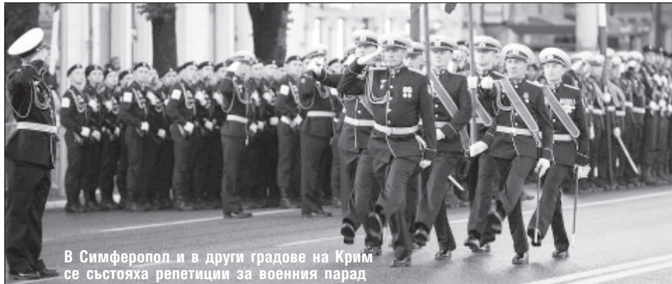
В Симферопол и в други градове на Крим се състояха репетиции за военния парад

Както и преди указът забранява всички масови мероприятия, спортните игри са ограничени до 50 участници и 10% зрители. Властите препоръчват на лицата, по-възрастни от 65 години да спазват режим на самоизолация.