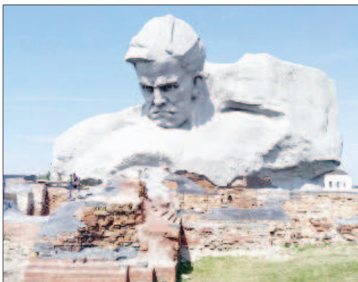
Мемориал Брестская крепость

Они были еще мальчишками, но музыканты счита-