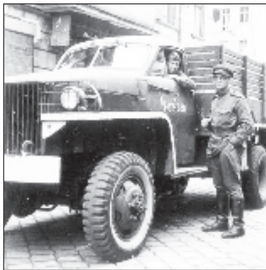
"Студебейкър" от времето на войната

Военнослужещи от Централния военен окръг пресъздадоха по архивни чертежи военния камион "Студебейкър", доставан в Съветската армия през годините на Великата отечествена война от западните съюзници. Техниката ще участва в Парада на Победата в Екатеринбург, се казва в съобщение, разпространено от пресслужбата на окръга.