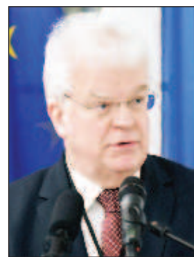
Постоянният представител на Русия в Европейския съюз Владимир Чижов

По-рано външнополитическата служба на ЕС разпространи заявление, в което се подчертава, че европейската страна е изразила осъждане и неприемане на действията на Русия. Според Брюксел руските санкции срещу ЕС били лишени от юридически основания, а кумулативният ефект от тези санкции щял да усложни още повече