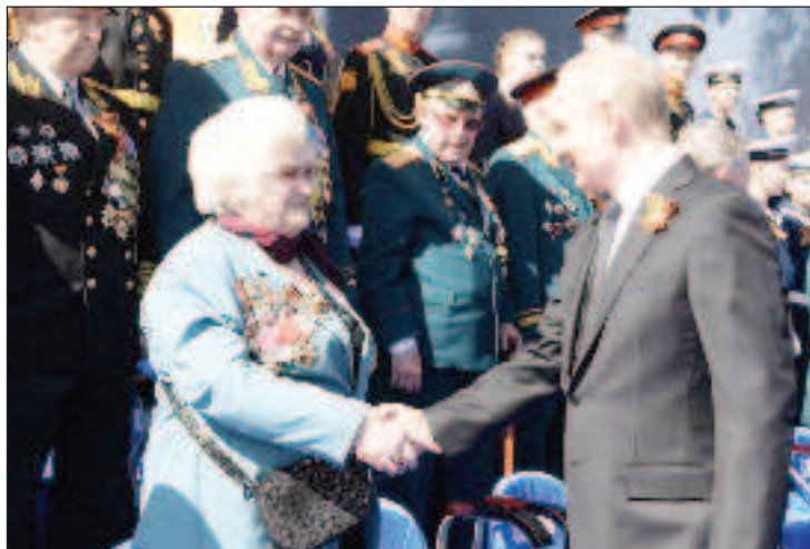
На параде Победы на Красной площади в 2018 году