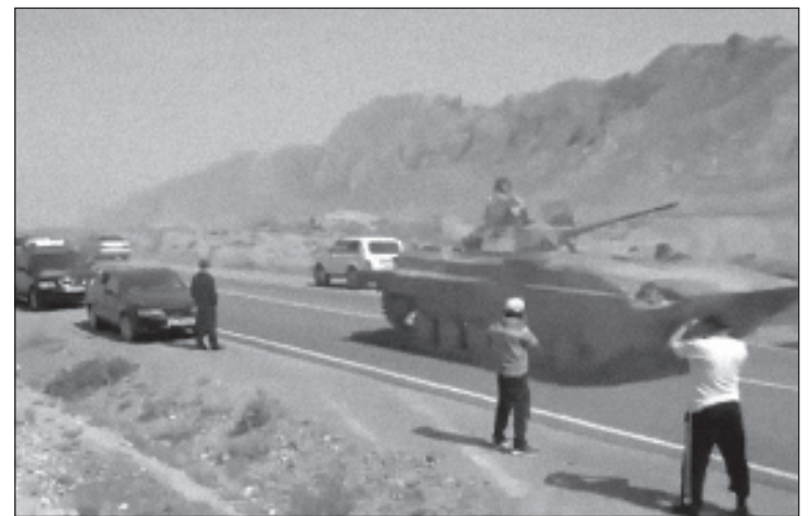
На таджикистанско-киргизской границе спор между местными жителями превратился в военный конфликт

В МВД Киргизии 1 мая сообщили, что конфликт произошел после установки таджикской стороной камеры видеонаблюдения рядом с водозаборным сооружением.