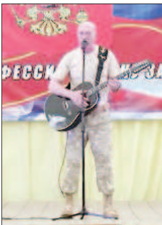
Александър Розенбаум смята за свой дълг да гостува на военните в Сирия

Последният концерт на певеца в Хмеймим е през 2016 г. Пандемията му попречи да изнесе планирания за 2020 година концерт. "Днес нямам нови песни, но