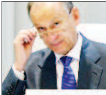
Секретарят на Съвета за сигурност на Русия Николай Патрушев

В края на миналата седмица секретарят на Съвета за сигурност на Русия Николай Патрушев проведе телефонен разговор с помощника на американския президент по въпросите на националната сигурност Джейк Съливан, съобщи пресслужбата на апарата на съвета.