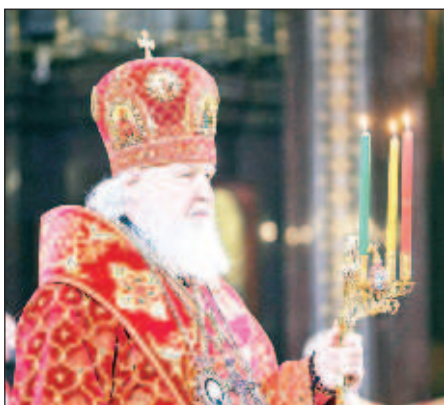
Святейший Патриарх Московский и всея Руси Кирилл

Но ведь не впервые такие прогнозы предлагаются нашему вниманию. В XX веке, в послереволюционное время, практически каждый год власть предпринимались усилия, чтобы снизить посещаемость храмов в пасхальные дни. Но завершилась та эпоха, пришли другие времена, другие люди, другие проблемы, и на весь мир обрушилась не просто философия, а жизненный уклад, связанный с таким явлением, как секуляризм, то есть жизнь без Бога и без Церкви. Это оказалось еще страшнее, чем идеологическая борьба с Церковью, которая велась в нашей стране в советское время, и наверняка есть аналитики, которые регистрируют и сокращение верующих,