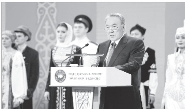
Нурсултан Назарбаев на трибуне сессии Ассамблеи народа Казахстана

Сессия прошла в онлайн-формате, на которой приняли участие более 550 участников. Первый Президент Казахстана Нурсултан Назарбаев в своем выступлении отметил, что сегодня Казахстан входит в число 50 наиболее развитых государств мира и группу стран с уровнем дохода выше среднего. Страна установила дружественные, равноправные и взаимовыгодные отношения со 183 государствами мира, межгосударственными объединениями и международными организациями на основе таких принципов внешней политики, как многовековность, прагматизм, проактивность и мультилатерализм.