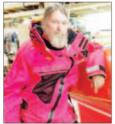
Российский путешественник, писатель, художник, священник Украинской православной церкви Московского патриархата

Биография Федора Конюхова насыщена событиями и трудными маршрутами. В общей сложности путешественник совершил четыре десятка экспедиций по морю. Естественно, что в каждой из них его поджидали сюрпризы, причем зачастую неприятные. И создавала их не только природа, но и люди. Однажды Конюхов заразился какой-то тропической инфекцией, и сделал вынужденную остановку на Филиппинах. Узнав об этом, пираты угнали его яхту. После того, как Федор окреп, ему пришлось самому становиться пиратом. Он похитил яхту разбойников и смог догнать и вернуть свою. Июль 2016-го стал временем нового рекорда Федора Конюхова. Он облетел вокруг земного шара на воздушном шаре. На это у путешественника ушло одиннадцать дней. Прежний рекорд принадлежал Стиву Фоссету, который сделал то же, только за тринадцать дней.