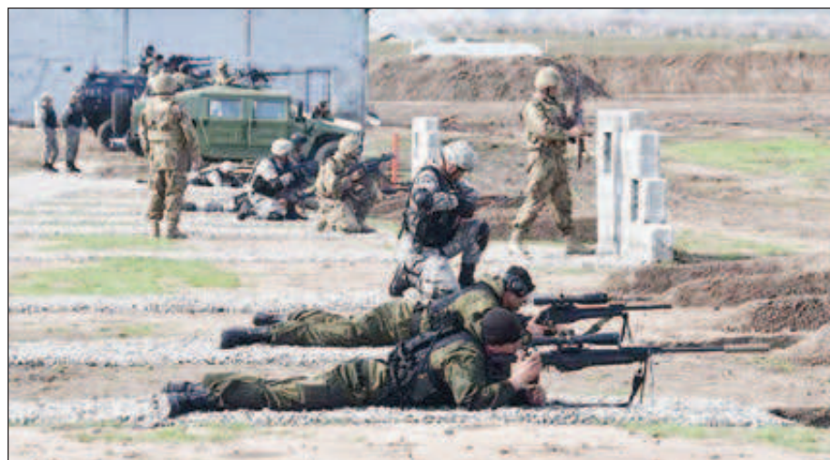
Руско-таджикистански учения на полигона Фахрабад

Той подчерта, че командването на военната база оказва на таджикстанските партньори съдействие в подготовката на личния състав на Въръжените сили на републиката. Според него руската страна участва в усилията за укрепването на таджикстанско-афганистанска-