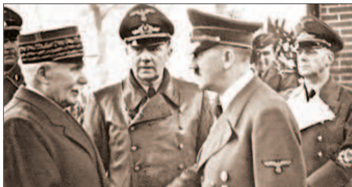
Всю войну на территории Южной Франции правил коллаборационистский фашистский режим генерала Петена. В городе Виши он встречал Гитлера

Объяснялось изменение в настроениях просто: гитлеровцы завершали подготовку к удару по Франции, и союзникам в этот момент ста-