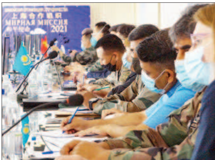
В Оренбург се състоя финалният етап на консултациите за антитерористичните учения "Мирна мисия - 2021"

По-рано в Оренбург се състоя финалният етап на консултациите по въпросите на орга-