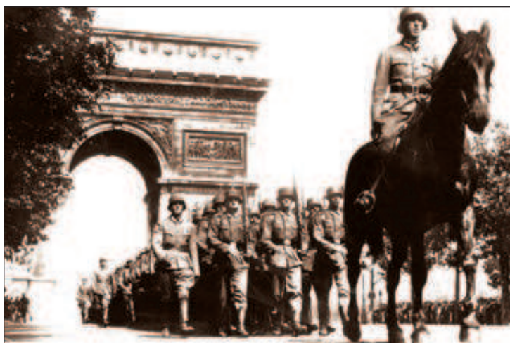
Франция сопротивлялась немецкому нападению ровно 40 дней

Грозном и Батуми" наиболее уязвимыми целями для ударов англо-французской авиации. Посол США во Франции Уильям Буллит доложил президенту США Франклину Рузвельту о том, что французы ведут активную подготовку к бомбардировкам бакинских нефтепромыслов с территории Сирии.