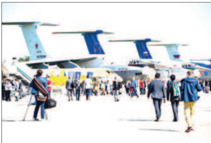
Въпреки ограниченията, породени от коронавируса, хиляди москвичани и гости се стичат на летището в Жуковски

От дирекцията отбелязват, че абонатите на официалните акаунти на МАКС-2021 в социалните мрежи продължават да следят събитията по време на авиосалона: обхватът на аудиторията съставлява около 234 хиляди души. Сайтът на ме-