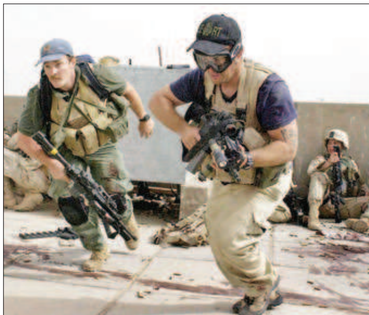
Командоси от Blackwater в действие

В продължение на близо четвърт век ветеранът от елитните спецчасти на САЩ, известни като "Морски котки", е пионер в индустрията на ЧВК и е създавал част-