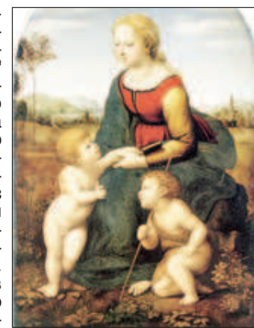
"Хубавата градинарка" е картина на италианския художник от Ренесанса Рафаело, известна още като мадоната, която от XVI век се счита за едно от съкровищата на Лувъра

"Нишата, запазена за тази картина в изложбата "Линията на Рафаело", прекрасна изпълни своята роля на празно пространство със смисъл. Днес тя е символ на лоялността на музейната общност към обещанията си, спазени дори при форсмажорни обстоятелства. Благодарни сме на братския Лувър за възможността днес да се възхищаваме на "Хубавата градинарка" в стил Ермитаж - уединено", разказа генералният директор на Държавния Ермитаж Михаил Пиотровски.