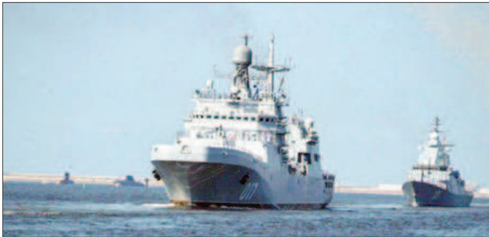
Епизод от първата съвместна тренировка за Главния военноморски парад

Във връзка с тренировката за корабите на река Нева бяха вдигнати мостове. В нея участваха кораби от различен клас, сред които ракетният крайцер "Маршал Устинов", големият противолодъчен кораб "Вицеадмирал Кулаков", големият десантен кораб