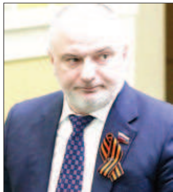
Председателят на Комитета по конституционно законодателство и държавно строителство на Съвета на федерацията Андрей Клишас

Той напомни, че от 16 юли влязоха в сила положенията от закона, според които се предвижда провеждането на културни, развлекателни и зрелищни мероприятия да става само на украински език. Това изискване, в частност, ще се разпростира върху обявите, афишите, входните билети,