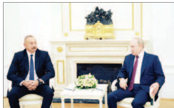
Президентите на Русия и Азербайджан Владимир Путин и Илхам Алиев обсъдиха ситуацията в Южен Кавказ

Руският президент Владимир Путин благодари на азербайджанския си колега Илхам Алиев за компромисните решения, които се предприемат за урегулирането на ситуацията в Южен Кавказ.