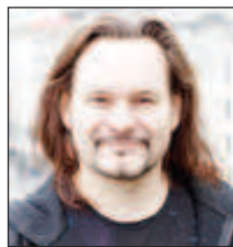
Борис Горячев е роден на 7 октомври 1971 година. В "Хора на Турецки" е от 2003 година. Има съпруга и дъщеря

На 49 години почина солистът на "Хорът на Турецки" Борис Горячев. Това потвърди арт-директорът на състава Ана Чех, цитирана от руските медии.