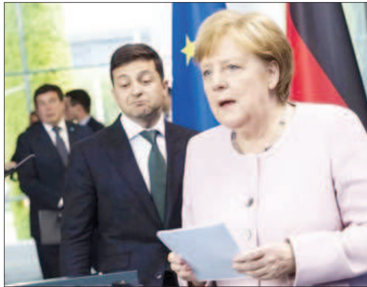
Неотдавна Владимир Зеленски направи отчаян опит да убеди Ангела Меркел, че "Северен поток-2" заплашва германската сигурност

Според експерти малко вероятно са сериозни инвестиции в Украйна. Още по-малко вероятно са те в сферата на енергетиката, като