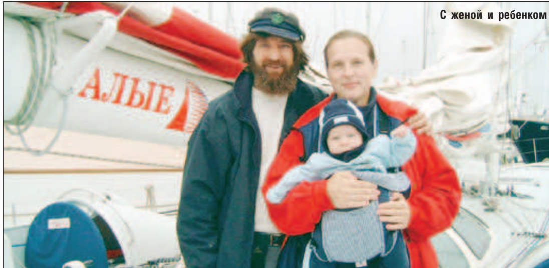
С женой и ребенком

- Так, наверное, у него не было семьи, - предположил один мой приятель, услышав мой восторженный рассказ о Конюхове.