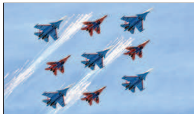
"Руски витязи" и "Стрижи" в съвместен строй ще демонстрират фигурата от висшия пилотаж "Кубински брилянт"

Въздушните асове ще демонстрират пред посетителите на авиосалона фигури от висшия пилотаж като "пирамида", "плик", "стрела", "копие", "звезда", групови "примки на Нестеров", "огледало" и много други.