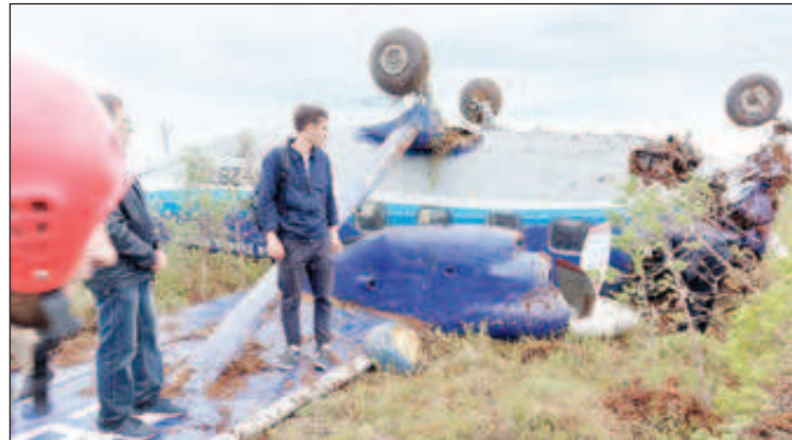
"Ан-28" нагоре с колесника след катастрофата

През изтеклата седмица станахме свидетели на истинско чудо. Самолет "Ан-28" на авиокомпания "Сила" за къси десетинации, летящ за Томск с 18 души на борда - 16 пътници и двама летци, попадна в страшна авария. Изведнъж отказват и двата мотора на машината и тя пада в тайгата. Всички обаче остават живи и само някои от тях са с леки наранявания. Преди да откажат двигателите, самолетът изчезва от радарите и връзката с екипажа се губи. Откриват ги с вертолет и ги откарват за преглед в болница в Томск. Под лекарско наблюдение остават малцина и след 3-4 дни и те са изписани. Само един от летците се оказва със счупен крак, но и той вече продължава лечението си вкъщи.