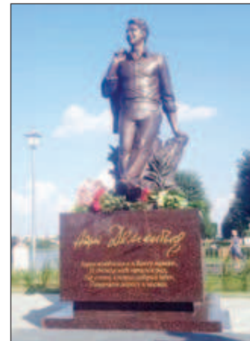
Новооткритият паметник на Дементиев в Твер

Четириметрова скулптура се появи преди седмица на една от крайбрежните улици в град Твер. Бронзовият поет, отправил поглед към спокойните води на Волга, е млад, усмихнат. Той сякаш посреща гости на рождения си ден. Паметникът на Андрей Дементиев в родния му град бе открит точно на тази дата - 16 юни, а от кончината му изминаха три години.