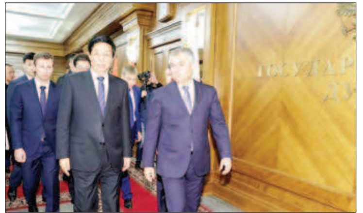
Спикерът на Държавната дума Вячеслав Володин (вдясно) и председателят на Постоянния комитет на Общокитайското събрание на народните представители Ли Чжаншу

Такива действия не водят до желан резултат, колкото и да го желаят, убеден е политикът. "Ние живеем в друга реалност и налагането на своята воля на други държави е недопустимо", поясни той, като изразява уве-