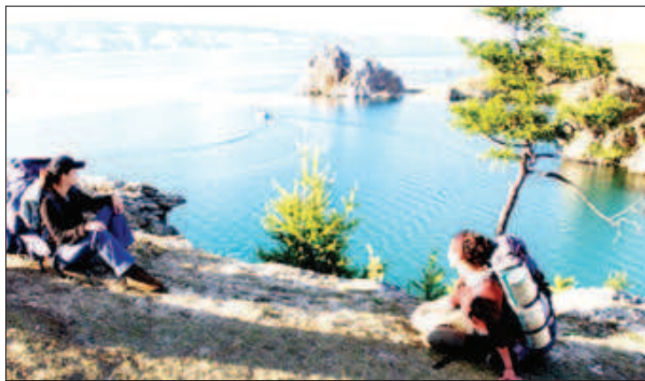
Байкал - все по-привлекателен

ха с призив към гражданите да подкрепят проекта "Екодесант", който включва организирано разделно събиране на отпадъците и екопросвета на местните