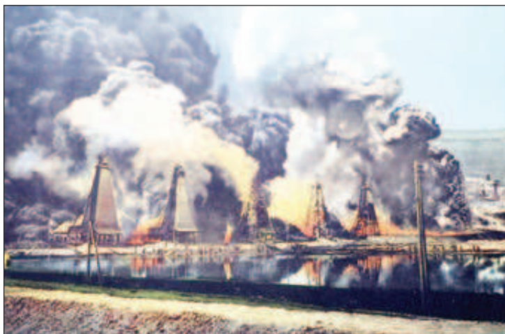
Добыча нефти в Азербайджане в довоенные годы

Несмотря на это, представители правых кругов как во Франции, так и в Великобритании выступали за то, чтобы рассматривать СССР как военного союзника Германии и использовать против него военную силу. Начиная с ноября 1939 года советская резидентура в Европе докладывала в Москву, что во Франции и Великобритании ведется проработка конкретных шагов в этом направлении. Активность подготовки была резко увеличена после начала советско-финской войны. В январе 1940 года премьер-министр Франции Эдуард Даладьё поручил главнокомандующим сухопутными и морскими силами Франции Морису Гамелену и Франсуа Дарлану подготовить план удара по советским нефтепромыслам, дабы