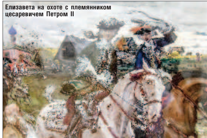
Елизавета на охоте с племянником цесаревичем Петром II

тоновича и его матери-регенты Анны Леопольдовны.