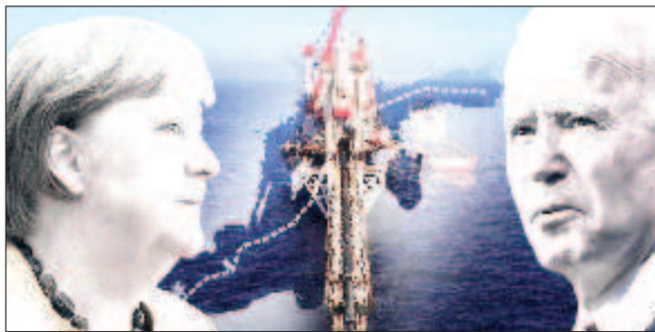
При Байдън предстои още по-ожесточена битка за "Северен поток-2"

Депутатът от Бундестага от партията "Алтернатива за Германия" Валдемар Гердт нарече решението на парламента на провинция Мекленбург-Горна Померания първата открита инициатива в подкрепа на така нужния на Германия проект. "Не-