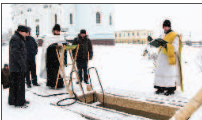
В Подмосковието ще подготвят места за къпане на Богоявление

Лютите студове в Красноярския край създадоха работа на лекарите. Ме-