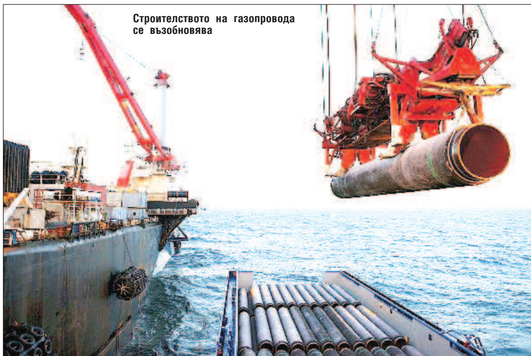
Строителството на газопровода се възобновява

Наистина, експертите споделят мнението, че втората тръба по дъното на Балтийско море значително ще подобри ситуацията с изхвърлянето на въглероден диоксид в атмосферата. Както е известно, алтернативата - украинската газотранспортна система е остаряла, много подълга и за пренасянето на всеки 1000 куб. м гориво се харчи много повече енергия. В полза на идеята за предоставяне на екологичен статут на "Северен поток-2" говорят и уверенията на "Газпром", че в перспектива по него ще може да се подава водород. На първо време газът може да бъде смесван с метан. В Европа е решено захранването на електростанции с такава смес. Ако има търсене, "Газпром" има възможност и е готов от метана да получава сив водород (с примес на въглероден двуокис), или син водород и да го доставя в Европа.