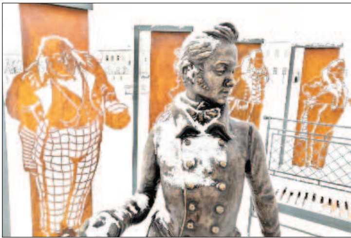
Бронзовата фигура на Хлестаков в град Устюжна

Изборът на персонажи не е случаен: с голяма вероятност описаните от Гогол събития са се случвали именно в Устюжна. Автор на композицията и бронзовите фигури на Хлестаков и Градоначалника е скулпторът, член-кореспондент на Академията на изкуствата, заслужил артист на Русия Александър Таратинов. Силуетите на плоските фигури на останалите персонажи от "Ре-