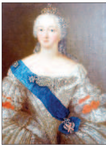
Императрица Елизавета Петровна

У дочери Петра I не было оснований роптать на свою судьбу. О таких людях как Елизавета говорят, что они родились под счастливой звездой. В день ее рождения, 18 декабря 1709 года, русская армия, победившая под Полтавой, торжественным маршем вступила в Москву. Елизавета появилась на свет, озаренная отблеском славы русского оружия в Полтавской битве.