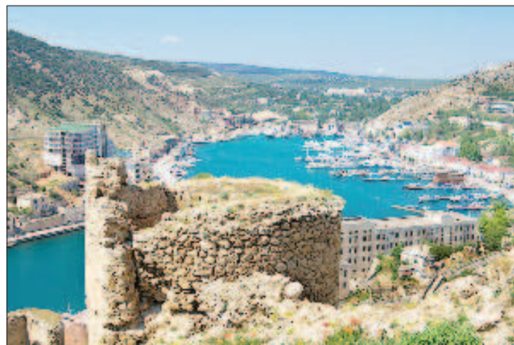
Крим избра да бъде руски регион чрез референдум през 2014 година

"Но в днешна Украйна подобни шоуто са на мода -