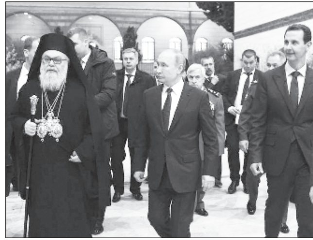
По време на неочакваното си рождественско посещение в Сирия преди година Путин и Асад посетиха православния храм "Света дева Мария"

Според телевизионния канал "Россия-1" на картите са били нанесени десетки лъжливи и истински маршрути. Подготовката е завършена, когато самолетът на Путин вече излита. Дори летците от съпровожд-