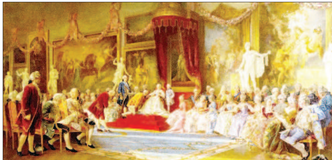
При Елизавете резко возрос интерес к искусствам. Она стала родоначальником Императорских театров России

Екатерина II вспоминала: "Говорить в присутствии Ее Величества было задачей не менее трудной, чем знать ее