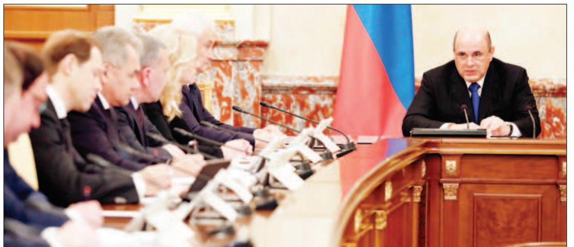
Заседание на руското правителство

Инициативата на държавния глава задължава също така държавните и общинските служители да съобщават в писмена форма на работодателя за прекратяване на руското си гражданство, придобиване на чуждестранно гражданство или получаване на жителство в друга държава в деня, ко-