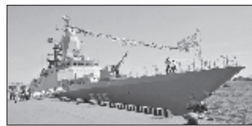
Три военни кораба от руския Балтийски флот хвърлиха котва в сирийския порт Тартус

Отрядът кораби на Балтийския флот напусна главната база на флота Балтийск в Калининградска област на 16 декември 2020 г. "Основната задача на далечния поход е осигуряване на военноморско присъствие и демонстриране на Андреевския флаг в различни райони на Атлантика, Средиземноморието и Индийския океан", отбелязаха от пресслужбата.