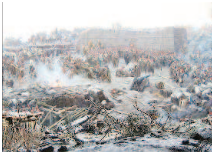
Фрагмент от панорамата, посветена на 50-годишнината от Първата отбрана на Севастопол в Кримската война на художника Франц Рубо (1856-1928), когото в Русия смятат за основател на руската школа по батальонна и панорамна живопис.

По данни на музея два фрагмента от панорамата, които се планира да бъдат изпратени в Севастопол, са били пренесени в музея-панорама "Бородинската битка" в Москва през 1965 г. В края на 2019 година е извършена реставрацията им, а сега е постигнато споразумение за прехвърлянето на тези фрагменти в Севастопол.