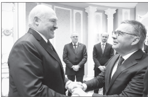
Президент Белоруссии Александр Лукашенко заверил президента Международной федерации хоккея Рене Фазель, что гости Чемпионата мира по хоккею будут в полной безопасности

ропейские общественные организации призывали IIHF перенести чемпионат мира 2021 года из Минска из-за напряженной политической ситуации в Белоруссии. Турнир запланирован в Минске и Риге в мае - июне. При