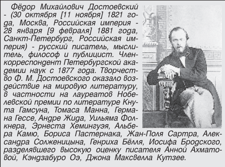
Фёдор Михайлович Достоевский - (30 октября [11 ноября] 1821 года, Москва, Российская империя - 28 января [9 февраля] 1881 года, Санкт-Петербург, Российская империя) - русский писатель, мыслитель, философ и публицист. Член-корреспондент Петербургской академии наук с 1877 года. Творчество Ф. М. Достоевского оказало воздействие на мировую литературу, в частности на лауреатов Нобелевской премии по литературе Кнута Гамсуна, Томаса Манна, Германа Гессе, Андре Жида, Уильяма Фолкнера, Эрнста Хемингуэя, Альбера Камю, Бориса Пастернака, Жан-Поля Сартра, Александры Солженицына, Генриха Бёлля, Иосифа Бродского, разделявшего высокую оценку писателя Анной Ахматовой, Кэндзабуро Оэ, Джона Максвелла Кутзее.

Жизнь и творческую репутацию писателя очень часто определяют мифы и мистификации, которых в жизни и творчестве Ф.М. было предостаточно. Вопреки или благодаря этому Достоевский стал одним из самых известных русских писателей. Его ставят в один ряд с Шекспиром. Достоевский был не только писателем, но и от-