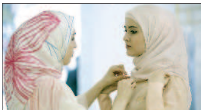
Чеченките искат да са в крак с модата