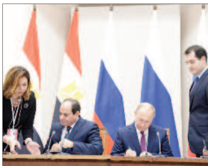
17 октомври 2018 г.: Подписването на Договора за стратегическо сътрудничество между Русия и Египет

Договорът беше подписан в Сочи на 17 октомври 2018 г. като резултат от посещението на президента на Еги-