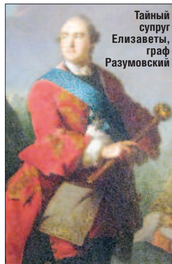
Тайный супруг Елизаветы, граф Разумовский

Екатерина II в "Мемуарах" напишет: "Хотелось бы смотреть, не сводя с нее глаз, и только с сожалением их можно было оторвать от нее, так как не находилось ни одного предмета, который бы с ней сравнялся". Елизавета никогда не надевала одного и того же платья дважды, даже более того - меняла их по нескольку раз на дню. Известно, что во время пожара 1753 года сгорело четыре тысячи ее платьев. А воспитатель великого князя Петра Федоровича, наследника престола, Якоб Штелин рассказывал, что после смерти