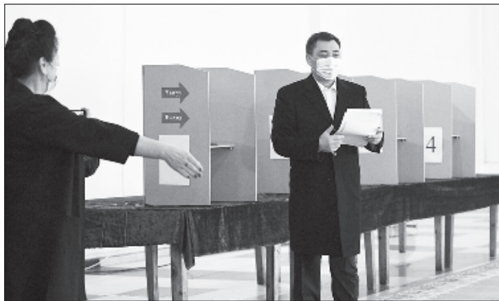
Садыр Жапаров голосует на досрочных президентских выборах в Киргизии

Путин отметил, что отношения России и Киргизии носят характер стратегического партнерства и союзничества, и обратил внимание на большой опыт плодотворного сотрудничества двух стран в различных областях