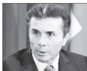
Бидзина Иванишвили не будет больше заниматься политикой

Еще одной из причин своего ухода Иванишвили назвал возраст. "Че-