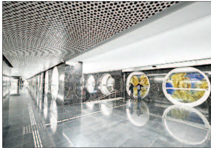
Станция "Электрозаводская" на БКЛ

БКЛ е най-дългата пръстеновидна метролиния в света. Повечето жители от районите, където бяха открити новите станции, и сега имат достъп до метрото, но и за тях БКЛ е голямо събитие. Досега огромен брой граждани бяха принудени да пътуват до старата "Кольцевая линия", за да се прехвърлят на съседна радиална линия. БКЛ, която е разположена на 10 километра от старата "Кольцевая линия", им дава възможност да