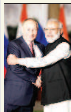
Путин и Модии преговаряха 4 часа