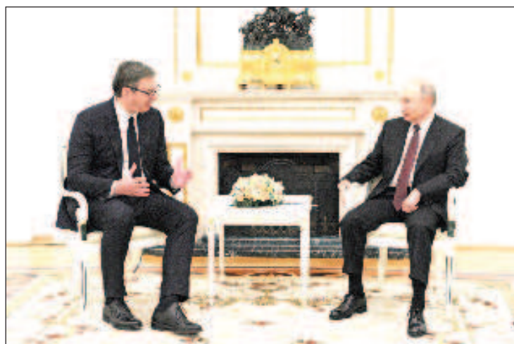
Страницата подготви Влади Владков

По време на визитата си на остров Лесбос в Гърция - възлова точка на нелегалната миграция в Европа, Франциск е осъдил егоизма на европейските политици. "Историята ни учи, че затвореността и национализъмът водят до катастрофални последици. Илюзия е да се мисли, че е достатъчно да се обезопасиш, защитавайки се от слабите, които чукат на вратата", е заявил Папата в мигрантски център на острова, като сравни лагера с нацистките лагери.