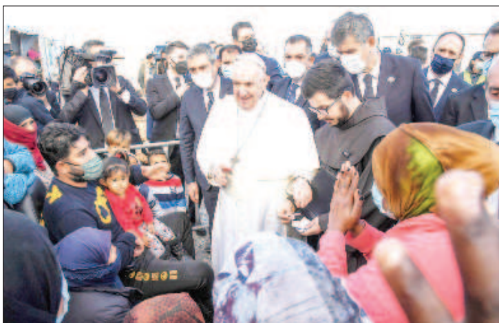
Папа Франциск по време на посещението му на остров Лесбос

Както пояснява италианската агенция АНСА, по време на брифинга Франциск е заявил, че е готов да посети Русия в най-близко време. Той е пояснил, че винаги е готов да тръгне за Москва, тъй като за да се води диалог между братя, не са нужни протоколи. "Братът е брат",