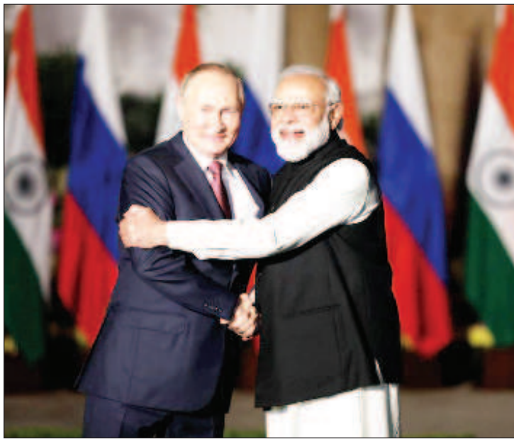
Путин и Моди се срещнаха за първи път от 2019 г. насам

за, че пандемията не е могла да спре темповете на развитие на взаимоотношенията между двете страни. Той оцени високо усилията на Русия и Индия в борбата с коронавирусната инфекция чрез изпитания на ваксини, тяхното производство и хуманитарната помощ.