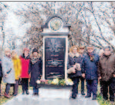
Дни Русского зарубежья прошли в Болгарии Стр. 5