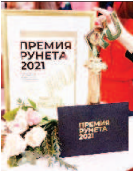
"Премия Рунет" е главната награда на руския интернет

За "Премия Рунет" бяха подадени 1097 заявки.