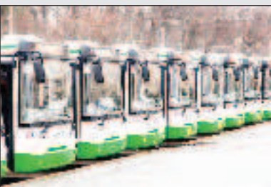
Фонд Николая Расторгуева передал ДНР 90 автобусов Стр. 7