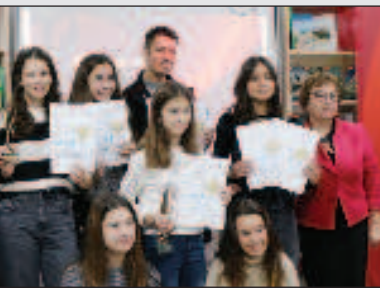
"Пусть всегда будет солнце" Стр. 6