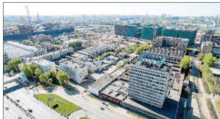
Територията на бившия завод ЗИЛ ще се преобрази