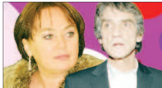
Лариса Гузеева, Валерий Гаркалин

"Официально заявляю: я никогда и нигде не говорила, не писала постов о том, что Гаркалин покупал сертификат о вакцинации. И уж тем более, не заявляла о том, что он поделился со мной такой информа-