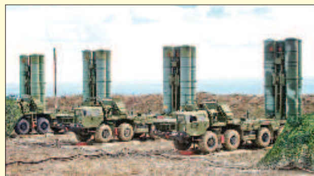
Договореностите между Русия и Индия за С-400 се изпълняват въпреки заплахите от страна на Вашингтон

Първият руски дипломат обърна внимание, че