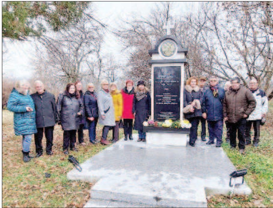
Возложение цветов у памятника белоэмигрантам в парке Перника

В этом году исполняется 130 лет шахтам города Перник. Датой начала добычи угля в этом районе считается 17 августа 1891 года, когда была сделана первая копка в м. Кулата в с. Перник. После этого открывается Первый государственный рудник, известный под названием "Старый рудник" и начинается эксплуатация и история Государственной угольной шахты Перник. Добыча угля из рудника осуществляется подземным и наземным способом. С 1891 года до 1944 в Пернике находятся восемь подземных шахт со множеством гале-