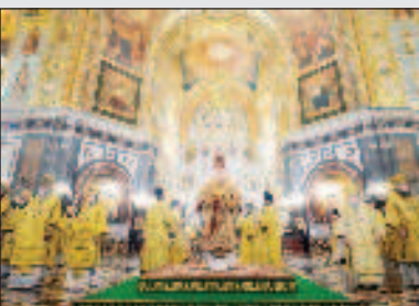
Духовный подвиг Александра Невского Стр. 12