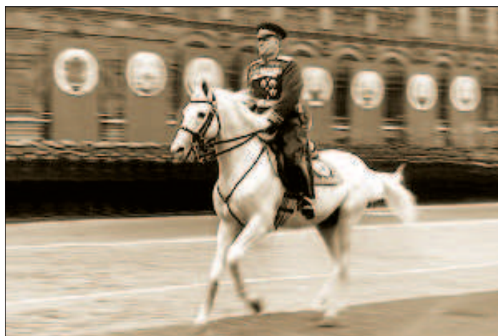
Маршал Жуков принимает Парад Победы на Красной площади

па армий "Север" исчерпала свои наступательные возможности. Жуков сохранил за Ленинградом шанс на дальнейшую борьбу и в конечном счете - шанс на будущую победу.