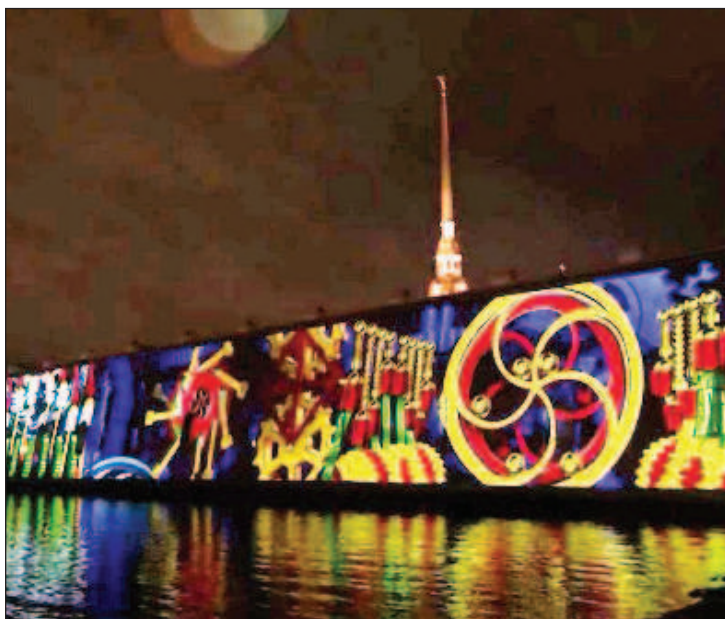
Част от светлинното шоу в Санкт Петербург върху стената на Петропавловската крепост

В Санкт Петербург се състоя традиционният фестивал "Чудо света". Той се провежда два пъти годишно - пролетен и зимен. Всеки път организаторите избират нова историческа площадка и тематика на инсталациите. Тази зима шоуто беше посветено на 800-годишнината от рождението на княз Александър Невски в деня на почитане неговата памет - 6 декември, и бе наречено "Чудо света. Связь времен". За площадка на шоуто бе избран символът на Петербург - Петропавловската крепост. Историческите стени на крепостта се превърнаха в гигантски оживели картини на тема историята на Русия, научни открития и изкуство. Освен изграждането на града на брега на Нева, художниците дизайнери показаха и съвременните му постижения