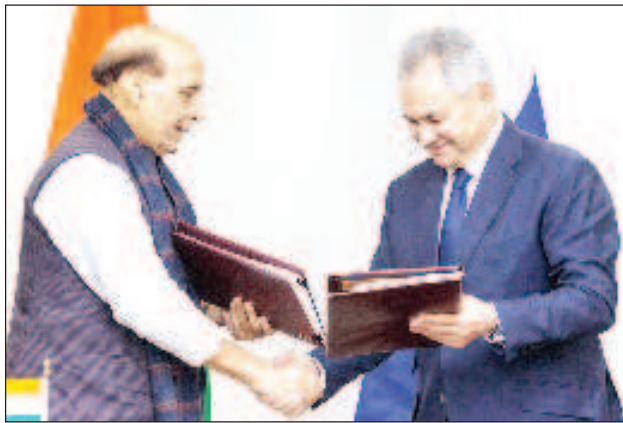
Министрите на отбраната Сергей Шойгу и Раджнатх Сингх са в основата на задълбочаването на руско-индийското военотехническо сътрудничество

Лидерите на Русия и Индия се съгласиха, че мирът, стабилността и взаимното икономическо развитие изискват съвместна работа на двете страни по най-съвременните и развиващи се области на от-