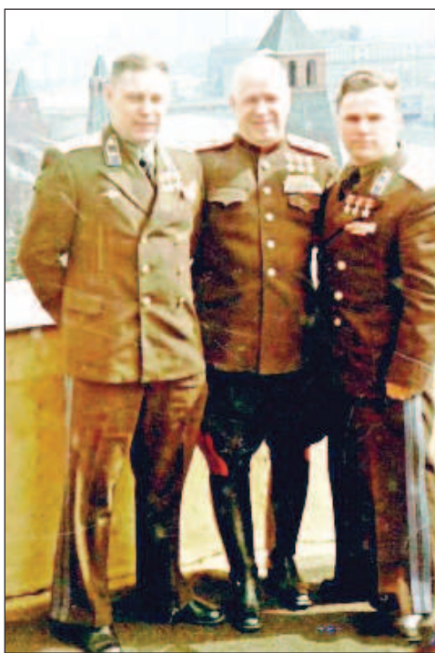
Победители в мирное время: Жуков (в центре) с легендарными воздушными асами Покрышкин и Кожедуб

ситуацию. Как и под Ленинградом, он сумел остановить против-