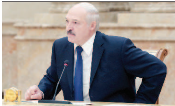
Белорусский президент Александр Лукашенко

кнул, что обновленный текст белорусской конституции ни в коем случае не должен установить двое-