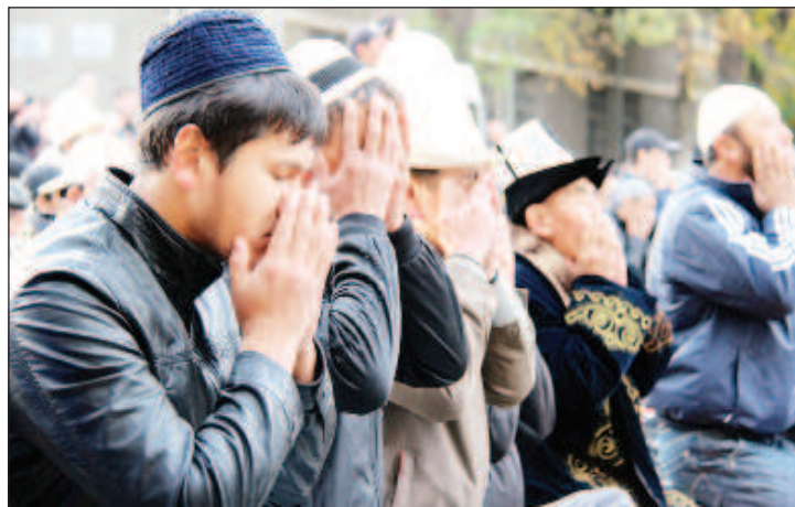
Правверные мусульмане получают государственную ипотеку с особыми условиями

В некоторых Telegram-каналах инициатива ГИК подверглась критике из-за вопросов о функционировании нового механизма. "В Кыргызстане проживает достаточно приличное количество христиан: русских, белорусов, украинцев, немцев, поляков и корейцев. Будут ли учитываться их жилищные потребности? Или ипотека по шариату будет доступна только мусульманам?" - рассуждают критики.