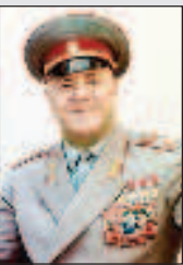
Маршал Победы выполнил свой долг Стр. 8