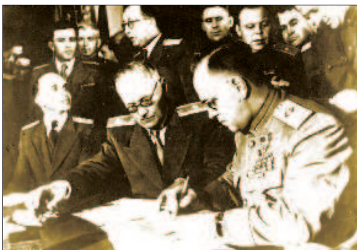
Маршал подписывает документ о безоговорочной капитуляции Германии