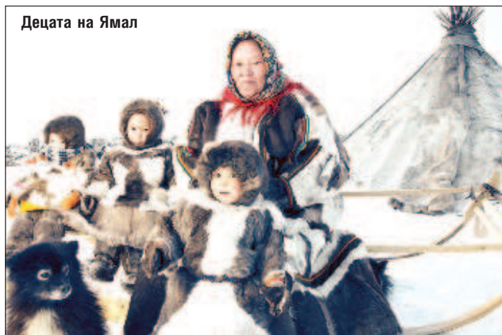
Деца на Ямал

Тези резултати са постигнати благодарение на успешната реализация на националния проект "Демография" в автономния окръг. На полуострова майките и бащите се ползват с различни видове подкрепа от държавата, включително и финансова. За сметка на бюджета на окръга например 699 многодетни семейства са компенсирани разходите си за почивка и оздравителни