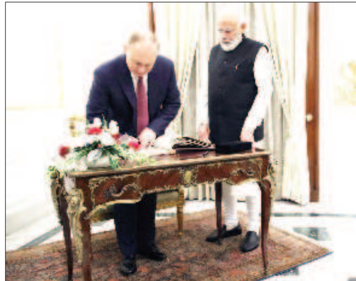
Президентът Путин и премиерът Моди по време на срещата им в Делхи

Международният дискуссионен клуб "Валдай" организира неотдавна поредната Азиатска конференция, на която бяха обсъдени именно въпросите на сложните и нелинейните политически и икономически конфигурации. Естествено в центъра на вниманието беше политиката на Русия и нейната роля в региона. Въпросът е съществен и труден, защото въпросната роля засега едва-едва се очертава. Русия има преимущество по всички направления: нейният силов потенциал, чието използване не се предвижда нито в Източна, нито в Южна, нито в Югоизточна Азия. Колкото до умелата дипломация, която също е силна черта на Москва, сложността и деликатност-