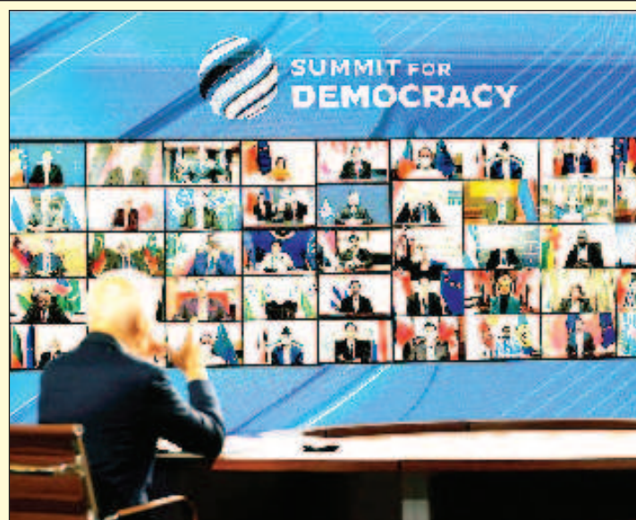
Байдън приветства виртуално масовката и обсъжда с нея виртуалната демокрация

А това потвърждава имено онова, за което ние говорим вече три години: Щатите развалят системата