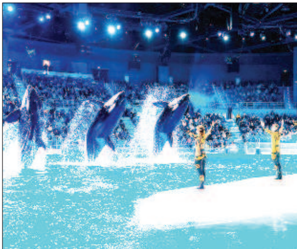
В средата на ноември в "Москвариум" се поведе "Водно шоу" като лека репетиция на невероятното новогодишно представление

За първи път в историята на "Москвариум" на ВДНХ на височина 8 метра над вод-