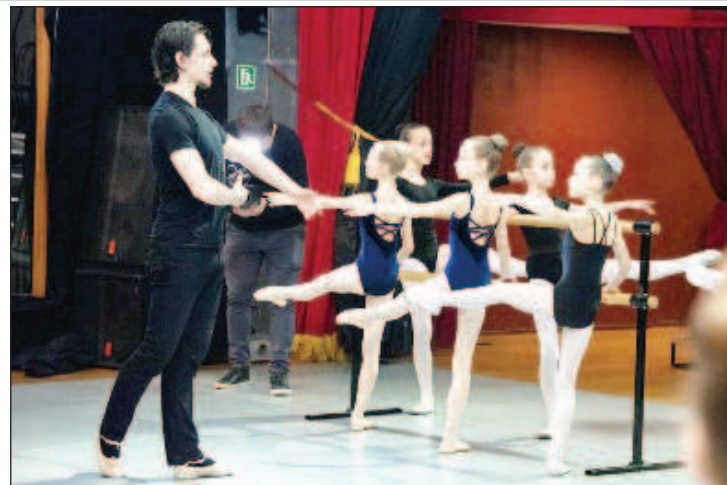
Художествен ръководител на Академията по хореография е знаменитият артист Сергей Полуниин, който в момента е премиер на Баварския театър. Той сподели, че е готов да стане и спонсор за стипендии за обучение на талантливи деца. В академията ще работят преподаватели на световно равнище от различни страни

Културно-образователните клъстери се строят по поръчение на Владимир Путин. Проектите се реализират едновременно в четири града - Калининград, Кемерово, Владивосток и Севастопол. Поръчител на строителството е Фондът за социални и културни проекти "Национално културно наследство", чито учредители са Болошой и Мариинският театър, Ермитажът и Третьяковската галерия. Всички строителни работи по обектите трябва да приключат до края на 2023 година.