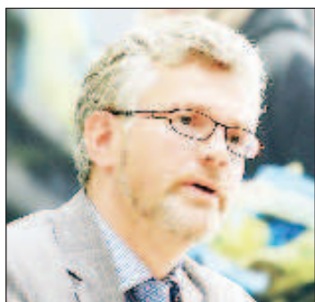
Посол Украины в Германии Андрей Мельник

Посол Украины в Германии Андрей Мельник призвал не ждать помощи от Берлина при новом канцлере ФРГ Олафе Шольце. Об этом он заявил в интервью ZN.UA.