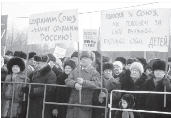
На митинге перед референдумом люди настаивают на сохранение Союза

Вот только и тогда, и сейчас мало кто говорит, что декабрьский референдум на Украине не имеет никакого отношения ни к законности, ни к демократии. Начнем с того, что он проходил вопреки действовавшему на тот