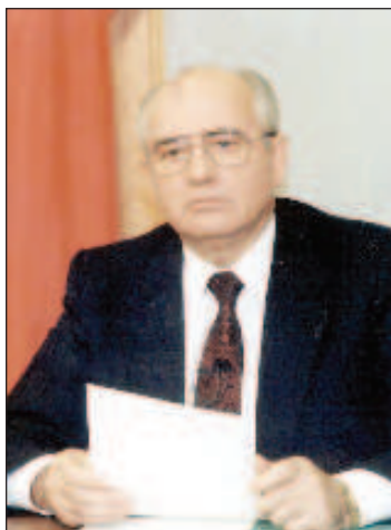
25 декабря 1991 года Михаил Горбачев оглашает по телевидению свою отставку от поста Президента Советского Союза

Понимая шаткость своих позиций, архитекторы раз-