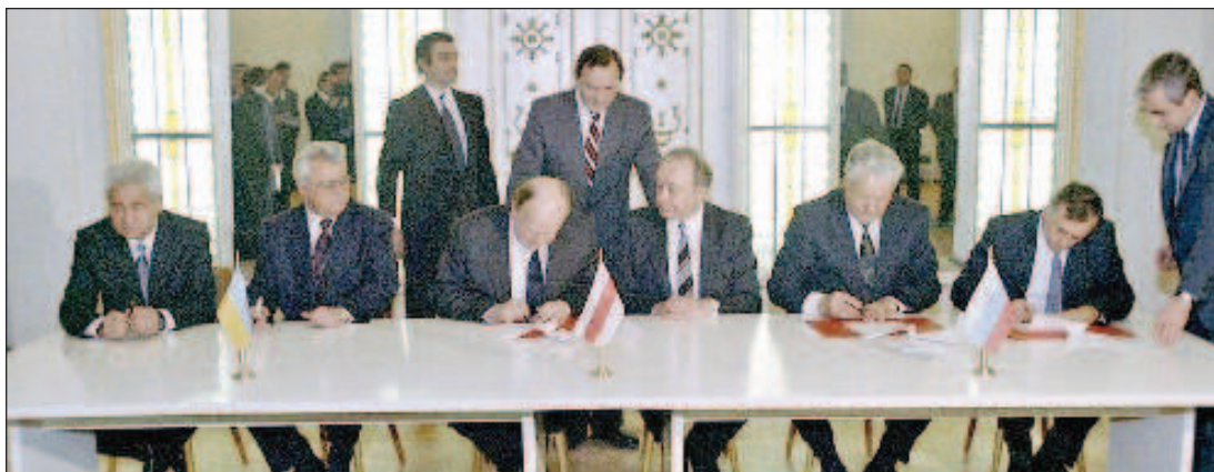
Церемония подписания соглашения о ликвидации СССР. Слева направо: от Украины Витольд Фокин - премьер-министр и Леонид Кравчук - президент; от Белоруссии Вячеслав Кебич - премьер-министр и Станислав Шушкевич - председатель Верховного Совета; от РСФСР Борис Ельцин - президент и Геннадий Бурбулис - Государственный секретарь

Сами они признавали тогда и, судя по откровениям некоторых из них признают и сейчас, что ехали в правительственную дачу "Вискули", где провели переговоры о роспуске СССР, не уведомив о цели собрания действующую всесоюзную власть, и в частности президента страны Михаила Горбачева. Причем глава Казахстана Нурсултан Назарбаев указывал заговорщикам на неправильность такого подхода, напоминая, что без привлечения к данному процессу Горбачева так делать нельзя. А сам президент СССР прямо на-