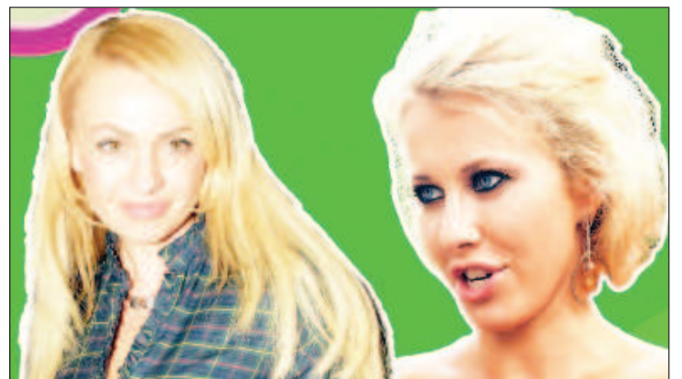
Яна Рудковская, Ксения Собчак

Не так давно знаменитая продюсер шокировала общественность, признавшись, что ее платье для вечеринки журнала Glamour стоит более 3 миллионов рублей. Звезда, комментируя приобретение, отметила, что "знает себе цену", однако фа-