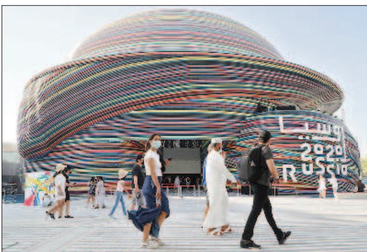
Павилионът на Русия на Експо-2020 в Дубай