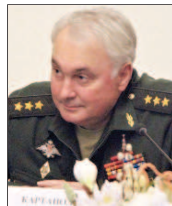
Председателят на Комитета за отбрана на Държавната дума Андрей Картаполов

европейските партньори думите на Владимир Владимирович за необходимостта от незабавно начало на преговори с цел изработване на ясни международно-правни договорености, изключващи всяко по-нататъшно придвижване на НАТО на Изток и разполагане в съседните на Русия държави, преди всичко в Украйна, заплашващи страната въоръжения. Върху това трябва да помислят нашите европейски партньори", подчерта Картаполов.