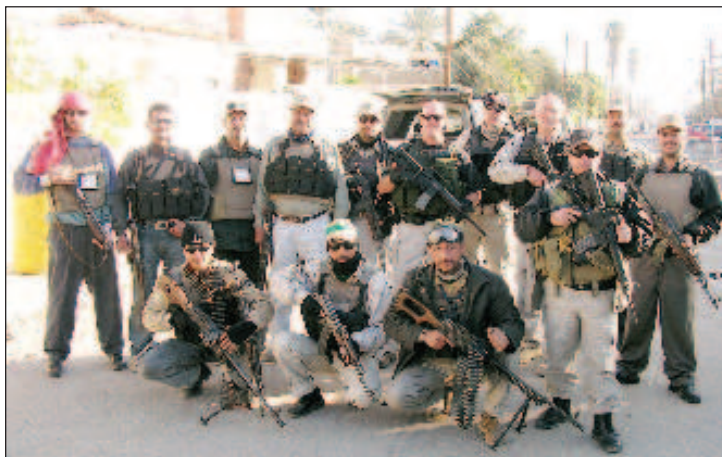
Прословутата американска частна военна компания "Блекуотър" участва в масов разстрел на мирни жители на площад Нисур в Багдад през 2007 г., но тогава ЕС не реагира

Москва запазва правото си на отговор на недружествените действия на Европейския съюз по отношение на руските граждани и организации, се казва в разпространен във вторник коментар на руското Министерство на външните работи по повод въвеждането на едностранни ограничителни мерки.