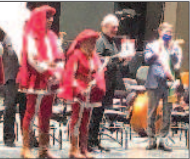
Маестро Гергиев - духовный посол между Россией и Европой Стр. 5

Газета "Русия днес-Россия сегодня" и Болгаро-руссийски информационен пул при поддержке Посольства России в Болгарии и Фонда поддержки и защиты прав соотечественников, проживающих за рубежом проводит 18-19 декабря 2021 г. в Софии международную конференцию "Актуальные проблемы положения российских соотечественников, проживающих за рубежом. Международный опыт их защиты от дискриминации, притеснения и домашнего насилия".