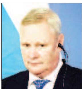
Първият заместник-министър на външните работи на Русия Владимир Титов

Първият заместник-министър на външните работи на Русия Владимир Титов обсъди с ръководителите на дипломатическите мисии на Австрия, Унгария, Полша, Словакия, Чехия, ФРГ и Швейцария сегашната военнополитическа обстановка в Европа.