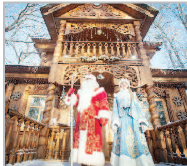
Имението на беларуския Дядо Мраз е най-голямото в страните от Общността на независимите държави /ОНД/. Територията на резиденцията е около 15 хектара. Тя е разположена в знаменития природен феномен на страната - националният парк "Беловежская пуща". Тук има дървени скулптури и невероятни украшения от дърворезба. Освен главната локация на имението - дома на Дядо Мраз, тук е разположена и дървената къщичка на Снежанка, поляна на 12-те месеца, жива украсена елха, алея със знаците на Източния календар и новогодишен влак.

дерация не се намесва във вътрешните работи на суверенни държави и уважава правата на всяка страна. Сенаторът обърна внимание на това, че в тази ситуация сенаторите от САЩ смятат за нормална властта в Украйна, която всъщност е терор срещу собствения народ, срещу част от своята територия.