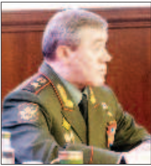
Началникът на Генералния щаб на Въроръжените сили на Руската федерация армейски генерал Валерий Герасимов запозна чуждестранните военни аташета със стратегическите възможности на Въроръжените сили на Русия