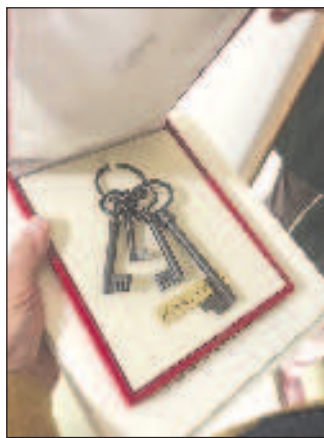
Валерию Гергиеву вручили символические ключи от Флоренции

В 2017 году он был награжден Президентом Румынии Радевым орденом Святых Кирилла и Мефодия за развитие болгарско-русских отношений. Осенью этого года под патронатом Румынии Радева и его супруги он снова дал благотворительный