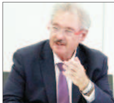
Министърът на външните работи на Люксембург Жан Аселборн

Министърът на външните работи на Люксембург Жан Аселборн е на мнение, че кризата в Украйна може да се урегулира само по дипломатически път - въз основа на Минските споразумения. Тази своя позиция той изложи в началото на седмичната след пристигането си за срещата на министрите на външните работи на страните от ЕС.