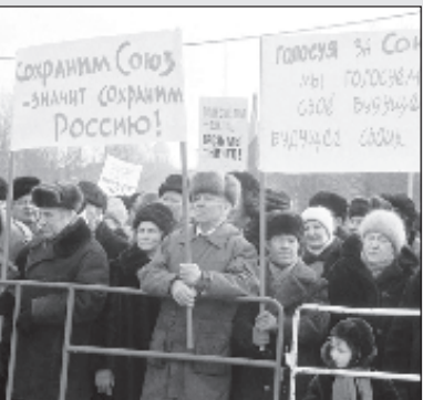
Заговор против государства и народа Стр. 8