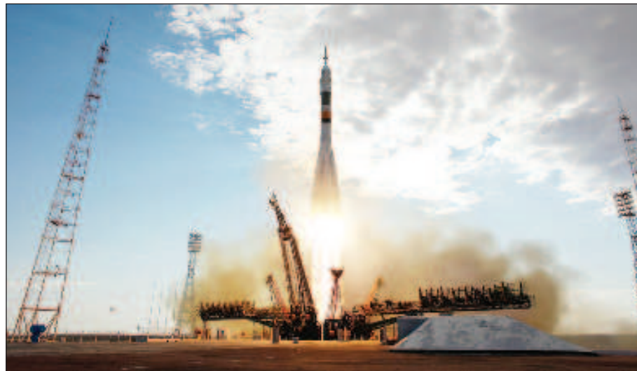
Запуск ракеты на "Байконуре"

Россия и Казахстан окончательно определились с перечнем мероприятий и сроками реализации, договорились о создании объектов социальной сферы и обслуживающей инфраструктуры города Байконур. Кроме того, чиновники озаботились вопросом развития экологической безопасности новой площадки и проработали решения по выводу их аренды, списанию и утилизации неиспользуемых объектов комплекса "Байтерек".