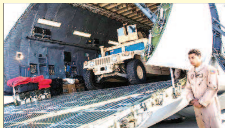
Украина получила от США вооружение на рекордные 510 млн. доллара

Ранее глава украинского Минобороны выразил надеж-