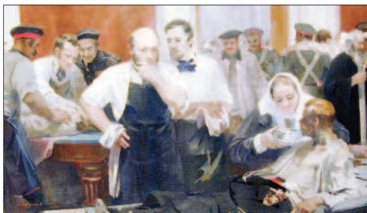
Николай Пирогов среди раненых на поле боя

Энергичный опытный врач-клиницист и диагност Сергей Боткин, официально исполнявший в 1877 г. обязанности лейб-медика, добровольно стал главным те-