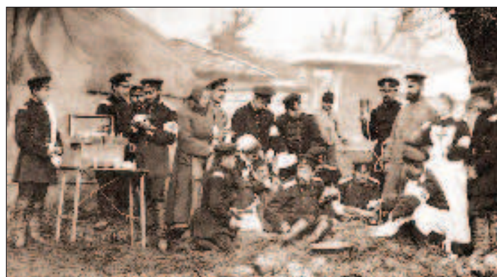
Иногда русские врачи устанавливали медпункты в домах болгар

Ученик и продолжатель дела Пирогова Склифосовский, горячо сочувствуя освободительной борьбе славянского народа, летом 1876 г. отправился в Черногорию, где он осуществлял главное наблюдение над всей медицинской