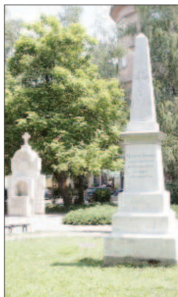
Братската могила на воини от 14-та пехотна дивизия, загинали на Шипка през Руско-турската освободителна война. Двата паметника се намират непосредствено до църквата "Успение на Пресвета Богородица"

Едно от най-човешките пожелания е да бъде мир. На 3.03.1878 г. е подписан документ за съгласие, с който спират смъртта, мъките и тревогите на хиляди хора по българските земи. За много родове това е щастливата съдба родовете им да надминат седем поколения. И когато някой иска да преоцени, да промени или отрече такова човешко постижение, трябва много да си помисли срещу какво се изправя.