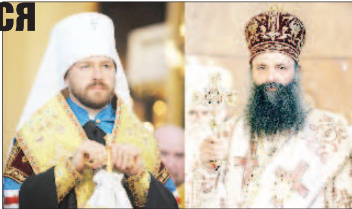
Митрополит Волоколамский Иларион и Патриарх Сербский Порфирий

"Я думаю, что это достойное избрание, которое по-