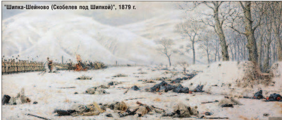
"Шипка-Шейново (Скобелев под Шипкой)", 1879 г.

А Островский сумел одной строчкой объяснить, почему одни Верещагиным восторгались, а другие - критиковали: "Творческому воображению художник не давал воли, и в этом была его и сила, и слабость". tass.ru