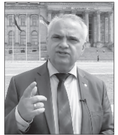
Депутат Бундестага Вальдемар Гердт

До присоединения Крыма к России более 80 процентов пресной воды на полуостров поступало через Северо-Крымский канал, который идет от Днепра, но Украина перекрыла его после референдума 2014 года. Многие водохранилища по-