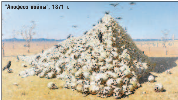
"Апофеоз войны", 1871 г.

Такие пирамиды оставил за собой Тамерлан в XIV веке. А правитель Кашгара Валихан-торе, следуя "традиции", приказывал сооружать