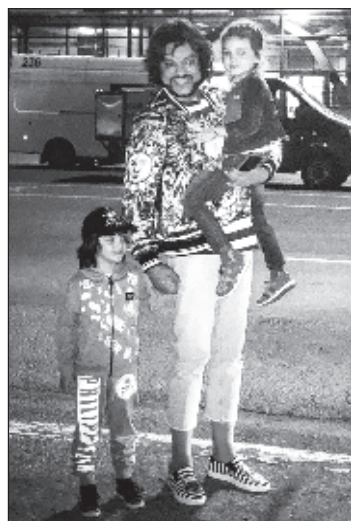
Оказалось, что гастроли Филиппа Киркорова в Крыму являются угрозой национальной безопасности Литвы

Министр заявил, что данные средства были выделены "из-за порочного прежнего порядка субсидирования". "Этот горький урок я хотел бы использовать и как повод глубже посмотреть на давно существующую проблему. Уже не первый раз в обществен-