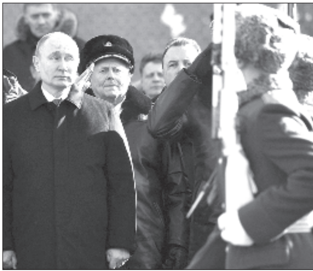
Руският държавен глава Владимир Путин поздравя военнослужещите и ветераните по случай Деня на защитника на отечеството

"Съвременният свят изисква постоянна бдителност и готовност за отговор на най-сложни предизвикателства, грамотни, решителни и ефективни действия. Нашата армия и флот умеят да правят това. Ние