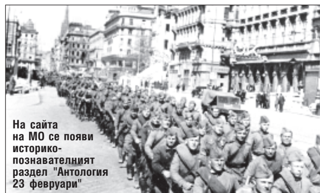
На сайта на МО се появи историко-познавателният раздел "Антология 23 февруари"

Отбелязва се, че в раздела се публикуват и материали за награди от фондовете на Централния архив на Министерството на отбраната за всички герои на Съветския съюз, за които вестникът е съобщавал в онези години. "Сред тях, напри-