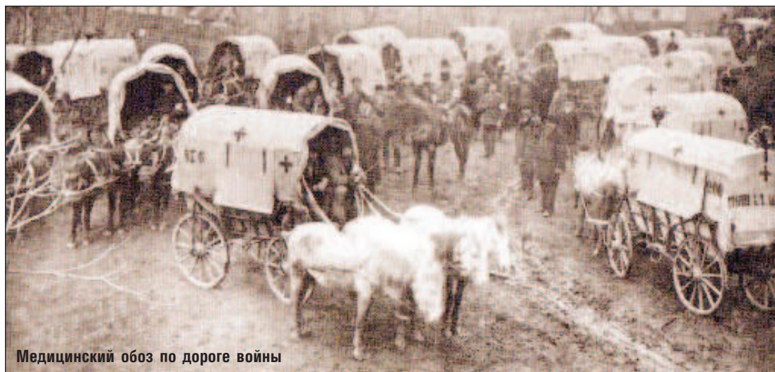
Медицинский обоз по дороге войны

частью санитарного отряда в Черногории и Герцеговине. Талант Склифосовского, как хирурга в полную силу раскрылся во время войны за освобождение Болгарии. Развивая взгляды Пирогова, он внес значительный вклад в военно-полевую хирургию, был сторонником максимального приближения медицинской помощи к месту боя, проводил на практике, как и Пирогов, принцип "сберегательного лечения огнестрельных ран" (был против ранних ампутаций при огнестрельных ранениях конечностей с повреждением костей). Примененные Склифосовским хирургические методы спасли жизнь многим раненым. Большое внимание Склифосовский, как и другие передовые врачи того времени, уде-