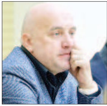
Захар Прилепин (истинското му име е Евгений Прилепин) е политически деец, писател, филолог, публицист. Той е член на щаба на Общеруския народен фронт и преди обединението е лидер на партията "За правду"

Двете нови длъжности са съпредседател-председател на Централния съвет и съпредседател-председател на