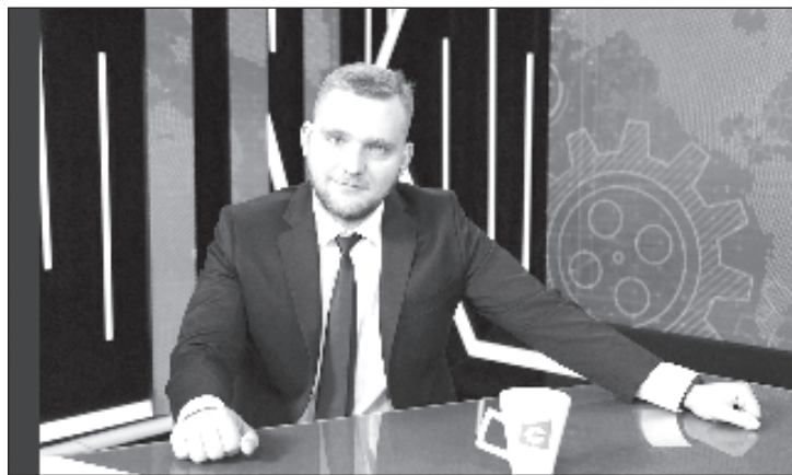
Григорий Азарёнок - белорусский режиссёр документальных фильмов и общественный деятель. Заслуженный деятель культуры Республики Беларусь. Приобрёл скандальную известность благодаря своим фильмам на тему изобличения оппозиции

большую роль сыграла и диктатура Пилсудского. Вообще, хочу сказать, что Европа того периода была достаточно быстро провело мной - видим, что происходило во всех странах Европы, начиная, там, Испания, Италия, Германия - и Польша, в общем-то, шла по этому же пути. При всех обвинениях, например, в большом авторитаризме Сталина и Советского Союза, на территории Польши белорусы, в общем-то, чувствовали себя доста-