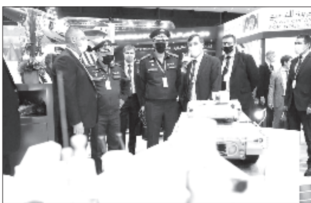
Делегацията от военното ведомство разглежда руската експозиция на изложението IDEX 2021, организирана от "Рособоронекспорт"

Показани бяха образци нова руска сухопътна бронирана техника, представени на експозицията от концерна "Уралвагонзавод". Гене-