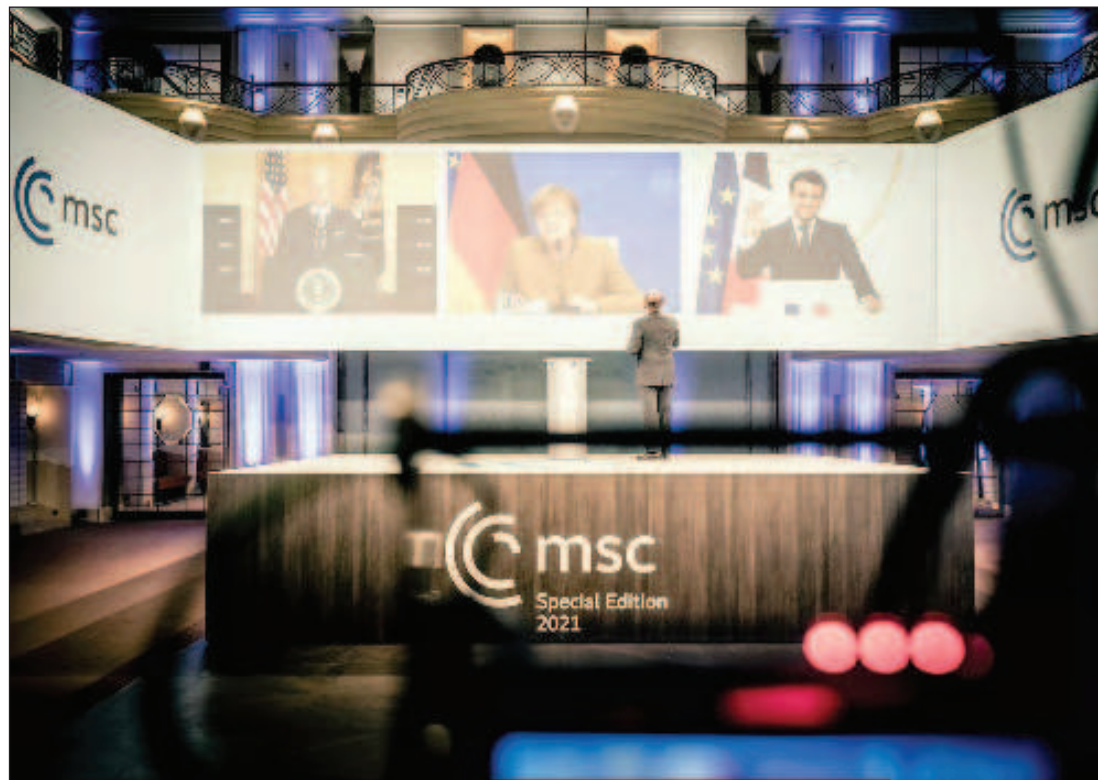
Така изглеждаше "специалното издание - 2021" на Мюнхенската конференция по сигурността

Очевидно е общото желание на САЩ и Европа да възстановят някогашното си единство, за което се смята, че е било разрушено от Тръмп. Ясно е също обаче, че то няма да си възвърне старата монолитност. Байдън иска бързо да запуши дупките, но Европа вече не е съгласна това да става за сметка на нейната икономика и уязвена сигурност. Днес това личи най-малко по реакцията на Германия в защита на "Северен поток-2" и на десетките хиляди фирми, работещи успешно в Русия. Избраният от Запада принцип за консолидация "гружба срещу някого" може да бъде ефективен, но не за дълго - докато има обединяващ фактор. Така беше по времето на студената война, когато Западът наистина беше обединен от общи социално-икономически, политически и идеологически интереси. Днес поради липса на друг обединяващ фактор САЩ тръбят за запахите от Русия и Китай. Но Европа все по-осезателно изпитва последиците за икономиката си от натрапената им "руска опасност". Все по-чувствителна става необходимостта да се раздели с илюзиите си. Важното е да не стане твърде късно.