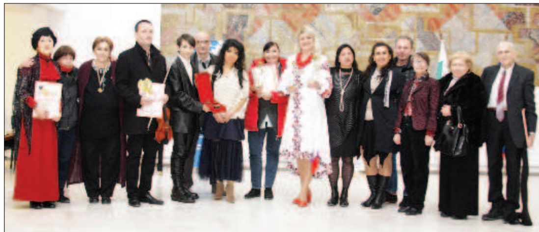
Лауреаты фестиваля с наградами