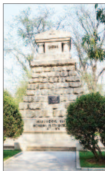
"Медицинским чинам погибшим в Турецкую войну 1877-1878" написано на памятнике в Софии

рапевтом Дунайской армии, сделав немало полезного для налаживания работы госпиталей, своевременной транспортировки раненных и т.д. Он помог в выявлении причин эпидемических заболеваний, в том числе желудочных, развившихся в ар-