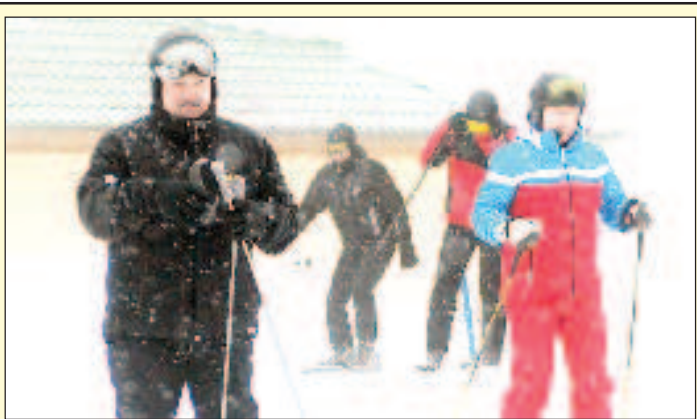
След продължилите шест часа преговори дойде време и за спорт

След срещата си в Сочи президентите на Русия и Беларус Владимир Путин и Александър Лукашенко се чува по телефона. Главните теми, обсъдени по време на разговора, са били функционирането на данъчната система, въпросите на кооперирането в рамките на Военнопромишления комплекс, информационното противодействие, съобщиха от пресслужбата на беларуския лидер. "Изравняването на условията за живот на хората и на субектите на стопанството в Съюзната държава са главна цел на цялата предстояща интензивна дейност", се подчертава в съобщението.