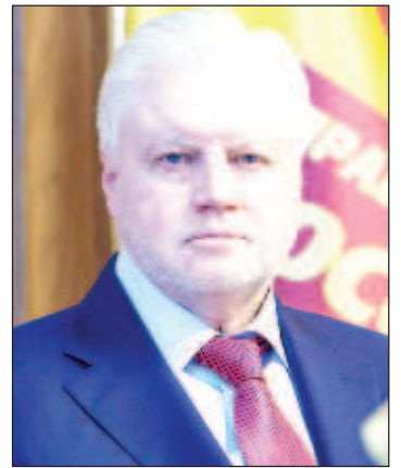
Сергей Миронов е политик, но няколкото висши образования му създават ореол на изключително образован човек. Завършил е Ленинградския институт "Плеханов" (инженер-геофизик), с отличие - юридическия факултет на СПбГУ, Санктпетербургския технически университет и Руската академия за държавна служба към президента на РФ. Бил е председател на Съвета на Федерацията преди Валентина Матвиенко. От 2016 година е ръководител на фракцията "Справедливая Россия" в Думата

Именно сходните моменти в програмите са били основата за преговорите и на самото обединение на трите партии. Захар Прилепин съобщи, че е водил преговори за разширяване на коалиция с още някои организации в левия сектор и до един-два месеца това ще стане ясно. Миронов е убеден, че на 19 септември новата коалиция ще накара да участват в изборите гражданите, които до-