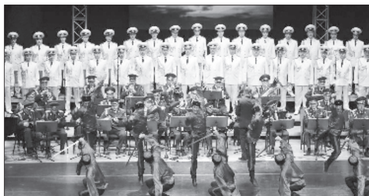
В конце 2015 года на Прибалтике запретили гастроли Академического ансамбля песни и пляски Российской армии имени А.В. Александрова

Он привлек к себе лишнее внимание в Вильнюсе в 2018 году, когда находился там с гастролями. Певец пришел голосовать на выборах президента России в посольство и горячо поддержал Владимира Путина. "Я за сильного президента, за сильную Россию, за настоящую Россию, в которой я родился 51 год назад. Я голосовал за свою красивую страну, которая никогда и никому не желала ничего плохого и никогда ни на кого первой не нападала", - сказал тогда артист.