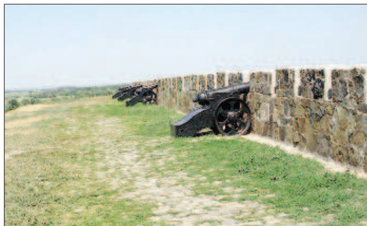
Част от степния маршрут в Ростовска област

В Ростовска област има нов туристически маршрут - "Дискавъри в степта", с дължина 618 км. Той минава покрай магистралата М-4 от север на юг. "Маршрутът е проектиран за три дни и включва 15 локации. По желание може да продължи и седмица", се казва в съобщение на правителството на региона. Маршрутът минава по най-живописните места на областта. Туристите ще могат да видят например древния град Азов и разкошните лозя. Ростовска област е в списъка на регионите с най-добри ус-