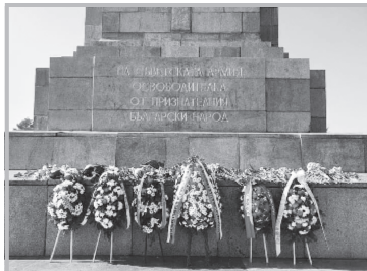
На 23 февруари по повод Деня на защитника на отечеството в Русия пред паметника на Съветската армия в София се събраха множество граждани. Венци и цветя бяха положени от служители на посолството на Русия в България, от посолството на Беларус у нас, Дома на Москва в София, представителството на "Россотрудничество" и РКИЦ, Форум "България-Русия", НС на БСП, Градската организация на БСП, Тракийските дружества, от обществени организации и много граждани. Венци и цветя бяха положени и на Паметника- костница на съветските войници в квартал "Лозенец" в София.

Неприятелите налагат санкции, опитват се да блокират големи международни проекти, открито се намесват във вътрешния обществен и политически живот, в демократичните процедури на страната и за целта активно използват арсенала на своите спецслужби. Подобни действия обаче са абсолютно безперспективни. "Ние сме готови за открит диалог, да търсим компромисни решения по най-сложните проблеми на базата на взаимното доверие и уважение. Но главно за нас безусловно остава суверенитетът на Русия, нейните национални интереси, сигурността на нашите граждани, правото на народа сам да определя своето бъдеще. Тези ценности, които са в основата на нашето развитие, трябва да бъдат надеждно защитени", заяви Путин. /"Русия днес"/