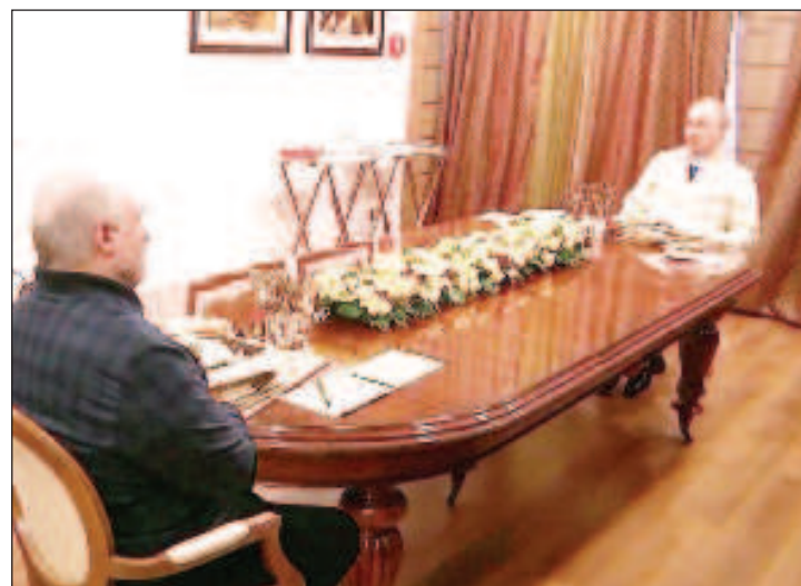
В Сочи се състояха преговори между президентите на Русия и на Беларус Владимир Путин и Александър Лукашенко

В отговор Путин отбеляза, че сътрудничеството между Русия и Беларус в промишлената сфера е мно-