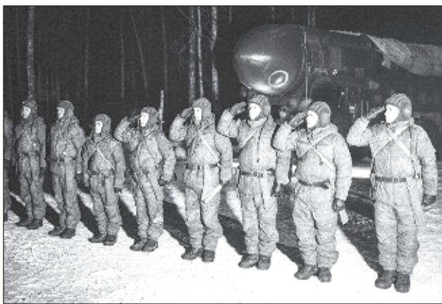
Боев разчет от Ракетните войски със стратегическо предназначение застъпва на дежурство

Около 6000 военнослужещи от Ракетните войски със стратегическо предназначение са посрещнали Деня на защитника на отечеството 23 февруари на бойния си пост, съобщиха от Министерството на отбраната.