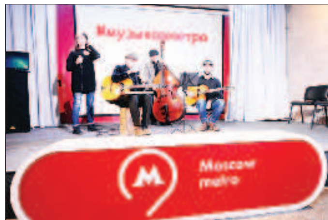
Желаещите да свирят и пеят в метрото са много, но кастинга минават най-добрите

Проектът "Музика в метрото" започва през 2016 г. След двегодишната ковидна пауза артистите се завърнаха в станциите и вестибулите на метрото, в МЦК (Московское центральное кольцо) и МЦД (Московские центральные диаметры). Импровизираните сцени се подбират в съответствие с правилата за безопасност, могат да се проследяват от камерите за ви-