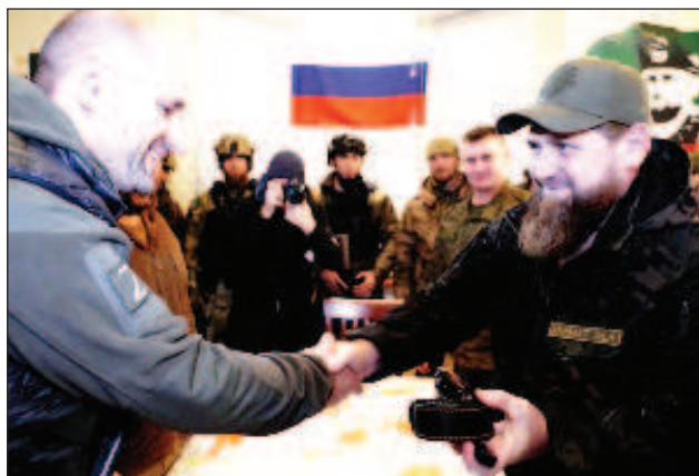
Кадиров към чеченските бойци: "Путин ни вярва и ние няма да го подведем!"

По време на съвещанието Кадиров е заявил, че всички действия вървят по план, ефективно. Наближава основната развързка в Мариупол. В близките дни градът ще бъде превзет и очистен от националистите. Целта