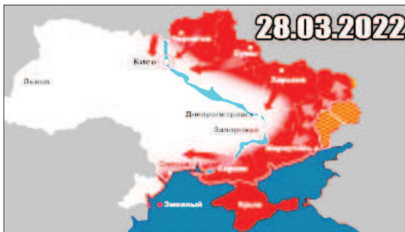
На картата с червен цвят е посочена територията, контролирана от руските Въоръжени сили и народните милиции на Донецката и на Луганската народна република

"Нашата специална операция изпреварва графика. Това говорят западни военни специалисти. Един от тях казва следното: "Поразен съм от скоростта, с която руската армия взема под контрол украинска земя. През този месец е превзета територия, равна на Великобритания". За специалната операция е характерно използването на високоточно оръжие и безпилотни летателни апарати, а това са белези за високотехнологична и съвременна армия", подчертава