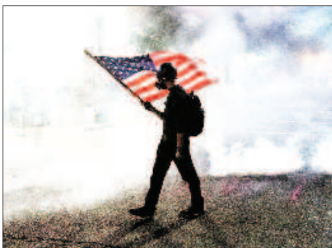
The Daily Wire предече недостиг на енергоресурси и продоволствия в САЩ заради политиката на техния президент

"През последните две години онова, което ни се струваше, че никога няма да се случи, стана реалност. Въвеждане едновременно на пълномощабни локдауни, затваряне на църкви, носене на маски по заповед на федералното правителство, икономика, която просто спря, а сега и недостиг на продоволствия", пише Ноулс. Президентът на САЩ