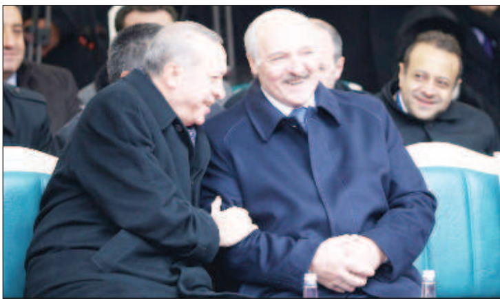
Лукашенко поздравил Эрдогана с 30-летием установления дипломатических отношений

Александр Лукашенко заострил внимание адресата послания на современных реалиях, живя в которых очень значима способность сохранения взаимной под-