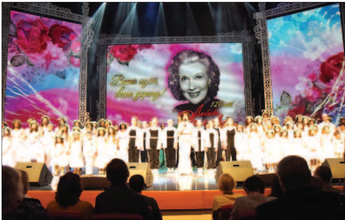
В завершение концерта все участники исполнили номер из репертуара Исаака Дунаевского с современной стилизацией произведения Фото и текст Лилии Ашарфудиновой

Вызовы послов Болгарии и России для консультаций будут мешать нашему межгосударственному диалогу в условиях, когда единственным путем к миру и взаимопониманию является дипломатия. Наша страна могла и может быть мостом для диалога между Западом и Россией. Даже Царь сказал: "С Евросоюзом - да, но не против России"! Но для этого нужны государственные деятели и настоящие лидеры, которых, увы, в этой судьбоносной ситуации в Европе и мире явно не хватает. Сегодня Турция взяла на себя роль посредника, от чего только приобретает международный и политический авторитет, а Болгария снова находится на грани того, чтобы принять неправильную сторону в истории.