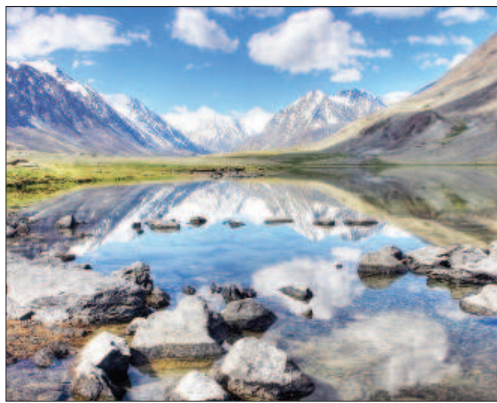
Алтайский край расположен на юго-востоке Западной Сибири, на границе континентальной Азии, в 3419 км от Москвы. Территория края составляет 168 тыс. кв. км, по площади занимает 21-е место в Российской Федерации и 6-е место в Сибирском федеральном округе. На севере край граничит с Новосибирской областью, на востоке - с Кемеровской областью, юго-восточная граница проходит с Республикой Алтай, на юго-западе и западе - государственная граница с Республикой Казахстан протяженностью 843,6 км.

Туризм на Алтае надолго запоминается вкусной натуральной едой из экологически чистых районов, изобилием меда и сыра - знаменитых брендовых продуктов - и удивительными рецептами блюд национальных и культурных диаспор. С 2019 года Алтайский край реализует на своей территории федеральный проект "Гастрономическая карта России", направленный на продвижение блюд современной региональной кухни, а также на выявление перспективных региональных продуктов с наибольшим экспортным потенциалом