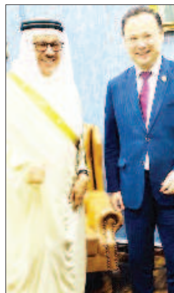
Министр иностранных дел Киргизии Руслан Казакбаев встретился со своим бахрейнским коллегой Абдуллатифом бин Рашидом Аль-Заяни

Кыргызский министр передал коллегам документы на рассмотрение, предусматривающие дальнейшее сотрудничество в области