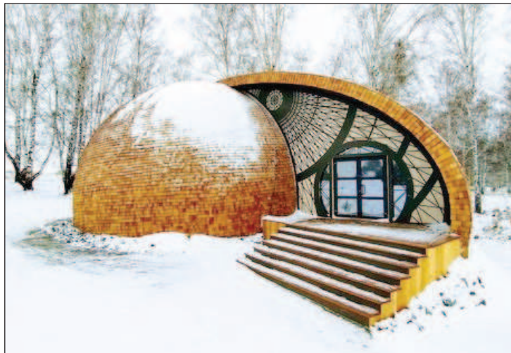
"Дом звука" в "Мира Парке" с пристройкой в виде ракушки в 2020 году завоевал сразу три награды фестиваля "Золотая капитель"