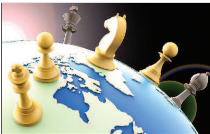
Според изданието The Intercept смята, че кризата в Украйна стана последна стъпка към появата на постамерикански свят

Кризата в Украйна стана последна стъпка към появата на постамерикански свят, се казва в материал