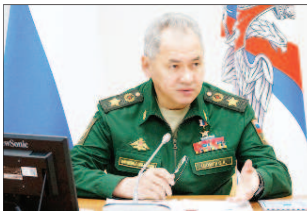
Руският министър на отбраната армейски генерал Сергей Шойгу по време на съвещанието в отбранителното ведомство

Шойгу поръча изпращането на наборниците във войските да започне през третата десетдневка на месец май, като уточни, че началото на наборната кампания ще започне още през тази седмица - на 1 април.