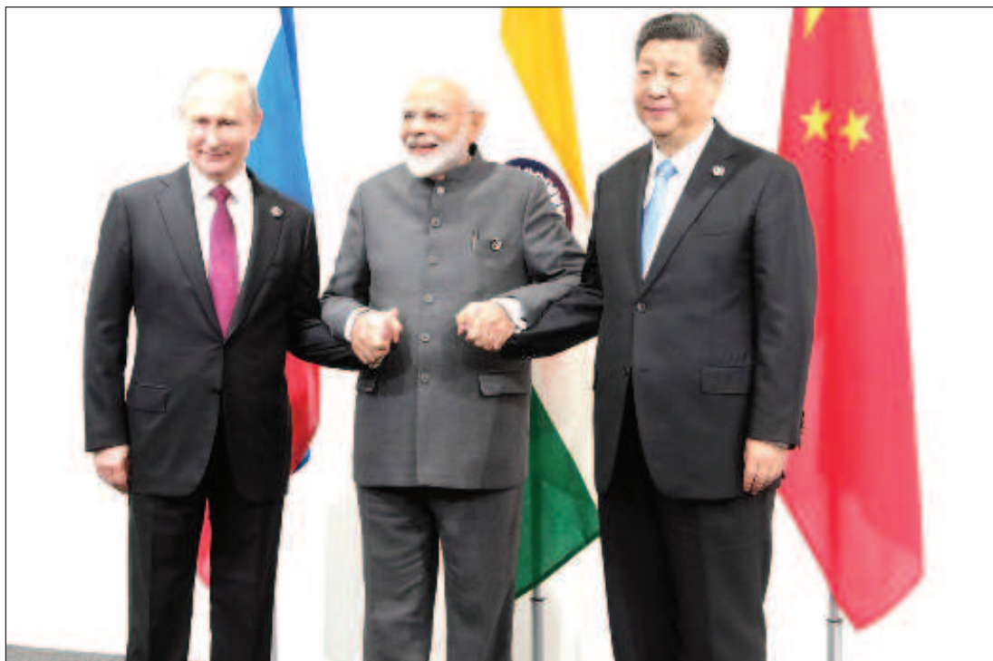
Лидерите на Русия, Индия и Китай - пример за равноправно партньорство срещу опитите за диктат на САЩ

Същевременно сътрудничеството между двете страни е несравнимо с многостранното руско-китайско взаимодействие. Затова в хода на неотдавнашната визита на Владимир Путин в Делхи