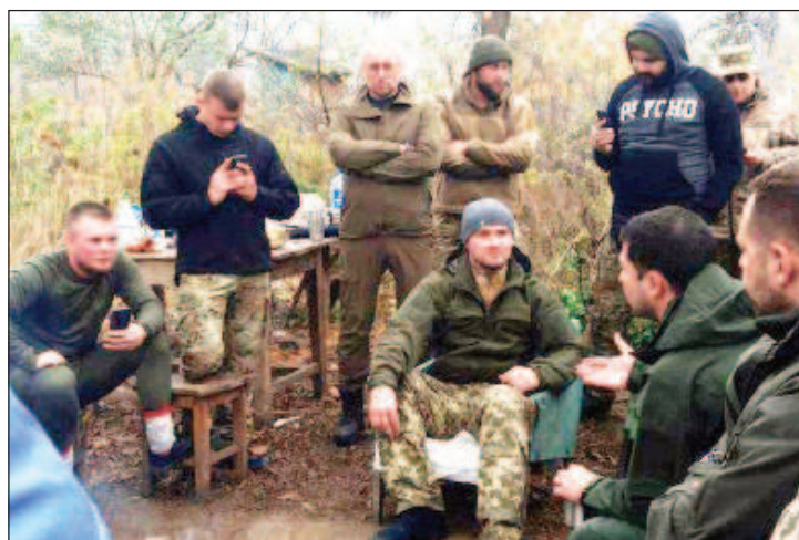
Несмотря на все усилия, верховный главнокомандующий Вооруженных сил Украины утратил контроль над национальными батальонами

Но Зеленский не может этого сделать по определению, вся линия его поведения исходит из установок США, а Байдену никакой мир на Украине не нужен. Единственно чего хотят американцы, втянуть Россию в позиционную войну, чего мы допустить никак не можем.