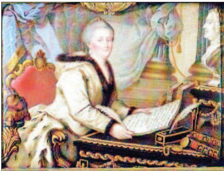
Екатерина II оставила потомкам огромное литературное наследство

- Она любила и хорошо знала страну, которая стала для нее отечеством. "Путешествие в Сибирь" - резко антирусский книга, была издана во Франции. И ответ неизвестного автора