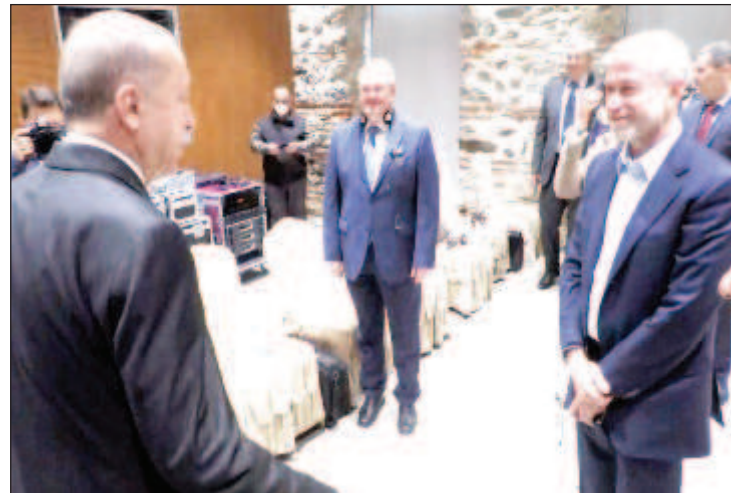
Турският президент Реджеп Тайип Ердоган се среща с руския милиардер Роман Абрамович преди началото на руско-украинските преговори в Истанбул

рите между представители на Русия и Украйна. Според пресекретаря на руския президент Дмитрий Песков бизнесменът е участвал в преговорите между страните в началния стадий. Източници на "Файненшъл Таймс" съобщиха, че руският лидер Владимир Путин лично е одобрил участието на бизнесмена в мирните преговори. Председателят на партията "Слуга на народа" и член на украинската делегация Давид Арахамия съобщи, че се е срещал с Абрамович в Гомел, където премина първият кръг от преговорите между Москва и Киев.