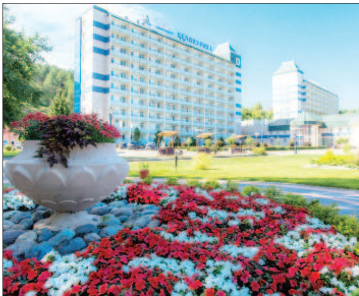
Город-курорт Белокуриха - многократный обладатель звания "Лучший курорт федерального значения", а его санатории первые в России получили престижный сертификат европейского качества EuropeSpa Med

В структуре валового регионального продукта существенно преобладают доли промышленности, сельского хозяйства, торговли. Дан-