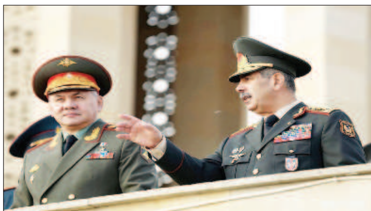
Сергей Шойгу и Закир Гасанов обсудили нормализацию ситуации в Нагорном Карабахе

Накануне официальный представитель российского МИД Мария Захарова заявила в ходе брифинга, что продолжаются осуществляемые при консультативном посредничестве России межведомственные контакты для начала процесса делимитации и демаркации азербайджано-армянской границы.