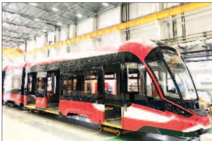
Трамваят "Витязь" ще е вече с руски двигатели, а вагонът е произведен в Твер

Западните санкции могат да се окажат полезни, смятат икономисти. За бизнеса в регионите се отваря възможност да заемат нишата на вносните стоки, да внедряват технологии, което е било сложно да се прави на фона на силните чуждестранни конкуренти. Но по-добре късно, отколкото никога. Това вече мнозина са прозрели. Особено в промишлеността. Нови перспективи например са се появили за татарстанското предприятие "Кориба", което внедрява руски пластик в кабелното производство и произвежда до един милион акумулаторни батерии. "В акумулаторите установихме два вносни компонента - френско фолио и турска хартия. Фолиото винаги го е произвеждала нашата фирма "Тесма" и ние вече дадохме заявка тя да възобнови производството за рус-