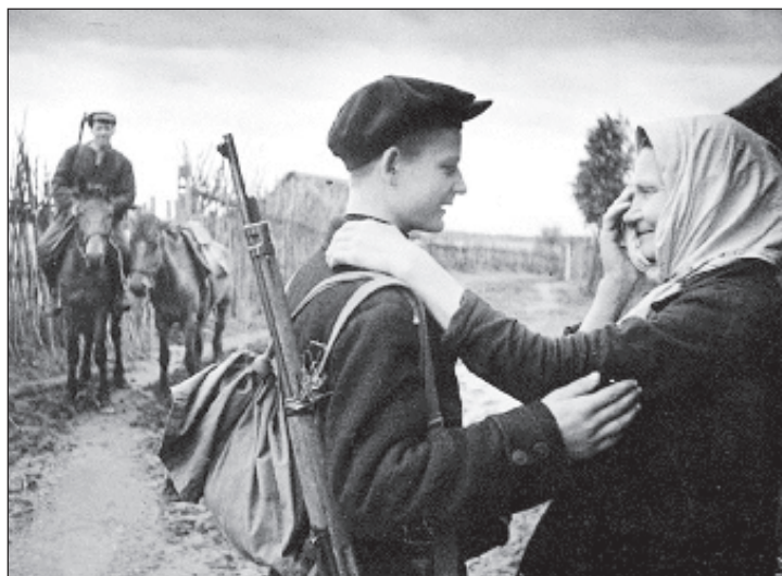
Проводы молодого солдата на фронт

к немецкому народу в связи с началом войны против Советского Союза. "Немецкий народ! В данный момент осуществляется величайшее по своей протяженности и объему выступление войск, какое только видел мир" - го-