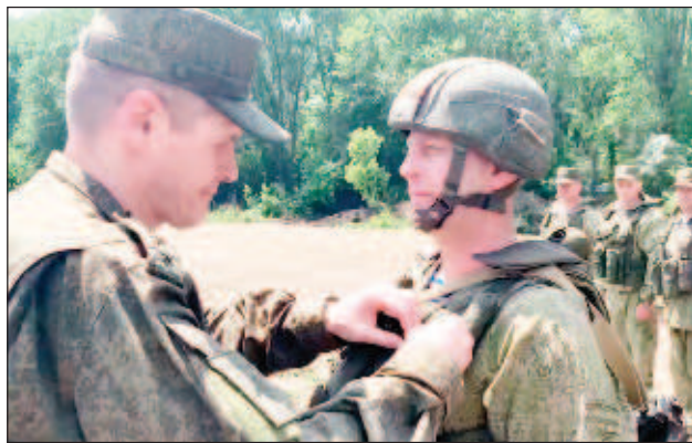
Генерал-полковник Михаил Теплински връчи държавни награди на военнослужещи от Въздушно-десантните войски

"След извършване на разузнаване безпилотният летателен апарат "Орлан-10" се завръща обратно. По време на артилерийския обстрел го приземих на полето и го изведох извън минометния обстрел. Запазих техниката в из-