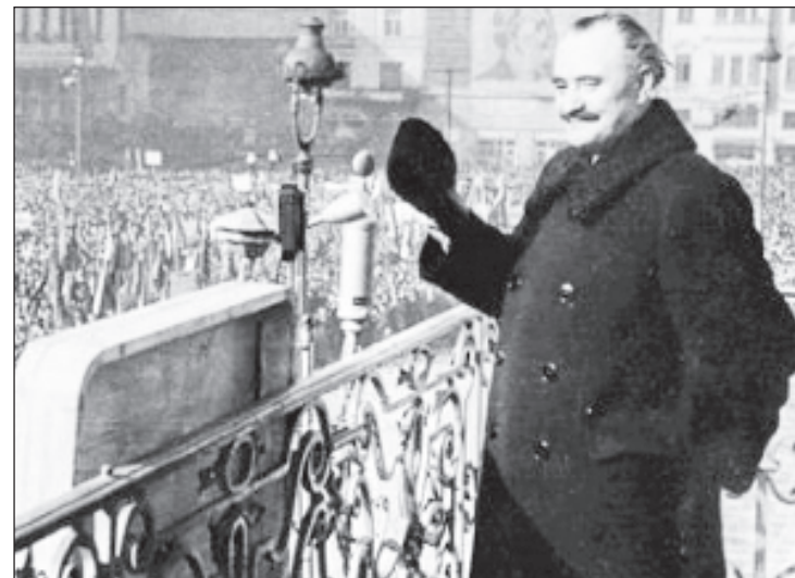
Георги Димитров е символ на борбата срещу фашизма

Музикален поздрав към присъстващите отправиха певиците Грета Ганчева и На-