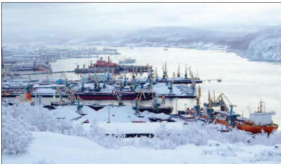
Мурманското пристанище през зимата

Днес мурманското пристанище е в ТОП 5 на най-големите пристанища в Русия по товарооборот, който е 54 милиона тона годишно. Неговото основно конкурентно преимущество е, че има пряк, от нищо неограничен достъп до Световния океан, тук се транспортира широка номенклатура стоки и има възможност да се обработват големи морски съдове. Тези фактори имат изключително значение за икономическото развитие и сигурността