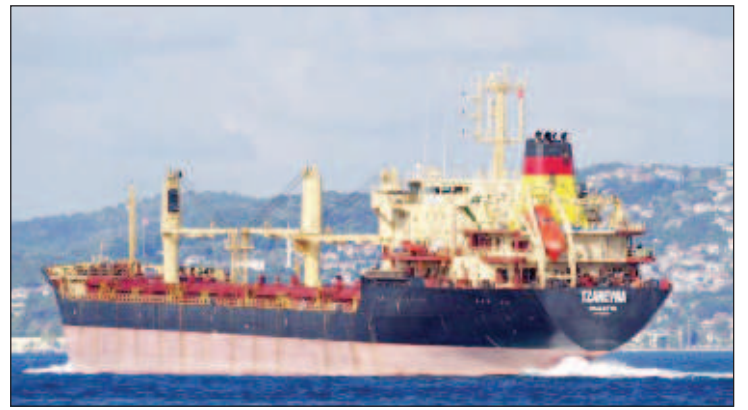
Българският кораб "Царевна" е на път да напусне порт Мариупол