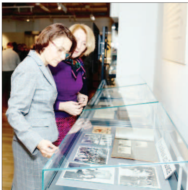
22 июня, в День памяти и скорби прошла Обзорная экскурсия "Русская эмиграция. От изгнания к триумфу" по музею Дома русского зарубежья имени Александра Солженицына

- Еще как летают! У них вообще все очень любопытно. Все пользуются сотовыми телефонами, а вот телевизор у них запрещен. Из Красноярска их отправили в Шушенское... Их принял местный предприниматель, бывший председатель колхоза, который там скупил все земли. Дальше было печально. Их отвели на квартиру в пятиэтажке, бросили матрас на пол и сказали: здесь ночуйте, завтра за вами придут, будете работать на ферме. Зарплата - пять тысяч. Они возмути-