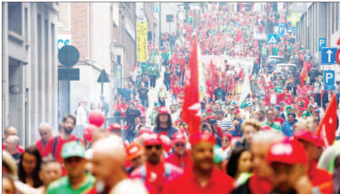
Протести в Брюксел срещу резкия скок на цените

посочи истинските корени на финансовите и икономическите проблеми на Евросъюза и САЩ и негативното влияние, което те оказват на останалия свят.