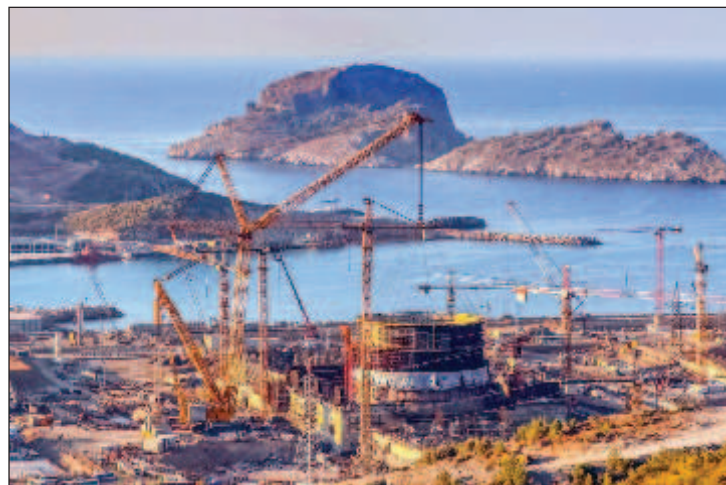
АЕЦ "Аккую" в провинция Мерсин е първата атомна електроцентрала в Турция. Тя ще произвежда около 35 млрд. кВтч годишно и ще покрива до 10% от електроенергийните нужди на страната

Той уточни, че проектът за изграждане на първата атомна централа в Турция се изпълнява по установения график. АЕЦ "Аккую" ще има четири реактора ВВЕР-1200 от поколение 3+, като се