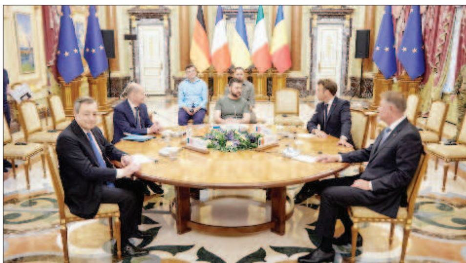
Министър-председателят на Италия Марио Драги, канцлерът на ФРГ Олаф Шолц, президентът на Украйна Владимир Зеленски, президентите на Франция Еманюел Макрон и на Румъния Клаус Йоханис по време на преговорите

Според автора у европейските правителства се натрупва "умора от Украйна" заради факта, че санкционният натиск, който бяха принудени да окажат върху Русия, бие по самите тях. "Проблемът със санкциите по отношение на Русия е, че те работят само когато вредят на самите нас", привежда в потвърждение на своите думи мнението на един от своите приятели -