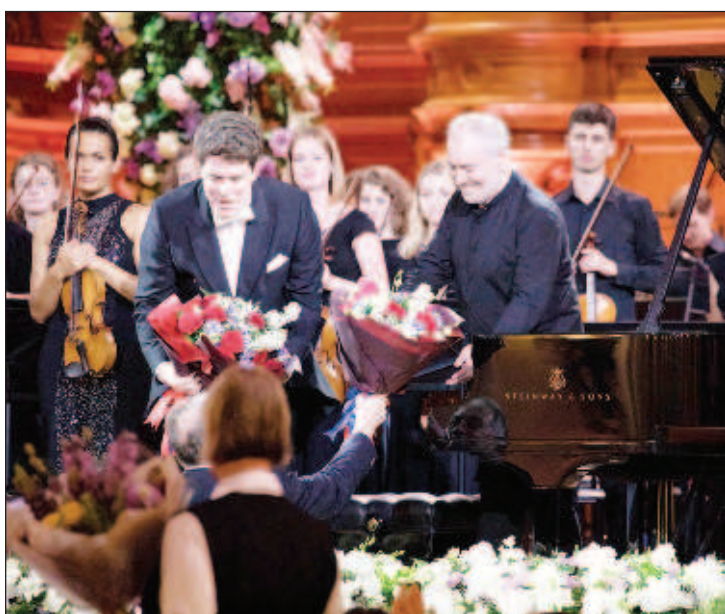
Денис Мацуев и Валерий Гергиев на откриването на конкурса "Рахманинов"

На тържественото откриване Руският национален младежки симфоничен оркестър под диригентството на Валерий Гергиев и Денис Мацуев изпълниха "Симфонични танци" на Рахманинов. Конкурсът е за пианисти, диригенти и композитори - именно в тези три специалности е бил велик Сергей