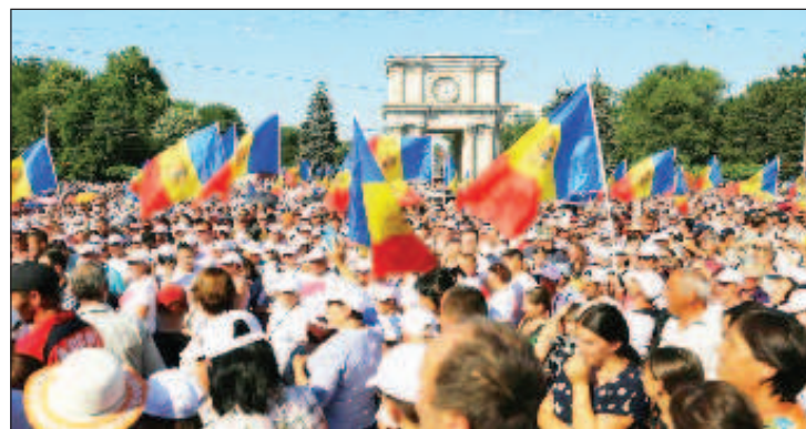
В Кишиневе сорвали концерт Филиппа Киркорова

Также сообщается, что полиция не пропустила на центральную площадь грузовик, перевозивший сцену для проведения концерта с участием артиста Филиппа Киркорова. Протестующие потребовали предоставить организаторам концерта возможность установить сцену и необходимое оборудо-