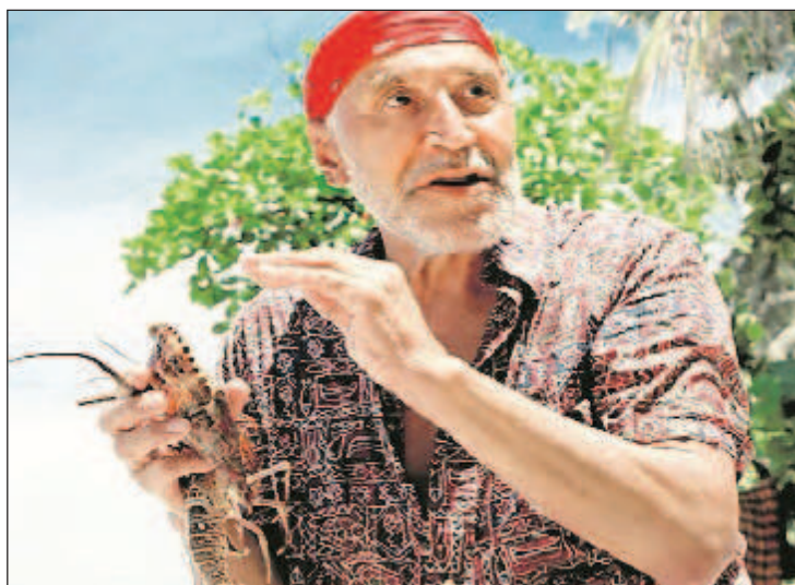
Мало кто ожидал увидеть Николая Николаевича в 67 лет среди героев реалити-шоу "Последний герой". Но он принял вызов, поучаствовав в четвертом, и в пятом сезонах шоу в 2003 и 2004 годах. И в итоге взял приз зрительских симпатий

Ещё учась в школе, Николай Николаевич работал табунщиком на подмосковном конном заводе. После школы поступил на биологический факультет МГУ им. М. В. Ломоносова, но, отучившись два года, ушёл работать. Два года работал на швейной фабрике, сначала учеником, потом дошёл до мастера по пошиву мужской верхней одежды 7-го разряда. Затем вновь вернулся в университет, и в 1963 году окончил кафедру биогеографии географического факультета МГУ. С 1964 по 1966 г. учился там же в аспирантуре. С 1968 года принял участие в популярной телевизионной передаче "В мире животных". Сначала в качестве выступающего (с ведущим А. М. Згуриди) и научного консультанта фильмов о животных "Чёрная гора", "Рики-Тики-Тави" и др., а с 1977 года в качестве авто-