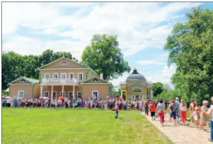
На месте где великий русский поэт М.Ю. Лермонтов провел свое детство сейчас находится Государственный Лермонтовский музей-заповедник "Тарханы"

Наиболее выдающимся археологическим памятником XI-XIII вв. европейского масштаба является Золотаревское городище. Здесь проходили важные торговые коммуникации от Великого