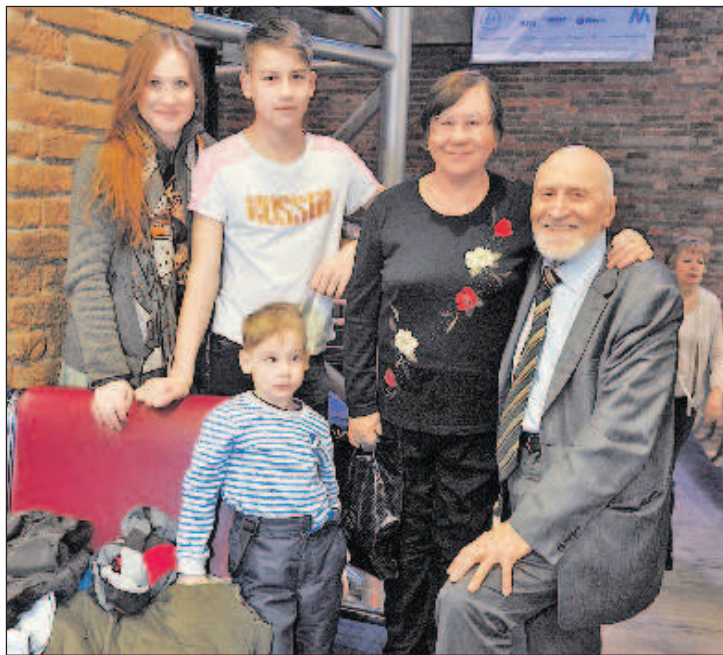
Дроздов с семьей

Правильно говорят, что в старости каждый имеет то лицо, которое заслужил. Посмотрите на эти добрые глаза дедушки из детской сказки. Многие беспокоятся о состоянии здоровья мэтра. Но что в рекламе, что в телепередачах он всегда выглядит бодрим. Может, потому что обрел гармонию с природой за десятки лет исследований. А может, просто потому что всю жизнь посвятил любимому делу.