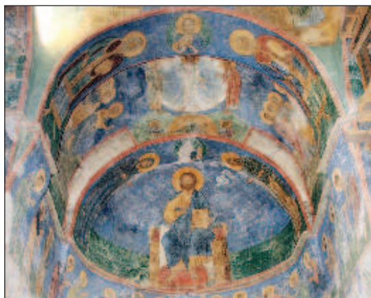
Уникалните фрески на Спасо-Преображенския храм в Мирожкия манастир

През 2019 г. Спасо-Преображенския храм на Мирожкия манастир е включен в Списъка на световното наследство на ЮНЕСКО. Фреските са създавани едновременно с изграждането на храма и са съществували до XVII век, след което са били варосани. За съществуването им става известно едва през 1856 г., когато по време на ремонт на храма