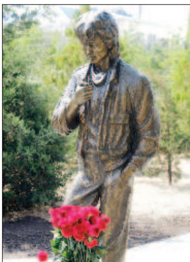
Паметникът на Виктор Цой в Елиста. Виктор Цой е певец, композитор, музикант, художник, актьор, лидер на култовата група "Кино". Роден е на 21 юни 1962 г. в Санкт Петербург. Той загива в автокатастрофа край Рига на 15 август 1990 г. Погребан е в Богословското гробище в Санкт Петербург

Бронзовият паметник на лидера на групата "Кино" Виктор Цой в столицата на Калмикия бе открит по повод 60-годишнината от рождението на певеца, поет и композитор. "Паметникът се намира в центъра на града край Алеята на героите, срещу шахматната ротонда. Скулптурата повтаря известния кадър от филма "Игла", където култовият музикант изпълни главната роля. Това е подарък за града от столичния предприемач Мингиян Яшаев, поклонник на творчеството на Виктор Цой", се казва в съобщение на пресслужбата на Елистинското градско събрание.