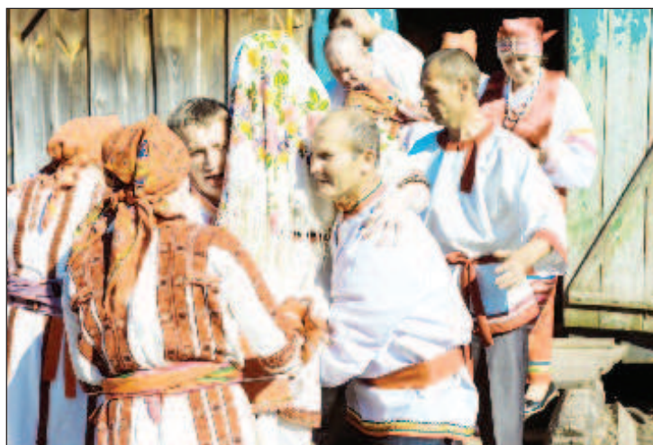
В Пензенской области стартовал проект по воссозданию традиционных свадебных обрядов коренных народов региона. Так, в селе Нижний Катмис Сосновоборского района удалось реконструировать в мельчайших деталях мордовскую свадьбу: национальный костюм, народная атрибутика, песни и присказки, сообщили в региональном отделении Союза женщин России. А в селе Индерка воссоздали татарскую свадьбу, правда, там древний обряд сохранился до наших дней практически в неизменном виде. Он включает в себя встречу молодых с медом и чак-чаком, дарение платков и передачу "сундука"

Участниками колонизации были служилые люди (конные и пешие казаки, рейтары, пушкары, засечные и станичные сторожа), получившие за государеву службу земельные поместья и денежное жалованье. Здесь помещались также татары и мордва, принявшие право-