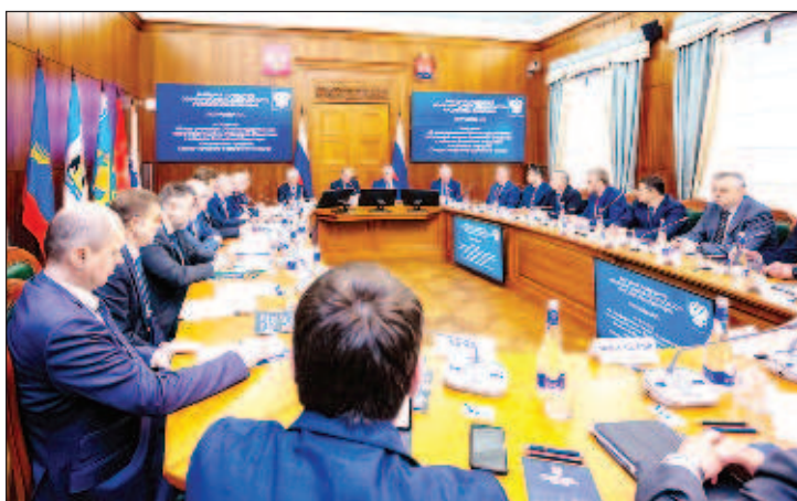
По време на изнесено в Калининград съвещание на руския Съвет за сигурност неговият секретар Николай Патрушев обеща сериозни ответни мерки в отговор на железопътната блокада от страна на Литва

"Ограничаването на железопътния транзит между Калининградска област и другите руски региони показва, че не може да се вярва не само на устните декларации на Запада, но и на писмените - отбеляза Патрушев. - На подобни враждебни действия Русия безследно ще реагира. Съответните мерки се разработват