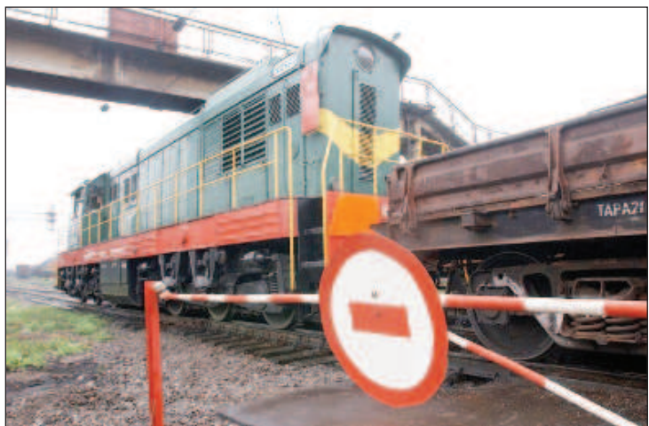
Литовские железные дороги прекратили транзит санкционных товаров к России

Бывший украинский дипломат Ростислав Ищенко прокомментировал транспортную блокаду Калининграда, которую организовала Литва. Об этом он написал в колонке для издания "Украина.ру".