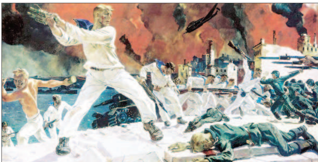
Картина Александра Дейнеки "Оборона Севастополя"