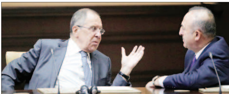
Въпросът за създаването на "зърнен коридор" беше обсъден още на 8 юни по време на преговорите в Анкара на министрите на външните работи на Русия и Турция Сергей Лавров и Мевлют Чавушоглу

Очаква се в случай на начало на работата на истанбулския механизъм в близките шестосем месеца на световните пазари през проливите Босфор и Дарданели да преминат 35-40 млн. тона зърно. Отбелязва се, че корабите ще започнат да извозват зърно от Украйна месец след като механизъмът между РФ, Украйна, Турция и ООН започне в Истанбул. Пър-