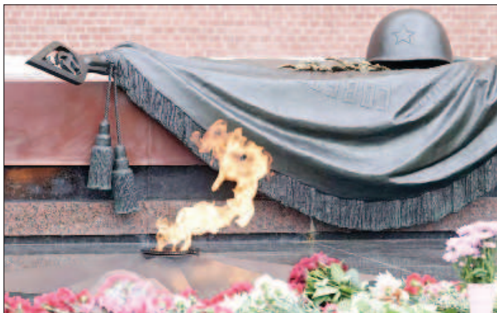
Памятник Неизвестного солдата: "Никто не забыт, ничто не забыто"

Фашистские войска перешли в наступление по всему фронту. Не везде атака развивалась по задуманному германским генштабом сценарию. На юге, на севере вермахту не удалось получить подавляющего преимущества. Здесь завязались тяжелые позиционные бои. Группа армий "Север" наткнулась на ожесточенное сопротивление советских танкистов. Захват переправы через Неман был критически важен для наступающих немецких сил. Бой длился весь день 22 июня. Не добившись успеха, немцы вынуждены были отступить. Сломить сопротивление советских танкистов удалось лишь пикирующим бомбардировщикам. Они атаковали советские танки до полудня 23