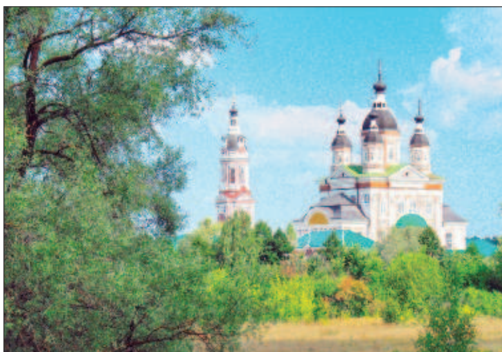
Пещерный Троице-Сканов монастырь - один из самых крупных в Восточной Европе. По протяженности превосходит даже подземные пещеры знаменитой Киево-Печерской лавры

Помимо станичной службы в XVI-XVII вв. осуществлялось строительство оборонительных линий. В середине XVII века были сооружены Пензенские Засечные черты. На них образовались города. Строительство сторожевых черт и крепостей положило начало колонизации Пензенского края, т.е. его освоению и заселению.