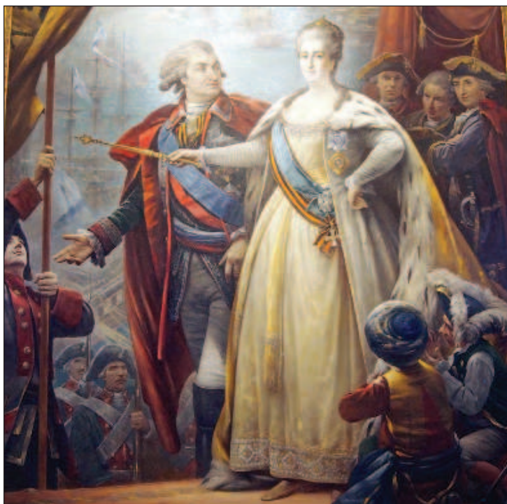
Светлейший князь Потемкин показывает Екатерине Великой новый Черноморский флот в недавно основанном городе Севастополе

Дело в том, что конкретной целью вояжа были Новороссия и Крым, которые еще с 1770-х гг. были в зоне особого внимания Потемкина. Можно даже сказать, что вопрос окончательного присоединения и освоения этих земель стал его навязчивой идеей и главным делом всей жизни. Это можно видеть по его переписке с Екатериной Великой - Светлейший князь в своих письмах демонстрирует то редкостное занудство, то небывалый напор, почти одержимость. И все подчинено одной-единственной цели - сделать Крым русским: "Если же не захватить ныне, то будет время, когда все то, что ныне получим даром, станем доставать дорогою ценою. Вы обязаны возвысить славу России. Приобретение Крыма ни усилит, ни обогатит вас не сможет, а только покой доставит. Поверьте, что Вы сим приобретением бессмертную славу получите и такую, какой ни один государь в России еще не имел. Сия слава проложит дорогу еще к другой и большей славе: с Крымом достанется и господство в Черном море. Сколько славы Вам будет стыда и укоризны от потомства, которое при каждых хлопотах так скажет: вот, она могла, да не хотела или упустила". Это строки из письма Потемкина, датированного декабрем 1782 г. К следующему лету он умудрился сделать так, что Крым в отечественной историографии прочно прописался под именем "трофея, не обагрённого кровью".