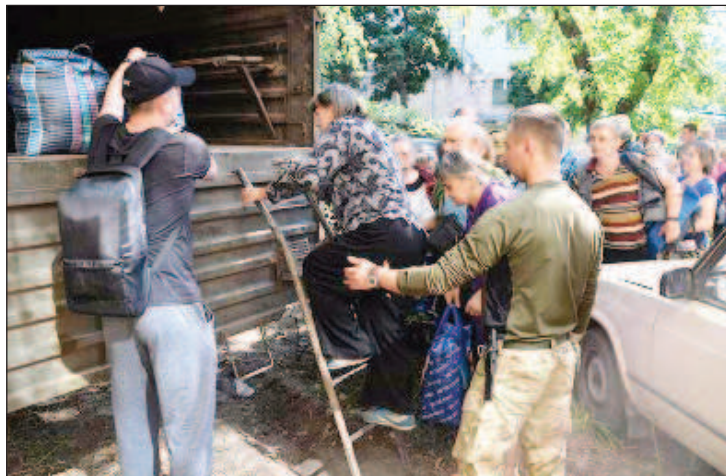
Утром 27 июня стало известно, что с территории завода "Азот" эвакуированы более 500 мирных жителей

Утром 27 июня стало известно, что с территории завода "Азот" эвакуированы более 500 мирных жителей. В Народной милиции ЛНР