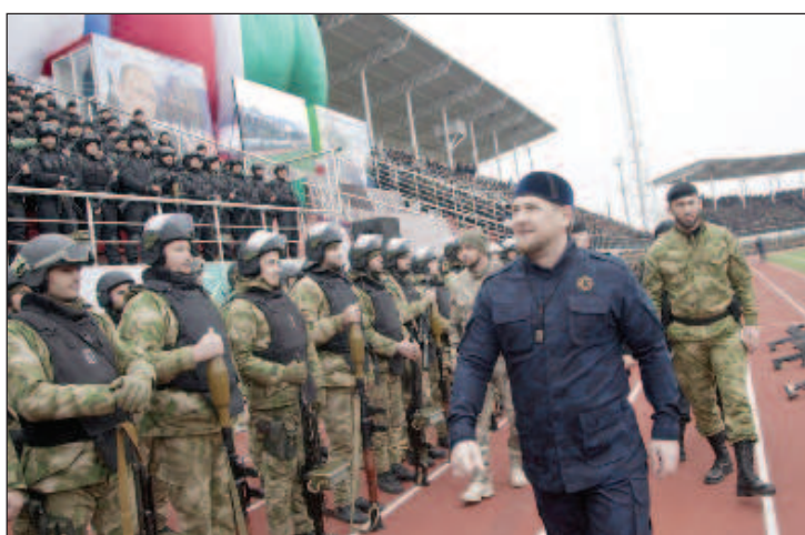
Рамзан Кадилов анонсира създаването на четири нови батальона за участие в специалната военна операция

"В контингента от военнослужещи ще влязат изключително чеченски момчета.