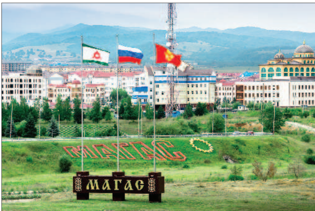
Город Магас был основан в 1994 году на месте, где в средние века находилась столица государства Алания. В 1239 году город, название которого переводилось с нахского языка как "город солнца", был разрушен

Кухня у ингушей сытная и калорийная. Обязательно закажите в ресторане хьалтам дулх - мясо с галушками. Не забудьте сискал - лепешки из кукурузной муки, традиционный ингушский хлеб. И обязательно попробуйте халву из кукурузной