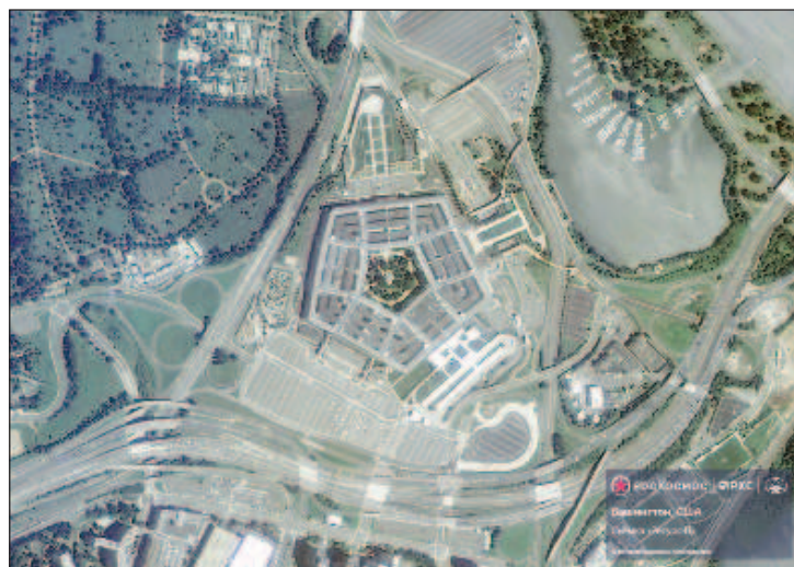
Така изглежда Пентагонът от Космоса

Публикувани са снимки от мястото на провеждане на срещата на най-високо равнище на НАТО в Мадрид, на