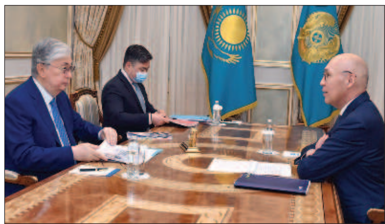
Касым-Жомарта Токаева с управляющим Международного финансового центра "Астана" Кайратом Келимбетовым

"Касым-Жомарт Токаев поручил активизировать работу по привлечению иностранных инвестиций в экономику страны в тесном взаимодействии с правительством, Национальным банком и Агентством по регулированию и развитию финансового рынка", - говорится в сообщении.