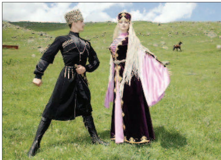
Ингуши - один из древнейших народов Северного Кавказа. Само название - "галгай" ("ḡalḡai") переводится как строитель, житель башен. Русский этноним "ингуш" происходит от названия древнего ингушского села Ангушт. Из-за высокой рождаемости в республике много детей и подростков; средний возраст населения 28,7 года (самое молодое население в стране)

"С 4 по 6 июня на площади Алания перед стометровой башней Согласия в Магасе пройдет международный фестиваль традиционных художественных промыслов и народных ремесел "Край мастеров". Он будет представлять из себя пространство, на территории которого посетители знакомятся с истоками ремесел различных народов и видят, как на их глазах создаются ремесленные изделия. В тече-