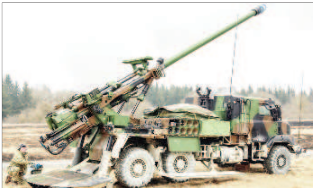
Френска самоходна артилерийска установка "Цезар"

Русия унизи президента на Франция Еманюел Макрон с пленяването на самоходните артилерий-