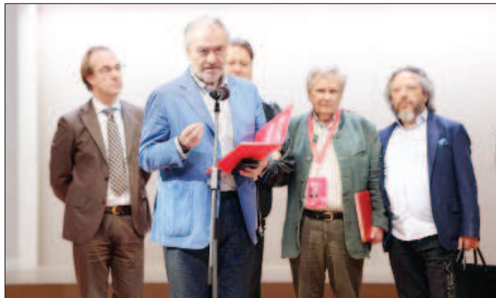
Валерий Гергиев обявява имената на лауреатите

Ето как оцени конкурса председателят на журито за диригенти Валерий Гергиев: "Нямахме остри противоре-