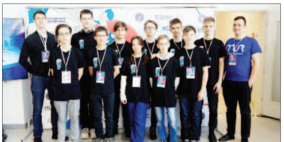
Отборът на учениците от Владивосток

Участниците подготвиха също технически отчет, постер и презентация пред жури.