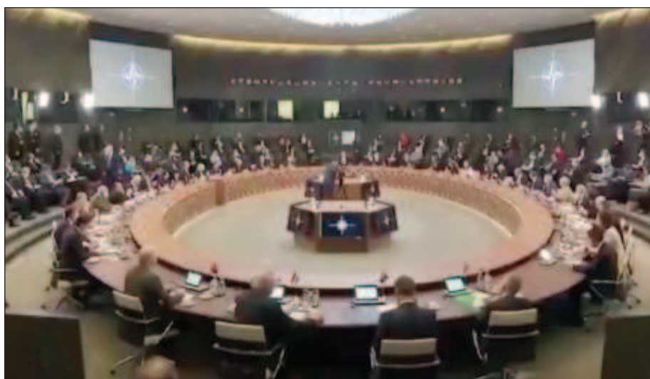
НАТО приема стратегическа концепция до 2030 г., главна съставна част от която е "руската заплаха"

Генералният секретар на алианса добави, че Турция е снела възраженията си за членството на Швеция и Финландия в НАТО и е подписано споразумение за сигурност. В същия ден готовността на Турция да подкрепи решението Финландия и Швеция да станат членки на алианса потвърдиха и от канцеларията на финландския президент Саули Ниинисте. Оттам отбелязва, че конкретните стъпки за член-