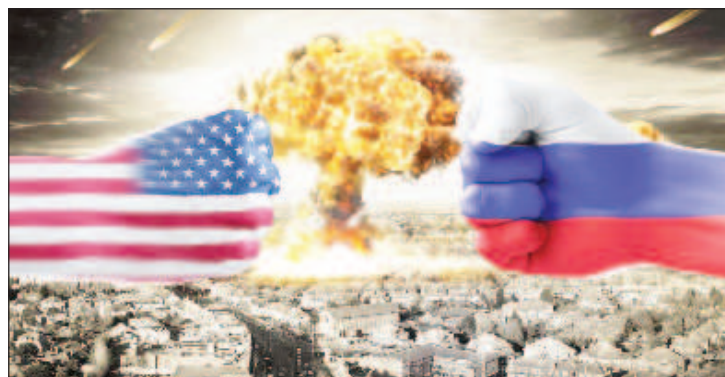
САЩ и НАТО рискуват да задълбочат конфликта с Русия заради Украйна

"Явявайки се лидер на блока, напоследък САЩ се стремят да превърнат НАТО в глобален политически инструмент", подчертава