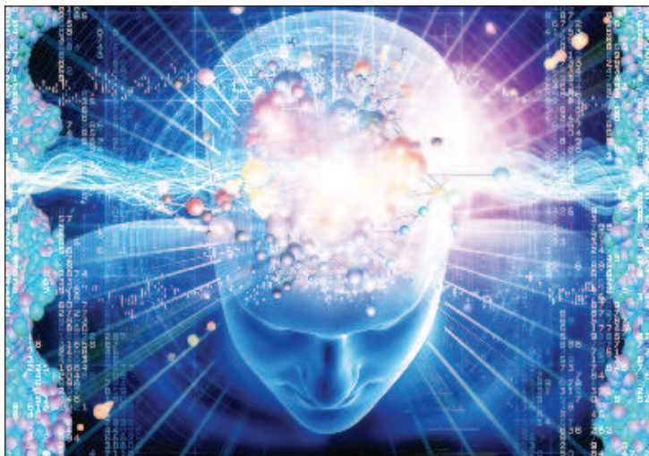
Бащата на медицината Хипократ твърдял, че човешкият организъм е единна структура, и подчертавал, че е много важно да се търси и отстранява причината за болестта, а не само нейните симптоми. А причините за нашите телесни болести много често се обясняват с психологическото ни неблагополучие

По думите му стресът, дългото нервно напрежение, душевните травми, скритата обида, страховете, конфликтите... Даже ако се опитваме да не ги забелязваме и да ги забравим, да ги изтласкаме от съзнанието си, тялото помни всичко. И ни го припомня. Бронхиалната астма възниква при попадане в дихателната система на едни или други алергени, може да се предизвика от инфекция, но и от емоционални фактори. Астмата ни засига, когато не можем да дишаме с пълни гърди от нещо или някого. Когато жизнената ни ситуация се подрежда така, че търсим и не намираме "отдушник", живеем в тежка, гнетяща атмосфера, не получаваме и глътка чист въздух... Това заболяване може да се задейства от неблагоприятната обстановка в работата, когато шефът не дава на подчинения си да диша. Или в дома са нахлули орда роднини, ко-