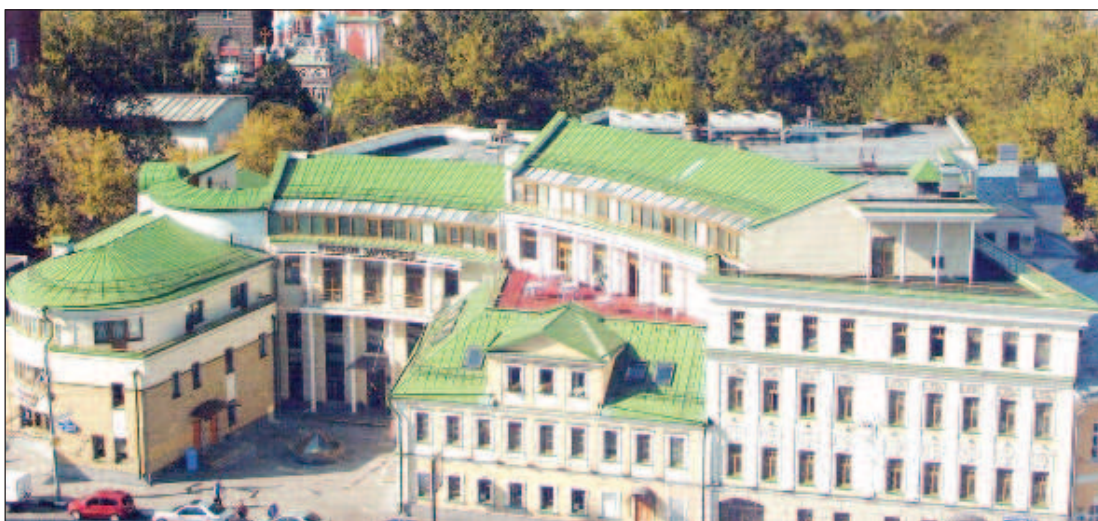
Комплекс Дома русского зарубежья

- Не было единой линии. Принимались сначала одни решения, потом - другие. Не было никакой логики.