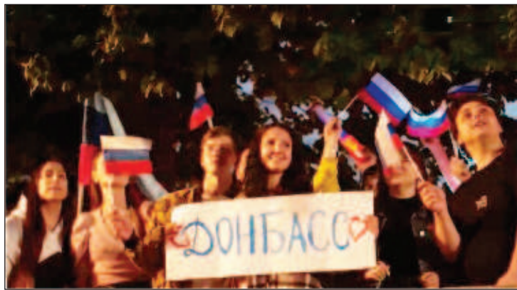
Абитуриенти от Донбас участваха в празника "Алые паруса" в Санкт Петербург

Педагози от няколко региона са изявили желание да заминат за Донбас за новата учебна година, съобщава в "Российская газета". Вече е оформена група учители доброволци от Новосибирска област. Учители от Ямал и Югра също са готови да потеглят към Донбас. В Приморието се е завършила групата експерти от регионалното министерство на образованието, които са били в Донбас за оказване на методическа помощ на местните педагози. От Министерството на образованието на Бурятия съобщават, че в училищата на републиката са изпратени предложения за оформяне на списъците с доброволци. Как именно ще се осъществява помощта за донбаските училища, за какъв период ще заминат педагозите от Русия, къде ще живеят, как ще се сменят, кой ще ги замени в техните училища - това са само част от организационните въпроси, които сега се решават. Но главното е разбирането, че трябва да се помогне на Донбас да организира образованието, да започне обучението на децата.