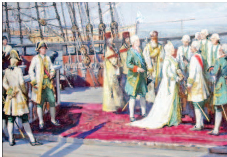
Екатерина II обозревает новый корабль