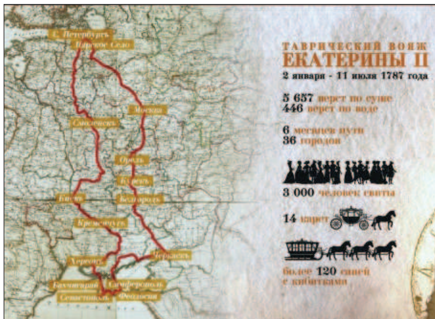
Маршрут путешествия императрицы по Новороссии и в Крыму

Хорошо, потому что Светлейший действительно работал не покладая рук. Еще до присоединения Крыма, в 1778 г., был основан Херсон. Потом - Екатеринослав. Потом - Севастополь. Строится Черноморский флот. В своем стремлении как можно быстрее заселить "сии пустынные земли" Потемкин решает на неслыханные шаги. Мало того, что разрешает