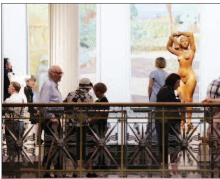
Най-голямата за 100 години изложба от колекциите на братя Морозови бе открита в Москва

Той поясни, че по-голямата част от изложбата е посветена на Иван Морозов, защото дейността му в областта на колекционирането се оказала по-мощна, от-