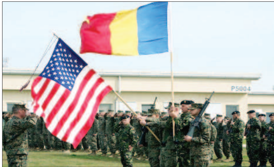
Посрещане на американски войски в Румъния

Конгресът на САЩ одобри да се отпуснат на Украйна близо 40 млрд. долара за военна и икономическа помощ и неотдавна президентът ве-