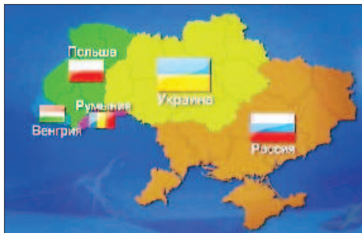
Така ще изглежда Украйна според някои от плановете на Запада

"Някои западни държави чакат Киев да падне и проблемът да се реши от само себе си", оплака се украинският външен министър Дмитрий Кулеба в интервю за украинските медии. Той отбеляза, че много негови западни колеги го питат колко още ще може Украйна да издържи, вместо да се интересуват с какво биха мог-