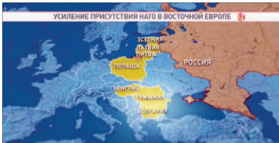
НАТО осваивает территории, прилегающие к жизненно важным районам России

История выбрала Россию в качестве силы, которая своим упорством и последовательностью в стремлении к правде и справедливости для всех ускорит переход к новому миропорядку. От нашей способности сыграть объединяющую роль и создать межцивилизационную "сеть" приоритетных партнеров на горизонте ближайшего десятилетия будут зависеть не только внешнеполитические позиции России, но и стабильность всей системы международных отношений.