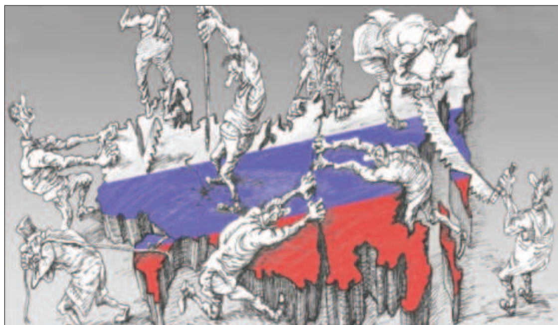
Цель противника - нанести России стратегическое поражение, устранив ее как геополитического конкурента

Российским интересам, безусловно, отвечает конструктивное взаимодействие со всеми соседями, в том числе в Евро-Атлантике. К этой цели нужно стремиться. Но не ценой одностороннего уступок - тем более уступок тем, кто открыто объявляет Россию главной угрозой, о чем говорится в Стратегической концепции НАТО, принятой в конце июня 2022 г. на саммите в Мадриде. В таких условиях сотрудничес-