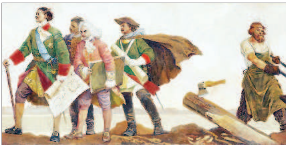
Петр Первый привнес "западничество" в самосознание правящего в России слоя

Оздоровляющий во многих смыслах отрыв от Запада формирует условия для более развернутого сотрудничества с глобальным Востоком и Югом еще и потому, что именно там сегодня - наибольшее число наших искренних единомышленников и друзей, что показала их взвешивая, сбалансированная реакция на российские действия по защите жителей Донбасса, ясно выраженный отказ присоединиться к ведомой США антироссийской коалиции и санкциям. Правда, не будем забывать, что СВО и все связанное с ней - отнюдь не главный пункт национальных и внешнеполитических повесток незападного мира. Оттуда события на Украине и вокруг нее