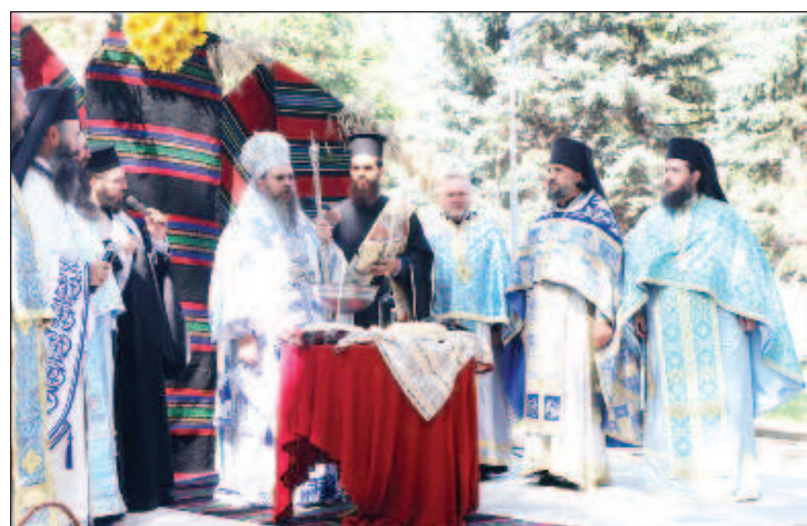
Белоградчикский Поликарп в сослужении протосингела

Божественную литургию возглавил vicарий Софийской митрополии епископ