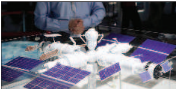
Ракетно-космическата корпорация "Енергия"

Напълно изработената по програмата за заместване на вноса версия на самолет МС-21 ще е готова в края на 2024 г., заяви вицепремиерът, министър на промишлеността и търговията Денис Мантуров . "До края на следващата година трябва да получим Sukhoi Superjet направи изцяло от руски материали, двигател и части без каквото и да било внос, а в края на 2024 г. същото трябва да се случи и със самолета МС-21", каза Мантуров за телевизионен канал "Россия 24". Сертифицирането на двата самолета трябва за приключи в края на 2023 г. Порано ръководителят на "Ростех" Сергей Чемезов заяви, че първите шест самолета МС-21 с руски двигател ПД-14 ще бъдат доставени на авиокомпаниите през 2024 г. От холдинга "Роселектроника", който влиза в "Ростех", съобщиха, че са приключили разработките на електронните компоненти за връзка на самолетите Sukhoi Superjet-100 и МС-21. Това позволява напълно да бъдат заменени американските изделия в състава на бордовата апаратура за радиовръзка.