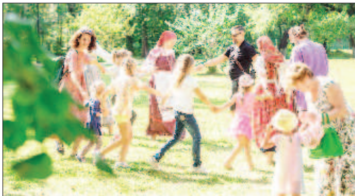
Семейният фестивал "Традиция" ще се проведе за седми път

В държавния историко-литературен музей-резерват "А. С. Пушкин" и парка "Захарово" на 20 август ще бъде открит седмият литературно-музикален фестивал "Традиция". Тази година той се провежда с подкрепата на Президентския фонд за културни инициативи, Министерството на културата и туризма на Московска област и администрацията на Одинцовски градски окръг в Московска област. Семейният фестивал "Традиция" обединява любители на изкуството без възрастови ограничения. Имението и паркът "Захарово" ще са пикник под открито небе, където в различни кътчета ще се състоят над 50 разнообразни събития - концерти, викторини, творчески срещи, майсторски класове, панаир.