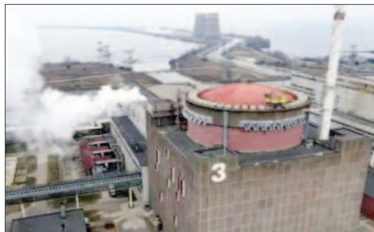
Един от обстрелите на Запорожката АЕЦ през тази седмица

жем да спасим Украйна, като обричаме на лишения американската икономика и собствената си армия", протестира сенаторът републиканец Ренд Пол.