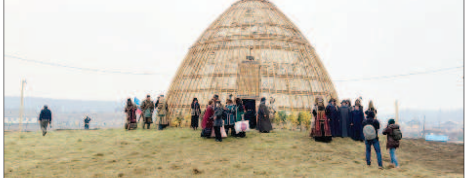
Якутски дом - урасу

Сутринта на 16 август във временния склад край Джанкой се взривиха боеприпаси. Пострадаха двама души. Освен това бе повредена жп линията, по която вървят влаковете откъм Керч през Джанкой към Симферопол, Севастопол и Евпатория. Освен евакуация на населението близо до взривените складове, 3422-мата пътници, намиращи се по това време във влаковете, са били прехвърлени по други маршрути. Надвечер движението е било възобновено.