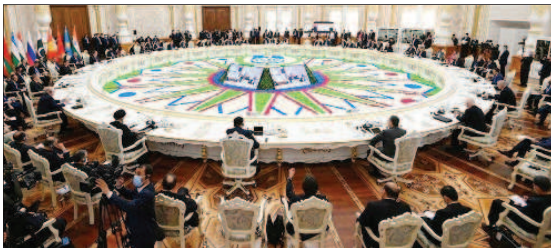
Процесс создания новых объединений получит мощное ускорение, доказательство этому - ШОС и БРИКС

сиейской армии противостоят формированиям киевского марионеточного режима, сделавшего ставку на ущербный радикал-национализм и безоглядную, унизиционную покорность иностранным хозяевам. Давние исторические враги - казаки и чеченцы, освободившие Лисичанск, называют себя братьями по оружию, а командира-чеченца награждают казачьим крестом. Здесь есть о чем задуматься. На поверхность выходит, что выбор в пользу межнационального единства и традиционных ценностей высвобождает созидательную