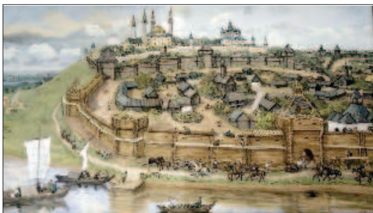
Казань - начало XVI века

ев особо ожесточенное сопротивление войскам Ивана Грозного оказали защитники главной городской мечети, во главе которых стоял имам Кул Шариф, происходивший из крымского рода сеидов - потомков Пророка Мухаммеда. Согласно одной из легенд, Иван Грозный был одновременно взбешен сопротивлением и поражен красотой мечети. А потому, обуянный яростью и завистью, велел не только снести мечеть, но и укорастить шедевр - выстроить в Москве точно такое же или похожее на него здание. Так, дескать, и появился в русской столице Храм Василия Блаженного.