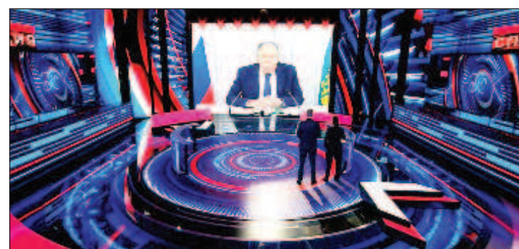
Сергей Лавров в студиото на програмата "60 минути"

Москва не може да допусне ситуация, при която киевският режим да създава постоянни заплахи за сигурността на Русия, включително и членството в НАТО и разполагане на въоръжение на територията на Украйна, заяви във вторник руският министър на външните работи Сергей Лавров в ефира на програмата "60 минути" по телевизионния канал "Россия-1".