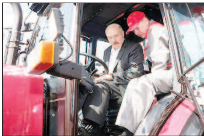
Лукашенко подарил Путину сертификат на трактор, на котором он работает

1 сентября президент Белоруссии Александр Лукашенко провел открытый урок со школьниками в собственной резиденции, где презентовал новое устройство. По его словам, создание ноутбука говорит о том, что у страны имеется огромный потенциал.