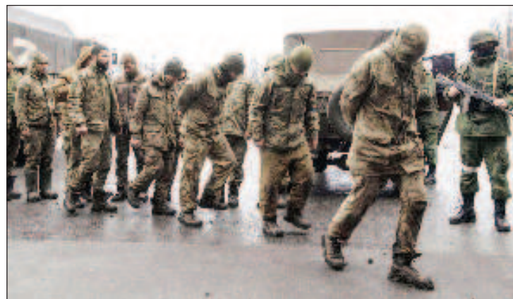
Украински военни, пленени в боевете в Донбас

Нека се върнем 4-5 месеца назад във времето, когато САЩ приеха пакет от помощ за Украйна по системата ленд-лайз. Още тогава бях уверен, че правилата на играта се променят. Не е възможно да се предоставя на Украйна военна помощ за десетки милиарди долари, да бъде пусната тя на стратегическа дълбочина до базите в Германия, Франция, Англия, Полша и къде ли не, без да се разширят границите на война-