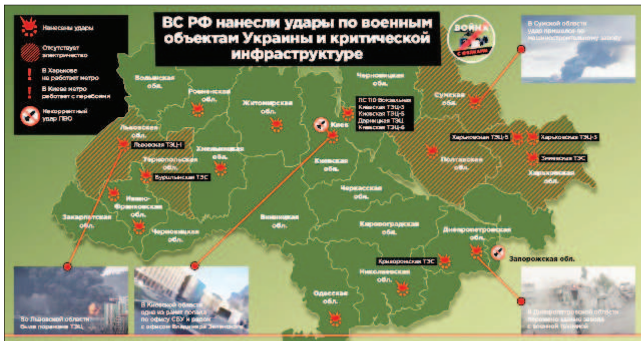
Карта на нанесените ракетни удари на 10 октомври

От руското Министерство на отбраната отчетоха, че всички определени обекти и цели за масирания ракетен