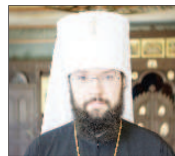
Митрополит Волоколамский Антоний

Во время интервью также был затронут вопрос, касающийся самоуправляемой Латвийской Православной Церкви Московского Патриархата. Требование латвийского государства к Московскому Патриархату о предоставлении автокефалии Латвийской Церкви, по мне-