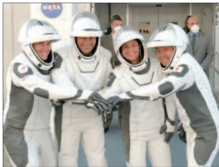
В экипаже с Анной Кикиной - японец из JAXA Коити Ваката, а также астронавты NASA Джош Кассада и Николь Манн перед полетом. Члены экипажа уже встретились с родными, и направились на историческую стартовую площадку LC-39A Космического центра им. Кеннеди на специально подготовленных автомобилях Tesla Model X