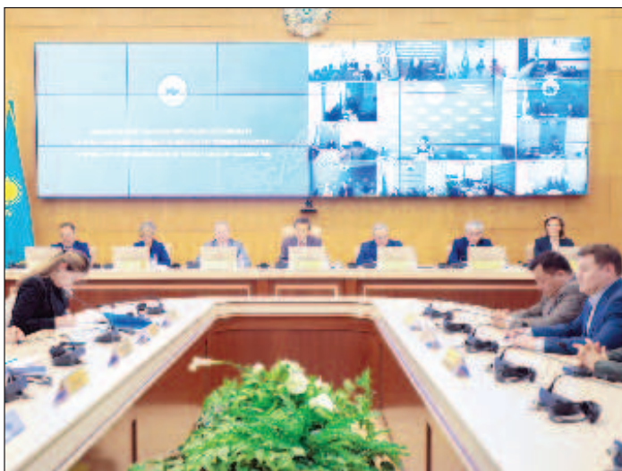
ЦИК постановила, что Токаев соответствует всем требованиям, предъявленным конституцией и законом "О выборах в Республике Казахстан"

В конце прошлой недели партия "Ак Жол" ("Светлый путь") выдвинула действующего главу Казахстана в