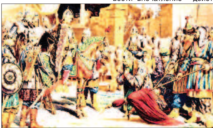
Иван Грозный и его войско входят в крепость

Зато известно другое. Больше всего минаретов всегда было у главного здания