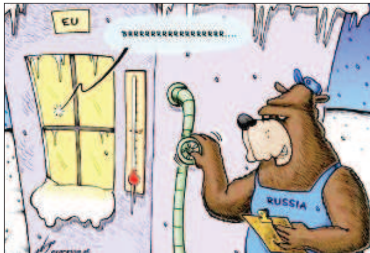
"Кому е нужна такава демокрация".

По данни на Евростат в Евростат се наблюдава рекордна за последните десетилетия инфлация - над 9%. В отделни страни на ЕС обаче положението е катастрофално. Сред тях са най-върлите врагове на Русия. Сега те сърбат попарата на