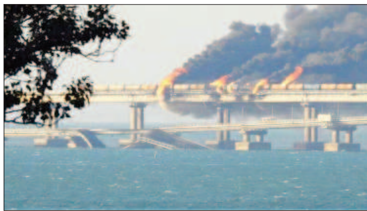
Моментът на взрива на Кримския мост

Както са установили руските контраразузнавачи, от 29 септември до 3 октомври товарът е бил освободен от митницата по правилата на организацията Евразийско икономическо сътрудничество (ЕврАЗИС) в Ереван на терминала "Трянсальянс" и там е станала подмяната на документите. След което негов изпращач вече е Дружеството с ограничена отговорност "ГУ АР ДЖИ ГРУП" (Република Армения, гр. Алаверди), а получател - Дружеството с ограничена отговорност "Лидер" (Москва). По-нататък с регистрирания в Грузия камион DAF на 4 октомври 2022 г. товарът е пресякъл руско-грузинската граница