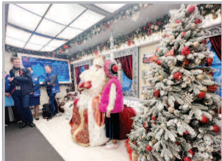
РЖД представи новия влак на Дядо Мраз на Ленинградската зала в Москва. На 22 октомври влакът ще потегли на 85-дневно новогодишно пътешествие по цяла Русия от Велики Устюг и ще се завърне на 15 януари. Тази година влакът ще стигне до крайната точка на руските железници - до гара Тихоокеанска, и ще измине 33 хил. км. В новия влак е оборудван специален вагон, където Дядо Мраз ще може да приветства децата и по техническите спирки. Като се имат предвид и малките гары, влакът ще има до 200 спирки. В състава има приемна, вагон за игри, два вагон-ресторанта и вагон лавка със сувенири

По-рано от ФСС съобщиха, че е бил предотвратен опит за терористичен акт в Брянск. Според версията на следствието гражданин на Украйна по задача, поставена от специалните служби, е подготвял взрив на един от транспортно-логистичните терминали.