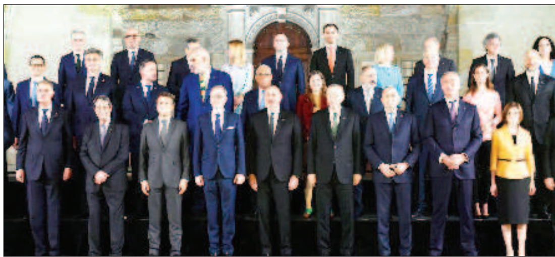
В Прага лидерите на някои европейски страни си направиха снимка на поредния ялов антируски форум

ропейския съюз, който поставя общоевропейското пространство под реалната заплаха "от дългосрочна фрагментация и дестабилизация". Според нея състоялата се в Прага среща е потвърдила нагледно идеологизирания и конфронтационен характер на този формат. "Набива се в очите липсата на позитивен дневен ред и на възможности за решаване на проблемни въпроси от професионална гледна точка. Девизът може да е "Дружим срещу Русия" или "Хайде да се събе-