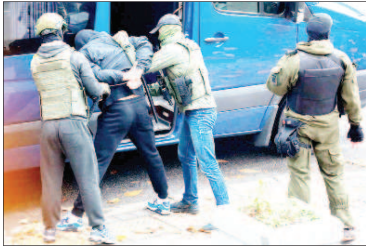
Задержанные дают признательные показания и сотрудничают со следствием

По словам замминистра МВД Белоруссии Геннадия Казакевича, белорусские правоохранители называют произошедшее проектом западных спецслужб. "Что характерно: в последнее вре-