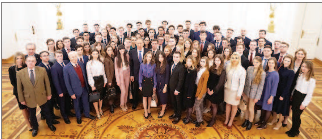
Сергей Лавров на срещата с випускниците на висши учебни заведения, за първи път приети на дипломатическа служба

Това заяви във вторник министърът на външните работи на Руската федерация Сергей Лавров на среща с випускниците на висши учебни заведения, за първи път приети на дипломатическа служба. "Няма смисъл и желание да запазваме предишното си присъствие в западните страни. Нашите хора работят в нечовешки условия. Създават им постоянни проблеми, заплахи за физическо нападение. Главното е, че там няма работа, откакто Европа реши да се затвори за нас и да прекрати всякакво икономическо сътрудничество. Насила не можеш да бъдеш мил", отбеляза Лавров.