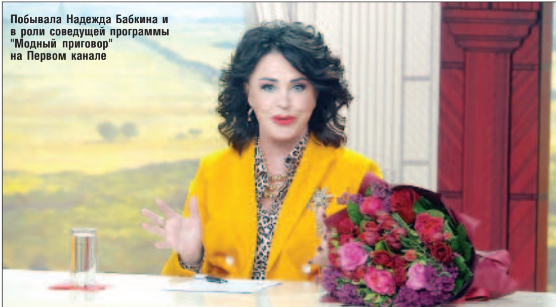
Побывала Надежда Бабкина и в роли соведущей программы "Модный приговор" на Первом канале

- Она ведь связана с вокалом. Как говорили в народе, "песню нужно играть", а не просто исполнять. Если так, значит, ты должен представить некий образ. В театре у меня их целая галерея. Я участвую в спектаклях по Куприну и Шукшину, Чехову и Зоценко... Однако мои любимые роли - гогаевские Солоха и Императрица из спектакля