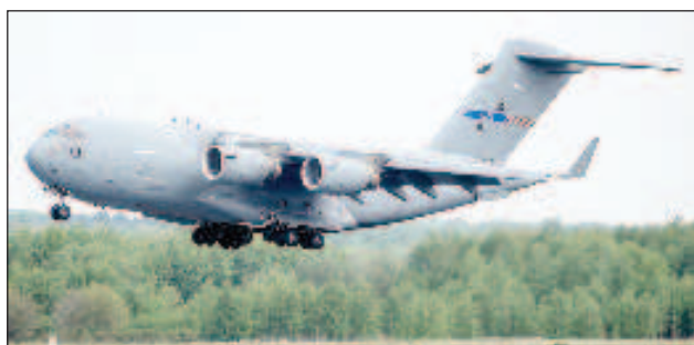
Летището в полския град Жешов се оказа сборен пункт за изпращане на оръжия и военна техника в Украйна

Отбелязва се, че "Боинг-747" може да превозва до 120 тона то-