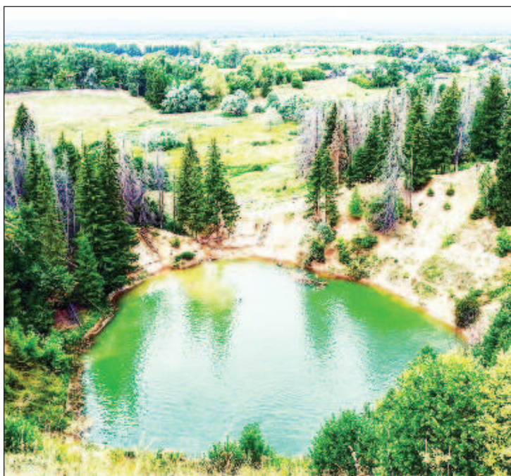
Республика Марий Эл место с особым колоритом. Там располагаются значительные бальнеологические ресурсы, насчитывается более 1000 рек, ручьев и озер

В течение длительного периода эта территория была ареной жестокой борьбы между Западом и Востоком, Европой и Азией, христианством и исламом, славянами и тюрками. Поэтому марийцы попадали в зависимость то от Хазарского Каганата, то от Волжской Булгарии, Золотой Орды, Казанского ханства. В середине XVI века Марийский край был присоединен к Русскому государству и с этого