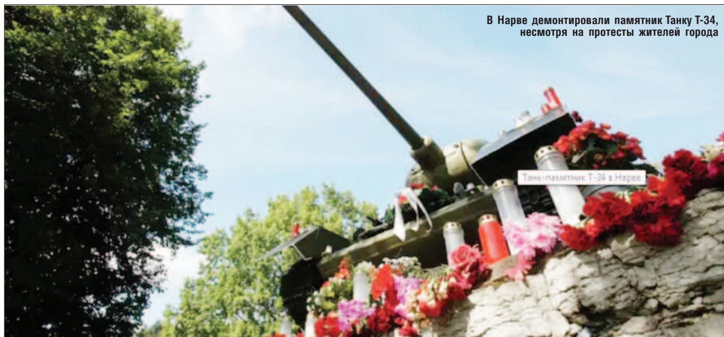
В Нарве демонтировали памятник Танку Т-34, несмотря на протесты жителей города

лько говорят ЕС! В итоге Европейский Союз продолжает ужесточать санкции против российского государства в ответ на проводимую Россией, вот уже полгода, военную операцию против Украины. В Эстонии в ночь на 19 сентября вступил в силу запрет на въезд в страну для граждан России. Это касается тех россиян, которые имеют визы, выданные в Эстонии, а также визы, выданные в других странах ЕС. Сейм Латвии утвердил поправки к иммиграционному закону, ужесточающие условия продления видов на жительство для граждан РФ, а также вводящие фактический запрет на получение долгосрочных рабочих виз, сообщается на сайте законодательного органа. Согласно принятым поправкам, граждане РФ больше не смогут получать долгосрочные визы (сроком до 1 года) для работы в Латвии, равно как и трудоустроившись в стране. Эта норма