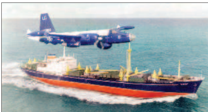
Самолет ВМС США преследует советское грузовое судно во время Карибского кризиса