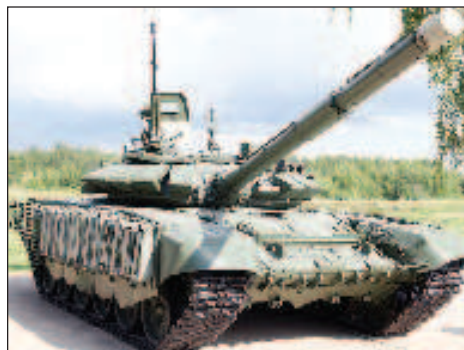
Руските гвардейци попълниха бойния си строй с още един украински танк

Отбелязва се, че руските гвардейци са пленили танка на територията на воинска част от Въоръжените сили на Украйна. Бяха отстранени повредите по танка и заменени някои системи. За екипаж бяха подбрани военнотранспортни от "Росгвардия", преминали воинската си служба в танковите войски. Танкът вече се изпол-