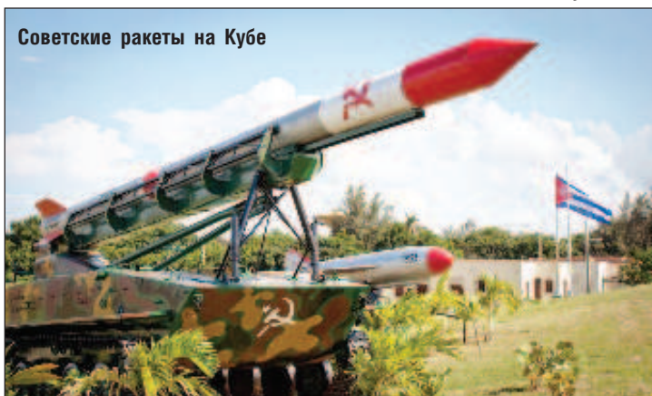
Советские ракеты на Кубе

Позднее, директор Архива национальной безопасности США Томас Блэнтон дополнил его слова, рассказав, что "парня, который спас мир, звали Василий Архипов". Его к тому моменту уже не было в живых - после возвращения из плавания в октябре 1962 г. Архипов продолжил службу в ВМФ. В 1981 г. ему было присвоено звание вице-адмирала, он вышел в запас. В 1998 г., в возрасте 72 лет, Василий Архипов скончался в подмосковной Купавне.