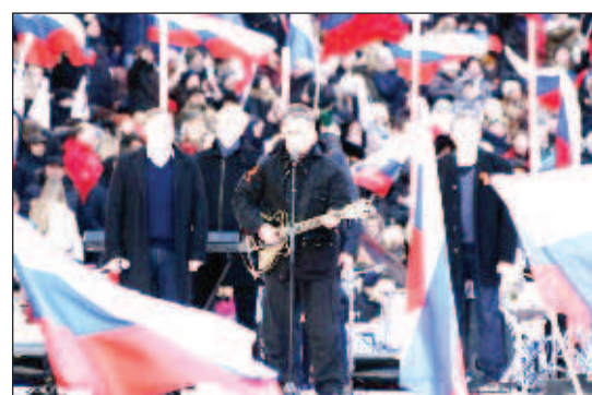
Николай Расторгуев на митинга концерт в подкрепа на присъединяването към Русия на ЛНР, ДНР, Херсонска и Запорожка област

"Да, чух, че съм в списъка. За мен това беше голяма чест като признание за това, което съм направил за страната, усещането е прекрасно. Мнозина вече ме поздравиха, достойни хора. Това е чудесно", каза Расторгуев в ефира на Първи канал. Той добави, че санкциите по никакъв начин няма да повлияят на всекидневието му. "Не