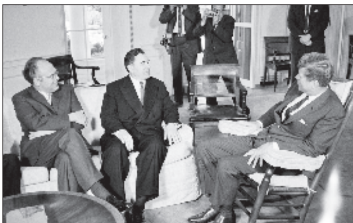
Президент США Джон Кеннеди (справа) с министром иностранных дел СССР Андреем Громыко и послом СССР в США Анатолием Добрыниным во время встречи в Белом доме, в октябре 1962 г.

Со своей стороны СССР предлагал США дать обязательство не вторгаться на Кубу - в ответ на него Советский Союз готов был забрать с Кубы свои ракеты. Это был первый шаг на пути возвращения мира. Но с первых дней эскалации кризиса вместе с военно-морской блокадой над Кубой участились полеты американских самолетов-разведчиков. В ночь на 27 октября один из них был сбит. Так для всего мира наступила "черная суббота". От ядерной войны теперь планету отделяли двое суток - именно через этот срок президент Кеннеди решил начать бомбардировку советских баз. В первый же