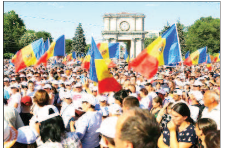
Лидер оппозиционной партии "Шор" Илан Шор обвинил президента страны Майю Санду в диктатуре и нарушении конституции

Политик отметил, что у граждан есть право протестовать, акция протеста была согласована с властями. "Когда президент нарушает конституцию и закон - закона ни для кого в стране нет", - подчеркнул оппозиционер. Он добавил, что жалоба в генпрокуратуру была подана, а демонстрации продолжатся "несмотря ни на что".