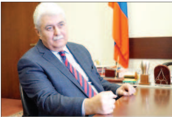
Зам.-секретарят на Съвета за сигурност на РФ Олег Храмов

- На първо място западните стратегии организират последователно въздействие върху учреждения и организации от системата на образованието, органите на държавната власт, върху културни дейци, представители на медиите, разчитайки на неустойчивата младежка среда. Целенасоченото влияние се организира по различни начини, включително и чрез формиране на "пета колона" с привличане на опозиционно настроени бизнесмени, артисти, блогъри, политици и различни лесно управляеми "малцинства". Западът с всички сили се стреми да спре хода на историята. Затова едно от направленията на деструктивното въздействие е дискредитиране на Рус-