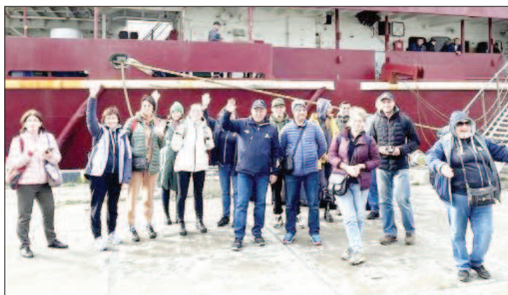
Групата лекари доброволци на остров Шикотан

На 16 октомври на остров Шикотан пристигна група лекари от експедицията "Рубежи России". След тригодишно прекъсване заради пандемията от ковид, тази година тя възобнови дейността си. Петнайсетте висококвалифицирани лекари доброволци от Москва, Санкт Петербург, Смоленск, Хабаровск и Южносахалинск дойдоха на Шикотан благодарение на фонда "Андрей Първозванни", който тази година отбелязва своята 30-годишнина, както и на компанията "Гидрострой".