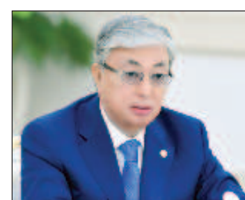
И Токаев се оказва враг на Украйна

На този фон дойде информацията, че украинският президент Владимир Зеленски е снел от длъжността посланик в Казахстан Пьотр Врубльовски. В края на август представителят на руското Министерство на външните работи Мария Захарова публикува интервю на Врубльовски пред блогъра Диас Суазиров, в което посланикът за-