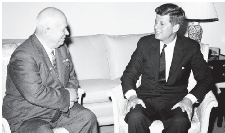
Хрущев и Кеннеди - два лидера, которые сумели предотвратить Третью мировую войну

22 октября в обращении к нации Кеннеди заявил о том, что на Кубе находятся советские ракеты, и потребовал от СССР немедленно их удалить, угрожая в противном случае применением силы. В этот же день было объявлено о том, что США начинают военно-морскую блокаду Кубы. СССР попросил срочного созыва Совета Безопасности ООН - он собрался 24 октября. Тогда же Никита Хрущев направил Кеннеди ответ, который начинался словами: "Представьте себе, господин Президент, что мы поставили бы Вам те ультимативные условия, которые Вы поставили нам своей акцией. Как бы Вы реагировали на это? Думаю, что Вы возмутились бы таким шагом с нашей стороны. И это было бы нам понятно". СССР отказался выполнить поставленный США ультиматум: "Это означало бы рукопожатие в своих отношениях с другими странами не разумом, а по-