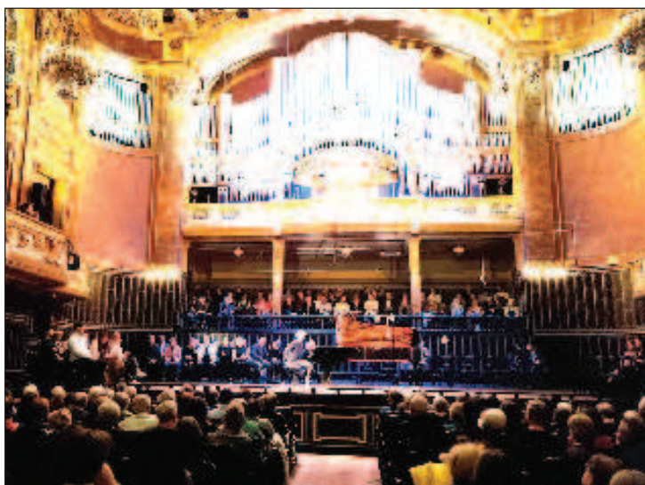
С концерт, посветен на Александър Скрябин, в Унгария бе открит фестивалът на руската музика