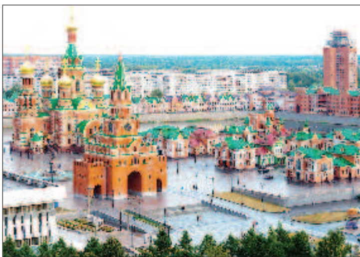
Йошкар-Ола: набережная как в Брюгге, башня как в Москве! Если в центре Йошкар-Олы вы вдруг почувствовали себя как в Москве на Красной площади - верьте своим глазам. Перед вами не мираж, а Благовещенская башня, одна из главных достопримечательностей марийской столицы и одновременно почти близнец Спасской башни Московского кремля. Разница в размерах есть, но небольшая: Спасская башня 71 м высотой, Благовещенская - 55 м. А в остальном - не отличить. Как и в Москве, на Благовещенской башне часы с циферблатами на все четыре стороны. Точность йошкар-олинских курантов выверяется по спутнику, а их бой слышен на три километра. А напротив, через реку Малая Кокшага другой мир - набережная Брюгге с домами во фламандском стиле. В центре есть копии архитектуры в русском стиле - Архангельская слобода и венецианская площадь Сан-Марко. Неоспоримый факт - такого больше нет нигде в России. Кроме того, в столице есть десятки необычных памятников - один из которых Йошкин кот - йошкар-олинцы приватизировали известный мем

номная Советская Социалистическая Республика со столицей в Йошкар-Оле. Республика состояла из 14 районов и управлялась Верховным Советом. В 1939 г. было начато строительство марийского машиностроительного завода. В 1992 году республика обрела современное название Марий Эл.