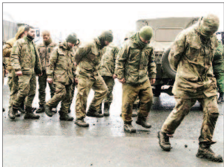
Пленные разведчики 92-й отдельной механизированной бригады Вооруженных сил Украины

Ранее пресс-секретарь Белого дома Карин Жан-Пьер сообщила, что США призвали американцев не ездить на Украину с целью участия в боевых действиях. Она добавила, что США признательны Киеву за включение всех военнопленных, независимо от их национальности, в свои переговоры, и в Штатах с нетерпением ждут воссоединения этих американских граждан со своими семьями.