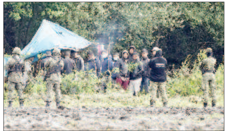
Amnesty International утверждает, что латвийские власти удерживали мигрантов и беженцев с белорусской границы, включая детей, в лесах, где подвергали их избиениям

Власти Латвии уличили в нарушении прав беженцев и мигрантов на границе с Белоруссией. Об этом сообщается в докладе правозащитной организации Amnesty International.