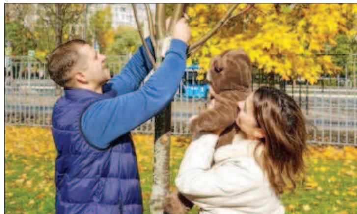
Московчани масово се включиха в акцията по засаждане на дървета