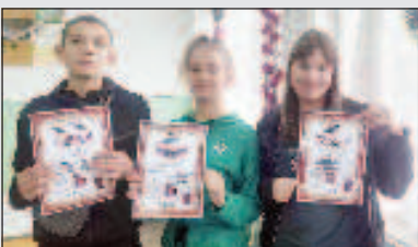
"Волшебный мир сказки" Стр. 5