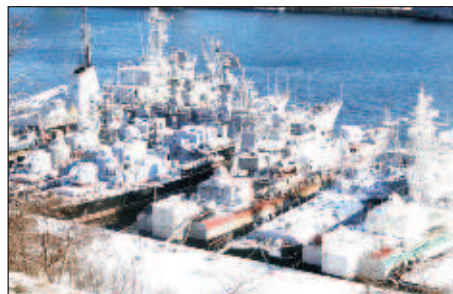
Корабите на руския Черноморски флот

Освен това наблюдателят отбелязва, че настъпването на зимата ще забави не само процеса на бойните действия на суша, но това ще се забележи и на море. Черноморският флот, смята Сътън, ще снижи своята активност, но причината не е само зимата. Руският ВМФ може преднамерено да не подлага на опасност своите кораби в интерес на бъдещи