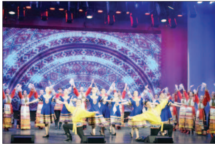
С пищен концерт на 19 декември в Брянск закриха Годината на културното наследство на народите на Русия

През 2022 г. за първи път е проведен Детски културен форум и Фестивал на детските национални колективи. Чрез телемост фестивалът "Вместе мы - Россия!" е съединил различни кътчета от цялата страна. През годината в този проект са се състояли 284 концерта в над 250 руски града. До края на годината са планирани още 16 мероприятия. В проекта активно се е включил и ансамбълът за песни и танци "Донбас", който е изнесъл концерти в 56 града.