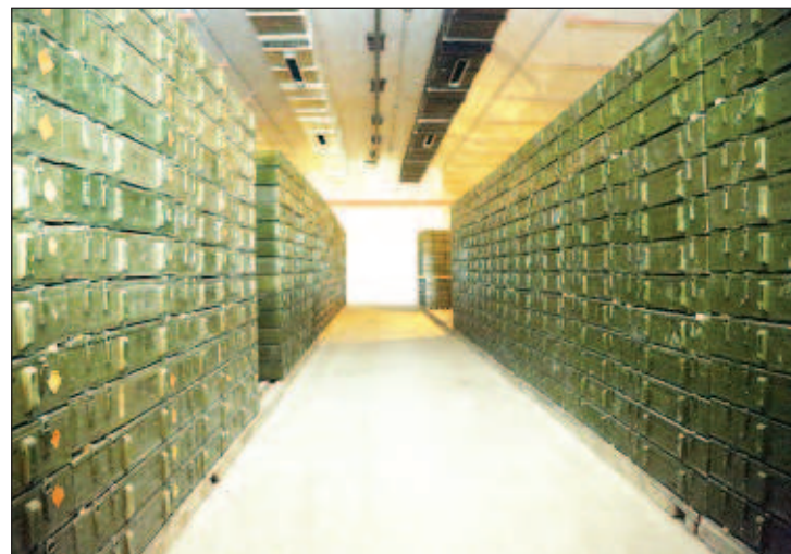
Част от боеприпасите в най-големия в Европа оръжен склад в Приднестровието

Приднестровието, 60% от жителите на което са руснаци и украинци, се обяви