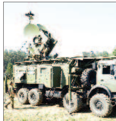
Мобилният пеленгатор "Боршчевик" ще открива творенията на Мъск в Украйна

тоположението си. Както е известно, украинската армия използва активно интернет, предоставен от Илон Мъск. Руски бойци нееднократно са взимали като трофеи терминали на "Старлинк" в освободените територии и напуснатите позиции на военнослужещите от Въоръжените сили на Украйна.