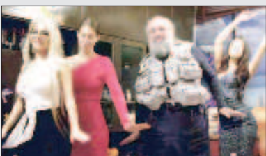
Анатолий Вассерман: Запад выбрал неверный путь Стр. 6