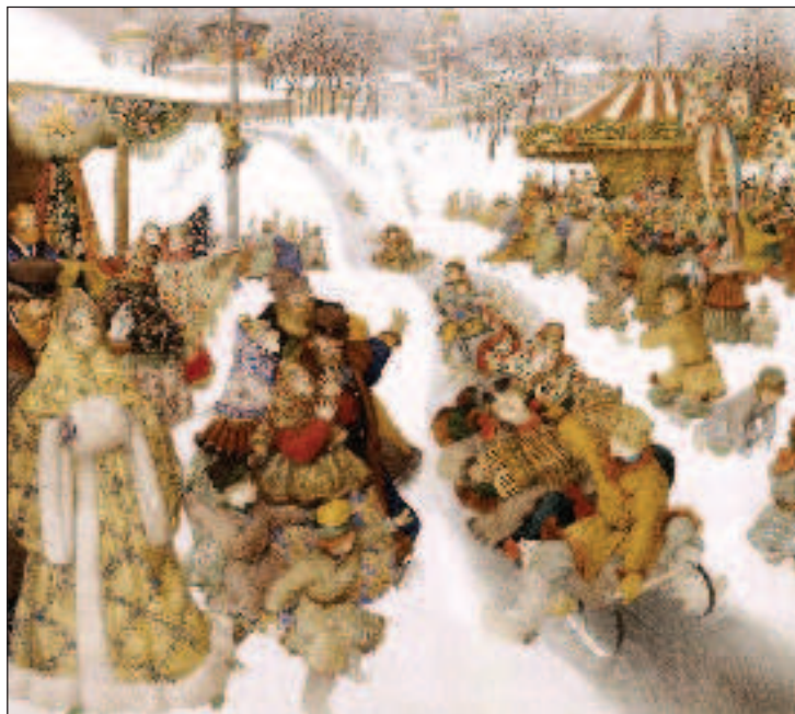
Народные гуляния во время Святки

Новый год в отличие от Рождества долго считался тихим и домашним праздником, на который приглашали родственников. Молодежь гадала, пожилые играли в карты, а в полночь заканчивался праздничный ужин, все поднимали тост и желали друг другу счастья в Новом году.