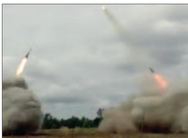
В "черния петък" за украинската ПВО бяха решени едновременно няколко задачи с перспективни последици за изхода на сраженията

Как се постигна този успех? Съдейки по всичко, е осъществена операция за разкриване на позициите на ПВО на Украйна и въвеждане в заблуда на техните разчети. Съобщава се, че в