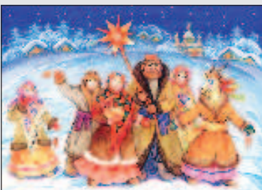
Праздники - от Рождества до Крещения Стр. 7