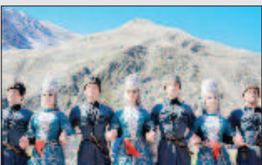
Эльбрус - жемчужина Кабардино-Балкарии Стр. 10