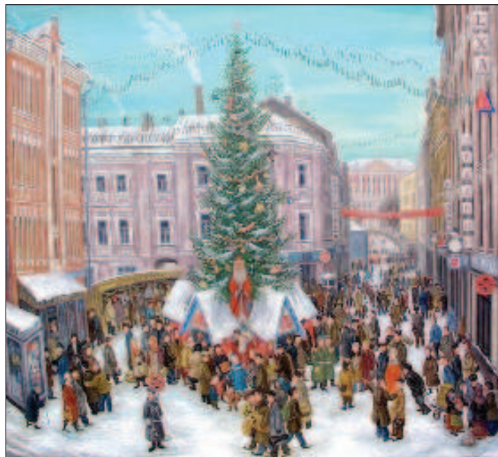
Рождественский базар в Столешниковом переулке в Москве

жать зеленую красавицу вновь вернулся, а в больших городах перед Рождеством открывались елочные базары. Первая официальная елка в России была устроена Николаем I по просьбе его жены, императрицы Александры Федоровны, урожденной прусской принцессы Шарлотты. И все таки до 1840-х годов обычай