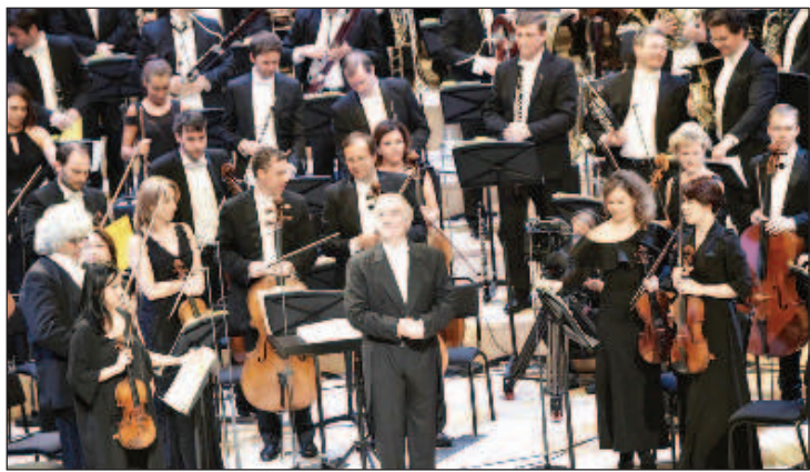
Симфоничният оркестър на Мариинския театър с диригент Валерий Гергиев

Оперната трупа и оркестърът на Мариинския театър под управлението на народния артист на Русия Валерий Гергиев потеглиха на новогодишни гастроли във Владикавказ и Сочи. На 20 и 21 декември в рамките на направлението "Ведущие театры" на Министерството на културата на РФ трупата на Мариинския театър изнесе концерти във Владикавказ на сцената на филиала на Мариинския театър в Република Северна Осетия - Алания, бяха представени премиерите на сезона - фрагменти от операта на Моцарт "Вълшебната флейта" в полусценично изпълнение и постановката на операта "Отело" на Верди. В полусценична версия бе показана и операта на Чайковски "Йоланта", съобщиха от пресслужбата на театъра.