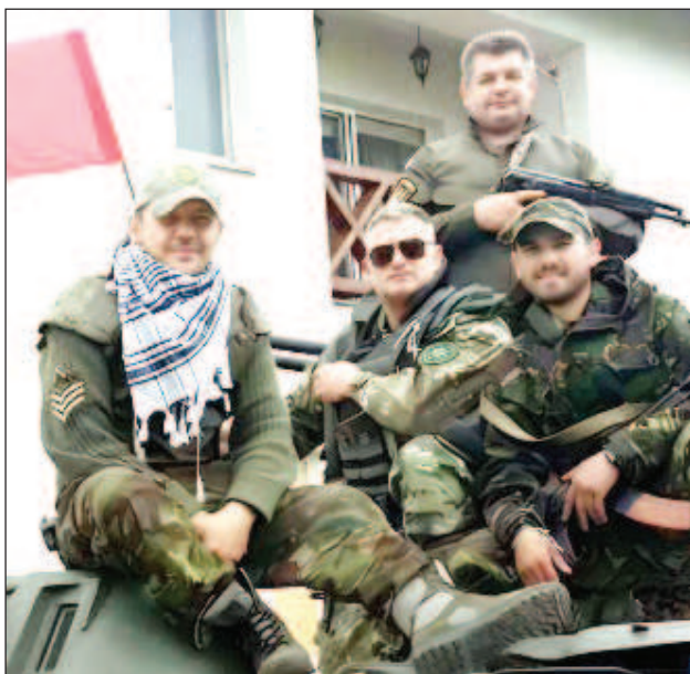
Полски наемници в Украйна