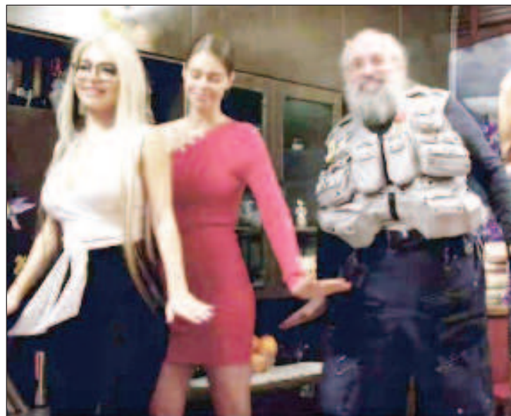
В 2019 году вновь проявился юмористический дар главного интеллектуала страны. Он согласился на съемки в клипе "Танцуй под Бузову" и даже изобразил несколько оригинальных па в ролике Ольги Бузовой в компании трех прелестниц

- Бронезилет бы мне точно пригодился. Тот жилет, что я ношу, содержит очень много инструментов на всякие непредвиденные случаи, но в рамках мирной жизни. К слову, мой стиль жизни слегка изменился, и я все реже выхожу из дома в жилете. Свободного времени