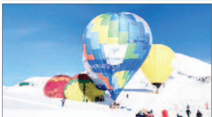
Петте аеростата преди полета