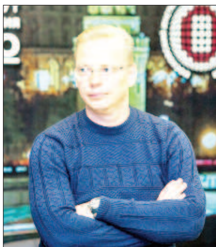
Эрнест Мацкявичюс - российский тележурналист, ведущий телепрограммы "Вести" на канале "Россия"

Кроме того, веду тренинги и дописываю книгу об искусстве коммуникации, где собраны лайфхаки, в том числе из арсенала спецслужб, позволяющие человеку увеличить уровень влияния и личной эффективности.