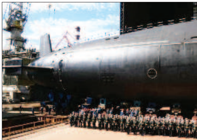
Церемонията по спускането на вода на най-новата атомна подводница "Генералисимус Суворов" от проекта "Борей-А"

"Комплексът РС-28 "Сармат" ще замени ракетите Р-36 "Воевода". Започва серийното производство на изстребителите от пето поколение Су-57, ударните безпилотни летателни апарати "Орион". Безпи-