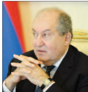
Бывший президент Армении Армен Саркисян

Президент Армении Армен Саркисян официально ушел в отставку, пишет "Коммерсантъ".