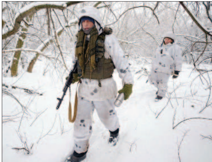
ЦРУ обучает для Украины организаторов партизанского движения

Пасечник отметил, что Яворовский полигон во Львовской области, хоть и числится украинским, давно передан в управление иностранных инструкторов.