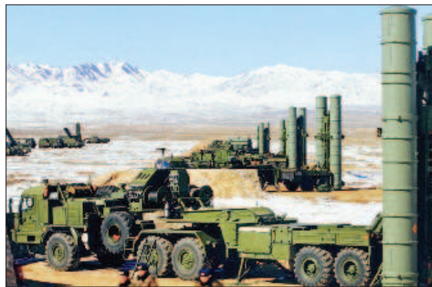
В руската армия вече получават зенитно-ракетните системи С-500 "Прометей"

"Става дума не само за техника, предназначена за бойни действия, но и за машини, оборудване за работа и живот в арктическата зона: екипировка, хранителни средства, развитие на военната инфраструктура. Главното е да не от-