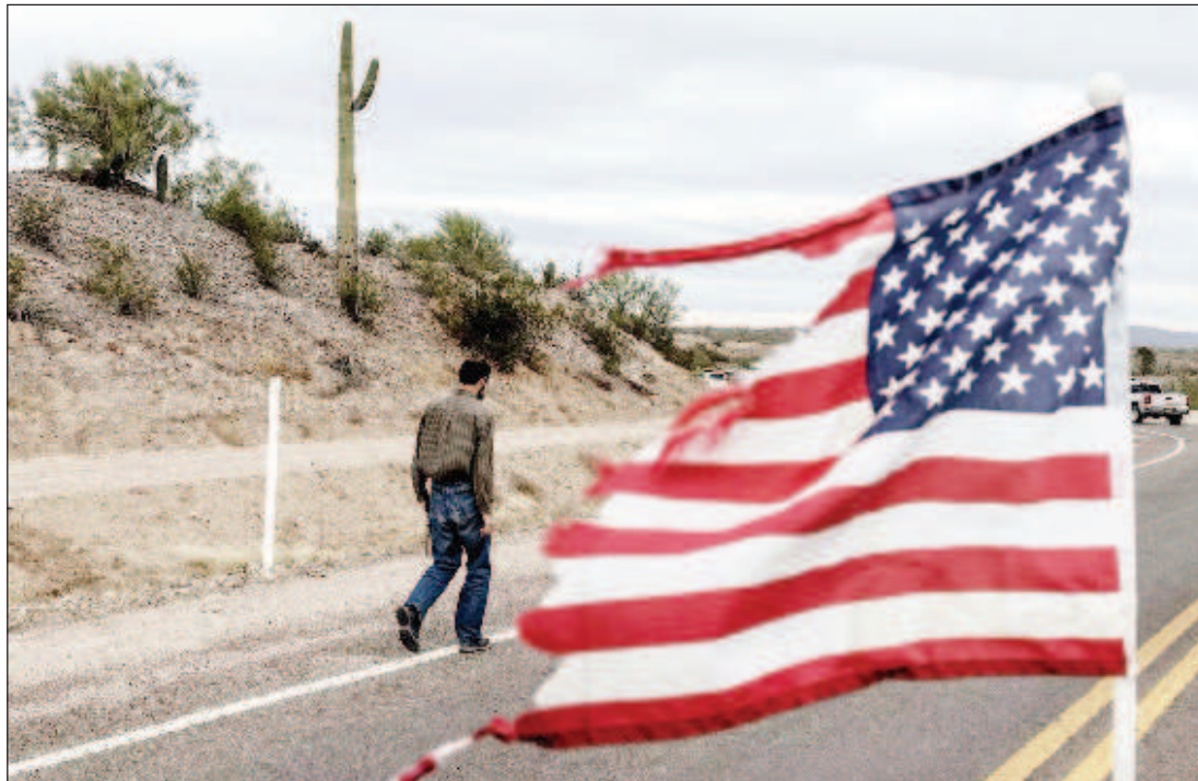
Опърпаното американско знаме в Тексас край границата с Мексико

По време на студената война САЩ подписаха множество договори за "взаим-