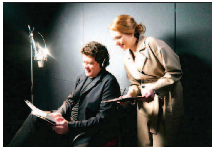
Пианистът Денис Мацуев по време на снимките на "Живые мемории"