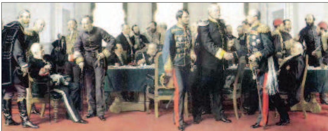
Представители западных стран на Берлинском конгрессе - Германия, Австро-Венгрия, Англия и Франция поздравляют друг друга за то, что успели расчленив Болгарию