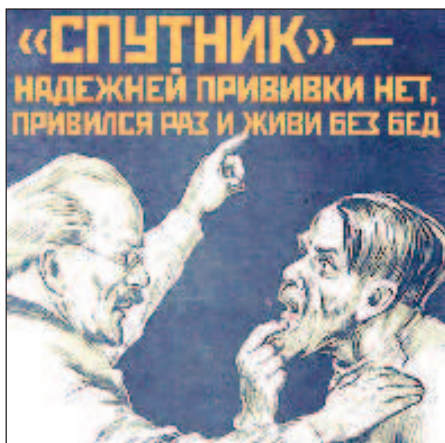
Плакат за ваксинация с ваксината "Спутник" в стила на старите агитационни плакати

мемории" са руски музеи и университети - от Крим до Владивосток. Те са дали възможност на авторите на проекта да видят с очите си местата, където са живели и творили героите от киноалманаха, да се запознаят с архивите.