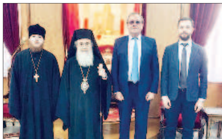
В центре Блаженнейший Патриарх Иерусалимский Феофил III и посол РФ в Израиле А.Д. Викторов

31 января Чрезвычайный и Полномочный посол Российской Федерации в Государстве Израиль А.Д. Викторов был принят Блаженнейшим Патриархом Иерусалимским Феофилом III, сообщил сайт Патриархия.ru.