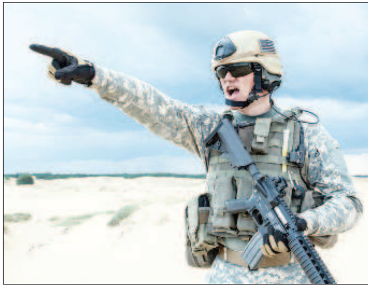
Американски военен в Украйна сочи границата с донбаските републики

Републиканците просто са длъжни да кажат на Байдън, че заявленията му за някакви сериозни заплахи за сигурността на Америка, които се надигат на украинската граница, са абсолютно лъжовни и всъщност той самият поставя под заплаха собствените ни граници. Такова мнение споделят не само републиканците. То намира подкрепа у хора от целия политически спектър. Крайно време е Байдън да разбере, че ако Америка трябва да хвърля средства и да пролива кръв за нечии граници, това трябва да са нейните граници. От тях трябва и да започне.