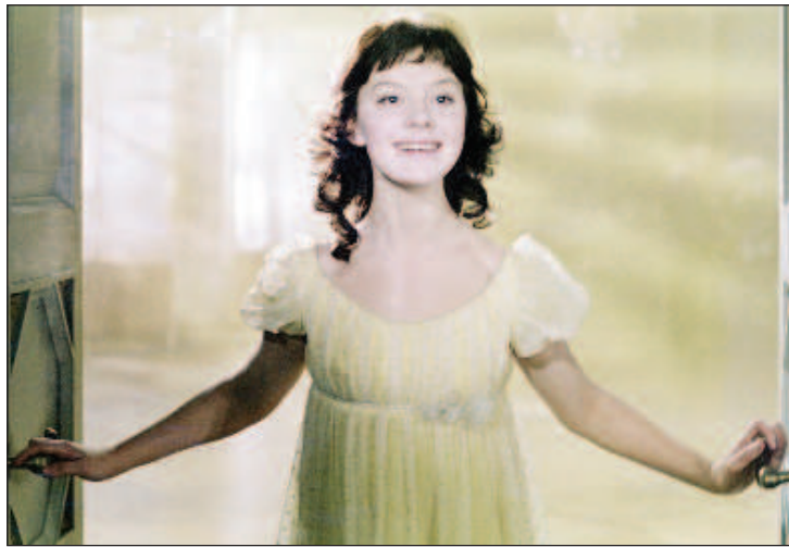
В роли Наташи Ростовы в фильме "Война и мир". 1968 год.

- Вы начали сниматься в 18 лет, как помнят прежде всего как Наташу Ростову. Потом что-то делали,