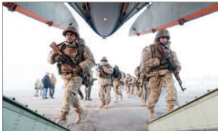
Учения имеют сугубо оборонительный характер и являются внутренним делом двух стран

В ходе второго этапа, с 10 по 20 февраля, будет проведено совместное учение "Союзная решимость-2022", в рамках которого будут отработаны вопросы пресечения и отражения внешней агрессии, а также противодействия терроризму.