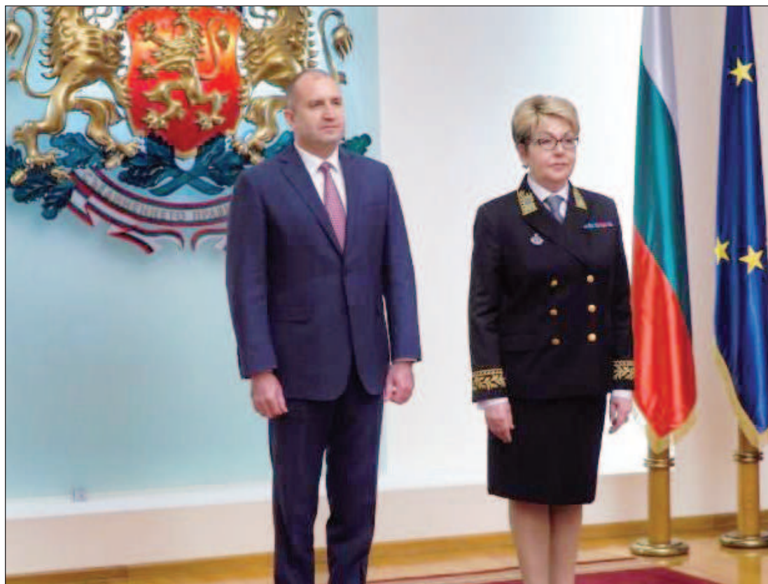
На 16 март 2021 г. посланик Елеонора Митрофанова връчи акредитивните си писма на президента на България Румен Радев. За тази почти една година тя успя да обиколи градове и села в цяла България, да се срещне с хора с различни професии и възраст и лично да се убеди, че българите тачат и обичат Русия

- Един въпрос, който е свързан с преговори, които предстоят между България и "Газпром" - за сключването на нов договор, старият изтича в края на тази година. При какви условия ще преговаряме с "Газпром" зависи ли от реакцията на България в момента по кризата с Украйна? Колкото по-приятелски настроена към Русия е България, толкова по-благоприятни икономически условия ще имаме или е спекулативно да се прави такава връзка?