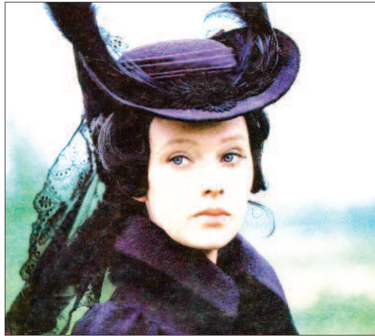
В главной роли в фильме "Юлия Вревская" (реж. Никола Корабов) Картина о драматической судьбе замечательной русской женщины - графини Юлии Петровны Вревской вышла в 1977 году. События ленты происходят в период Русско-турецкой войны за освобождение болгарского народа от турецкого ига. Рано овдовевшая графиня, вложив все свои средства в организацию добровольческого санитарного отряда, становится сестрой милосердия на фронте. В 1878 году Юлия Вревская умирает от тифа в болгарском городе Бяла где и похоронена

Много читаю. Без книг вообще не могу жить. Но современных авторов не люблю.