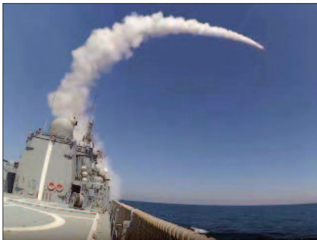
Изпитателен пуск на противокорабната хиперзвукова ракета "Циркон"

"Русия е построила цяла система противоракетна отбрана, като се започне от комплексите С-300 и се завърши с С-500. Това е най-новата система, на която никой няма аналог. Тези комплекси предизвикват интереса на много наши партньори, както и недоволството на на-