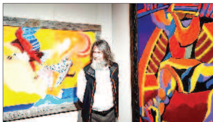
Фьодор Конюхов и неговите картини

През декември, преди да отпразнува 70-годишнината си, Конюхов сподели плановете си за 2022 г. - да пресече Атлантическия и Тихия океан с катамаран, оборудван със слънчеви батерии. Изпитанията на плавателния съд започнаха през януари. По време на плаването Ко-