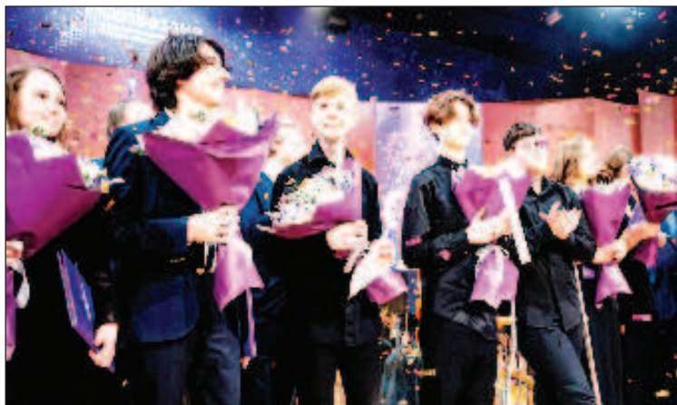
За първи път в конкурса "Созвездие" спечелилите голямата награда са трима