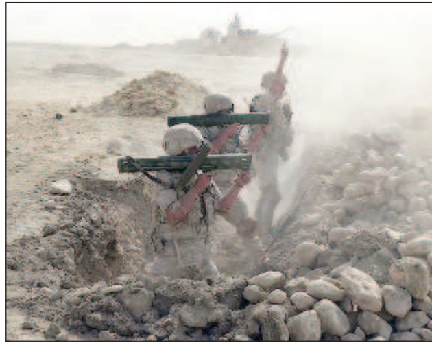
Епизод от завършилите руско-таджикистански учения

От въздуха обединената групировка войски е поддържана от екипажи на транспортно-бойните вертолетни Ми-8 и удар-