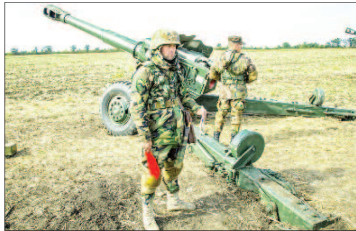
Эпизод молдавско-румынских артиллерийских учений "Огненный щит - 2023"

В Минобороны уточнили, что в них приняли участие подразделение офицеров, сержантов и солдат мотострелковой бригады молдавских ВС "Штефан Великий". В марте сообщалось о проведении в Молдавии военных учений спецназа совместно с армиями США, Великобритании и Румынии.