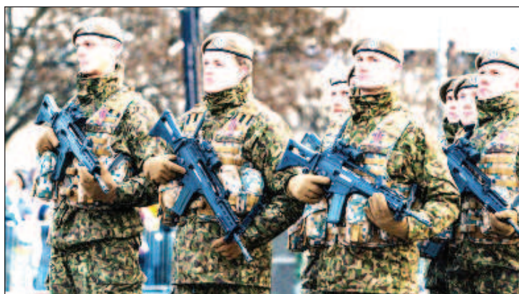
Латвия вновь вводит воинскую повинность для сдерживания России

Он также объяснил введение воинской повинности. "У нас должно быть намного больше людей, умеющих обращаться с оружием, это вопрос сдерживания Рос-