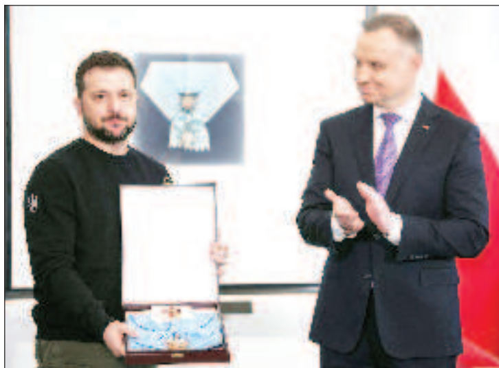
Дуда връчва на Зеленски "Белия орел"

В навечерието на визитата на Зеленски във Варшава директорът на Службата за външно разузнаване на