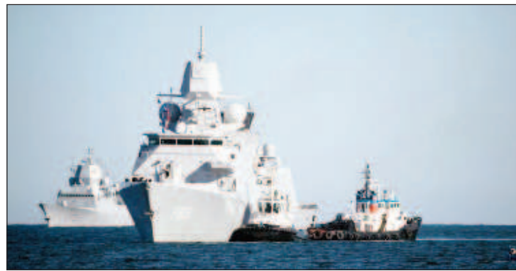
В Старый порт Таллина прибыли фрегат Военно-морских сил Германии Brandenburg и португальский фрегат Bartolomeu Dias

"Визит наших кораблей демонстрирует решимость и готовность Североатлантического союза быстро и эффективно реагировать для защиты каждого члена НАТО в случае необходимости", - сказано в сообщении властей.