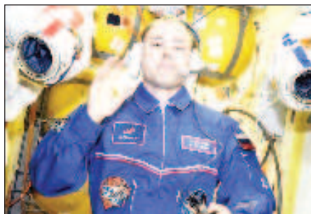
Космонавтът Дмитрий Петелин

"Мощта на ракетата и безкрайността на Космоса - това е като руската душа", цитира думите на Петелин "Роскосмос" в своя Telegram канал. От руската държавна корпорация разказаха още, че мотото на космонавта от детството е било