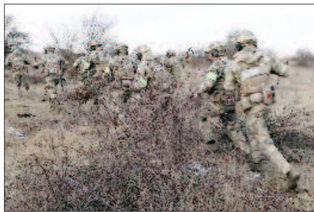
Елитните "Вълци на Да Винчи", попаднаха под руски огън

В началото на специалната военна операция отрядът "Вълците на Да Винчи" беше базиран в Донбас. Той участва в боевете за Купянск, Харковска област, през есента на миналата година и в прочистването на представителите на мирното население, заподозрени в симпатии към Русия.