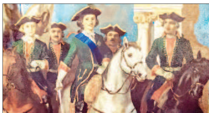
Обе Екатерины во время дворцового переворота 1762 года русских воинов.

ствие по странам Европы, в ходе которого она познакомилась с лучшими мыслителями эпохи - Дидро, Вольтером и другими. Все они отмечали глубокие знания и необычайный ум княгини Дашковой, а также ее чрезвычайно одобрительные отзывы о Екатерине II. Эти отзывы со временем помогут самой Дашковой - императрица, состоявшая в переписке с теми же Вольтером и Дидро, осталась довольной тем, что бывшая подруга выступает в Европе как ее собственный "агент влияния".