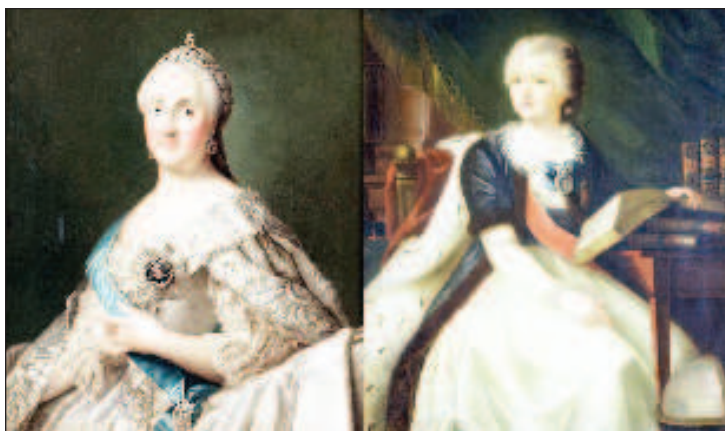
Екатерина Великая и Княгиня Дашкова

Юная Дашкова была причастна к заговору, который возвел на престол Екатерину II. Однако степень ее причастности остается спорной. Императрица и Дашкова в своих воспоминаниях описывали это весьма по-разному. Екатерина II писала, что Дашкова отвечала лишь за связь с офицерами низшего звена, не посвященными во все детали переворота 1762