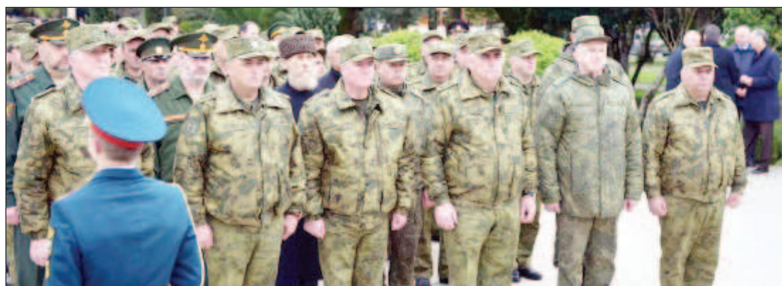
Основная цель учений в Абхазии - повысить готовность штабов и войск

Мероприятия подготовки армии и штабов проводятся в соответствии с планом совместной боевой подготовки войск Абхазии и Вооруженных сил России.