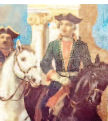
Обе Екатерины во время дворцового переворота 1762 года русских воинов.

Именно Дашкова стала инициатором проведения регулярных публичных научных лекций, что способствовало популяризации науки среди широких слоев населения. Было увеличено количество студентов - академических стипендиатов, большое количество молодых россиян