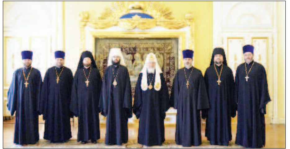
В завершение встречи Святейший Патриарх поблагодарил клириков за их труды и пожелал помощи Божией в служении.

В ходе беседы священники рассказали Его Святейшеству о жизни епархий и приходов Московского Патриархата в странах их пребы-