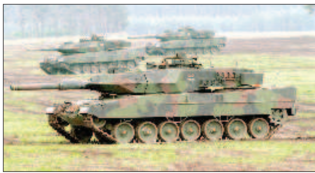
Специални групи руски военнослужещи ще унищожават западните танкове в Украйна

"Генерал-полковник Евкуров постави конкретна задача за създаването на тези групи. В съответствие с неговите указания началникът на Главното управление "Бойна