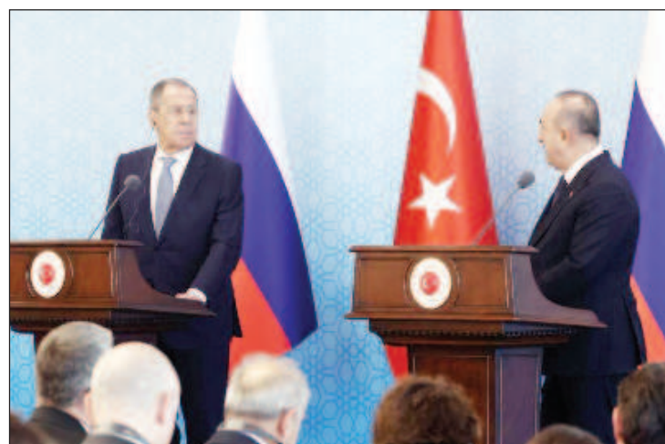
Съвместната пресконференция на Сергей Лавров и Мевлют Чавушоглу

Лавров поясни, че това е суверенна дейност на всяка една страна, още повече в такава развита държава като Турция. "Друг е въпро-