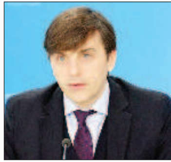
Министър Сергей Кравцов

Интересен факт е, че Министерството на просветата на РФ е разработило учебник по украински език