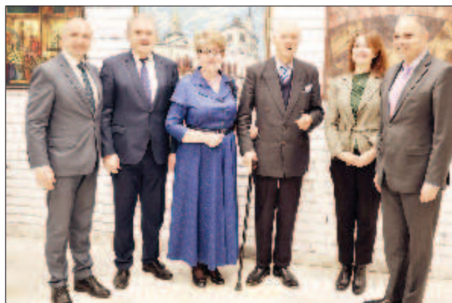
Посол России Э.В. Митрофанова с гостями выставки