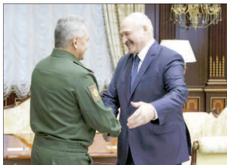
Лукашенко поиска от Русия гаранции за сигурността на Беларус

ни не изпълняват и на практика са стъпкали договореностите за гаранции за сигурност, които фигурираха в рамките на Будапещенския меморандум в замяна на извеждането на ядреното оръжие от територията на страната, като отбеляза, че има предвид също така и икономическата сигурност. "Каква ти икономическа сигурност, щом те въвеждат срещу нас, срещу Русия икономически санкции! - отбеляза беларуският лидер. - Затова повдигнах този въпрос на преговорите с президента на Русия. Той ме подкрепи напъл-