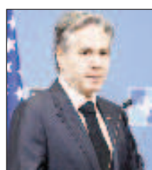
Държавният секретар на САЩ Антъни Блинкен е против примирието в Украйна

Държавният секретар на САЩ Антъни Блинкен изключи възможността за преговори за прекратяване на огъня между Русия и Украйна в настоящия момент. Своята гледна точка той изложи в интервю за медийната група Funke, фрагмент от което беше излъчено в края на миналата седмица.