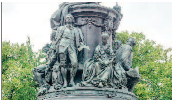
Фигуры в основании памятника Екатерине II в Петербурге - поэт Гавриил Державин и княгиня Дашкова

Европы, что впоследствии помогло ей в годы работы директором Академии наук. По возвращении Дашковой в Россию Екатерина Великая вернула ей свое расположение. В 1783 году императрица, которой очень импонировала идея Дашковой