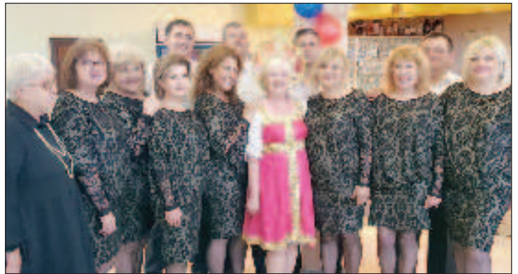
Празднование 9-го мая в г. Елхово

В этом году наша группа, впервые, совместно с вокальной группой "Виолина" при Доме культуры "Пробуда" приняла участие в Национа-