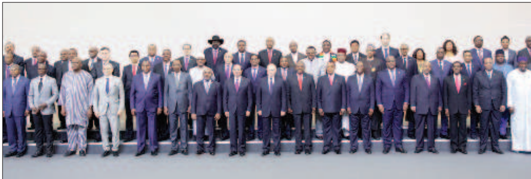
Първата среща на най-високо равнище Русия-Африка се състоя през октомври 2019 година в Сочи

Международната сигурност, политическата стабилност, въпросите за продължителното осигуряване, както и съвместните усилия за борба с епидемиите и извънредните ситуации ще са главните теми в блока "Комплексната сигурност и суве-