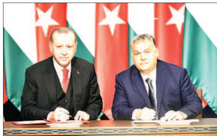
Ердоган и Орбан останаха единствените препятствия за членството на Швеция в НАТО

Съдейки по неотдашните събития, Орбан разчита все пак да си вземе от ЕС замразените 12 милиарда евро. Затова той непрекъснато вдига залозите в търка с Брюксел. В понеделник унгарският министър на външните работи Петер Сиярто неочаквано заяви, че неговата страна ще се обърне към Евросъюза с молба да продължи с още една година изключването на страната от антируските санкции. То ще позволи на унгарската енергийна група MOL да експортира в Чехия нефтопродукти, произведени благодарение на доставките на руска суровина по нефтопровода "Дружба". Си-