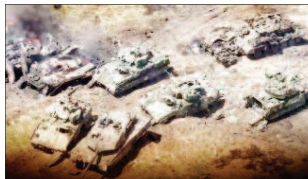
На мястото на унищожените 16 танка "Леопард" в Украйна пристигат десетки други

Украинските войски вече използваха танковете "Леопард" в хода на контранастъплението си, което започна на 4 юни. От руското Министерство на отбраната заявиха, че са унищожени много танкове от този тип. На 27 юни пре-