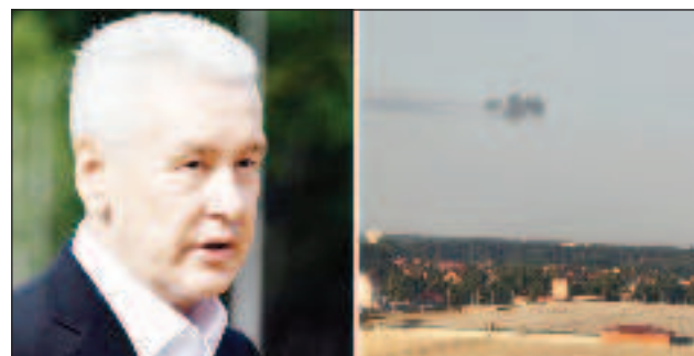
Кметът на Москва Собянин заяви, че украинските безпилотни летателни апарати в Московска област са унищожени

Уточнява се, че четири украински безпилотни летателни апарата са унищожени на територията на Нова Москва от средствата за противовъздушна отбрана, а още един дрон е свален с помощта на средствата за радиоелект-