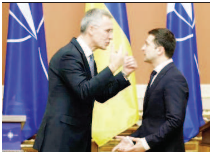
Столтенберг обяснява на пръсти какво се очаква от Зеленски, за да приемат Украйна в НАТО

Косвено за планове на неонацисткия режим свидетелстват и организираният през изтеклата седмица учения за радиоактивна защита в случай на извънредно положение в района на АЕЦ. Те обхващаха твърде широка територия: Днепропетровска и Николаевска област, като и намиращите се под контрола на Киев части от Херсонска и Запорожка област. Същевременно вечерно време, когато идва моментът за прогнозата за времето, вместо това Министерството на здравеопазването дава съвети как хората да се предпазят в