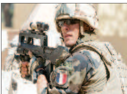
Препоръчват на френските инструктори да не дружат с украински военнослужещи

Френските военни инструктори получиха указания да избягват приятелства с украински военнослужещи по време на обучението им, за да не изпитват отрицателни емоции след смъртта им, събщи вестник "Фигаро".