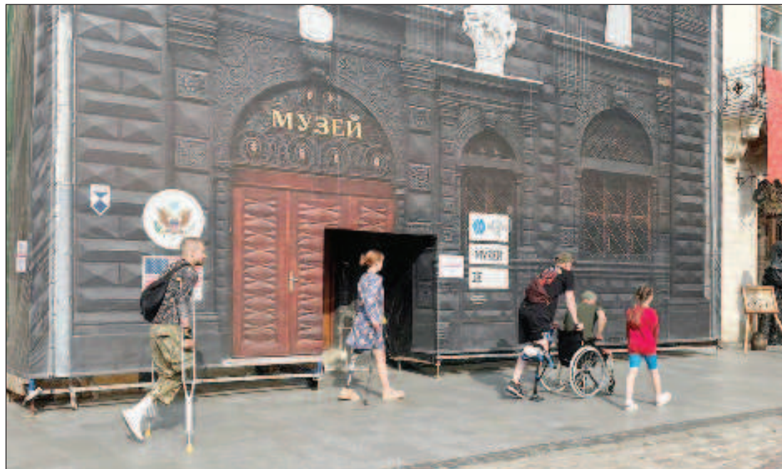
Тази фотография, направена на улица в Львов, изглежда като символ на трагедията на украинците: от петима души четирима са инвалиди, които минават на фона на знамето и герба на САЩ

"Използването на безпилотни апарати за поразяване на значими цели противникът практикува отдавна. Сега се съобщава, че Киев смята да засили тяхната употреба. От военна гледна точка това не е особено ефективно, но резултатите са осезаеми, когато става