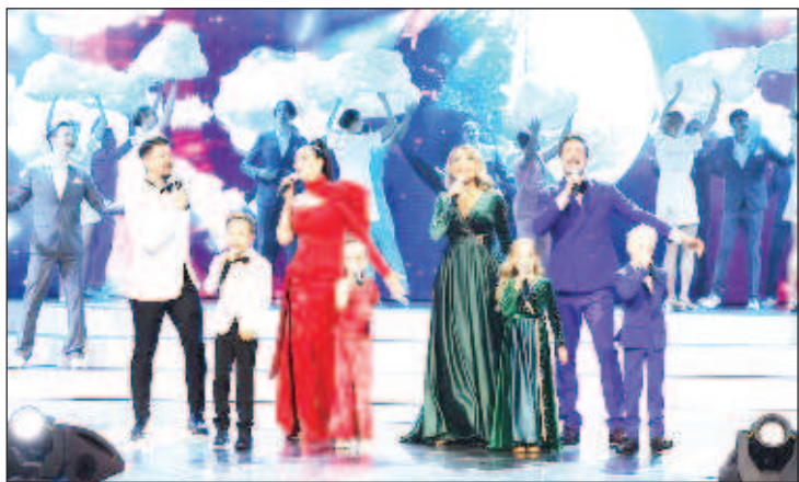
Момент от закриването на "Славянский базар" във Витебск

Фестивалът ще приключи на 23 юли, също на покрива на павилиона "Рабочий и колхозница", където ще се състои спектакъл-четене на "Мистерия-буфф", който според организаторите е притча за същността на човека. В проекта ще участват артисти от Студиото за театрално изкуство и випусници на ГИТИС.