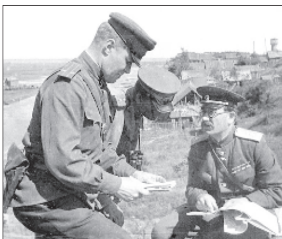
Маршал Ротмистров (справа) на фронте