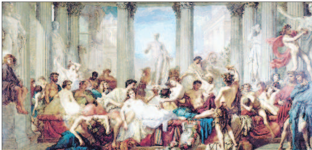
Картина на френския художник Тома Кутюр "Римляните по време на упадък", рисувана 1847 г., когато Франция започва да губи славата си на лидер в културата

Днес САЩ - и това е очевидно, искат да запазят хегемонията си, като накарат потенциалните си конкуренти да работят един срещу друг, за да се отслабят взаимно. Това се проявява главно по отношение на Европа, Русия и Китай. Дори в самата Европа Щатите искат да предотвратят появата на една доминираща страна. Те разиграват картата на разногласията между старата Западна Европа и по-динамичната и източна част, която фактически играе ролята на американски агент за влияние. САЩ обаче са изправени пред редица предизвикателства и пред риска от сблъсък с Русия и Китай - държави, които в сегашния момент, изглежда, не се вписват в законите на Шпенглер за морфологията на историята, които утвърждават принципа за упадък на цивилизациите.