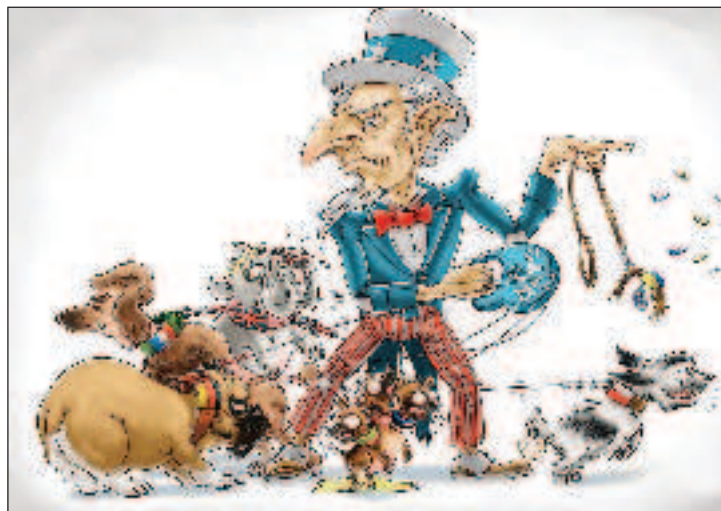
Европейските съюзници на САЩ, когато трябва, може да бъдат използвани и като кучета

Според публикацията истинските причини за недоволството на французите не е расизмът, а ускореният упадък. Посочват се неговите основни параметри. В икономиката: нулев ръст и снижаваща се производителност. В социалната сфера: масова безработица и нищета, засягаща 9 млн. французи, а доходите на 70% от тях зависят напълно от социалните помощи, единствен ориентир за младежта са социалните мрежи. Финансите на страната: държавният дълг надхвърля 3 трлн. евро, частният дълг е в размер на 146% от БВП, а търговският баланс - 7% от БВП. Политическият провал: имаме затлъстяла и безсилна власт, която монополизира 58% от БВП, като същевременно е неспособна да реши основните си задачи по поддържане на сигурността, да гарантира основните права на гражданите