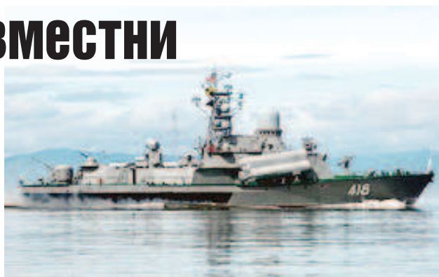
Китайски бойни кораби се насочиха към Японско море

китайското МО. Главната цел на ученията е "повишаване равнището на стратегическо сътрудничество между двете армии за поддържане на регионалния мир и стабилност", посочват от китайска страна. Порано от Генералния щаб на ВС на РФ заявиха, че координирането на усилията между Русия и Китай на международната арена оказва стабилизиращо влияние