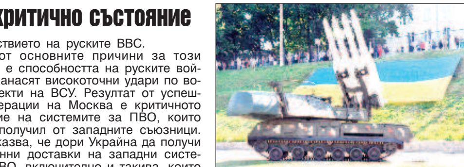
Дори най-съвременните установки за ПВО от Запада са уязвими за руските атаки

Москва вече е доказала готовността си да увеличава военното производство за по-мощни удари по западната техника. Това означава, че дори най-съвременните системи за ПВО, които могат да бъдат