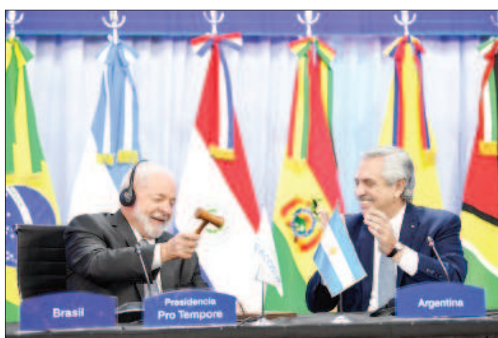
Бразилският президент Луис Инасиу Лула да Силва на срещата в Брюксел: "Сега ние решаваме кой на кого какво дължи"

В Брюксел се наложи да бъдат изслушани претенциите на страните от Латинска Америка към Европа и САЩ. Повдигната бе темата за търговията с роби, за