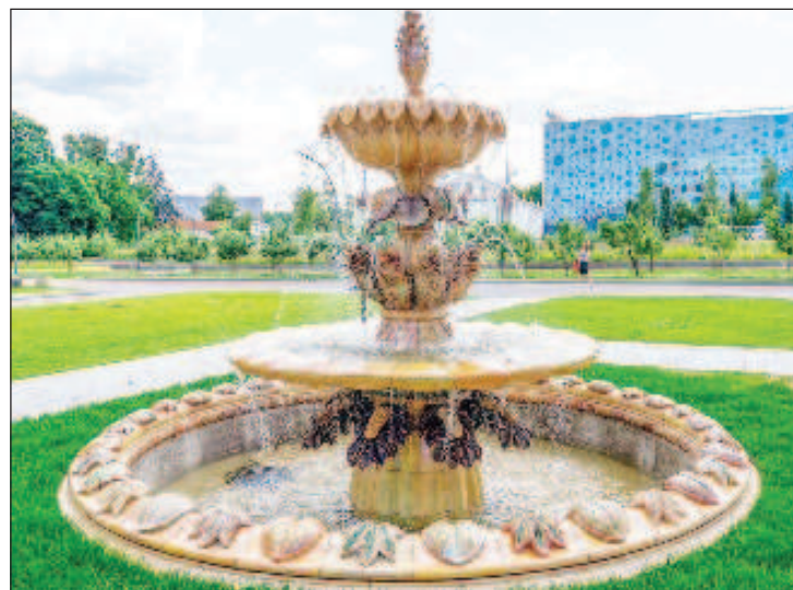
Възстановеният фонтан заработи след 40 години

Възстановяването на облицовката е направено в керамичните ателиета на Гжел. Променено е оборудването на фонтана, инженерната система, отново са отлети долната и средната чаша.