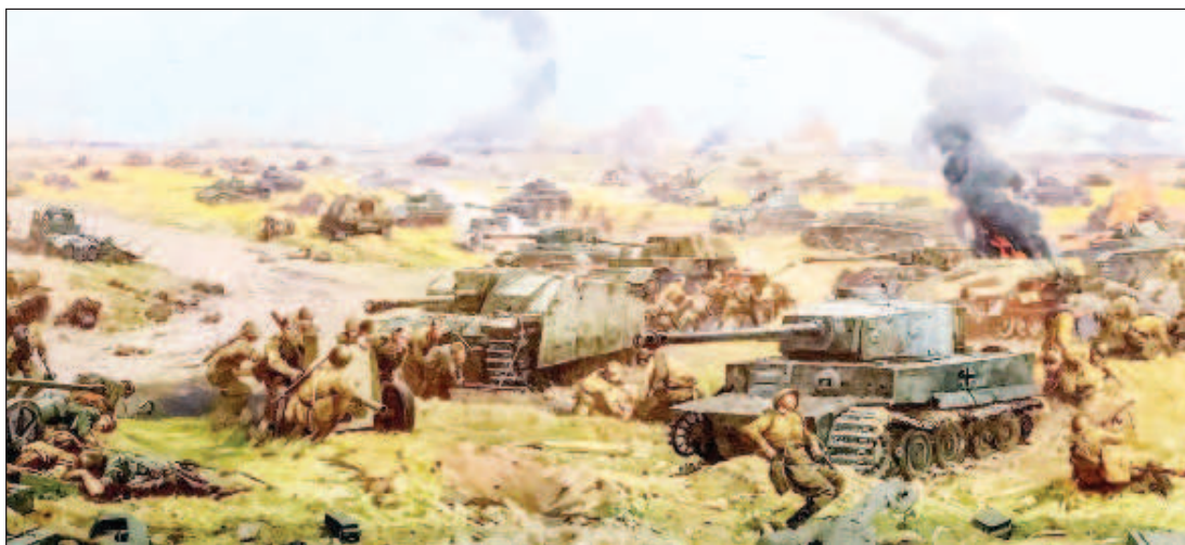
Панорама крупнейшего в истории встречного танкового сражения в Музее Победы в Москве

Самый горячий прием ждал бронированных монстров. "Тигры" и "Пантеры" были сложными. Напротив, советские конструкторы разработали относительно простое и компактное оружие - противотанковые авиабомбы (ПТАБ) - весом всего 1,5 кг и в габаритах 2,5 кг бомбы. ПТАБ наши создали всего за полгода. Испытания завершили весной 1943-го, как раз когда Гитлер определял сроки проведения "Цитадели". Есть данные, что план этой операции уже лежал на столе у