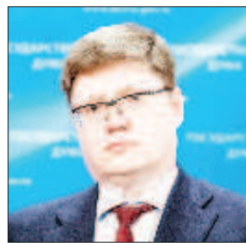
Андрей Исаев е зам.-ръководител на фракцията на "Единна Русия" в Държавната дума

Що се отнася до диспансеризацията на населението, броят на профилактичните прегледи през 2022 г. достигна рекордните 68 милиона. Според данните, предоставени от Министерството на здравеопазването, в резултат на това са били открити повече от 12 милиона случаи на болести, свързани с кръвообращението. "Единна Русия" смята, че трябва да започне безплат-