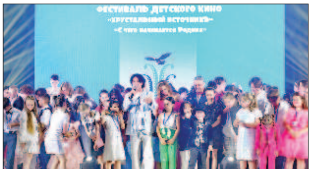
Финалът на фестивала "Хрустальный источник"

Детски екипи заснеха девет игрални късометражни филма на първия фестивал за детско кино "Хрустальный источник". В снимките участваха повече от 170 деца от