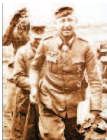
Фельдмаршал Эрих фон Манштейн

Сталина. Наша разведка умела делать невозможное. Сталин лично приказал наркомом боеприпасов Борису Ванникову изготовить к 15 мая 800 тысяч ПТАБ. Задание выполнено в срок и в указанных объемах. Но до июля бомбы засекретили и в боях не применяли. Чтобы вермахт не успел подготовиться.