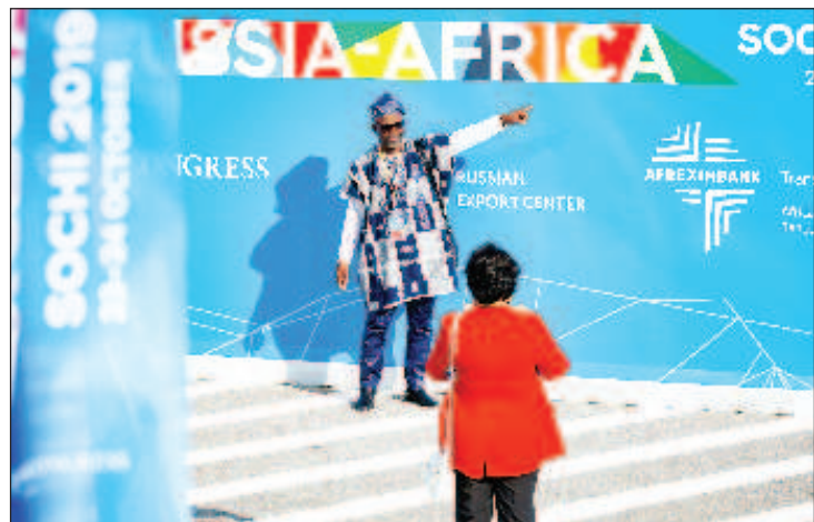
Преди 4 години в Сочи се състоя първият форум "Русия-Африка"