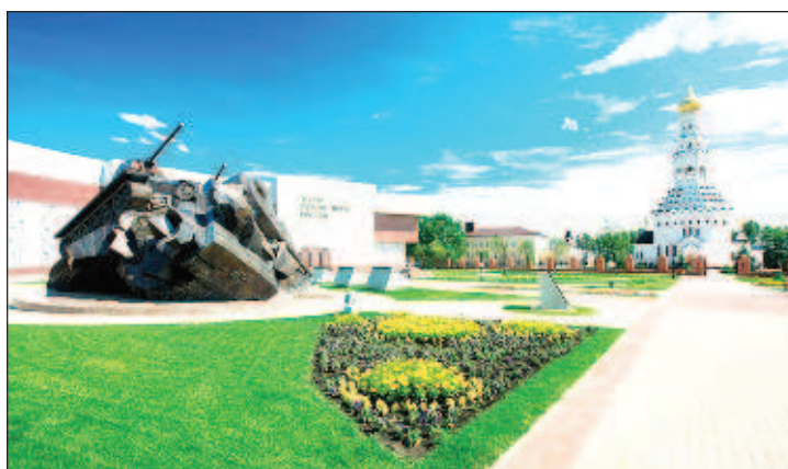
Храм Петра и Павла и скульптурно-художественная композиция "Танковое сражение" в Музее заповеднике на Прохоровском поле

Вермахт спешно стал расконцентрировать походные и боевые порядки. При остановке танки располагались под кронами деревьев. Наши авиабомбы в таких условиях теряли эффективность: взрыватели срабатывали преждевременно. А истребителям Люфтваффе приказали: игнорируя все иные цели, атаковать только Ил-2. Любой ценой. С задачей летчики-герои справились: за время боев на Курской дуге обрушили на врага полмиллиона кумулятивных бомб. Жгли не только танки, но и машины, артиллерию, склады горючего и боеприпасов. Уже после Прохоровки и последующих сражений немецкая бронетехника приобрела причудливый вид: повера танков натягивали металлические сетки, чтобы снизить куму-