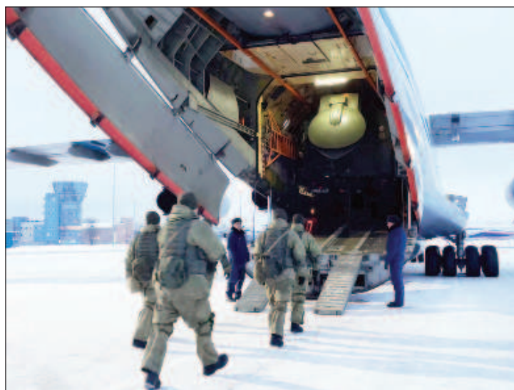
Все аэродромы и полигоны Белоруссии задействуют в совместных с Россией учениях

6 января сообщалось, что в Белоруссию прибыл эше-