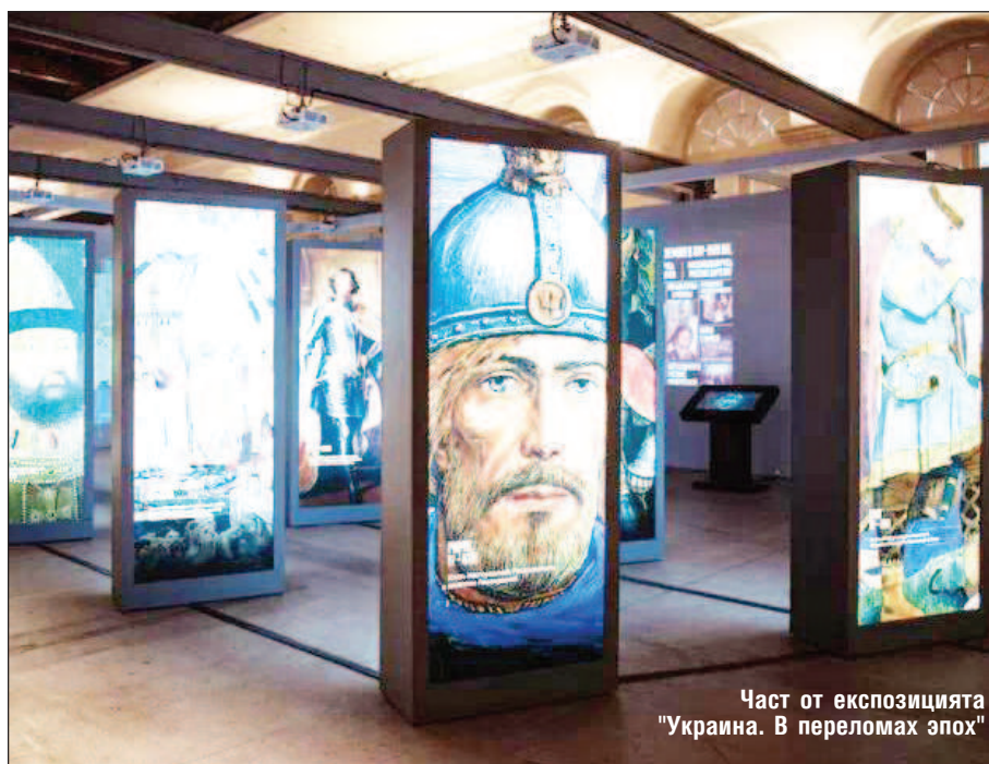
Част от експозицията "Украйна. В переломите епохи"