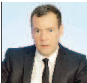
Дмитрий Медведев е на мнение, че дресурата на Киев от страна на Запада продължава

В навечерието на празниците пресслужбата на Кремъл съобщи, че руският президент Владимир Путин е поръчал от 12:00 часа на 6 януари до 24:00 часа на 7