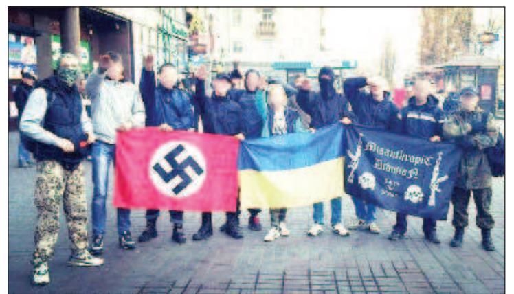
Кадър от мита за украинската демокрация

Той напомня как западните лидери от години си затварят очите за разпространението на нацистката идеология в Украйна. "Поддръжниците на режима дори не смятат за нужно да осъдят флирта на режима с последователите на неонацизма. Особено умопомрачаваща е ролята на батальона "Азов". Много години наред - още до конфликта с Русия, това подразделение беше извес-