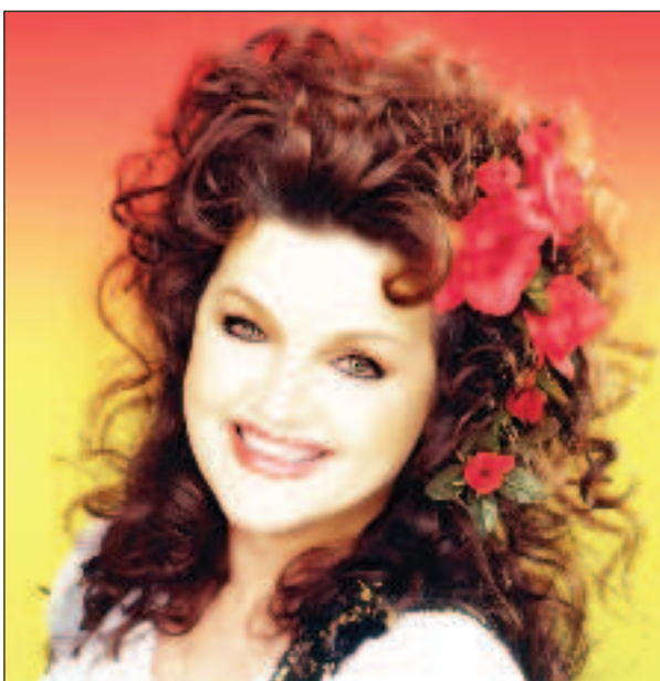
Народная артистка Молдавской ССР, заслуженная артистка РСФСР Надежда Чепрага

- Как на всех. Начинающему кружит голову, зрелому даёт мотивацию. Когда я в 16 лет в 1972 году пела во Франции, в "Олимпиаде", и получила золотую медаль вместе с мэтрами - Еленой Образцовой, Бибигуль Тулигеновой... Так ведь я ещё танцевала с президентом Франции Жоржем Помпиду. Это я теперь с улыбкой вспоминаю, а тогда я, деревенская девчонка, говорю президенту Франции, ясное дело, по-французски (в школе учила): "Вам большой привет от Ивана Ивановича Бодюла". Он деликатно спрашивает: "А кто это?" Я: "Первый секретарь ЦК". Президент: "Первый секретарь ЦК - мой друг Леонид Брежнев". "Иван Иванович Бодюл!" - спорю я. "Ну, и ему передайте привет", - не стал спорить Помпиду. Я тогда жила в деревне, училась в 9-м классе. В моём понимании первый секретарь ЦК мог быть только один - Молдовы. Во Франции я постриглась под модное тогда