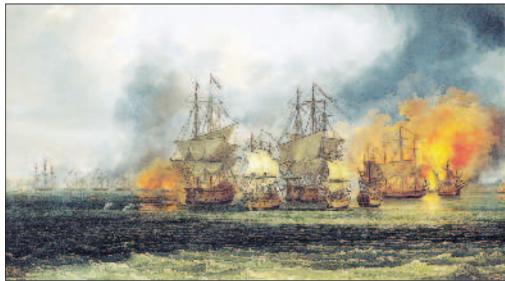
Морские бои во время Первой архипелагской экспедиции русского флота 1769-1774 гг., когда 18 греческих островов дружно попросились в российское подданство

После изгнания Наполеона из России встал вопрос - что делать с Польшей. Подвергшаяся в XVIII в. разделу и наскоро восстановлен-