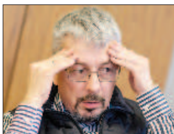
Министърът на културата на Украйна Александър Ткаченко

Украински театри заместват произведения на руски композитори с постановки, в чиято основа са произведения на европейски и местни автори, съобщи министърът на културата на Украйна Александър Ткаченко, цитиран от ТАСС.