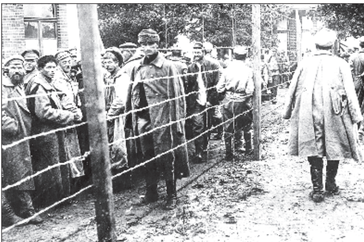
Десятки тысяч советских военнопленных были уничтожены в польском плену после советско-польской войны 1919-1921 гг. На территории Польши оказалось более 150 тысяч красноармейцев, в лагерях погибла половина их

нее, лично императрица Екатерина II осуществляла свою заветную мечту - Греческий проект. Первая Архипелагская экспедиция русского флота 1769-1774 гг. была настолько успешной, что 18 греческих островов дружно попросились в российское подданство. Просьбу уважили, Екатерина взяла "братьев по вере православной" под свою державу. Но добра это не принесло.