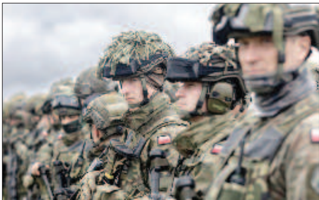
Освен полските наемници, които действат в Украйна срещу Русия, Полша създава нови подразделения в източната част на страната

"Ние организираме нови воински части. Между 16-а механизирана дивизия, която действа предимно във Варминско-Мазурското воеводство, и 18-а механизирана дивизия, която действа предимно в Мазовецкото и Люблинското воеводство, ще се появи