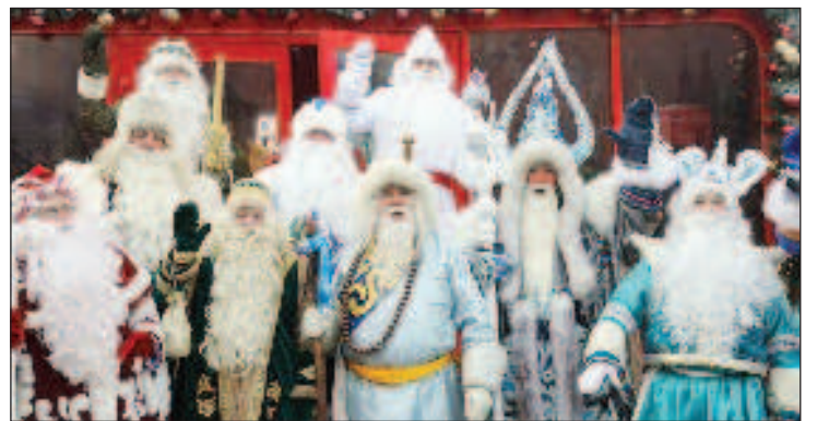
Първият сбор на Дядо Мразовци от регионите в Москва

сбор на регионалните Дядо Мразовци в Москва" е фиксирано от международната агенция за регистрация на рекорди "Интеррекорд". Това е най-голямата в Евразия алтернатива на Книгата на Гинес.