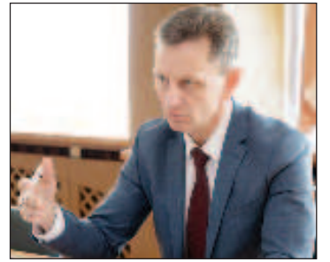
Владимир Сипягин, депутат от ЛДПР

хора мълчат. Мнозина дори вече се завърнаха. Някои останали и работят. Но не желаят на страната си смърт, разпадане. Можеш да не се съгласяваш с политиката на властите и можеш да говориш за това, но да желаят разпадането на страната си могат само предатели. Западните страни водят война срещу Русия до разпадането ѝ, както открито заявя-