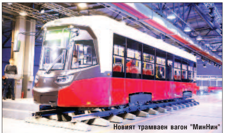
Новият трамваен вагон "МинНин"

От административния център на Приволжкия федерален окръг цитираха губернатора Глеб Никитин, според когото предстои модернизация на почти 150 км пътища и закупуването на 170 нови вагона. Според него това ще позволи един път и половина да се увеличи скоростта на трамвая, освен това ще се повиши комфорта не само за