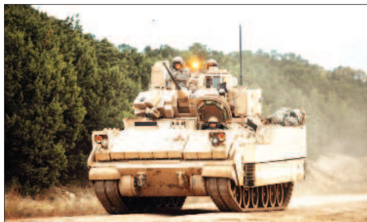
Надеждата на САЩ е бойната машина на пехотата "Брадли" да обърне хода на бойните действия в Украйна

В отговор на въпрос дали САЩ са обезпечени от все по-активното задействане от руска страна на частната военна компания "Вагнер" в Украйна, Прайс заяви, че Вашингтон не смята ефективни подобни стъпки от страна на Руската федерация. "Това ясно свидетелства, че руската страна започва да прибегва към все по-радикални мерки, за да проектира сила извън пределите на своите граници на територията на Украйна. Сега там действат десетки хиляди бойци, свързани не с руските Въоръжени сили, а с частната военна компания "Вагнер". И ако погледнем миналото на тези бойци, това изобщо не са висо-