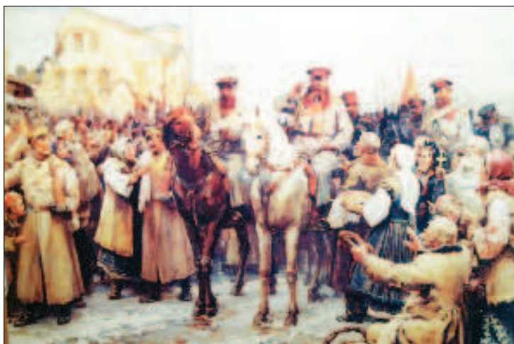
Сто сорок пять лет назад освобожденная София встречала хлебом и солью генерала Гурко, командующего Гродненским гусарским полком и Кавказской казачьей бригадой

С другой стороны, сохранение в Болгарии русского присутствия, и тем более попытка превратить эту