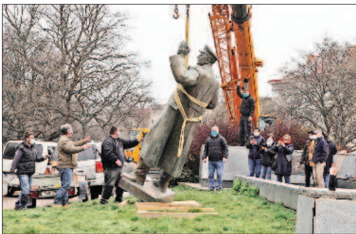
В Праге разрушили памятник освободителю города маршалу Коневу

Первый звоночек прозвучал в далеком 1771 году. Тогда Российская империя, вер-