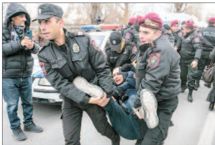
Активисты планировали перекрыть доступ к военной базе Гюмри

Лачинский коридор, который связывает Армению и Нагорный Карабах, был перекрыт 12 декабря. Экоактивисты требовали завершить эксплуатацию природных ресурсов Нагорного Карабаха. 13 декабря в Ми-