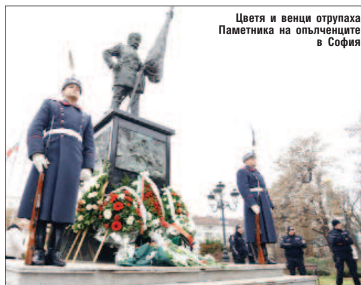
Цветя и венци отрупах Паметника на опълченците в София

от историята на България през нейната 13-вековна история, като акцентира на важността на Охридската патриаршия, на Втората българска държава, опряла се на три морета: "България има дни, години и векове на погром и горест, но и години на величие. На интерактивната карта на родината ни бихме могли да проследим как държавата ни ту свети, ту тъне в мрак. След десетки въстания и неизброими жертви на наша територия руският император Александър II решава, че ще освободи православните българи. През април 1877 г. 280 000 руски войници и 7500 опълченци преминават река Дунав при Свищов. За вицегубернатор на Свищов е избран Марко Балабанов, който преди това, заедно с Драган Цанков, месеци наред обикаля европейските столици, за да моли да бъде подкрепен народът ни по пътя към освобождението си. Но единствено Русия тръгва с войските си, подкрепена от 50 000 румънска армия, начело с Карол I. Битката на връх Шипка остава в историята като нещо нечувано. Но за да бъде София запазена, ние дължим почит на още трима смели