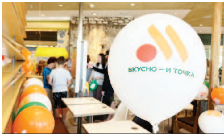
На мястото на избягалия "Макдоналдс" се настани нова верига за бързо хранене - руската "Вкусно. И точка"