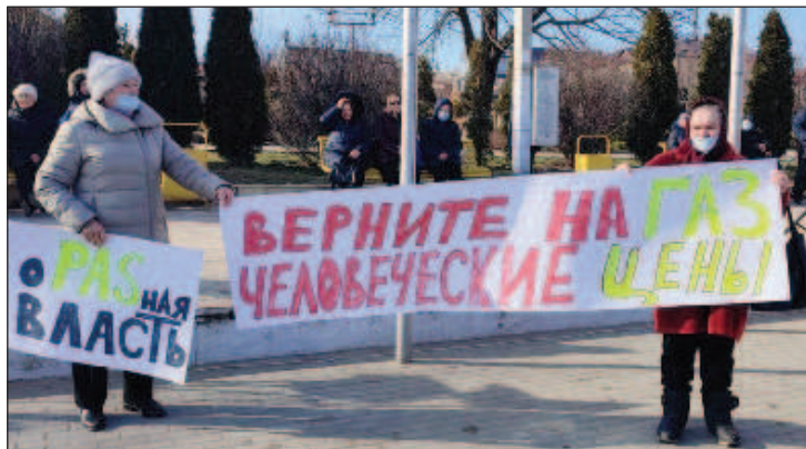
В Молдова не стихват демонстрациите срещу високите цени на газа