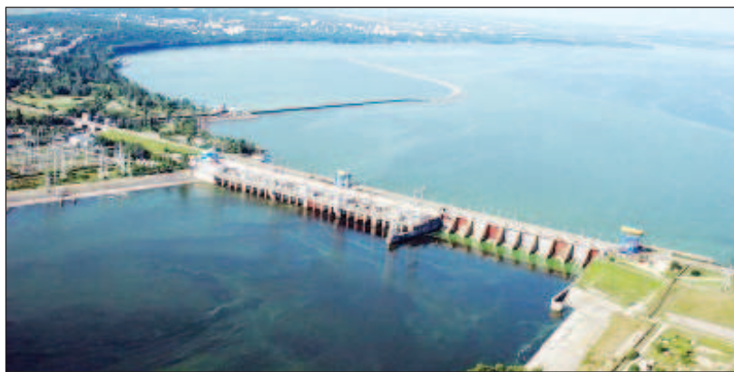
Всички планове Каховското водохранилище да стане обект на евентуален украински десант са обречени

Дандикин е на мнение, че украинската армия едва ли ще успее да построи временни мостове или понтони, за да може по тях да превози военна техника. Той предполага, че темата за форсирането на Днепър се разпространява с надеждата, че Въоръжените сили на Русия ще оттеглят част