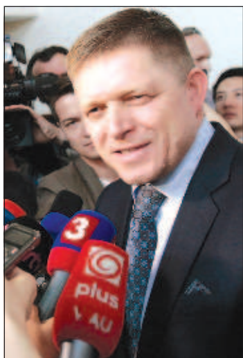
Роберт Фицо може да се завърне на бял кон във властта в Словакия