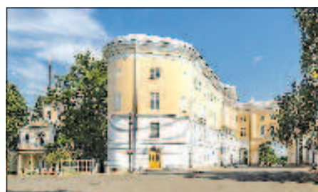
Царскоселският лицей днес

"Вие, разбира се, знаете колко уникален е този лицей, неговата история, и ни се струва, че ще бъде чудесно да го възродим", каза ректорът на среща с президента на РФ в Кремъл. Той уточни, че става дума за възраждане на лицей именно като учебно заведение, за да "се подготвят мла-