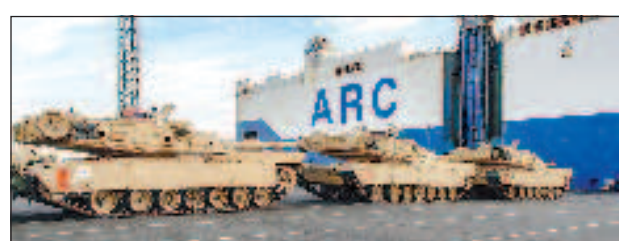
Първата партида "Абрамс" пристигна в Украйна

Вестникът предполага, че положението на бойното поле също може да се усложни от настъпващия период на есенни дъждове, тъй като тежката бронирана тех-