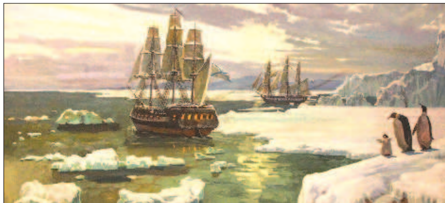
Шлюпы "Восток" и "Мирный" у берегов Антарктиды

ми. Но в жизни Беллинсгаузена нашлось место не только далеким морским путешествиям и географическим открытиям, но и воинским подвигам. Действующий морской офицер, он участвовал во многих походах русского императорского флота, в боевых действиях против Османской империи.