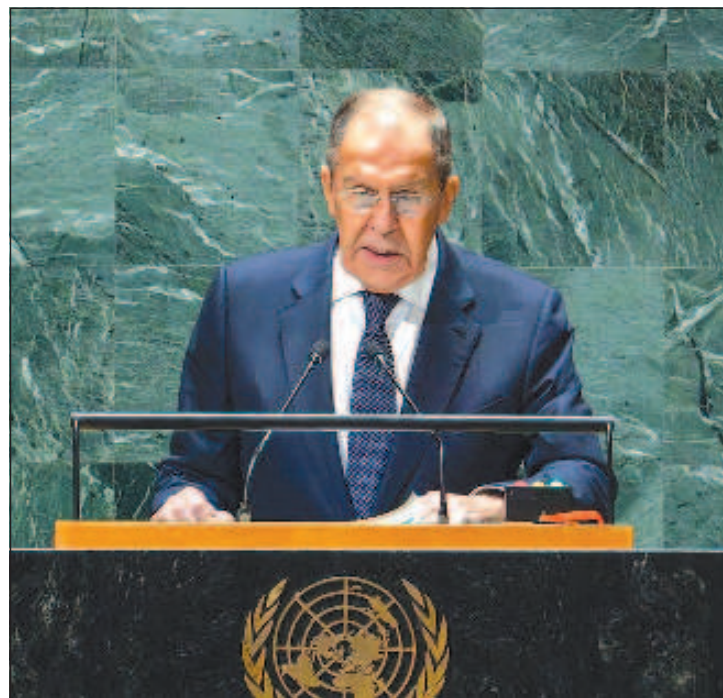
Сергей Лавров говори пред Общото събрание на ООН

По думите му все по-необходимо става разширяването на Съвета за сигурност на ООН главно чрез увеличаване присъствието в неговия състав на страните от Азия, Африка и Латинска Америка. Време е да бъдат преразгледани и методите на формиране на Секретариата на ООН. Действащите дълги години критерии не отразяват реалната тежест на държавите в международните дела и несправедливо осигуряват доминира-