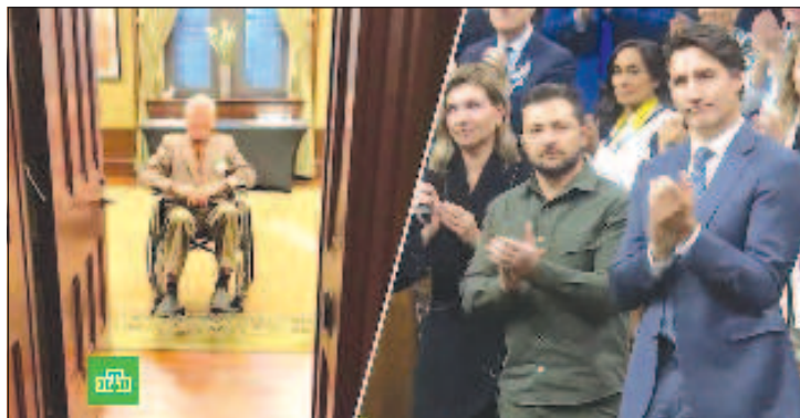
Зеленски и Трюдо аплодираха есесовеца

В края на миналата седмица Рота се обърна към обществеността с извинение за поканата в парламента и за аплодисментите в чест на 98-годишния боец от СС дивизията, тъй като не знаел за миналото на Хунка. На следващия ден ООН се обяви срещу честването на лица, участвали в наци-