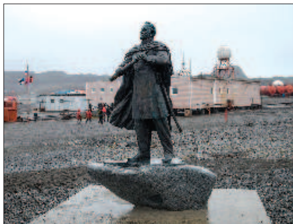
Памятник Беллинсгаузену на одноименной российской антарктической станции

Труды Беллинсгаузена действительно увидели свет лишь через 10 лет после его открытий. Да и то после нажима знаменитого главы Морского ученого комитета при Морском министерстве Логгина Голенищева-Кутузова, который имел некоторое влияние на императора: "Может случиться, и едва ли уже не случилось, что учиненные капитаном Беллинсгаузенем обретения, по неизвестности оных, послужат к чести иностранных, а не наших мореплавателей". А вот выдающийся немецкий географ Август Генрих Петерман писал о Беллинсгаузене: "Ни один мореплаватель после него не исследовал такого громадного пространства земного шара, как он". А сам открыватель Антарктики про себя говорил: "На море родился, море - вся моя жизнь".