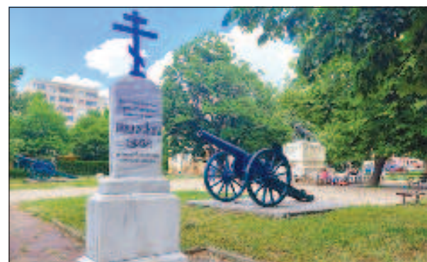
Надгробна плоча на лейтенант Николай Алексеевич Албовски от 9-и драгунски Казански полк, убит на 18 юли 1877 г. "Тук почива тялото на лейтенант Николай Алексеевич Албовски от 9-и драгунски Казански полк, роден на 11 септември 1847 г. в Харьковска губерния, убит на 18 юли 1877 г. край Ески Загра".

Около обяд на 18 юли турците, които се намирали пред отряда на Евгений Максимилианович, преминали в настъпление. Страхувайки се от флангова атака, руската преграда се оттеглила към Стара Загора. Там се намирали 1-ва, 2-ра, 3-та и 5-а дружина от българското опълчение, 8-и драгунски Астрахански полк, 9-и драгунски Казански полк, 9-и хусарски Киевски полк, 2 сотни от 26-и полк на Донската армия, 16-а кавалерийска батарея и взвод от 2-ра планинска и 10-а Донска батарея. Турците спрели при село Джуранли. Кавалерийските отряди извършили разузнаване и установили, че към града от юг се придвижват най-малко 10 батальона, 10 ескадрона и 2 артилерийски батареи. По този начин турците заели позиции на юг при село Арабаджикой и на изток при Джуранли. Руските войски трябвало да се сражават на