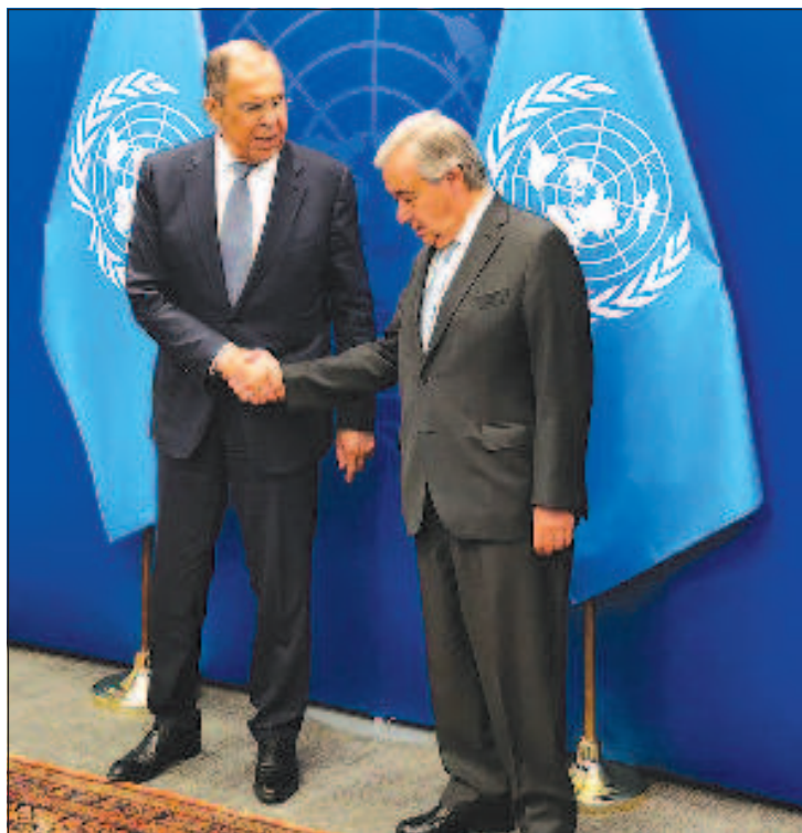
Министър Лавров и генералният секретар на ООН Антониу Гутериш

Той цитира генералния секретар Гутериш, който в навечерието на сесията на Общото събрание отбеляза, че "ако искаме мир и благоденствие, основаващи се на равенство и солидарност, лидерите трябва да поемат особена отговорност за постигане на компромис при проектирането на нашето общо бъдеще, заради общото ни благо". Руският министър нарече тези думи "добър отговор на всички онези, които се опитват да разделят света на "демокрация" и "автокрация" и да диктуват на всички само своите неоколониални правила.