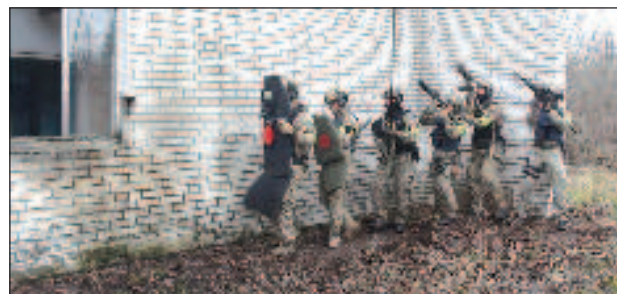
На полигона на Източния военен окръг в Приморие "Сергеевский" започнаха международни антитерористични учения

В основата на разиграваните тактически епизоди са залегналите варианти за съвместни действия на воинските контингенти от Въроръжените сили на Руската федерация, Мянма и други държави - партньори. Към ученията са привлечени органи на военно управление и подразделения от Източния военен окръг. За отработване на съвместни действия в състава на многонационална групировка войски са по-