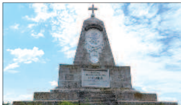
Паметникът на битката при Джуранли и Ески Загра е първият паметник, издигнат в област Стара Загора в 1881 г. На лицевата му страна е изписано: "При царуването на руския император Александър II под командването на Негово Височество княз Николай Максимилианович, херцог на Лейхтенберг, на 19 юли 1877 г. в битката при Джуранли и Ески Загра". На обратната страна на паметника са изписани участващите в битката формирования.