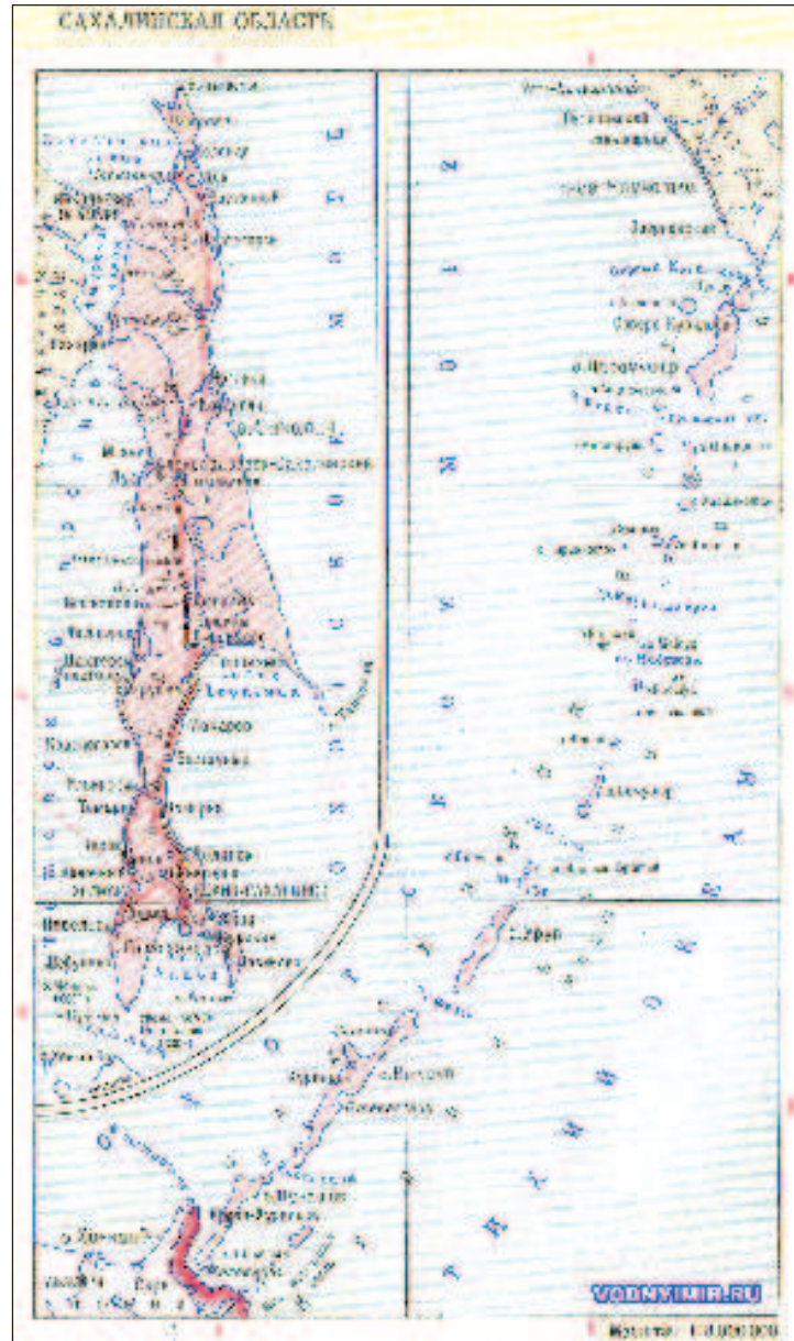
Карта Сахалинской области

Ведущими отраслями промышленности в Сахалин-