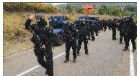
Нова вълна на напрежение залива Северно Косово

Руският дипломат изрази увереност, че на западните страни е нужно контролирано напрежение, за да оказват натиск, въздействие върху