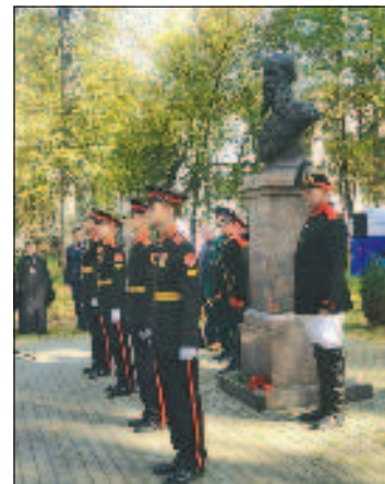
Част от участниците в тържествата при бюста на генерал Гурко