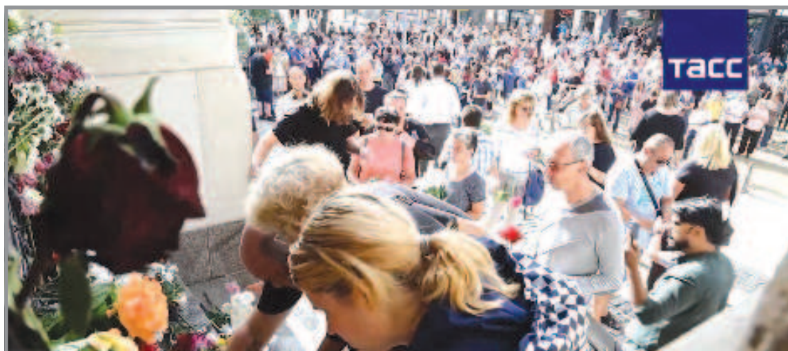
Десятки прихожан молятся перед дверями Русской церкви в Софии, закрытой после выдворения из Болгарии трех представителей РПЦ, несут букеты цветов и зажигают свечи. Как передает корреспондент ТАСС с места событий, верующие молятся за скорейшее открытие храма, подчеркивая, что политика не должна вмешиваться в церковные дела и выражая уверенность, что отношениям сестринских Русской и Болгарской православной церквей этот инцидент не помешает. Взвизывая за руки, прихожане выстроили живую цепь, защищая церковь, где покоятся мощи святого Серафима, от внешнего вмешательства.

25 сентября Посол Болгарии в Москве Атанас Крыстин был вызван в МИД России в связи с высылкой священников Русской православной церкви (РПЦ) из страны. Ему заявлено, что эта антироссийская провокация болгарских властей обернется неприятными последствиями для Софии. Отмечено, что очередная провокационная выходка болгарских властей, полностью вписывающаяся в текущие евроатлантические установки по "борьбе с российским влиянием", неизбежно обернется неприятными последствиями - прежде всего для его инициаторов".