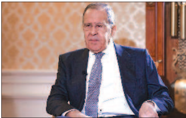
Министр иностранных дел Российской Федерации Сергей Лавров

Заявления политиков из стран Запада уже не вызывают удивления, заявил глава МИД РФ Сергей Лавров. Так он прокомментировал выступление своей коллеги из Финляндии Элины Валтонен, сообщает РИА "Новости". В интервью американским СМИ она призналась, что западные санкции, в частности, нацелены на ухудшение жизни обычных россиян. По её словам, Запад хочет,