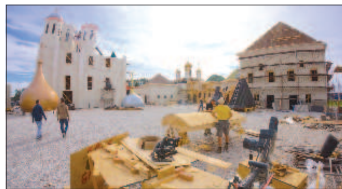
Строи се Московският кремъл

Москва остава най-големият център на руската киноиндустрия, в която работят 10 хиляди компании и се създават 90% от руските филми и сериали. Паркът в Красная Пахра обаче е само началото на изграждането на цял кинокълстер в столицата. Реорганизира се бившият Общеруски научноизследователски и проектно-конструкторски инсти-