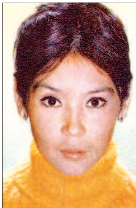
Наталья Аринбасарова в молодости

После работы в "Первом учителе" Аринбасарова поступила во ВГИК. В институте существовало правило, что студентам нельзя сниматься в кино. Но начинающей актрисе этого запрета удалось избежать. После успеха "Первого