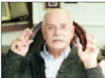
Никита Михалков - създател и водещ на предаването "Бесогон"

Режисьорът, актьор и председател на Съюза на кинематографистите на РФ Никита Михалков написа открито писмо до Съвета на Европейския съюз, в което коментира факта, че той е в "черния списък" на ЕС, като упреква "демократичното общество" във въвеждане на санкции срещу човек, позволил си да изрази лично мнение в собствената си страна.