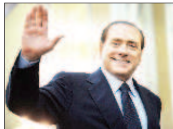
Италия Силвио Берлускони

По-рано бившият италиански премиер предложи себе си и бившия германски канцлер Ангела Меркел като посредници за разрешаване на конфликта в Украйна.