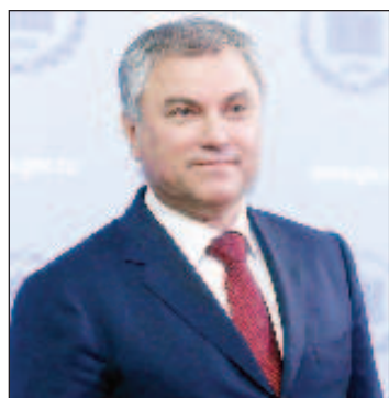
Вячеслав Володин, председател на Думата

Тук се появява и неизвестното. Светът няма опит във взаимодействието в рамките на международната политика, където има толкова много играчи от различен калибър, които влияят на общата картина. Няма и готови рецепти как да се установи баланс и стабилност. Всичко става ясно в крачка - и в двустранните