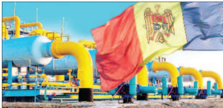
В Молдавии связали отказ вводить санкции против РФ с риском остаться без газа

Комментируя позицию Кишинева, Водэ объяснил, что страна рискует столкнуться с прекращением поставок российского газа и ряда следующих за этим негативных последствий, кото-