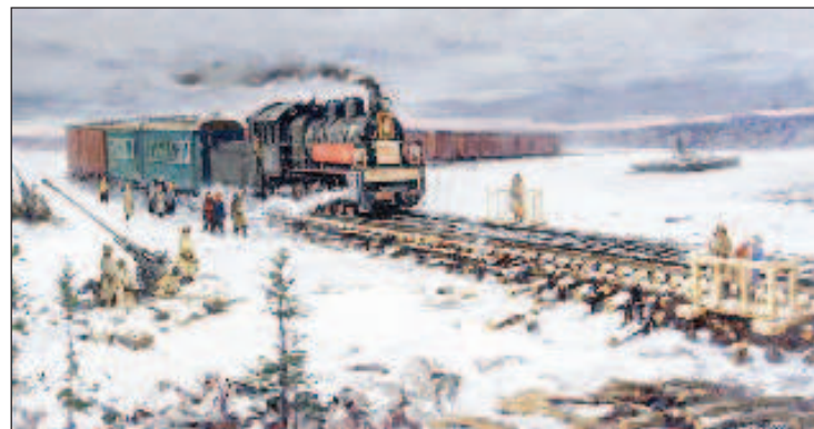
Строительство Дороги жизни

Битва за Ленинград продолжалась. Почти год ушел на подготовку решительного удара по немецким позициям и полного снятия блокады. Последний артиллерийский удар по Ленинграду немцы нанесли 22 января 1944 г. В январе 1943 г. маховик наступательных операций Красной армии еще не набрал полный ход. Но именно тогда, на шлиссельбургском льду, под хмурым зимним небом, впервые сверкнула искра Победы. (ИЗВЕСТИЯ)