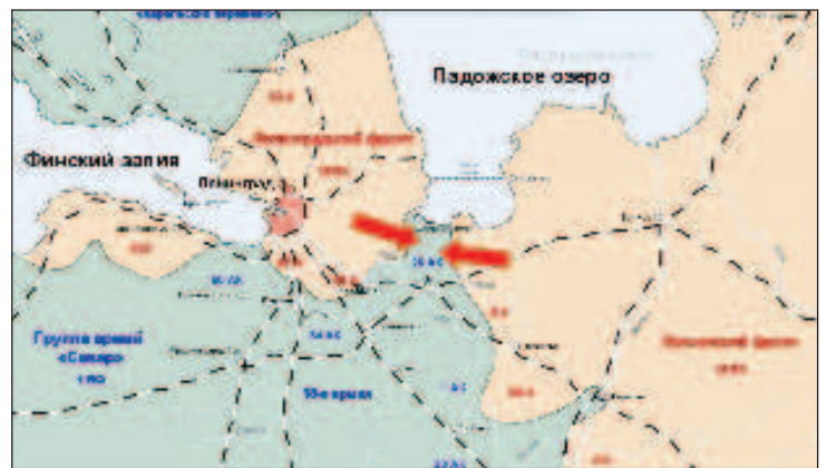
Карта фронтов до прорыва

В те дни о прорыве блокады ежедневно рапортовало не только Совинформбюро, но и Лондонское радио. Приведем слова, по которым можно судить о тогдашнем отношении союзников к сражавшейся России: "Слово "Ленинград" сейчас на устах у всех. Какой замечательный успех! Русские проявили сверхчеловеческий героизм. В течение многих