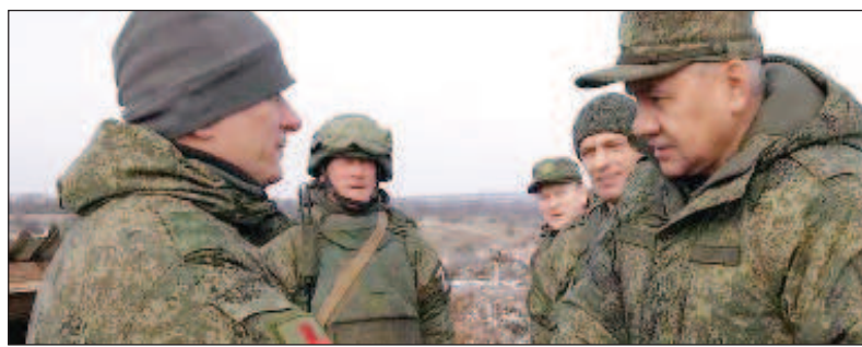
В зоната на специалната военна операция армейски генерал Сергей Шойгу връчи държавни награди за проявени самоотверженост и героизъм от военнослужещи от групировката войски "Изток"

Сред другите мероприятия Шойгу е посочил създаването на три нови мотострелкови и две десантно-штурмови дивизии, преформирането в дивизии на седем мотострелкови бригади, а също така усиление на бой-