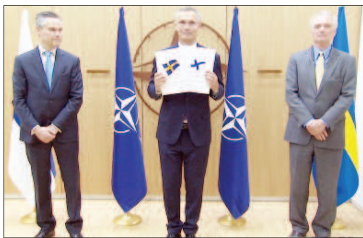
Въпреки предварителния пропаганден шум около заявките на Швеция и Финландия за членство в НАТО, всичко е в ръцете на Турция

В материала се отбелязва, че колкото по-скоро Турция и нейните партньори стигнат до съгласие, толкова по-добре ще бъде за али-