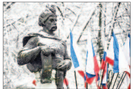
Торжественные мероприятия в честь годовщины Переяславской рады проходят у памятника Богдану Хмельницкому в Симферополе

В середине XVII столетия запорожцы во главе с гетманом Богданом Хмельницким, борясь против католических польских магнатов, обратились к русскому царю Алексею Михайловичу с просьбой взять их под свое покровительство. В октябре 1653 года Земский собор в Москве решил поддержать эту просьбу, а 18 января (8-го по старому стилю) 1654 года состоялась Переяславская рада, на которой запорожцы