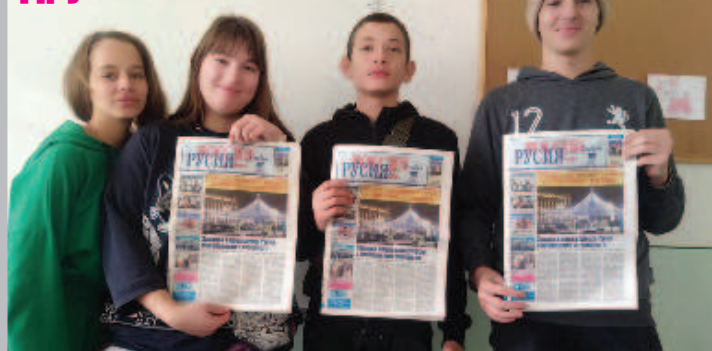
Учащиеся 7-8 классов спортивной школы им. Пьера де Кубертена города Ямбола, участники многих конкурсов и проектов, связанных с популяризацией русского языка и культуры