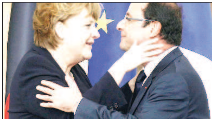
Меркел и Оланд: високи отношения в царството на лъжата

Взетото с изпреварване решение за началото на специалната военна операция се оказа единствено правилното. То позволи да се предотврати голяма катастрофа и гибелта на много хора. Затова признанията на представители на киевския режим