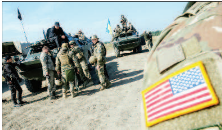
В Соледаре действовали американские наемники

Ранее командир ВСУ с позывным Мадьяр заявил,