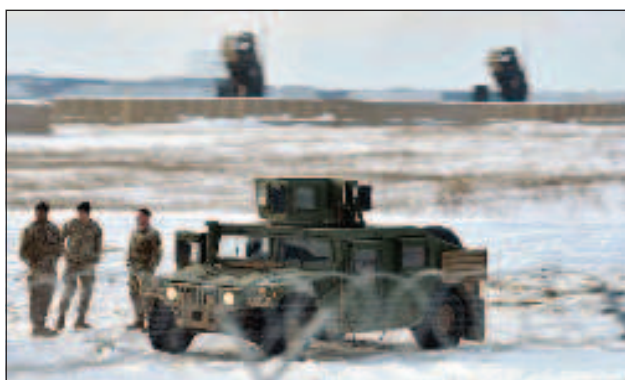
средите на западното разузнаване "Украйна - то

Според източника от телевизионния канал от