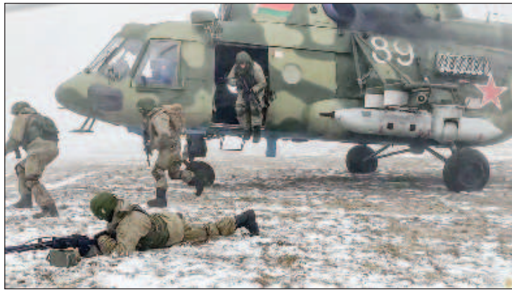
План маневров предполагает отработку высадки тактического десанта, ведения воздушной разведки, доставки грузов и эвакуации раненых

В ведомстве уточнили, что в учениях принимают участие подразделения, входящие в состав авиационного компонента региональной группировки войск. Отмечается, что план маневров предполагает, в частности, отработку высадки тактического десанта, ведения воздушной разведки, доставки грузов и эвакуации раненых.