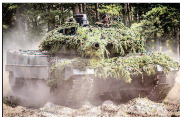
На 20 януари НАТО ще обяви доставките на танкове "Леопард 2" за Украйна