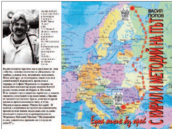
Обложка книги "Миссия без конца"

Уже со смехом он рассказывал, как по дороге осваивал не всегда цензурный сленг русских водителей, которые везли памятник и вели машину сопровождения. Поведал он и еще одну интересную деталь, связанную с перевозкой памятника. Дело в том, что грузовик в Болгарию приехал за-