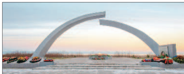
Памятник "Разорванное кольцо" - символ прорыва блокады

Там, где Нева впадает в Ладогу, расположена важная твердыня - город Шлиссельбург, оставшийся в руках гитлеровцев с сентября 1941 г. Но шлиссельбургская крепость - знаменитый Орешек - все это время не сдавалась врагу. Там, на ос-