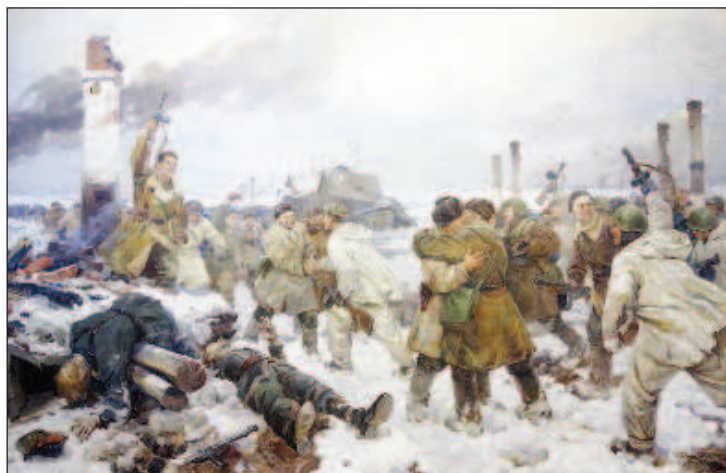
Прорыв блокады Ленинграда

рилла Мерецкова. Перед ними стояла задача в первые недели 1943 г. разгромить вражескую группировку, удерживавшую Шлиссельбургско-Синявинский выступ. Прорывную операцию назвали "Искра". В разработке операции принимали участие и представители Ставки - Климент Ворошилов и Георгий Жуков. Командование понимало, что самой трудной задачей для бойцов и командиров станет преодоление эшелонированной обороны немцев. Наступательная операция началась 12 января. После внушительной артподготовки ударные части Красной армии взломали немецкую оборону. В ходе кровопролитных тяжелых боев удалось осво-