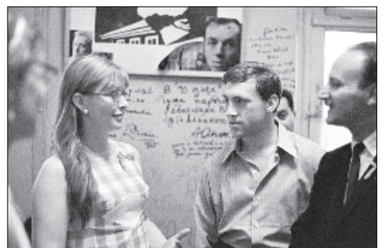
Марина Влади и Владимир Висоцки на 10-годишния юбилей на Театъра на Таганка, 1974 г.

Филмът разказва за живота, работата и творчеството на Владимир Висоцки. В кадър се появяват негови колеги, приятели, любимата му Марина Влади, с която през