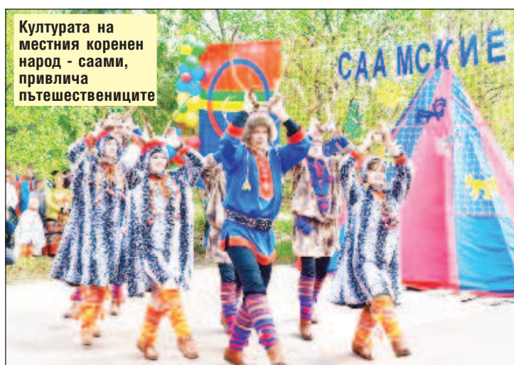
Културата на местния коренен народ - саами, привлича пътешествениците

На второ място в списъка на интересните направления за пътешествия през