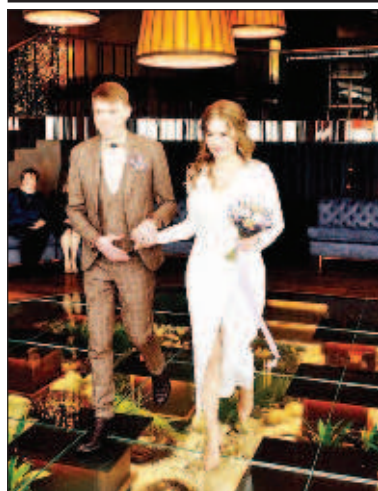
Най-популярната дестинация за бракосъчетание в Москва е кулата "Око" (ресторант Birds) в Москва Сити

сал е видеообръщение към участниците в специалната военна операция: "Другари от полка! Съжалявам, че ви се налага да повторите това, което аз правех по време на войната. Тези места са ми много добре познати. Пожелавам това да завърши по-скоро с победа!".