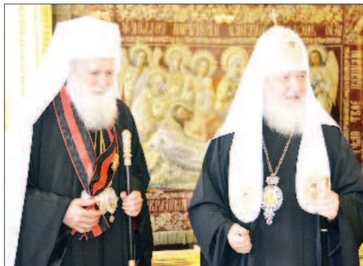
Патриарх Неофит во время встречи с Патриархом Кириллом в рамках своего визита в Россию (24 мая 2014 г.)

+КИРИЛЛ, ПАТРИАРХ МОСКОВСКИЙ И ВСЕЯ РУСИ