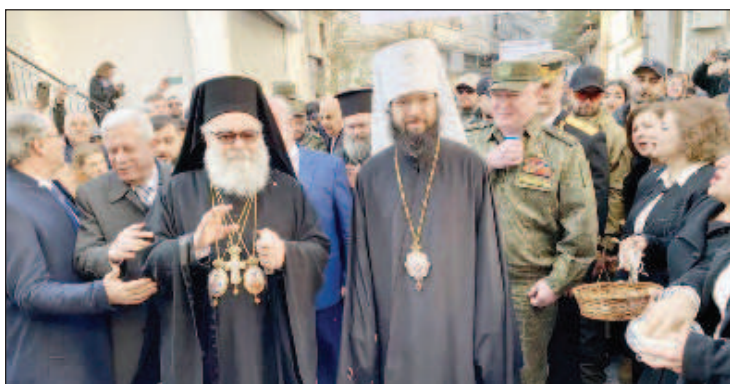
Блаженнейший Патриарх Великой Антиохии и всего Востока Иоанн X и председатель Отдела внешних церковных связей Московского Патриархата митрополит Волоколамский Антоний

22 января председатель Отдела внешних церковных связей Московского Патриархата митрополит Волоколамский Антоний принял участие в воскресной Божественной литургии в храме великомученика Георгия Победоносца в сирийском городе Арбин, сообщил Патриархия.ru.