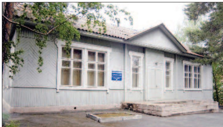
Дом Курчатова в Озерске, Челябинская область, в котором он жил, работая над созданием атомной бомбы

Однако это отставание пока что не было критичным. Когда Курчатов в 1942 г. ознакомил с агентурными данными, он констатировал: "Информация совершенно не содержит технических подробностей о физических исследованиях по самому процессу деления". Проблема, и серьезная, состояла в другом: "Как по числу кадров, так и по материально-технической вооруженности исследований