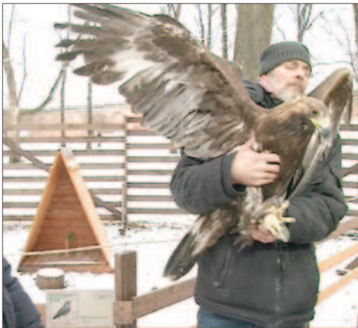
В Соколовия двор във Велики Новгород

Соколовият двор във Велики Новгород работи от 2016 г. Тук всеки може да се запознае с традициите на лова със соколи. Навремето новгородските гледачи на