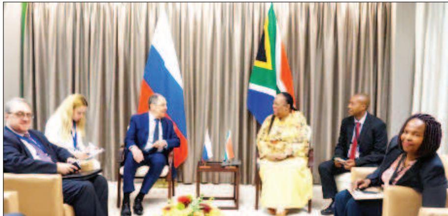
В Претория Лавров се среща със своя южноафрикански колега Наледи Пандор, с която обсъдиха двустранното сътрудничество и световните проблеми

ето поискам, а за онова, което ти искаш да правиш, ще си помисля". Това са опити да бъдат внедрени елементи на неоколониалната политика, каза тя.