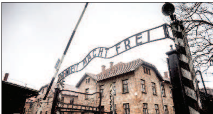
Освободителите не са добре дошли на годишнината от освобождаването на лагера на смъртта

"Такава покана не е постъпвала в посолството. Както следва от информацията, публикувана на сайта на музея "Аушвиц-Биркенау", в помещението, където ще се състои основното меропри-