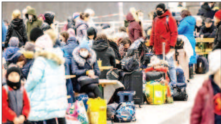
Беженцы с Украины в Британии пожаловались на "социальную смерть"

Многие украинские беженцы, находящиеся в Великобритании, становятся бездомными после окончания программы спонсорства, пишет обозреватель издания The Guardian Тоби Томас.