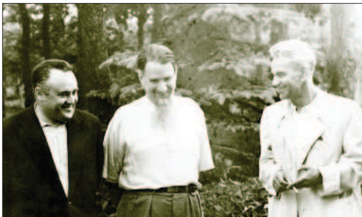
Академики Сергей Королев, Игорь Курчатов и Мстислав Келдыш. Их называли "Три К" советской науки

сомневаться: "Данные показывают, что в России действительно имел место ядерный взрыв. Это, однако, не доказывает, что у них есть готовая к применению бомба". Дескать, русские что-то украли и разок бахнули, но наладить производство такого оружия им не по силам. Американская пресса тут же наполнилась сплетнями об утечках атомных секретов из США.