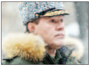
Армейски генерал Валерий Герасимов

В навечерието на 260-годишнината от създаването на Генералния щаб на Русия неговият началник армейски генерал Валерий Герасимов даде ексклузивно интервю за изданието "Аргументи и факти". Той накратко обозначи и работата на Генералния