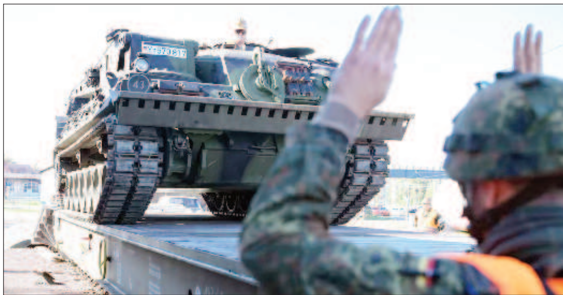
80 години по-късно германски танкове се канят отново да стъпят на древна руска земя и да стрелят срещу Русия. Би трябвало по-добре да помнят Берлин 1945

Той нарича несъстоятелни аргументите, че ядрените държави досега не са използвали в локални конфликти оръжие за масово унищожение.