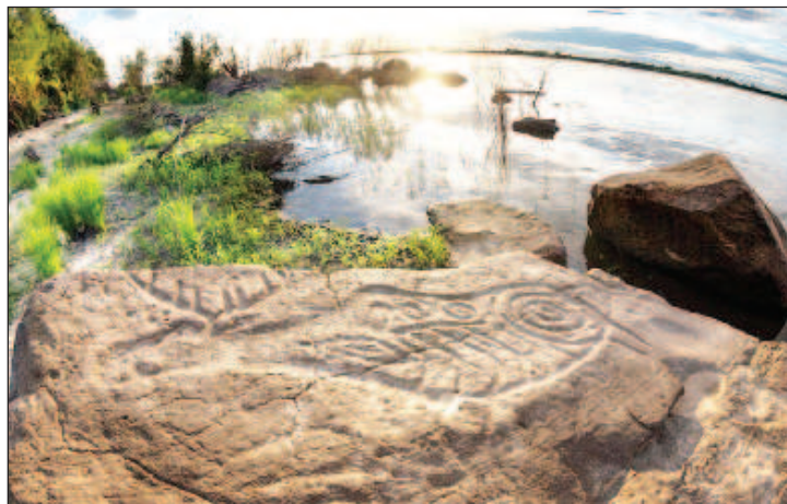
Петроглифы Сикачи-Аляна - это самые известные наскальные изображения в Хабаровском крае. Они нанесены на поверхности базальтовых валунов, которые находятся на правом берегу Амура между селами Сикачи-Алян и Малышево в 60 км от Хабаровска. Всего сделано около 300 научных описаний отдельных наскальных изображений. В настоящее время вблизи кромки воды доступны к осмотру около 200 петроглифов. Остальные были снесены проплывающими весной льдинами и находятся на дне реки. На валунах выдолблены изображения животных (лоси, лошади), сцены охоты, человеческие фигуры, сидящие в лодках люди и шаманские маски-личины

Сизиманский Каменный лес. В бухте Сизиман, что на берегу Татарского пролива, в 180 километрах на север от порта Ванино, есть уникальное место - сизиманский Ка-