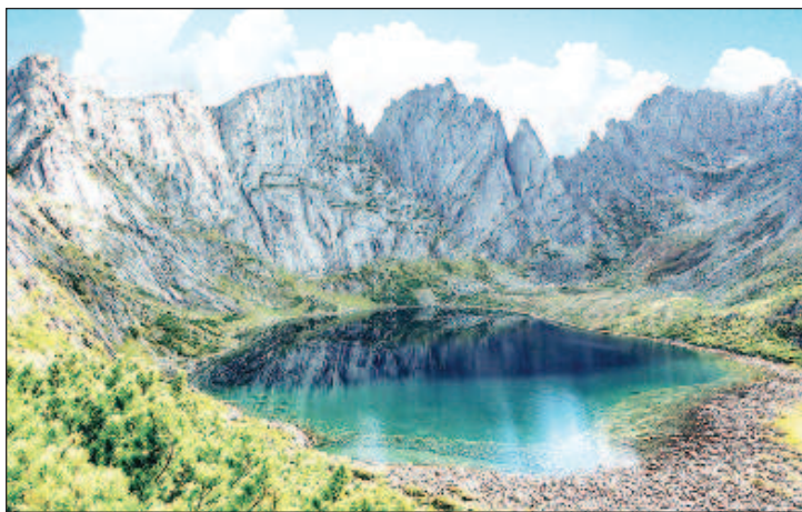
Хребет Дуссе-Алинь расположен в центре Хабаровского края и является уникальным памятником природы. Хребет замечателен своей красотой, необычностью рельефа и обилием уникальных природных объектов. Жемчужиной Дуссе-Алиня является озеро Медвежье, расположенное на высоте 1600 м. С трех сторон оно окружено скалами. Хребет Дуссе-Алинь простирается на 150 км в длину, а его высота достигает 2325 м

После ликвидации Дальневосточной республики в 1922 году была образована Дальневосточная область со столицей в Чите. Она простиралась от Байкала до Камчатки. Хабаровск и Владивосток стали центрами губерний в её составе - Приамурской и Приморской. Но уже в январе 1923 года центр Дальневосточной области переехал из Читы в Хабаровск, а в 1926-м он стал столицей Дальневосточного края.