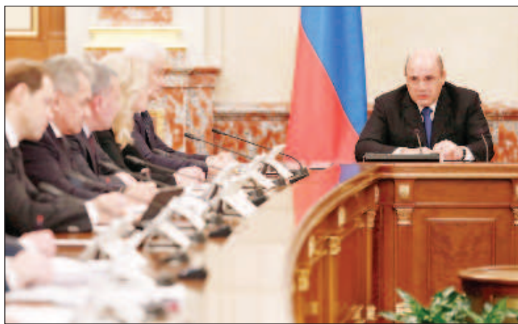
Заседание на Министерския съвет начело с Михаил Мишустин

Държавната дума утвърди Михаил Мишустин за премиер на 16 януари 2020 г. и допитването е проведено по повод тази дата. "Количеството на позитивните оценки е три пъти по-голямо от негативните - 68% срещу 22%", отбелязва Фьодоров. 22% от респондентите са оценили работата на Министерския съвет като "еднозначно добра", 46% - "поскоро добра", 14% - "по-