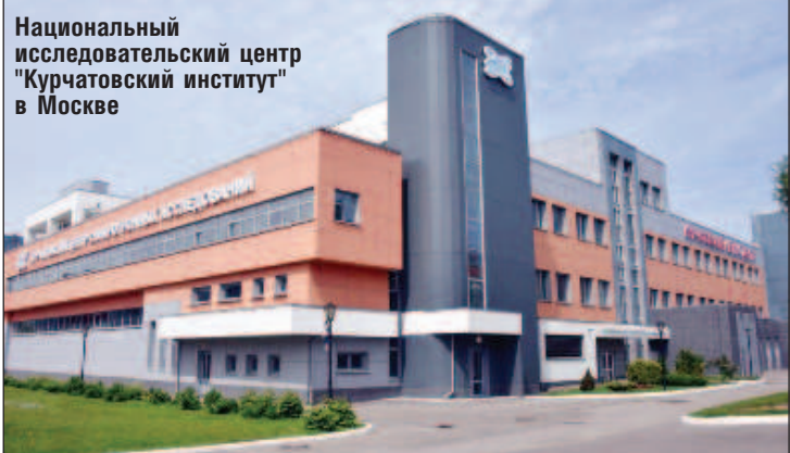
Национальный исследовательский центр "Курчатовский институт" в Москве