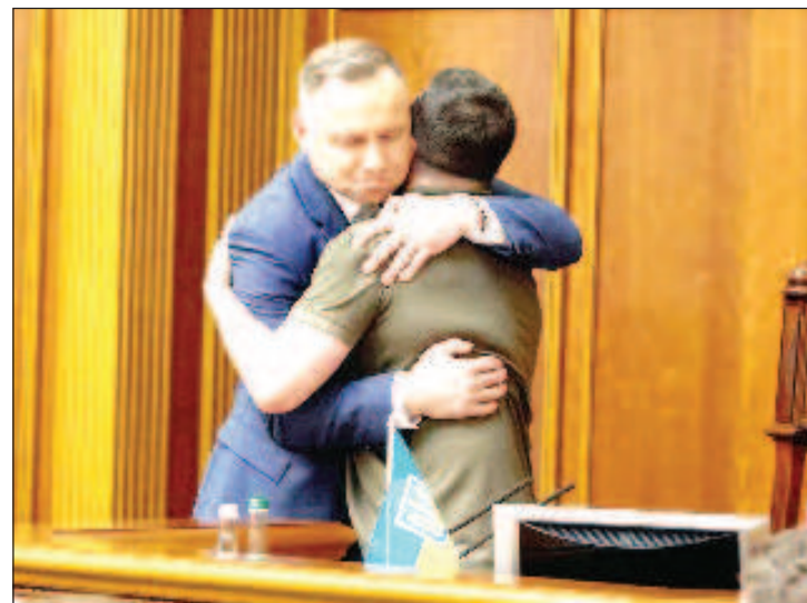
Дуда и Зеленски: Украйна в лапите на Полша

В Полша никога не е изчезвало желанието да погълне част от украинските територии, припомни неотдавна Владимир Путин. През последните години то видимо нарасна. Руският президент отбелязва, че в Москва много добре знаят за разработваните реални планове на Варшава за съз-