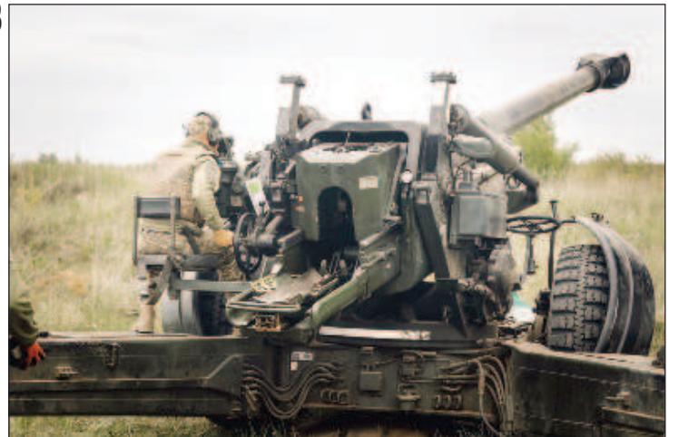
Гаубица калибра 155 миллиметров FH-70

Уточняется, что Киев получит десятки гаубиц калибра 155 миллиметров FH-70 и 122-миллиметровые D-30, тысячи артиллерийских снарядов, сотни противотанковых гранатометов M2 "Carl-Gustaf" с боеприпаса-