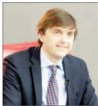
Министърът на просветата Сергей Кравцов

На 19 февруари в Москва ще бъде открита скулптурна композиция в чест на Ушински. През март ще се проведе фестивал на професионалната ориентация. Голямата педагогическа диктовка и Общоруският урок, посветени на Годината на педагога и наставника, са в програмата за септември. А за октомври е определена Голяма учителска седмица. През годината