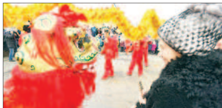
В чест на китайската Нова година във ВДНХ се изви 18-метров дракон

Пълна информация за конкурса: http://perorusi.ru/ http://perorusi.ru/blog/2023/01/объявление-о-конкурсе-2023/