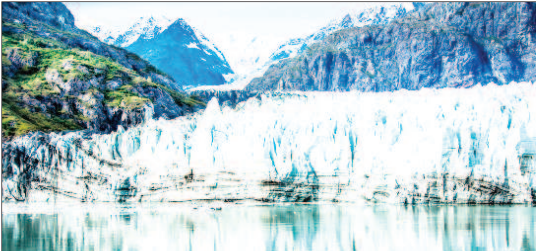
Според учените ефектите от глобалното затопляне се усещат по целия свят и вече са засегнали 80% от планетата, където живее 85% от населението. Намаляването на ледените покривки и морския лед ще доведе до по-слабо отразяване на слънчевата енергия и в резултат на това до по-нататъшно глобално затопляне

Искам да подчертая, че нашият модел прогнозира по-нататъшно ускоряване на унищожаването на ледниците и затоплянето на климата в Антарктида в близко бъдеще, поради безпрецедентно увеличение на честотата на най-силните земетресения в южната част на Тихия океан в края на XX и началото на XXI век.