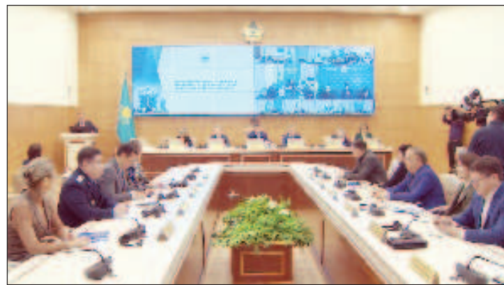
ЦИК Казахстана допустила к участию в парламентских выборах семь партий

Центральная избирательная комиссия Казахстана допустила к участию во внеочередных выборах в мажилис (нижняя палата парламента) все семь зарегистрированных политических партий. Соответствующие постановления были приняты на заседании ЦИК, запись которого доступна на сайте ведомства.