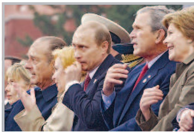
На Красной площади

построено 56,8 км магистральных дорог и 20 км - внутриквартальных. По словам заммэра, стройкомплекс Москвы уже заключил контрактов на сумму около 125 млрд руб.