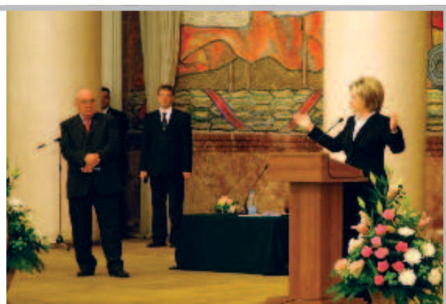
Госсекретарь США в МГУ