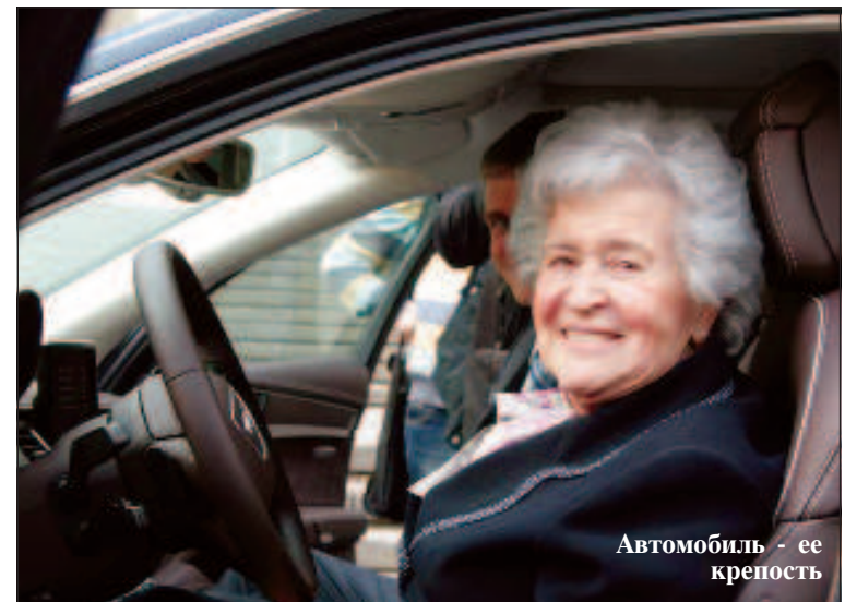
Автомобиль - ее крепость

"Москва - Берлин. Тоталитарное искусство". Данная выставка считается одной из самых смелых экспозиций музея. В конце 80-х годов по инициативе Антоновой была разработана государственная программа развития музея. В рамках программы в 1995 г. в ГМИИ был открыт музей личных коллекций. К настоящему времени собрано уже больше сорока коллекций. В 1996 г. она стала инициатором открытия Учебного художественного музея имени Цветаева. Этот отдел ГМИИ создавался на материале музейных коллекций слепков скульптуры Древнего мира, Средневековья и Возрождения. В 1998 г. в основном здании музея был открыт новый зал - Зал истории музея, экспозиция которого знакомит с важнейшими этапами создания музейных коллекций. Экспозиция показывает, как учебный музей слепков мало-помалу