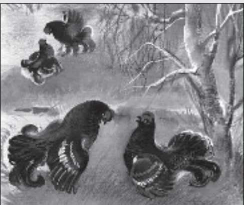
Тетерева особенно красивы весной

Ком Беземон - Сынок, мы решили копить на машину - папа перестанет пить, я перестану курить, а ты? - А я перестану ходить в школу!