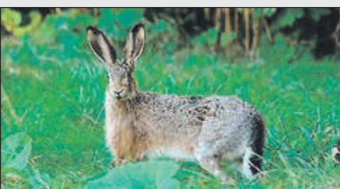
Зайцы снова стали русаками