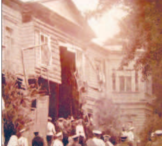
Дом Столыпина после взрыва в августе 1906 г.