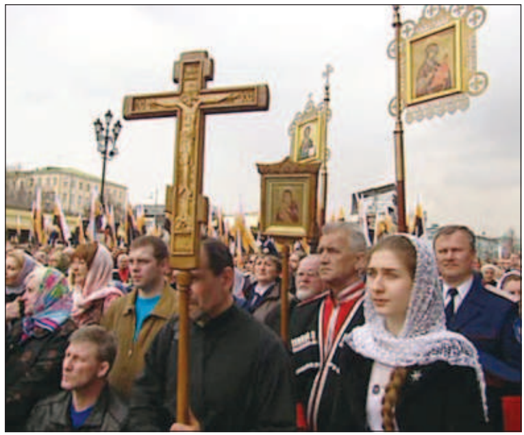
Молебен у храма Христа Спасителя перед оскверненными святынями - иконами из Великого Устюга, пострадавшими от рук вандала, и перед поклонным крестом из Невинномысска, а также перед частицей ризы Господней и ризы Богородицы - возглавил патриарх Московский и всея Руси Кирилл

последнее время произошло целая череда "актов вандализма и осквернения храмов", начавшаяся 21 февраля с акции панк-группы Pussy Riot в храме Христа Спасителя. 6 марта от рук вандала с топором пострадало 30 икон из храма в Великом Устюге, 20 марта в Покровский кафедральный собор Невинномысска ворвался мужчина с охотничьим ножом, он осквернил иконы, поклонный крест, алтарь и избил священника. В этой серии стоят и другие акции: