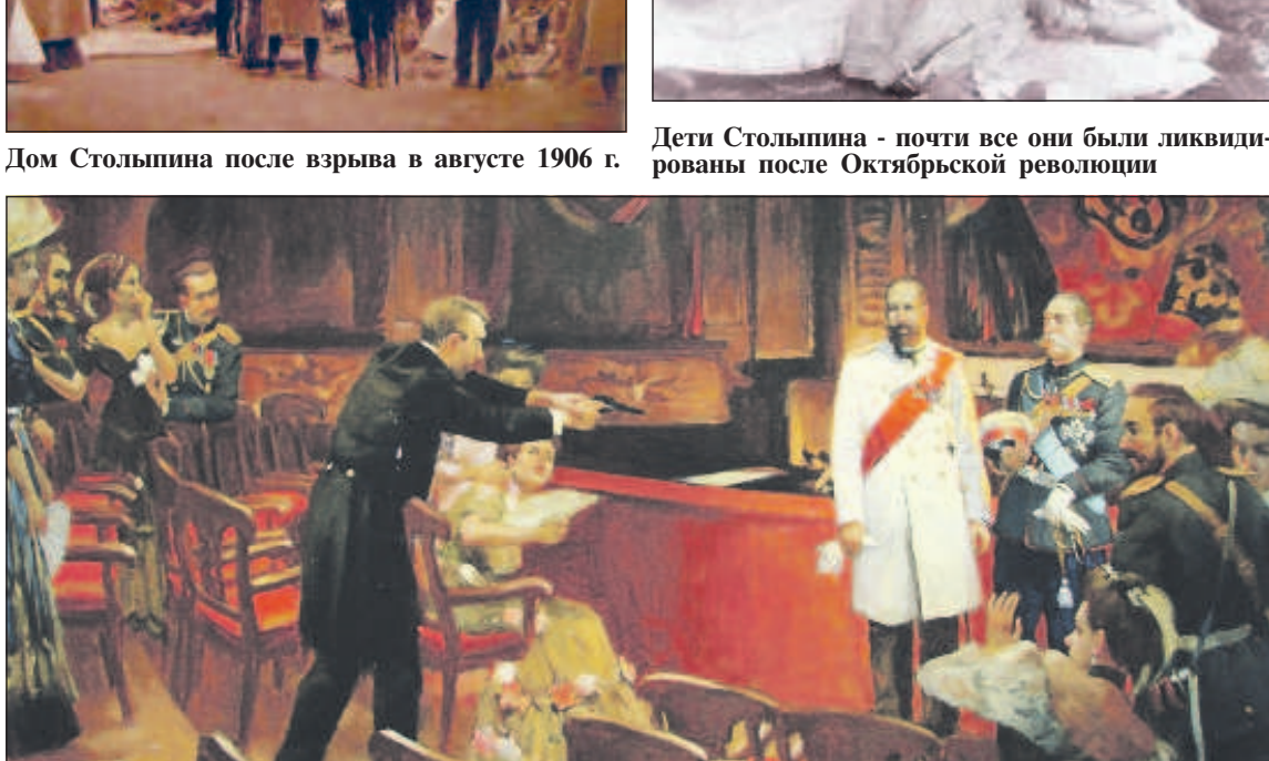
Смертельный выстрел террориста в Киевском оперном театре

В обиход вошли термины "скорострельная юстиция" и "столыпинская реакция". В частности, один из видных кадетов Фёдор Измайлович Родичев во время выступления в запальчивости использовал выражение "столыпинский галстук". Премьер, находившийся в тот момент на заседании, потребовал от Родичева "удовлетворения", то есть вызвал его на дуэль. Подавленный критикой депутатов