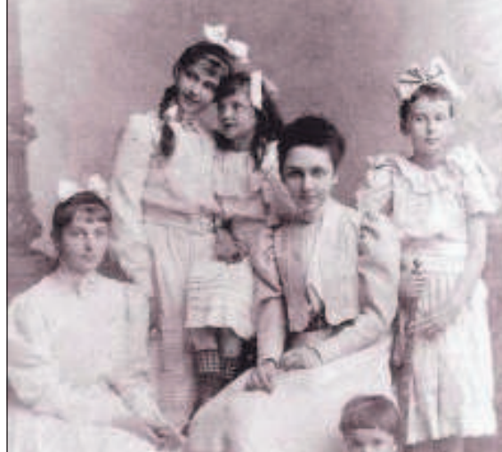
Дети Столыпина - почти все они были ликвидированы после Октябрьской революции