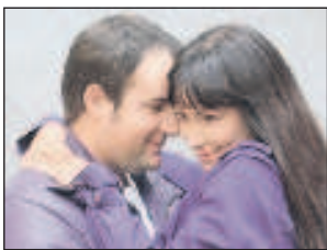
Нонна Гришаева и Александр Нестеров