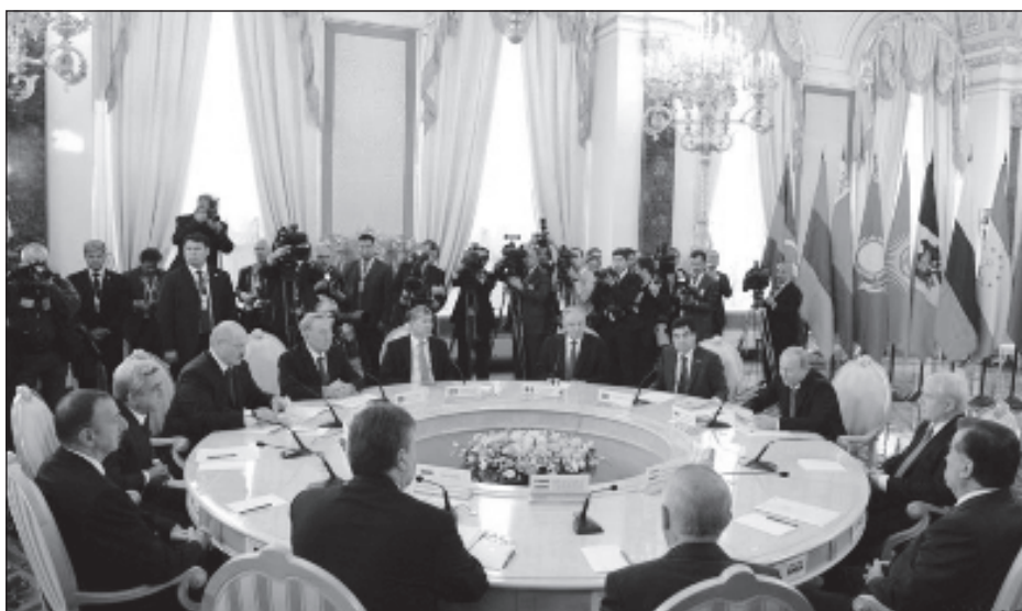
В мае с. г. Ислам Каримов присутствовал на юбилейном саммите ОДКБ, по итогам которого была принята декларация о готовности "развивать и углублять всесторонние союзнические отношения во внешнеполитической, военной и военно-технической областях" (сама организация в этом документе была названа "ключевым инструментом обеспечения безопасности и стабильности")