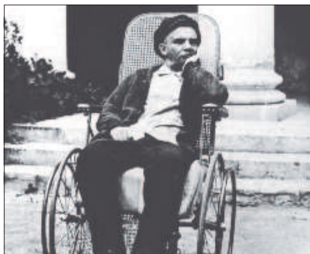
В конце своей жизни Ленин не ходил

терс отметил, что за несколько часов до смерти Ленин был активным и мог разговаривать. Он рассказал, что при вскрытии были проведены токсические анализы, которые выявили бы отравление.