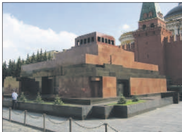
Мавзолей в Москве

В 1921 г. состояние здоровья вождя стало ухудшаться, у него случались инсульты, чередующиеся с периодами улучшения. Позже у Ленина парализовало правые конечности, про-