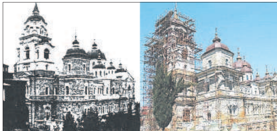
Андреевский собор самый крупный на Афоне вмещает 5 тыс. человек был построен на средства Сибирякова. В начале 20-го века за грандиозные размеры его называли "Кремлем Востока".

жила в Иркутске, здесь в 1860 г. и родился Иннокентий. В 15 лет, оставшись после смерти родителей сиротой, он