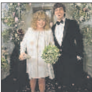
Алла Пугачева и Максим Галкин

Это, пожалуй, самая известная и обсуждаемая пара на просторах всего бывшего Советского Союза! Десять лет подряд, с тех пор как Примадонна начала встречаться с юным юмористом, все только и ждали, когда же ей надоеет очередная "игрушка". Но прошло вре-