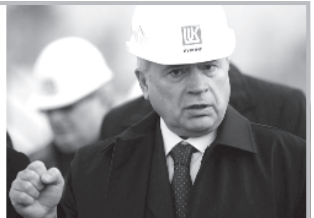
Такие люди, как шеф "Лукойла" Вагит Алекперов, двигают экономику РФ вперед