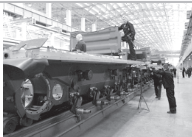
Сборка танков в цехе Научно-производственной корпорации "Уралвагонзавод".