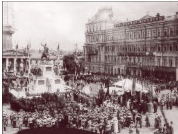
Открытие памятника Скобелеву на Тверской площади в 1912 г. Теперь на его месте памятник Юрию Долгорукому

в качестве представителя генерального штаба побывал в многих военных походах на южных рубежах России. В стычках с противником получил несколько ранений, но всегда оставался в строю. Его мужество и храбрость были замечены всеми. Отважный офицер получил свою первую боевую награду - орден святого Георгия 4-й степени. В 1874 г. Михаил Дмитриевич был произведен в полковники и флигель-адъютанты, женился на фрейлине императрицы княжне Марии Гагаринной, но уютная семейная жизнь была не для него - в 1876 г. его брак был расторгнут. Он добивается направления в Туркестан. Именно там к нему пришла первая слава. Одетый в белый мундир, на белой лошади Скобелев оставался целым и невредимым после самых жарких схваток с противником. Уже в то время сложилась легенда, что он заговорен от пуль. В апреле 1877 г. началась Русско-турецкая война для освобождения Болгарии. Скобелев решил непременно в ней участвовать. Казалось, что этого дела он ждал всю жизнь. Всеизвестны его подвиги на болгарской земле, почти не было большого и решительного для исхода войны сражения в котором он не принимал уча-