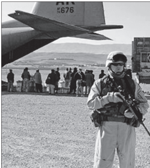
База германских ВВС в Узбекистане

Постоянный представитель России при ООН заявил, что в Афганистане в ходе антитеррористических мероприятий выдавливают террористов к границам Средней Азии - передает ИА REGNUM. Как сообщает Центр Новостей ООН, на заседании Совета Безопасности ООН в Нью-Йорке в среду Чуркин привлек внимание участников заседания к обстановке на севере Афганистана, куда вследствие антитеррористических мероприятий происходит выдавливание террористов. "Это несет непосредственную угрозу безопасности наших центральноазиатских партнеров по СНГ", - заявил постпред РФ. Афганистан имеет общую границу с Таджикистаном, Туркменистаном и Узбекистаном. При этом самая протяженная линия границы - 1344 км - между Таджикистаном и Афганистаном, большая часть которой проходит по сложному горному рельефу, что и является причиной трудностей в ее охране. На прошлой неделе спецслужбы Афганистана заявили, что вооруженные группировки причастные к террористической сети "Аль-Каида" и движению "Хакани" пытаются прорваться из Пакистана в Таджикистан с целью осуществления террористических актов.