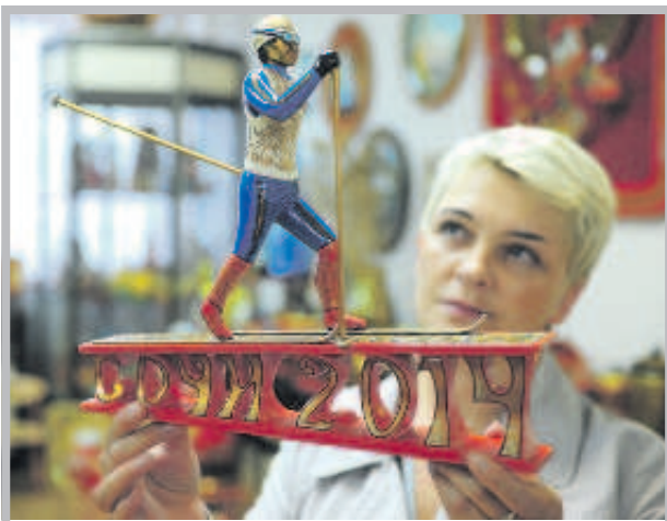
Хохлома - это не только ложки и матрешки