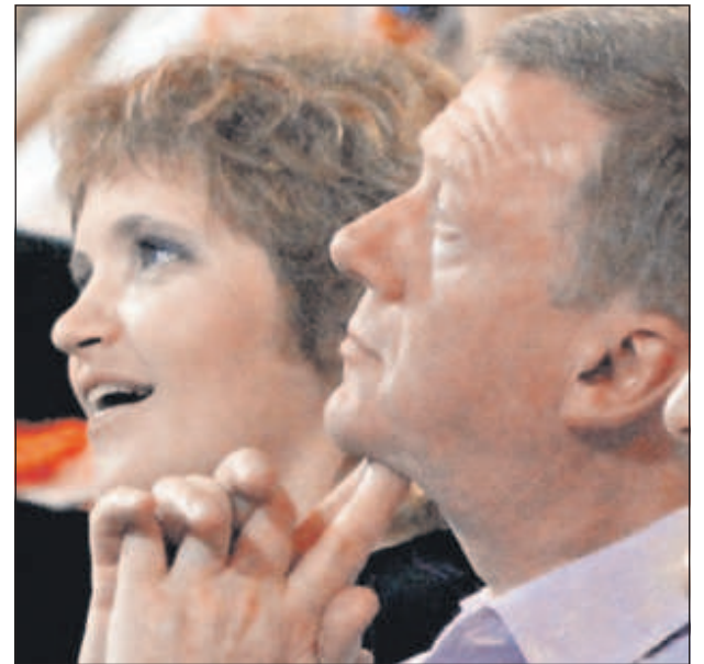
Анатолий Чубайс и режиссер Дуня Смирнова

О свадьбе главы "Роснано" Анатолия Чубайса и режиссера Дуни Смирновой пресса шумела еще полгода назад. И вот и пара впервые появилась на публике вместе. Анатолий Борисович прилетел на "Кинотавр" поддержать на конкурсном показе фильм жены "Кококо". Особых восторгов картина ни у кого не вызвала, но подобные мелочи не испортили молодому празднику. Тем более что Чубайсу срочно требовалось расслабиться после инструктажа в Бильдербергском клубе - периферийной структуре "мирового закулисья", куда его вызывали вместе с оголтелым оппозиционером Гарри Каспаровым. Ни один из фильмов конкурсной программы "Кинотавра" не вызывал такого ажиотажа, как "Кококо" Дуни Смирновой. Впрочем, актеры не скрывали истинного мотива. Всем хотелось воспользоваться случаем и постоять рядом с демонической личностью - Анатолием Чубайсом. "Ведь все их жалкие киноэкранные кривлянья и ужимки, вместе взятые, повлияли на судьбу страны в миллионы раз меньше, чем десяток его размашистых подписей", - комментирует "Экспресс газета".