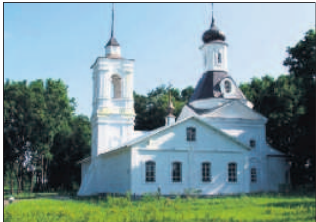
В Спасо-Преображенской церкви в родовом имении покоится прах Белого генерала

Офицеры-штабисты - недолюбливали Скобелева, завидуя его успехам, шептались за его спиной, что он позер, который нарочито щеголяет своей отвагой, презрением к опасности и к смерти. „Он знал, что ведет на смерть, и без колебаний не посылал, а вел за собой. Первая пуля - ему, первая встреча с неприятелем была его. Дело требует жертв, и, раз ре-