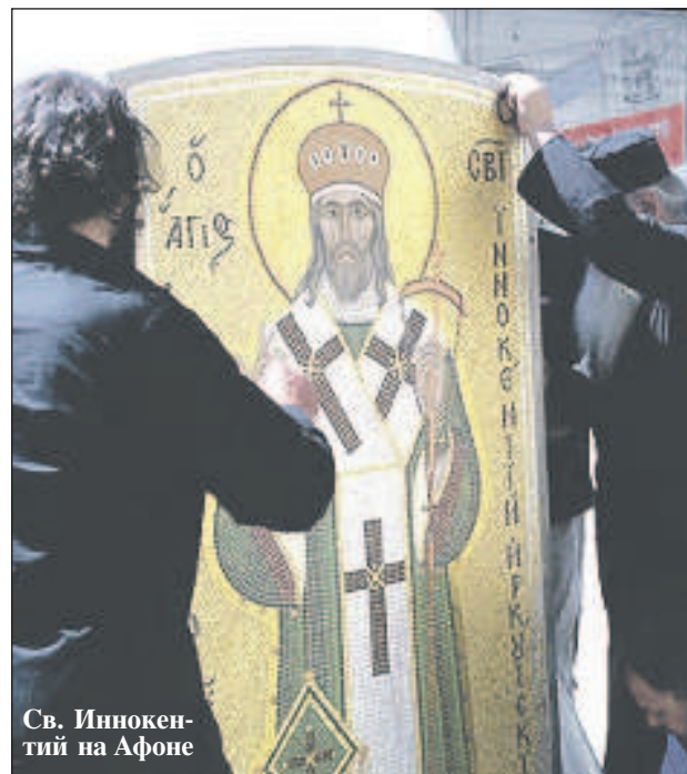
Св. Иннокентий на Афоне

Вся жизнь схимонаха Иннокентия является ярким примером для наших состоятельных соотечественников, которым монах-миллионер показывает, что и богатство может возвести на Небо, если распоряжаться им по заповедям Божиим.