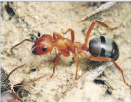
Муравей много работает, но не потеет