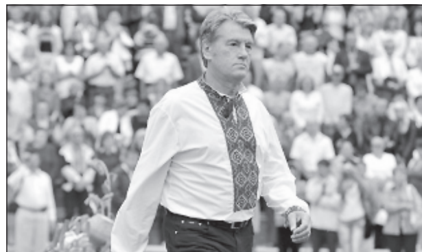
Ющенко снова идет на выборы

Виктор Андреевич Ющенко в последние месяцы развил бурную деятельность,