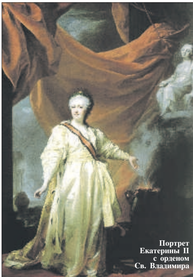
Портрет Екатерины II с орденом Св. Владимира

Первыми кавалерами такого ордена стали знаменитые военачальники и герои Отечественной войны 1812 года - адмирал Дмитрий