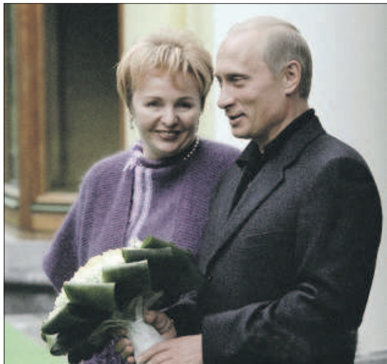
24 мая 2002 года. Владимир Путин с супругой Людмилой перед встречей с президентом США Джорджем Бушем

бота по еще большей концентрации капитала в руках элиты, что необходимо предпринять какие-то сложные секретные усилия по обеспечению сохранности активов этой элиты при какой-то другой власти. Тем, кто пристально наблюдал за подготовкой ухода Ельцина, нетрудно вспомнить, что и про него вплоть до новогоднего отречения от президентства говорили, что он никогда не расстанется с властью, что "семья" этого не допустит. Но трудно предположить, что человек, стоящий во главе огромной страны, мыслит категориями "сохранности активов", разными вариациями понятия "семья" и прочими, крайне локализованными интересами. Похоже, история такого не допускает. Нынешняя тактика Путина, какой мы ее видим на протяжении последнего года, скорее показывает, что он ищет новую конфигурацию политических и экономических сил, которые позволят развивать страну