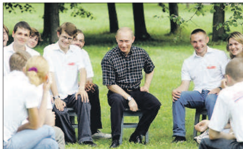
Путин часто встречается с молодежью

Эти несомненные успехи во многом объясняют (правда, скорее с точки зрения западного обывателя или политика) популярность Путина. В любой