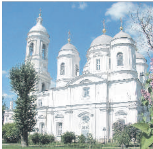
Князь - Владимирский собор в Питере

После Октябрьской революции Императорский орден Равноапостольного князя Владимира был упразднен. В отличие от других высших государственных отличий, как ордена Св. апостола Андрея Первозванного, Св. Георгия, Св. Александра Невского и Св. великомученицы Екатерины, он так и не был восстановлен. В 1957 г. одна Русская православная церковь учредила свой орден Святого Владимира в 3 степенях в ознаменование 40-летия восстановления Патриаршества в России. Первоначально орден предназначался для награждения представителей зарубежной православной Церкви и других вероисповеданий. В центре нагрудного знака изображение Св. князя Владимира и по кругу надпись - "За церковные заслуги". Среди кавалеров - патриархи Алексий I и Алексий II. В 2002 г. ныне покойный Святейший Патриарх Московский и всея Руси Алексий II за заслуги перед Отечеством и в связи с 50-летием со дня рождения вручил президенту Владимиру Путину отличие Русской православной церкви - орден святого равноапостольного князя Владимира.