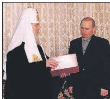
Патриарх Алексий II вручает Путину церковный орден Св. Владимира

тавитель знаменитого "Толкового словаря живого великорусского языка", которым широко пользуются до сегодняшнего дня. Но помимо того Даль написал еще 145 повестей и рассказов, 106 историй для сборника "Матросские досуги", 62 истории для сборника "Солдатские досуги" и множество стихотворений, собрал и обработал более тысячи сказок, русских пословиц и поговорок. Далеко не полное собрание его сочинений составляют десять томов. В. И. Даль был морским офицером, потом врачом в сухопутных частях участвовал в войнах и походах, отличался в сражениях. Орден Св. Владимира с бантом он по-