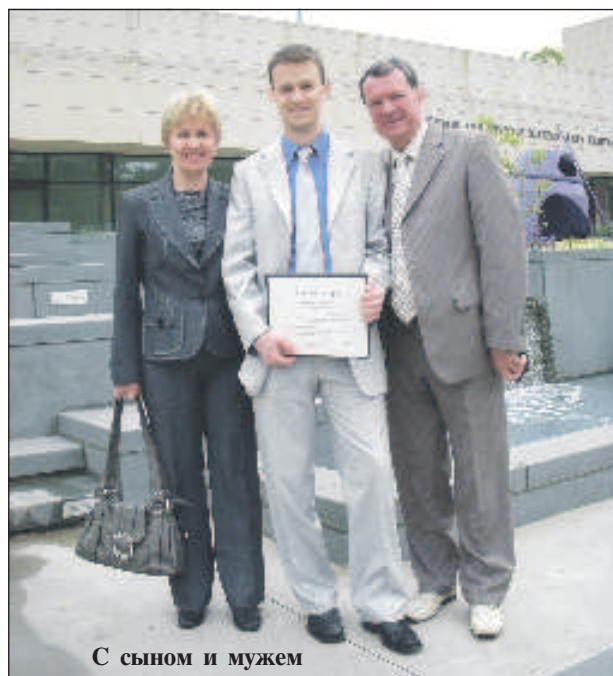
С сыном и мужем

А ведь первоначальный план замужества был совсем иной: муж - студент Ленинградского финансово-экономического института заканчивает свое образование, его жена, т.е. я - аспирантуру, и наша жизнь продолжается в колыбели Великой Октябрьской революции, легендарном Ленинграде. Но не тут-то было: хронический бронхит, который получил мой муж в "северной Венеции" навсегда оставил иллюзии в