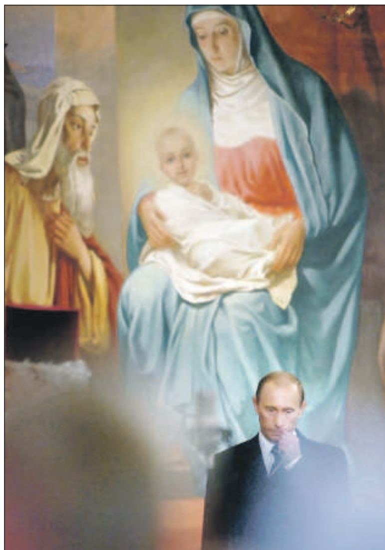
17 мая 2007 года. Владимир Путин на церемонии подписания Акта о каноническом общении и восстановлении единства в Поместной Русской Православной Церкви в Храме Христа Спасителя. Открыто взаимодействуя с церковью, Путин опирается на фундаментальные ценности, неожиданно ставшие современными, и этим, как и в случае с ОНФ, вытаскивает в сферу непосредственной политики новые социальные слои

Если посмотреть скептически взглядом на итог двадцати лет постсоветского развития страны, то мы добились только одного - страна не