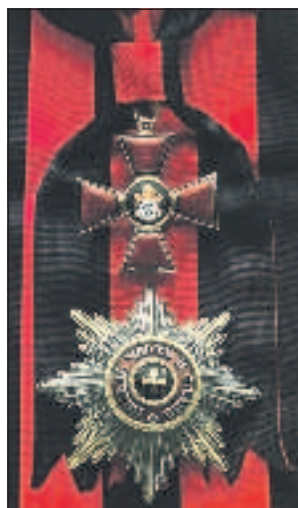
Лента, знак и звезда ордена

Владимир Иванович Даль был кавалером орденов Св. Владими-