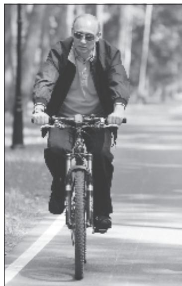
11 июня 2011 года. Председатель правительства РФ Владимир Путин во время неформальной встречи с президентом РФ Дмитрием Медведевым в московской резиденции "Горки"

в всех без исключения граждан, не существует. Не только современное, вообще сколько-нибудь сложное государство является иерархией, которая, с одной стороны, обеспечивает его управляемость, а с другой - автоматически ведет к неравному доступу к ресурсам (использование насильственного принуждения, различия в экономических позициях, ресурсах и благоприятных возможностях, в знаниях, степени информированности и т. д.), а значит, и к неравным возможностям. Поэтому, про-