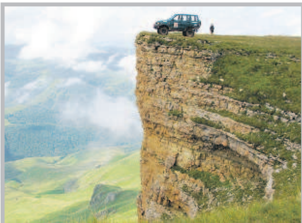
Бермамыт - плато на северном склоне Большого Кавказа, в 35 км к Ю.-З. от Кисловодска в Карачаево-Черкесской АО РСФСР. Относится к системе Кузсты Скалистого хребта. Вершинная поверхность сложена верхнеюрскими известняками. Южный Скалистый выступ, отделённый от основного плато узкой седловиной и называемый Малым Б., достигает высоты 2643 м. Основное плато, более массивное - Большой Бермамыт высотой до 2591 м. Развита задренованная и голый карст. От плато открывается прекрасный вид на снежные цепи Большого Кавказа и на Эльбрус