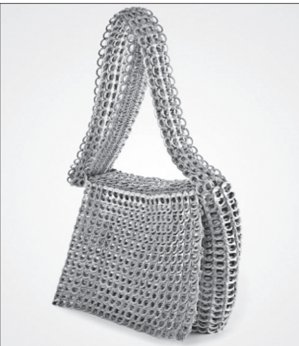
А эта сумка для любителей пива в баночках

Вы пиво пьете, фанту и другую газировку в бутылках? А пробки выкидываете? Ну и зря. Посмотрите, какую красоту можно сделать из обычных пивных пробок от стеклянных бутылок. Труда и усердия конечно вложено много, все подогнать и подогнуть, состыковать зубцы, но результат впечатляет.