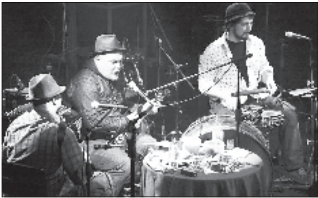
Группа Rocker Joker

Концерт белорусской команды Rocker Joker в Познани в рамках Дней белорусской культуры отменен, сообщает польские СМИ со ссылкой на местные власти. Против появления группы, чья песня "Саяна останется с нами" стала гимном президентской кампании Александра Лукашенко, выступили члены влиятельной оппозиционной партии "Право и справедливость", сообщает газета "Белорусский партизан". Издание пишет, что концерт группы должен был состояться 28 октября в рамках Дней культуры Беларуси в Познани, которые финансируются Управлением Маршала области Великопольского региона. Однако