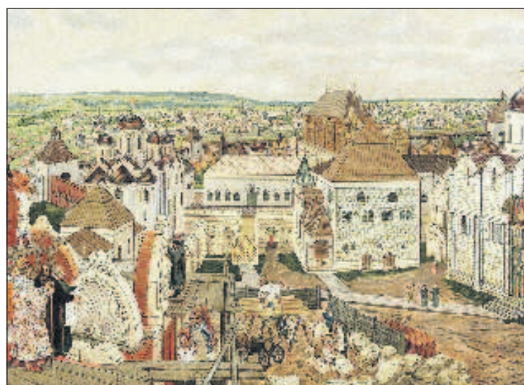
Строительство в Кремле во время Ивана III

вого класса - дворянства, которое стало опорой власти самодержца. Иван обладал жестким и упрямым нравом, ему были присущи проницательность и способность предвидения, особенно в вопросах внешней политики. Умер Иван в 1505 г., высоко подняв престиж Московской Руси в Европе. Иван III, названный Великим, был одним из выдающихся государственных деятелей феодальной России. Обладая незаурядным умом и широтой политических представлений, он сумел понять насущную необходимость объединения русских земель в единую державу. На смену Великому князю Московскому пришло государство Всея Руси.