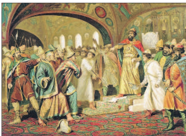
Царь Иван III разрывает ханскую грамоту

Брак Ивана III с византийской принцессой устроил папа римс-