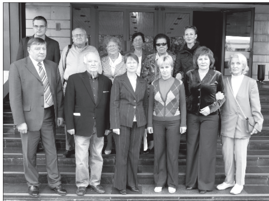
Встреча с ветеранами Великой Отечественной войны

венников в странах Балканского региона. Во время рабочих заседаний Исполнительный директор Фонда защиты Игорь Конс-