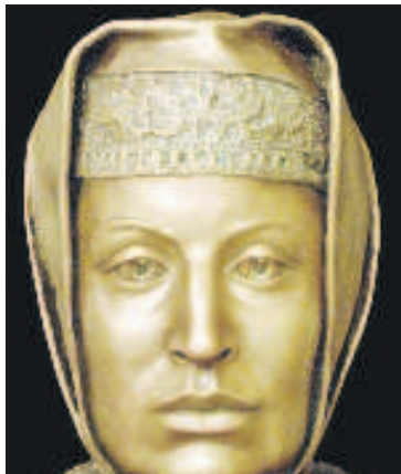
Иван Великий женился на Софье Палеолог, а вместе с ней на Русь "прилетел" византийский двуглавый орел

владелец не мог просто так называться царем или королем. Все настоящие цари и короли сочли бы это вызовом и немедленно создали бы против самозванца военный союз. Дипломаты Ивана III прекрасно это сознавали, поэтому поначалу оперировали этими титулами очень осторожно, не жалея времени на объяснения подлинного их значения. Титул "государь всея Руси" означал, что Иван III, как Юрийкович и потомок Владимира Святого, предьявляет права на все русские земли, когда-то входившие в состав Древней Руси. Титулы "царь" и "самодержец" подразумевали, что московские князья больше не данники Орды и вольны сами распоряжаться своей землей. Никто из других государей не имел права вмешиваться в их внутренние дела.