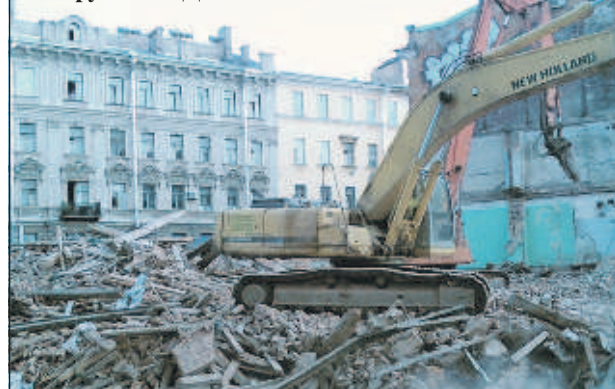
Разрушение Дома Рогова

История получила широкий резонанс, и губернатор Северной столицы Георгий Полтавченко предложил ввести строгую административную ответственность за снос зданий в выходные и праздничные дни.