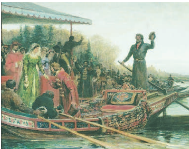
Прибытие Софьи Палеолог на Русь

Софья обладала незаурядным умом и вскоре достигла заметного влияния. По ее настоянию царь предпринял перестройку Москвы. Из Европы были вызваны художники и зодчие. Воздвигались новые храмы и дворцы. Построены были Успенский и Благовещенский соборы. Москва украсилась Грановитой палатой и Теремным дворцом. Собор Успения Богоматери тогда становится главным храмом Московского государства, а сегодня это - старейшее полностью сохранившееся здание Москвы. Строительство велось и в других городах - Коломне, Туле, Иван-городе. При Иване были введены сложные и