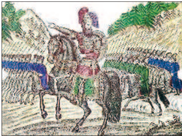
Ермак и его ратники - лубок (рисунок по дереву)

Прошло несколько лет, прежде чем русские правительственные войска окончательно закрепились в Сибири и выстроили в окрестностях Кашлыка крепость Тобольск, ставшую новой столицей края. Через тринадцать лет после гибели Ермака царские воеводы окончательно разгромили Кучума. Яркая личность Ермака произвела неизгладимое впечатление и на русских, и на татар. Сказания о подвигах Ермака были