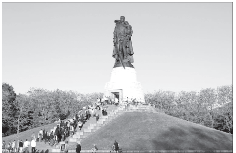
Памятник в Трептов-парке в Берлине

Наши автомобили - не новые, поэтому помощь механика может потребоваться в любой момент. Одному из "уазиков" - 22 года. Оба автомобиля получили госномера "012" - в честь 2012 года -