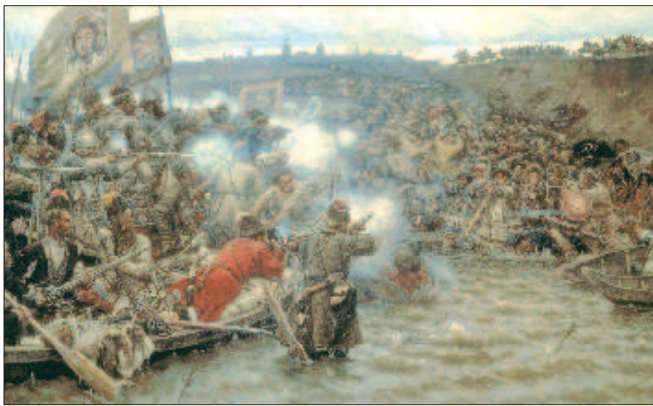
"Покорение Сибири Ермаком", художника Сурикова

Гарнизоны вновь возведенных крепостей нуждались в снабжении вооружением и провиантом. В каждом городе расселяли ремесленников разных специальностей - плотников, кузнецов, оружейников. Муку сначала доставляли по воде из Руси, однако очень скоро начали развивать сельское хозяйство в окрестностях каждого города, привлекая колонистов. Как и в случае с завоеванием русскими казанских земель, по следам государства шла церковь. Первые две сибирские церкви были возведены в Тюмени в 1586 г. К 1605 г. несколько других появилось в Верхотурье, Туринске, Мангазее и Березове. Самые первые из основанных в Сибири монастырей - Тобольский (1588 г.), Туринский и Верхотуринский (1604 г.). Главной целью церкви в ее продвижении в Сибирь было обслуживание религиозных потребностей русских поселенцев. Как и в Казани, духовенству и местным официальным лицам запрещалось прибегать к насилию при обращении местного населения в христианскую веру. Христианство, если вообще вводилось, должно было побеждать "любовью, а не жестокостью".