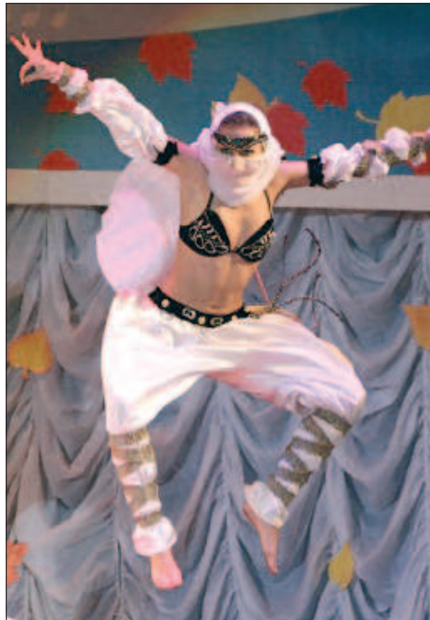
В ростовском Дворце спорта состоялся концерт по случаю открытия XVII регионального межвузовского фестиваля студенческой эстрады "Золотая осень - 2012". В нем приняли участие более тысячи самодельных артистов, творческие коллективы из 22-х вузов Южного и Северо-Кавказского федеральных округов