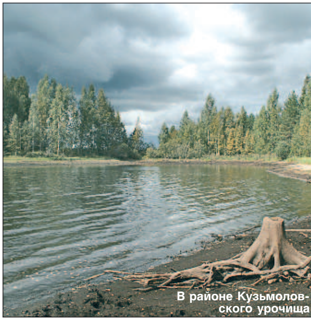
В районе Кузьмоловского урочища

- Вторая: это вход в параллельный мир, и именно