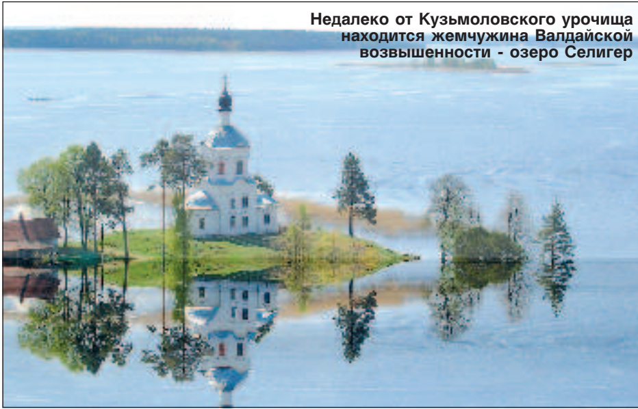
Недалеко от Кузьмоловского урочища находится жемчужина Валдайской возвышенности - озеро Селигер