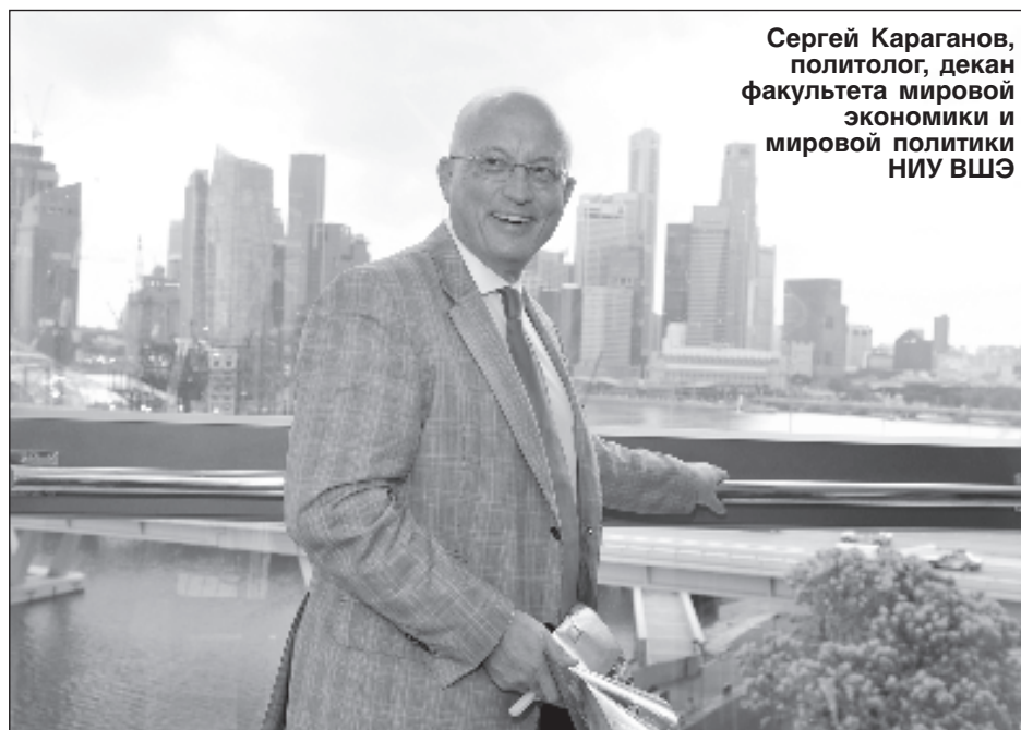
Сергей Караганов, политолог, декан факультета мировой экономики и мировой политики НИУ ВШЭ

мическое отставание другими факторами силы. И возможен ли, а если да, то когда и как, поворот к решительной экономической модернизации?