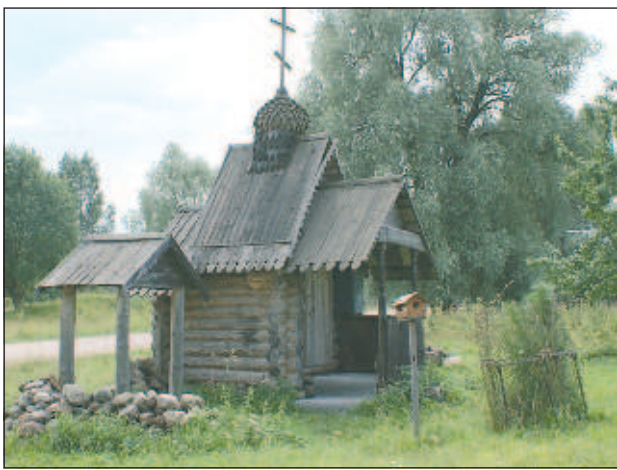
Множество обезлюженных старинных деревень уносят тайны древней Валдайской земли

туда все "проваливается". - Третья: в зоне создан волновой коллапс. Что же касается происхождения, то тут специалисты только руками разводят: может, это какой-то необъяснимый природный феномен, а может, тут вмешались инопланетяне или какие-то потусторонние силы. Но больше всего тревожит то, что каждую секунду пятно увеличивается на 8 миллиметров. Значит, через десяток лет в "зону отчуждения" попадут и такие крупные города, как Москва и Санкт-Петербург. Может, это и есть конец света?