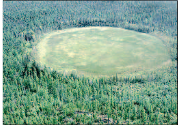
Вид на "зону исчезновения" с птичьего полета