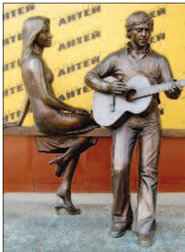
Памятник Владимиру Высоцкому и Марине Влади

Став оплотом новой власти, Екатеринбург был выбран в качестве места ссылки последнего русского царя и его семьи. Здесь, в подвале дома Ипатьева, в июле 1918 г., все члены императорской семьи были расстреляны. Через несколько дней после этого на город обрушилось наступление белой гвардии, которая удерживала здесь власть до 1919 г., но в итоге