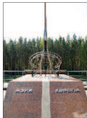
Между Европой и Азией

Послевоенный Свердловск не останавливается на достигнутом и вплоть до распада СССР он растет и разви-