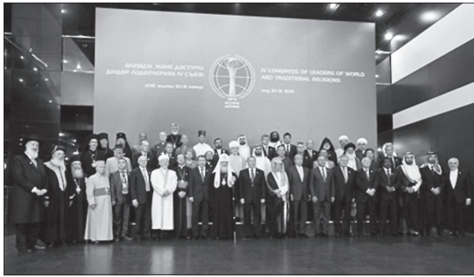
IV Съезд лидеров мировых и традиционных религий (Астана, 30-31 мая 2012 года). "Создатель - един, Вселенная - одна, небо - безбрежно, а значит всем нам - как детям одного отца и одной матери - необходимо жить в мире и согласии" (Из выступления Н. А. Назарбаева на съезде лидеров мировых и традиционных религий). Среди верующих в Казахстане имеются последователи почти всех мировых религий: ислама, христианства (православия, католицизма, протестантских течений), буддизма, а также иудаизма, индуизма, древних политеистических культов и современных новообразований.

В известной степени сильное вмешательство государства является результатом естественной слабости зарождающегося гражданского общества, которое на этом этапе недостаточно сильное, чтоб контролировать и осуществлять самоконтроль, а также справляться с экстремистскими движениями, которые получают легитимность через религию. Это было указано в Государственной программе по противодействию терроризму и религиозному экстремизму, необходимость разработки которой была вызвана именно зачистившимися проявлениями в