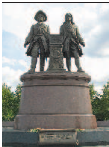
Памятник основателям - Татищеву и Де Генину

мом свою и без того значительную роль в стране. Важность города заключалась и в том, что во времена правления Екатерины Великой через него была проложена главная на тот момент дорога страны - Большой Сибирский тракт. Благодаря ему Екатеринбург стал окном в противоположную Европе часть материка. Город открыл для России путь в Азию, на просторы богатейшего Сибирского края. Строительство железной дороги в конце XIX ве-