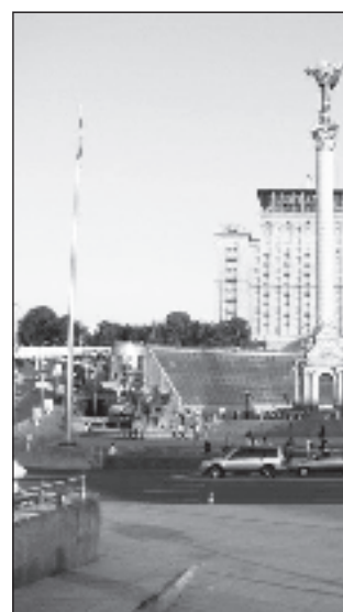
Памятник независимости Украины

висимости доминируют среди сторонников Компартии Украины. В рядах сторонников правящей Партии регио-