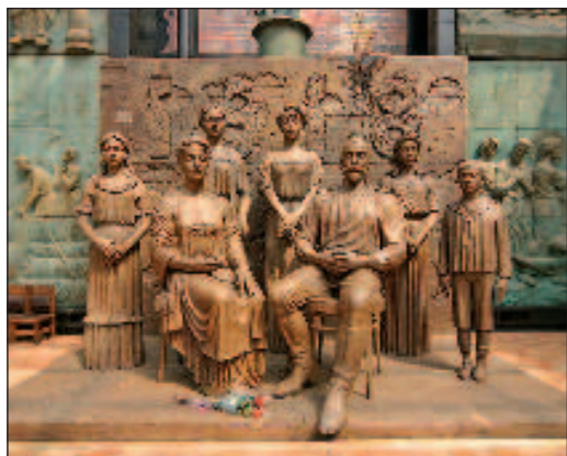
Монументальная работа Зураба Церетели, посвященная расстрелу семьи Николая II в 1918 году, в подвале дома Ипатьева (вправо)

ка только усилило торгово-экономическое значение Екатеринбурга и таким образом, в XX веке город вошел в статус полноправной столицы Урала.