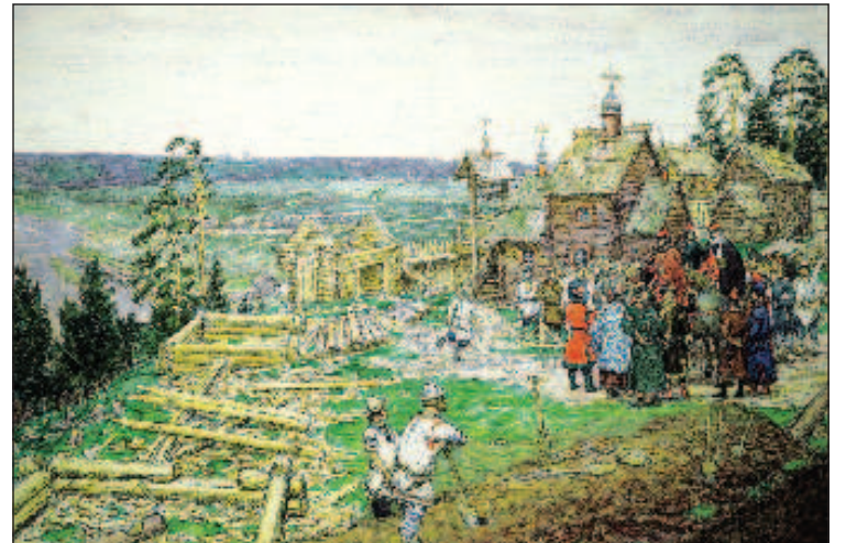
Первый кремль в Москве. Это место, на высоком берегу Боровицкого холма, на зелёном мысе, при слиянии двух рек - Москвы и Неглинной, приглянулось Юрию Долгорукому

Еще одна легенда связана с Хрущевым. Говорят, Никита Сергеевич очень не любил этот памятник и даже как-то проезжая по Тверской выразил неудовольствие по пово-