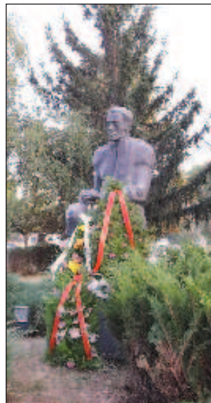
Памятник поэту Всеволоду Гаршину.

ые колонны неприятеля пошли на приступ русского редута, который с соседней высоты Карадерлибаир непрерывно обстреливался неприятельской артиллерией. В тот тяжелый день при тридцатиградусной жаре, без воды, напрягая последние силы, защитники редута на высоте Кирчанбаир отбили двенадцать атак противника, предпринятых им менее чем за сутки. В этом бою был повторен подвиг героев Шипки, о чем рассказывает писатель Гаршин в "Аязларском сражении", в котором он был ранен. В приказе по полку говорилось, что "рядовой из вольноопределяющихся Всеволод Гаршин личным примером увлек своих товарищей в атаку, чем способствовал успеху