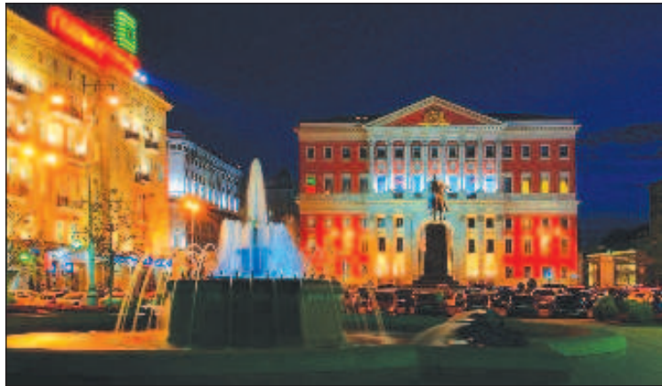
Тверская площадь с памятником перед мэрией

История самого памятника не менее интересна и полна любопытными, но мало известными широкой публике деталями. Незадолго до Первой Мировой войны Тверскую площадь переименовали в Скобелевскую, т.к. в 1912 году там поставили памятник "белому генералу", герою Русско-турецкой войны 1877-1878 гг. Михаилу Скобелеву.