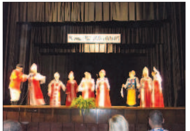
Жители Светлина горячо встретили вокальную группу "Рябинушка" и вместе с нами пели "Калинку" и "Катюшу"

который намеревался вступить во взаимодействие с Сулейманом-пашой, атаковавшим Шипку, и осажденным в Плевене Османом-пашой.