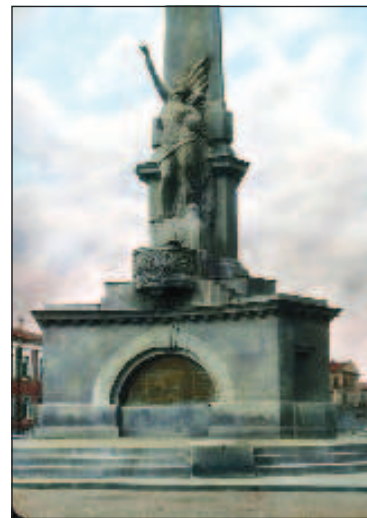
Памятник Свободы, на месте котлого сегодня стоит Юрий Долгорукий