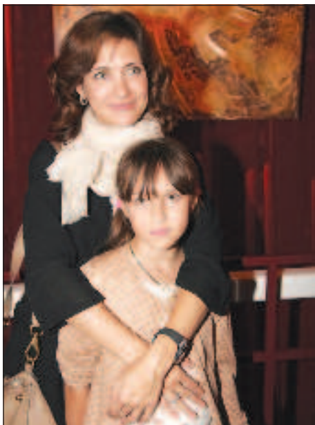
Екатерина Климова с дочкой