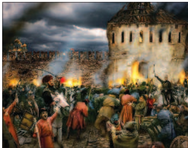
"Битва за Москву в 1612 г." - эскиз художественной панорамы

В сентябре 1611 г. энергичный и деятельный нижегородский земский староста Козьма Минин призвал к формированию нового ополчения для освобождения Москвы и России. Минина поддержали и поручили ему руководить сбором средств и распределением их среди ратников. Нижегородцы призвали возглавить ополчение Дмитрия Пожарского. Тот принял, но с условием, чтобы всеми хозяйственными делами в ополчении заведовал Козьма Минин, организаторские способнос-