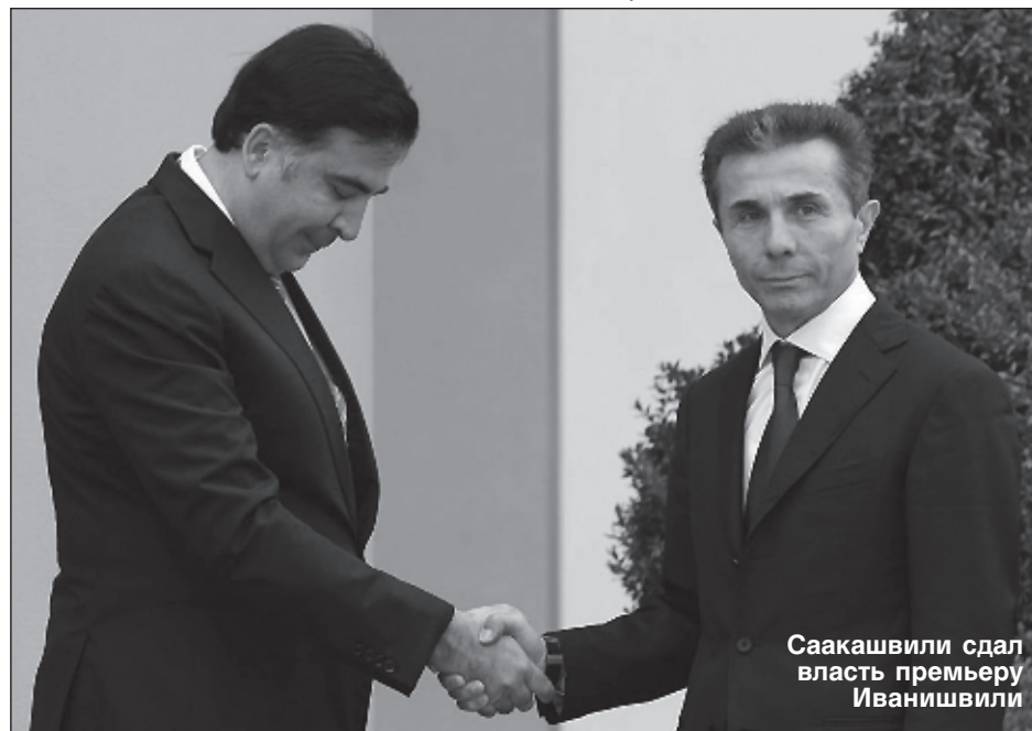
Саакашвили сдал власть премьеру Иванишвили

Конечно, фигура Иванишвили, обладателя многомиллиардного состояния и на данный момент самого влиятельного человека в республике, сегодня затмевает собой всех других политических игроков, но достичь уровня популярности Саакашвили у нынешнего премьера вряд ли получится. Тем более что он уже анонсировал свой уход из политики, и вопрос, удастся ли Иванишвили контролировать парламент и правительство из своего делового офиса, остается открытым - грузинские руководители уже не раз за последнее десятилетие демонстрировали свой буйный нрав и непредсказуемость.