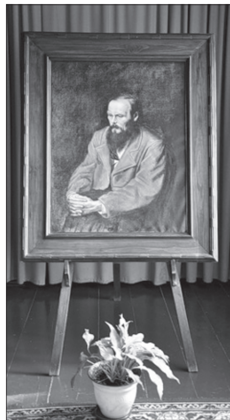
Портрет Федора Михайловича Достоевского

тостоевский сделал великое антропологическое открытие, и в этом нужно прежде всего видеть его художественное, философское и религиозное значение. В романах Достоевского нет ничего, кроме человека и человеческих отношений." Так это и есть главное! Ведь именно человек движет миром, именно он строит и разрушает, любит и ненавидит, калечит и создает. Автор прозрел, что все беды человечества происходят от самого человека, эти мысли и оставил в своих произведениях. Поэтому, Достоевского можно и даже нужно читать всем!