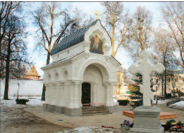
Часовня князю Пожарскому на месте усыпальницы его знатного рода в Спасо-Евфимиевом монастыре в Суздале

тивлению оккупантам призвал патриарх Гермоген, рассылавший во все города России грамоты с призывом защитить русскую землю и православную веру. Одним из самых активных деятелей "Первого ополчения", формировавшегося для освобождения Москвы в 1611 г., стал Дмитрий Пожарский. Первое ополчение однако