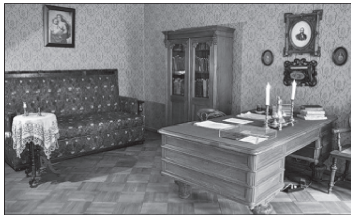
Здесь (Санкт-Петербург) Достоевский провел свои последние годы и скончался 28 января (9 февраля) 1881 г.

"Преступление и наказание", в котором была создана литературная полифония - особенность повествования, включающая разные точки зрения и повествовательные голоса. Это понятие ввел Михаил Бахтин (1929). И действительно, читая роман о "студенте, который убил то-