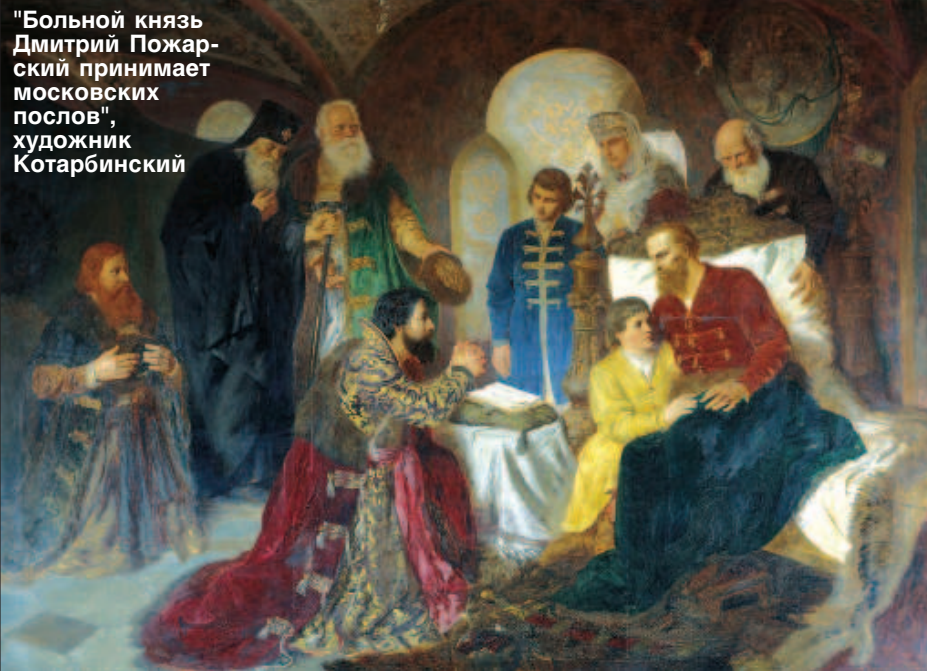
"Больной князь Дмитрий Пожарский принимает московских послов", художник Котарбинский

Умер Дмитрий Пожарский 30 апреля 1642 г. Долгое время место его захоронения оставалось тайной. Лишь во второй половине XIX века было доподлинно установлено, что князь похоронен в родовой усыпальнице в суздальском Спасо-Евфимиевом монастыре. С годами усыпальница была разрушена, однако сама могила князя оказалась нетронутой. В 2009 г. усыпальница была восстановлена и открыта 4 ноября, в день освобождения Москвы от польской шляхты, а сегодня - День народного единства.