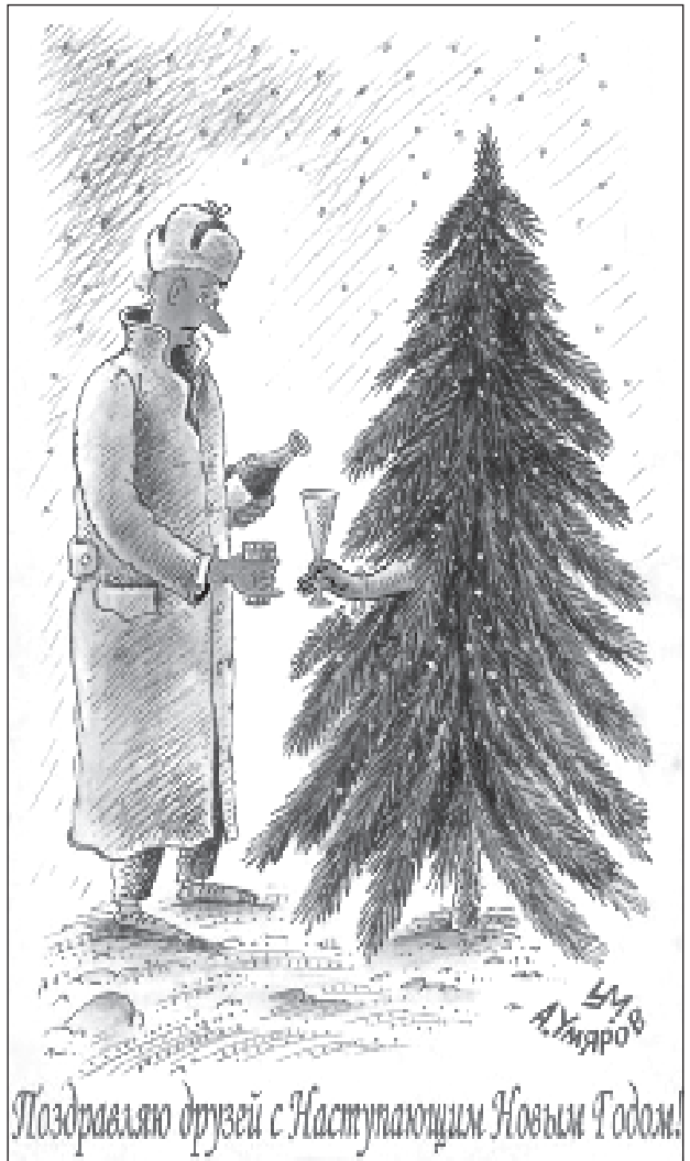
Поздравляю друзей с наступающим Новым Годом!

концерт пианиста Павлина Станчева 22 декабря 18.00 ч., Большой зал Моноспектакль Георгия Даверова "То, что было" ("Което е било") (вход по билетам)