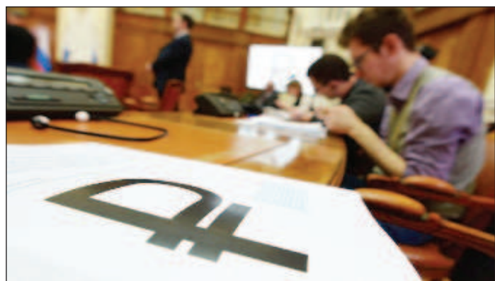
В банковских офисах рассматривают графический знак рубля

Центральный банк (ЦБ) окончательно утвердил графический знак рубля, выбрав из пяти самых популярных вариантов. За последний месяц в голосовании на сайте ЦБ участвовали 280 000 россиян. Победителем стало перечеркнутое изображение буквы "Р". Оно приглянулось более 60% граждан. Теперь этот значок будут использовать в официальных и платежных документах.