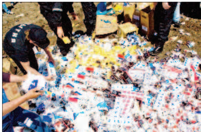
Очередная задержка контрафактных сигарет

По оценкам "БАТ Россия", из-за нелегалов в 2013 г. госбюджет недополучит 3,3 млрд. рублей акцизных отчислений от табачной отрасли. По плану акцизные сборы от "табачков" в 2013 г. должны составить 281 млрд. рублей. В 2012 г. акцизные сборы от продаж сигарет в России составили 187,8 млрд. рублей.