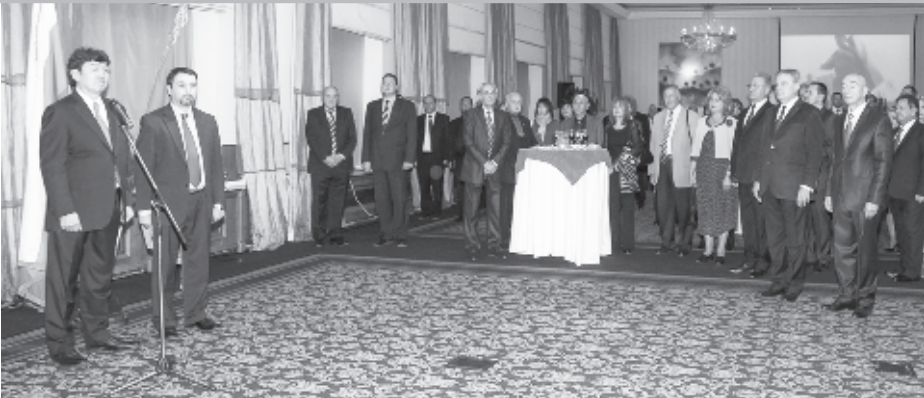
На снимке: посол Казахстана Темиртай Избастин и заместитель министра иностранных дел Болгарии Ангел Величков.

По случаю национального праздника Казахстана - Дня независимости, 16 декабря 2013 года Посольство Республики Казахстан в Болгарии организовало прием. В этом году отмечается 22-летие независимости республики. На приеме присутствовали дипломаты, политики, писатели, журналисты, спортсмены, представители казахской диаспоры и студенты.