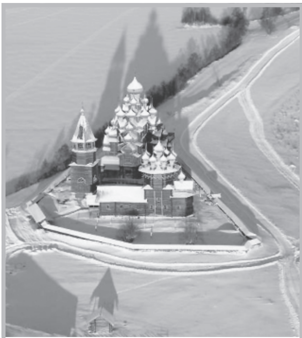
Кижы с высоты птичьего полета