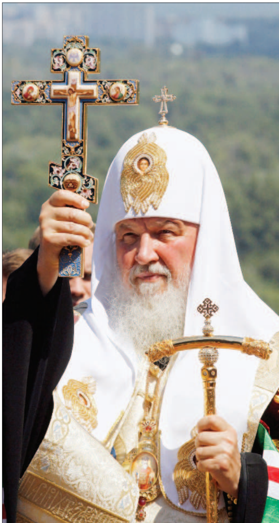
КИРИЛ - Патриарх Московски и на цяла Русия