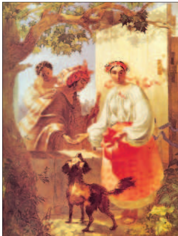
Картина Тараса Шевченко "Цыганка-гадалка"