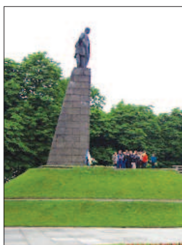
Шевченковский национальный заповедник. Могила и памятник поэту на "Тарасовой горе" в городе Каневе, Черкасская область

речения про императрицу. И за это Шевченко получил максимальное суровое наказание". Его забрили в солдаты и отправили служить в Орскую крепость Оренбургского отдельного корпуса с царской резолюцией про запрет писать и рисовать. Не смотря на это, в 1848 г. в качестве художника Тарас Шевченко был включен в состав экспедиции по исследованию Аральского моря, где активно рисовал акварелью пейзажи и портреты. В 1851 г. художник был включен также в геологическую экспедицию в горах