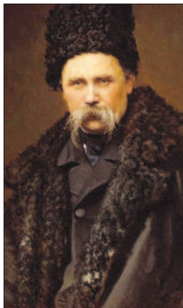
Портрет поэта, дело кисти Николая Крамского

Идеи, вроде, панславистские, но места монарху там не было. Зато были злые слова об императрице: в поэме "Сон" поэт прошелся над физическими недостатками Александры Федоровны - нервным тиком, который появился у нее после восстания декабристов. Илона Малкаева, хранитель мемориальной мастерской Шевченко Российской академии художеств комментирует: "Император Николай Первый смеялся, когда услышал гадости про себя, но посуровел, когда прочитал такие из-