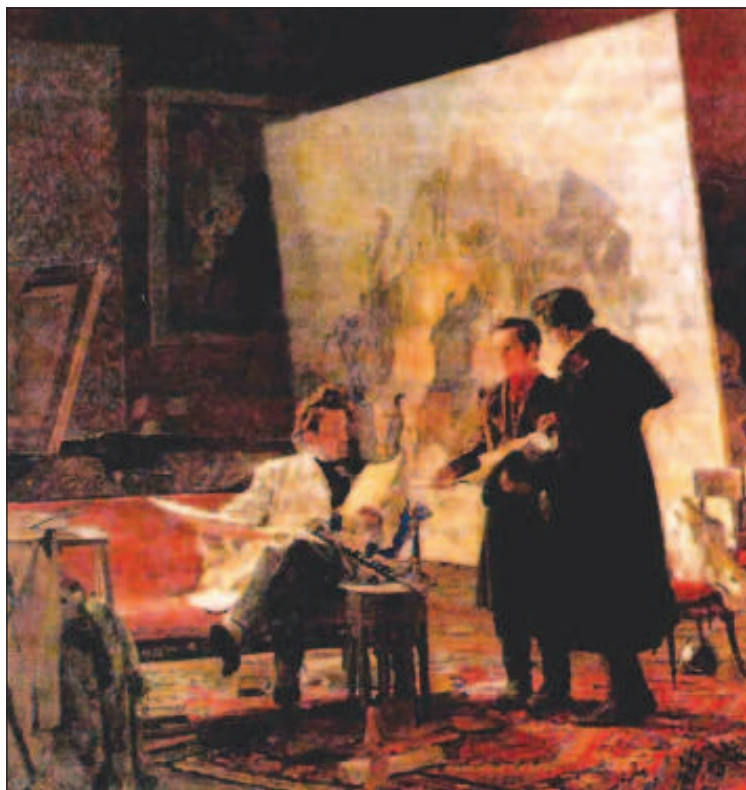
Картина Крамского "Молодой Тарас Шевченко у художника Брюллова"

Григорьевич говорил, писал дневник и прозу на русском языке. А стихи шли как будто из другой части души - на украинском.