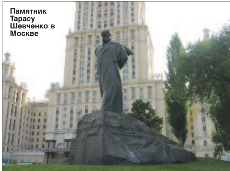
Памятник Тарасу Шевченко в Москве

В 1843 и 1845 гг. молодой писатель и не менее талантлив художник работал в киевской Временной комиссии по рассмотрению старых актов. В феврале 1847 г. его утвердили на должность преподавателя рисования Киевского университета. В 1846 г. Шевченко вошел в основанное в конце 1845 г. преподавателями и студентами Киевского университета тайное Кирилло-Мефодиевское общество, состоявшее из молодых людей, интересовавшихся развитием славянских народностей и революционными антимоноархическими идеями. В апреле 1847