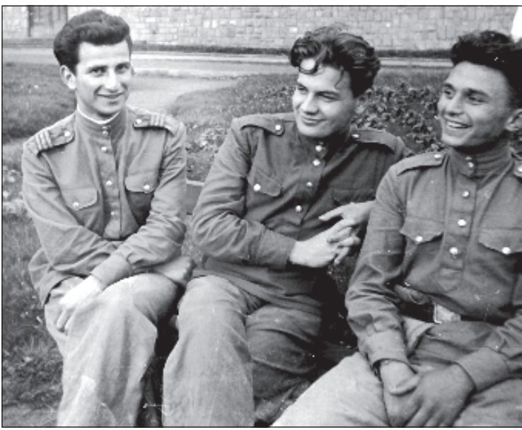
Друзья-суворовцы, в середине Петр Младенов

нерального секретаря БКП и Председателя Государственного совета в ноябре 1989 г. пленум ЦК БКП доверил ему эти высшие посты в государстве. Он - первый демократический президент республики. Бурные демонстрации, инспирированные Союзом демократических сил, вынудили П. Младенова уйти в отставку в конце 1990 г. Ушел из жизни молодым в возрасте 64 лет.