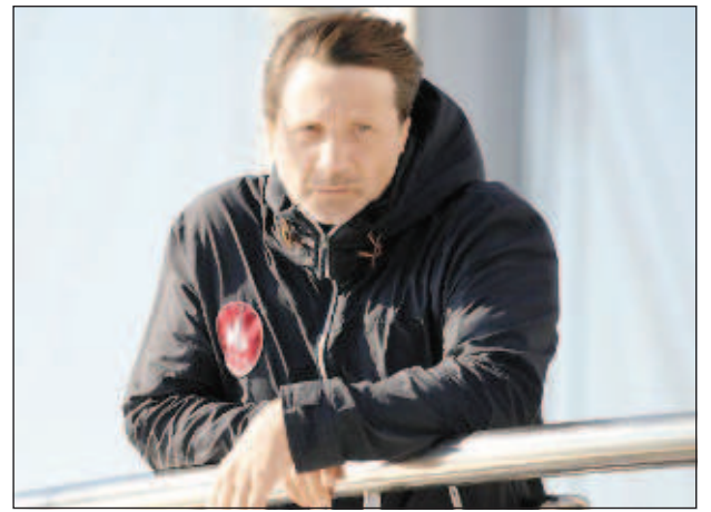
сцене не "исповедует", он либо дурак, либо не понимает, чем занимается".