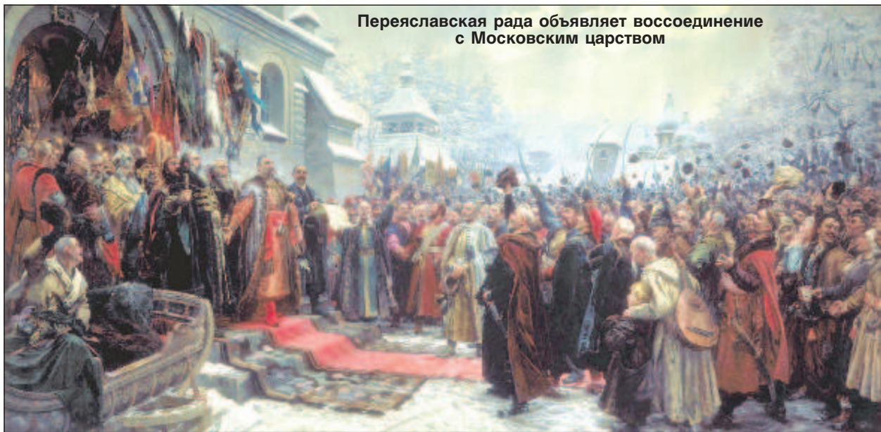
Переяславская рада объявляет воссоединение с Московским царством

Умер знаменитый гетман 16 августа 1657 г. в Чигирине. Был похоронен в Суботове. Однако, упокоение его не было спокойным: в 1664 г. польский воевода Чарнецкий сжег хутор Хмельницкого, а прах гетмана и его сына Тимоша