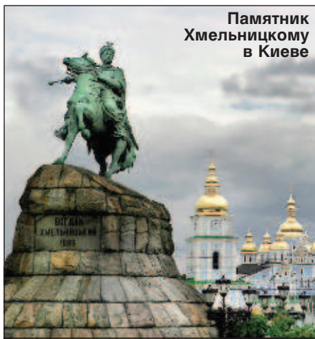
Памятник Хмельницкому в Киеве