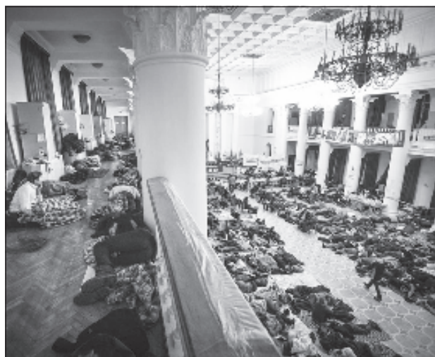
Часть захваченного сторонниками оппозиции здания Киевской мэрии

Как сообщили в мэрии, злоумышленники срезали замок с двери склада и вынесли оттуда пакеты с медалями. Позднее некоторые награды были найдены в соседних помещениях и на лестнице. В связи с произошедшим киевские чиновники обратились в милицию. В настоящее время сотрудники мэрии, сверяясь с