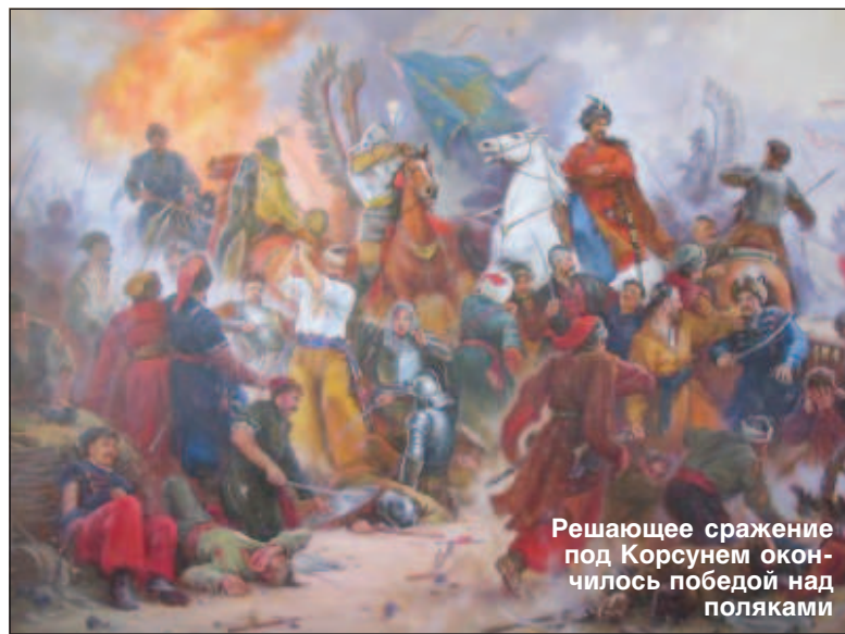
Решающее сражение под Корсунем окончилось победой над поляками