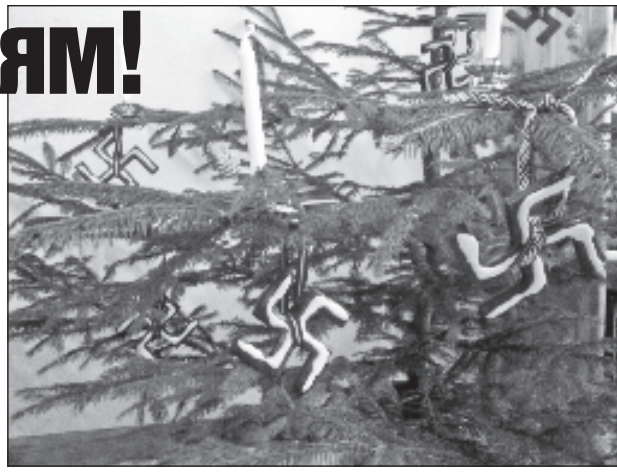
Новогодняя елка с рождественскими печеньками в виде свастики

ченье в форме свастики, судя по снимкам и подписям к ним, испек Иесалниекс или кто-то из его близких. На одной из фотографий оно изображено в процессе приготовления (подпись к фото сопровождается смайликом), при этом на вопрос читателя националист ответил, что используется электрическая духовка, а не газовая. Демонстрируя уже готовое печенье, политик отметил, что его можно вешать на елку, и добавил: в его семье приготовление выпечки в виде "огненных крестов" (одно из наименований латышской свастики) стало рождественской традицией.