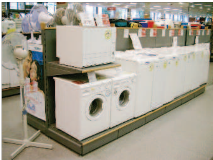
По прогнозам в 2014 г. можно ожидать снижение цен только на электронику и бытовую технику

Зато производители мяса подорожания не обещают. Тут вообще-то тоже корма дорожают, но, как объясняют эксперты, на рынке курятины и свинины очень высока конкуренция. Поэтому цены на эти продукты в 2013 г. практически не росли, а курятина так даже немного подешевела. По оценкам Национальной мясной ассоциации, конкуренция на внутреннем рынке будет и дальше увеличиваться, и это не даст ценам расти. А если не дорожают куры и свинина, это не дает дорожать и говядине. Иначе ее все меньше покупают - люди переключаются на более дешевые виды мяса.