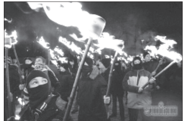
Факельное шествие националистов

Вторая жалоба поступила от сотрудника охраны отеля, который привел схожую версию. По материалам дела, "около 19:00 на бульваре Шевченко неизвестный из числа участников факельного шествия бросил в помещение отеля