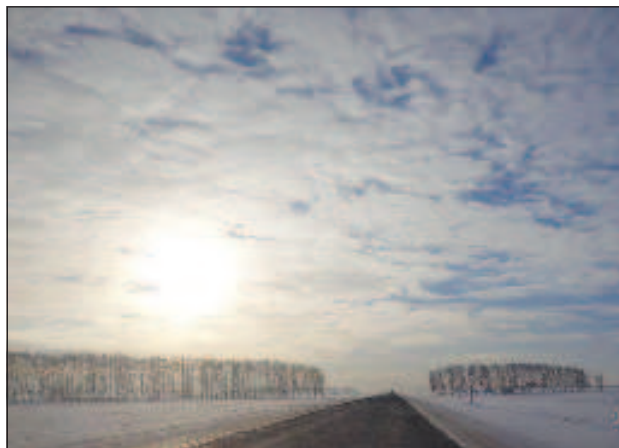
Симеон Гройсман - Награда от МОС при ФСС