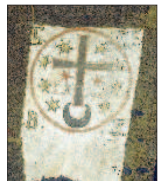
Льняная хоругвь Богдана Хмельницкого хранится в Музее армии в Стокгольме

дилось в конце XVI и в первой половине XVII веков, когда на Украине одно за другим вспыхивали восстания крестьян, казаков и мещан. В 1648-1654 годах это вылилось в широкую освободительную войну, возглавленную выдающимся государственным деятелем и полководцем гетманом Богданом Хмельницким. Удачные военные действия, дипломатический расчет, прозорливость Богдана Хмельницкого помогли ему одержать ряд побед в войне с войсками Речи Посполитой.