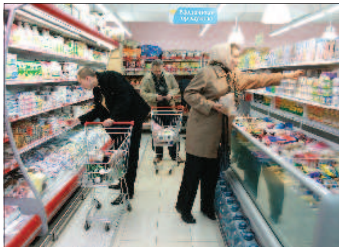
Походы в супермаркеты становятся дороже

В магазинах, торгующих через прилавок, средний чек в ноябре неожиданно (он был стабилен на протяжении многих месяцев) снизился на 8%. Однако он оказался все же на 7% выше, чем в ноябре прошлого года. В гипермаркетах, супермаркетах и дискаунтерах заметных изменений этого показателя зафиксировано не было. Исследовательская скан-панель домохозяйств основана на данных потребления 10 тыс. россиян, репрезентирующих покупательское и потребительское поведение жителей городов России с населением более 100 тыс. человек. Участники панели сканируют штрих-коды всех купленных товаров, приносимых домой.