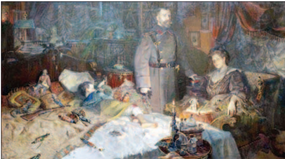
Николай II с женой и больным сыном после отречения от престола под домашним арестом в Царском селе