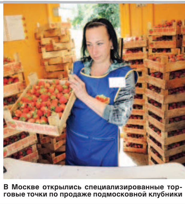
В Москве открылись специализированные торговые точки по продаже подмосковной клубники

Времена, когда на почте продавались только конверты и открытки давно канули в Лету. Теперь в почтовых отделениях вы вряд ли встретите коллекционные марки, зато, скорее всего, сможете купить семена, шампунь, тушенку и даже одежду. Бумажные письма пишут всё реже, а очереди в почтовых отделениях в основном состоят из желающих оплатить коммунальные счета или получить очередную товар, заказанный через интернет-магазин. Поэтому кон-