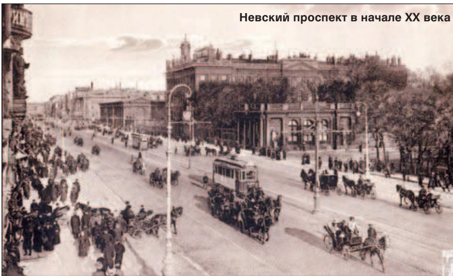
Невский проспект в начале XX века