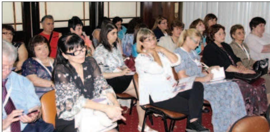
Болгарские участники форума

управления образованием и международных неправительственных организаций: МАПРЯЛ, МПО, VIALIGHT и других общественных организаций. Болгарские преподаватели РКИ, приехавшие из 21 города страны, представляли 51 учебное заведение Болгарии.