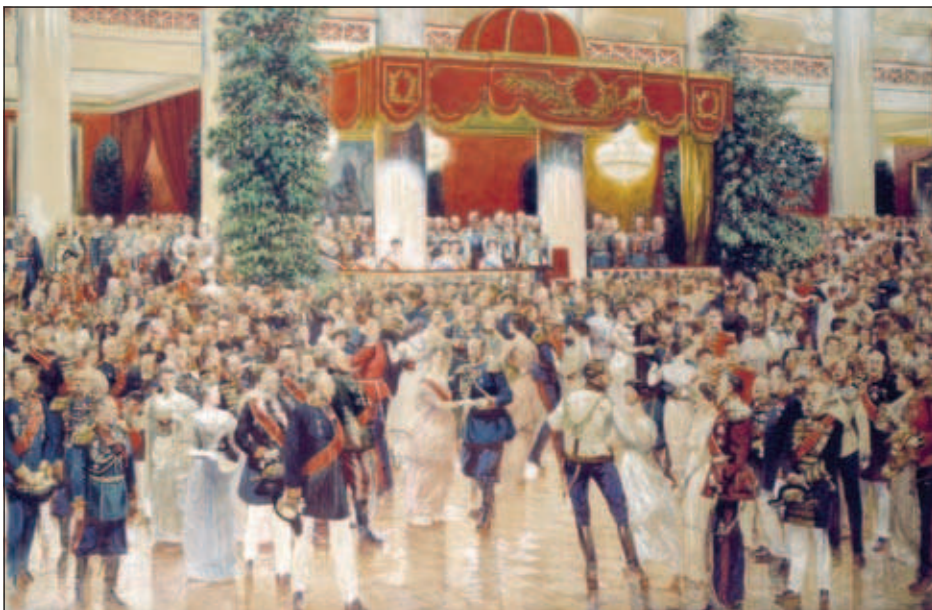
Бал в Зимнем дворце при Николаем II

После императорской четы, главное место в светской иерархии занимают вдовствующая императрица и "малые дворы" - сыновья и внуки императоров со своими семьями. У каждого "малого двора" - городская и загородная резиденция, полное государственное содержание. Петербург - город казарм, военная столица. Гвардия - сливки петербургского большого света. Великие князья, как правило, занимают в ней высшие посты. В последнее столетие существования императорской России статус гвардейцев значительно эволюционировал, а точнее, деградировал. В пушкинское время гвардия - интеллектуальная элита русского общества (Чаадаев, Лермонтов, декабристы); но в 1910-е трудно представить себе Блока или Ахматову в обществе гвардейских офицеров. Уже Вронский и Толстой - скорее физкультурники, чем интеллектуалы.