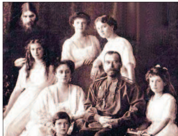
Григорий Распутин с императорской семьей

Наибольший гнев семьи и большого света вызывало растущее влияние Григория Распутина. В приближении мужика к трону видели не только блажь царицы, но и прямое оскорбление династии. Не заслуженные генералы, не ближайшие родственники, не опытные бюрок-