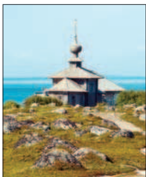
1702 году на Соловках по указанию Петра I.

5 июля 2014 года в музее-заповеднике "Коломенское" в Москве в рамках III Межрегионального фестиваля славянского искусства "Русское поле" волонтеры общественных движений "Общее дело" и "Сорок сороков" построят за сутки храм в честь преподобного Сергия Радонежского, который станет точной копией Андреевской церкви, возведенной в