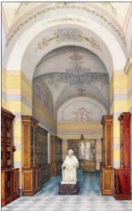
Библиотека Вольтера в Публичке

Было в этой идее и принципиально новое начало, подхваченное и укрепленное последующими поколениями. Национальная библиотека России была задумана и организована не только как книгохранилище, но одновременно как библиотека общедоступная. Ежегодно в первые годы ее посещало около шестисот читателей. Это были самые разные по общественному положению и происхождению люди. Купцы, ученые, мещане, учащиеся, чиновники, военные, представители духовенства и первые читательницы приобретали билеты на право посещения библиотеки.