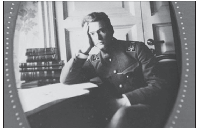
Ученый-изобретатель Владимир Зворыкин - студент Санкт-Петербургского университета