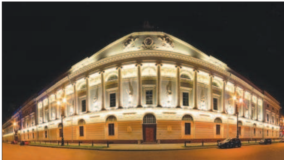
Российская национальная библиотека