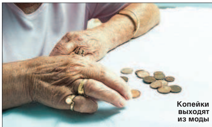
Копейки выходят из моды

С 1 января 2014 г. налоги в России уже нужно будет считать в полных рублях, применяя правила арифметики. То есть суммы менее 50 копеек отбрасывать, а 50 копеек и более округлять до полного рубля. Это официально прописано в новом Налоговом кодексе РФ.