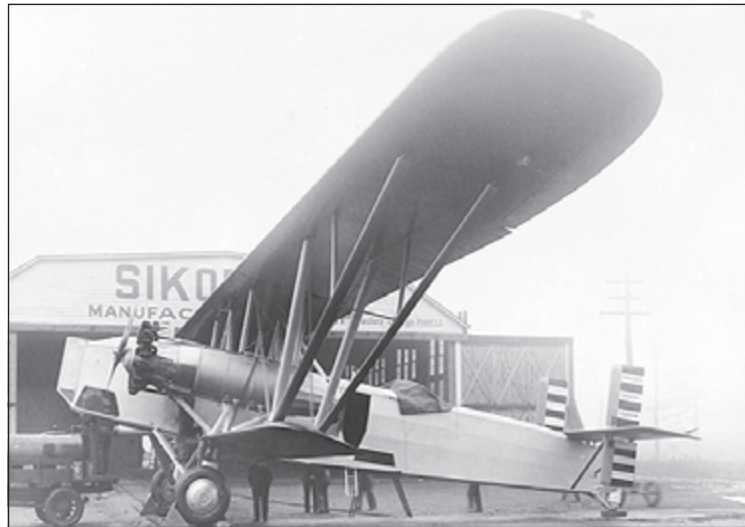
Инженер Игорь Сикорский получил образование в царской России и уже на Западе создал серию замечательных вертолётов и самолётов

выпустила в массовое производство бытовой катушечный магнитофон. А в 1956 г. он выпустил первый в мире видео-магнитофон, и все электротехнические киты - Panasonic, Sony, Samsung и др. - патент покупали у Понятова. В период расцвета компании в ней работало более 20 тыс. человек, было много филиалов в разных странах - и Понятов приказал перед каждым филиалом сажать берёзки. Когда в СССР открывали первый телецентр на Шаболовке, то закупали оборудо-