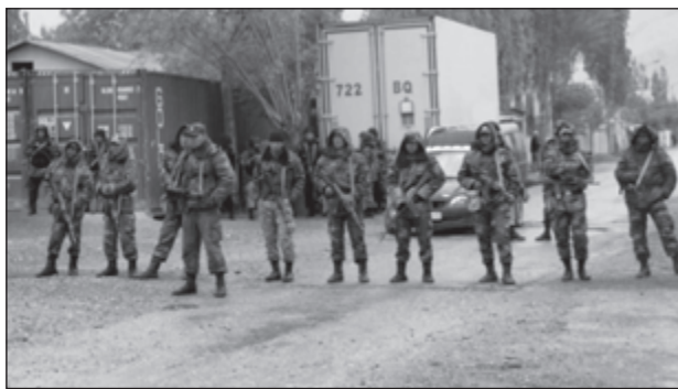
Таджикские пограничники на месте происшествия

По официальной версии Душанбе, перестрелку спровоцировали киргизы, которые в субботу, 11 января, "предприняли попытку продолжения строительных работ с использованием вооруженного прикрытия военнослужащих". Согласно этой версии, строители вместе с охраной вторглись на таджикскую территорию и были остановлены местными пограничниками. Прекратить работу нарушители отказались, после чего сопровождавшие их киргизские военнослужащие "без предупреждения открыли