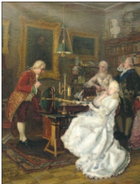
Екатерина II одобрила проект создания Императорской библиотеки

ководство Публичной библиотеки и подготовил ее к торжественному открытию. Но торжество, которого так долго ждали, пришлось отложить: на территорию России вторглись войска Наполеона, началась война. Французские войска быстро продвигались вглубь страны, и над Петербургом нависла угроза вторжения врага. Все самое ценное из фондов создающейся библиотеки погрузили на небольшое парусное судно и отправили на Север страны. Книги вернулись обратно в столицу только после окончания войны. Благодаря настойчивости Оленина, в библиотеку поступили архивы полководцев Кутузова и Ермолова, дневники, письма, мемуары участников войны и ее свидетелей.