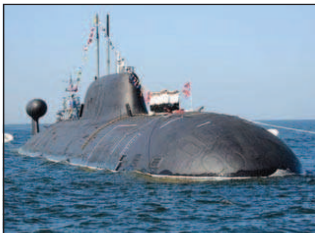
Два походных храма получили экипажи подводных лодок Северодвинска. Экипажу крейсера "Екатеринбург" передали походный храм прп. Серафима Саровского в день памяти этого святого, сообщает сайт "Правда Севера". А вооружение подводного атомохода "Князь Владимир" пополнит одноименный иконостас.

Главная цель акции - оказание жителям отдаленных сел духовно-социальной помощи. В числе участников акции - священнослужители, медицинские работники и представители органов социальной защиты области. В ходе рейда корабля-церкви для сельских жителей будут организованы: приемы врачей и проведение функциональной диагностики (УЗИ и ЭКГ), все желающие смогут воспользоваться услугами священнослужителей - принять таинства крещения, причастия, исповеди, также будет оказана безвозмезд-