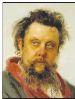
Его "Запорожцы", "Бурлаки" и портрет Мусоргского можно считать визитными карточками художника

шестилетнюю поездку за границу за счет академии.