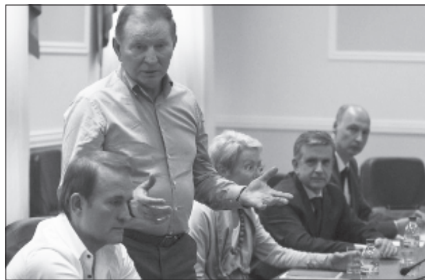
В заседании приняли участие второй президент Украины Леонид Кучма (на снимке), посол России в Украине Михаил Зурабов и представитель ОБСЕ

- С Федерикой Могерини не все так просто. Она была назначе-