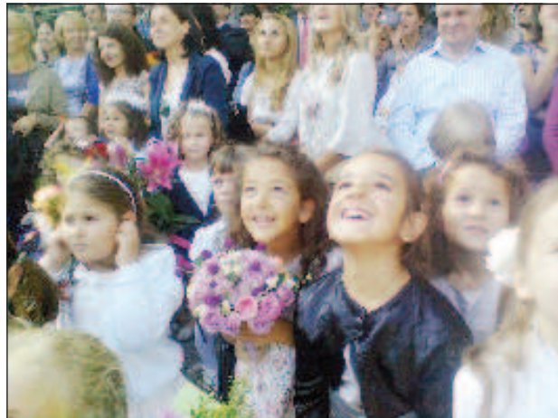
Праздничный салют в нашу честь!

Традиционная линейка во дворе школы продемонстрировала, что в этой школе все ребята талантливы по-своему и их таланты не остаются незамеченными. Главное: всё к месту и все на своём месте. Буквально за час гости и родители убедились, что