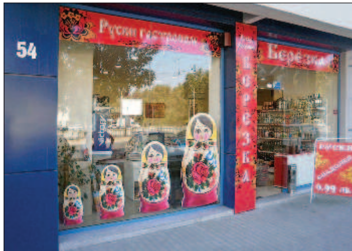
Витрины "Березки" всегда оформлены со вкусом