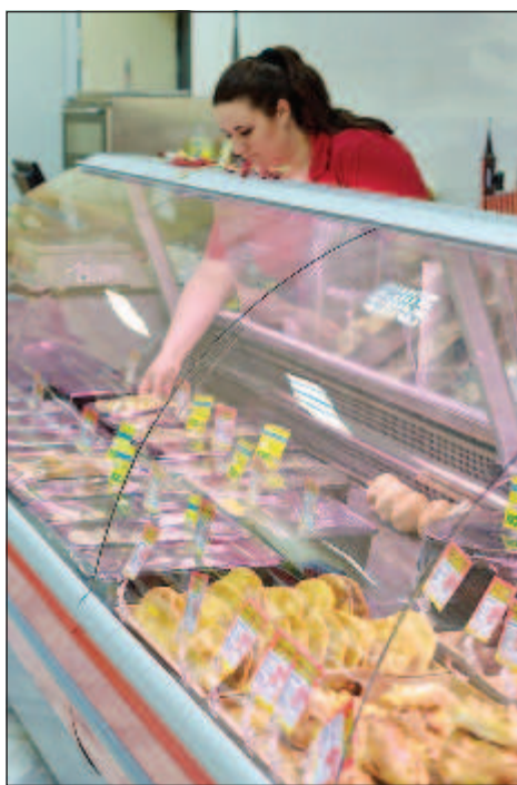
Конек "Березки" - продукты, не характерные для болгарского стола

Конек "Березки" - продукты, не характерные для болгарского стола. Здесь можно купить привычные россиянину продукты: селедку, икру, водку, черный хлеб, сладости производства фабрик "Красный Октябрь" и "Рот Фронт", соки "Сады Придонья", пиво "Балтика" и майонез "Махеев". Набор товаров расширялся постепенно. Всего в ассортименте "Березки" - более 1500 наименований. На ряд товаров семейная компания держит цены, близкие к местным конкурентам, но на некоторые они в разы выше.