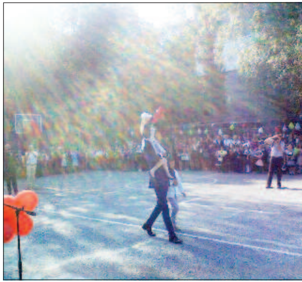
Первый звонок сопровождается радужная аура добра

В школе при российском посольстве начался учебный год