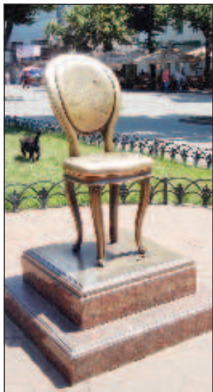
Площадь Остапа Бендера - самая маленькая площадь в мире, а на ней стоит памятник Двенадцатому стулу

Специальная комиссия под руководством Де Рибаса и инженера армий Суворова и Потемкина - Франца де Волана, обследовала черноморское побережье и показала преимущества Хаджибеевской бухты над Оча-