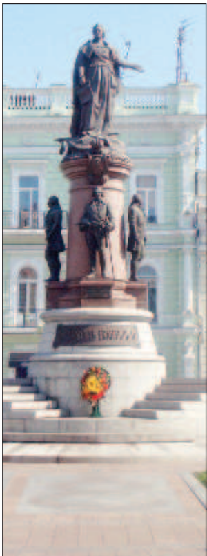
Памятник Екатерине II и основателям города Одессы, среди которых светлейший князь Григорий Потемкин, граф Платон Zubov, адмирал Иосиф де Рибас и инженер Франц де Волан

Скоро Одесса стала центром Новороссии, ее гордостью. Причиной этого были благоприятные экономическая и политическая ситуации. Не имея конкурентов в Черноморско-Азовском бассейне, одесский порт для Европы и Ближнего Востока стал главным поставщиком хлеба. Из года в год стремительно увеличивались портовые обороты, развивался город, росло его население. В 1817 г. здесь насчитывалось 32 тыс. жителей, то есть в 10 раз больше по сравнению с 1797 г. В 1812 г. после Русско-турецкой войны граница отодвинулась от города, а из присоединенной Бессарабии в одесский порт хлынул хлеб и другие сельскохозяйственные продукты. С 1820 по 1861 г. Одесса стала городом европейского масштаба. Основой ее экономического могущества по-прежнему являлась непрерывно растущая торговля. К хлебоэкспортным операциям, по которым одесский порт уверенно удерживал первенство в Европе, прибавился значительный объем импортного оборота, ибо в течение 40 лет с 1819 г. город обладал привилегия-