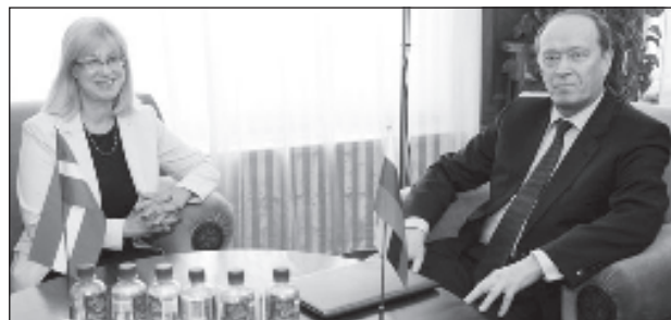
Министр образования Латвии Ина Друзиете и посол России Александр Вешняков

Как отмечает портал, российский посол подарил 2-й Резекненской средней школе книги Валентина Пикуля о Второй мировой войне. 1 сентября на латвийском