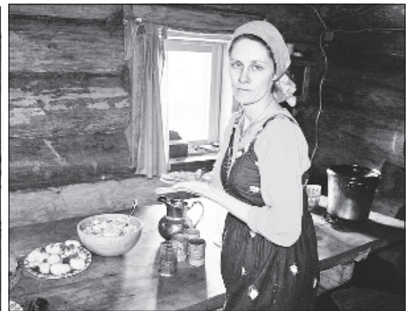
Дом экс-олигарха состоит из одной большой комнаты. В одном углу молятся, в другом готовят, в третьем столуются.