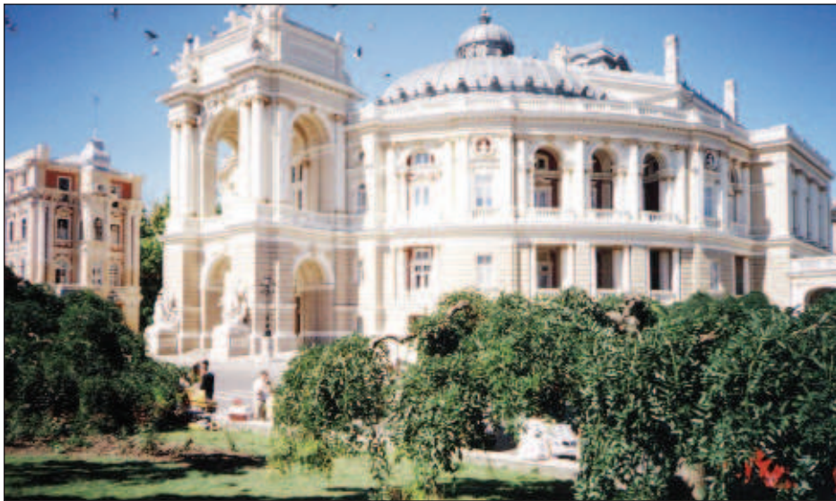
Знаменитый Одесский театр оперы