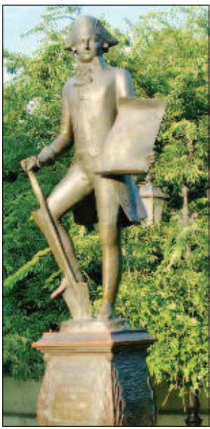
Памятник Де Рибасу