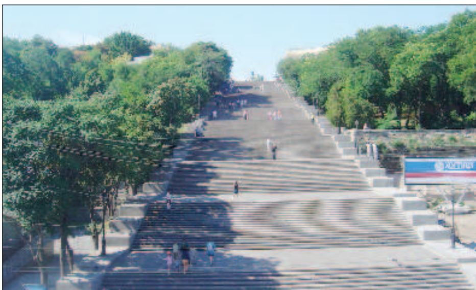
Легендарная Потемкинская лестница - символ города. У нее 192 ступеней, высота - 27 м. Сверху открывается широкая панорама морского порта, гавани и Одесского залива

ми порто-франко, то есть на его территории можно было без уплаты пошлины торговать иностранными товарами.