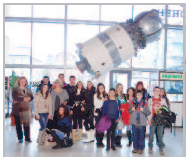
4 февраля ученики школы №112 имени Стояна Заимова города Софии и профессиональной гимназии по металлоэлектротехнике имени Юрия Гагарина города Петрич посетили РКИЦ в Софии. Школьники ознакомились с выставкой, посвященной 70-летию снятия блокады Ленинграда, и с выставкой, посвященной Зимним Олимпийским играм 2014 в Сочи, Россия. Учащиеся школ с большим интересом посмотрели в РКИЦ фильмы о блокаде Ленинграда и о полете Юрия Гагарина в космос