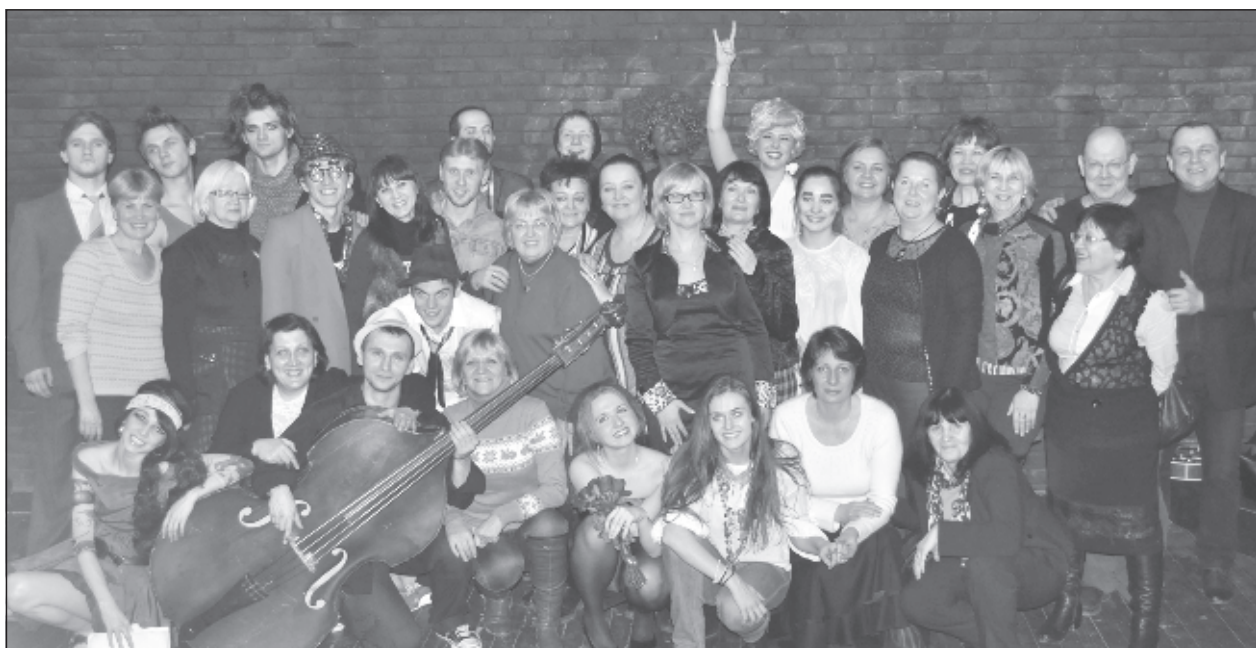
Незабываемое посещение ГИТИСа. Мы попали на экзаменационный спектакль будущих режиссеров. Насмеялись от души и зарядились энергией на несколько месяцев вперед

Понравился проект "Бампер" - детский книжный магазин и клуб на колесах. В автобус "Бампер" можно прийти купить книгу, почитать книгу, поговорить про книгу, повстречаться с автором книги, а также поиграть, сочинить свою собственную и нарисовать к ней