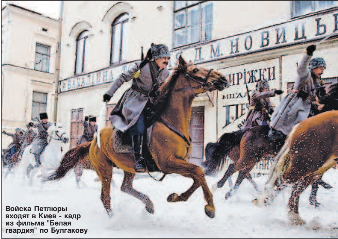
Войска Петлюры входят в Киев - кадр из фильма "Белая гвардия" по Булгакову

В эти дни в связи с событиями в Киеве постоянно слышится этот адрес - улица Грушевского. Там баррикады, столкновения - место знаковое. Михаил Сергеевич Грушевский - украинский и советский историк. Все свои основные труды он написал до революции. Смысл его 10-томной монографии "История Украины-Руси" - это попытка доказать, что украинский народ именно как украинский этнос сложился еще во время Киевской, домонгольской Руси, то есть возникновения близких, брат-