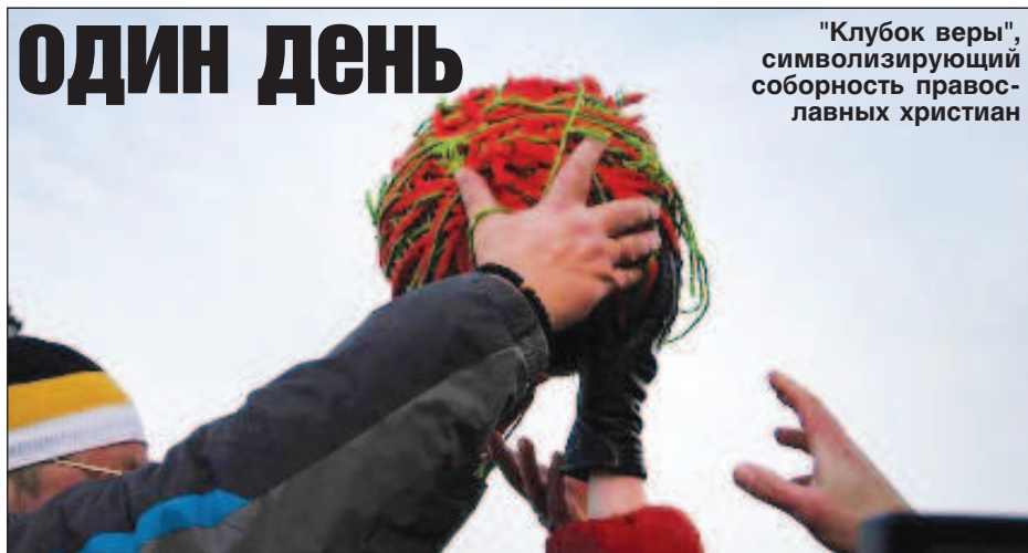
"Клубок веры", символизирующий соборность православных христиан

Также, президент Владимир Путин поздравил патриарха Московского и всея Руси Кирилла с пятилетием со дня интронизации и отметил вклад Предстоятеля Русской православной церкви не только в религиозную, но и в общественную работу. "Я уверен, знаю точно, что эти пять лет пролетели для вас как один день, потому что вы всегда с людьми, всегда в работе, занимаетесь не только чисто религиозной деятельностью, но и большой общественной ра-