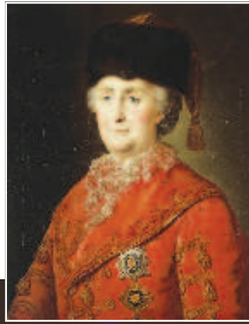
Портрет Екатерины II в Эрмитаже

тисса, Пикассо и других художников новых направлений.