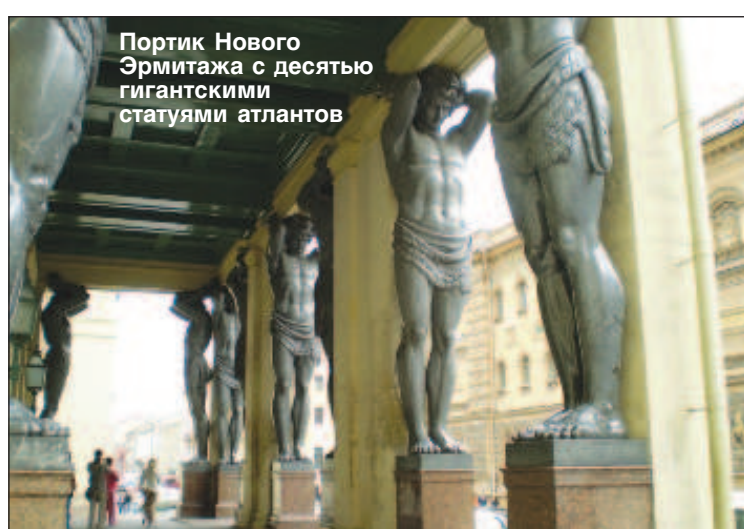
Портик Нового Эрмитажа с десятью гигантскими статуями атлантов

В XVIII веке благодаря Екатерине II в России пробудился интерес к коллекционированию. Это увлечение затем достигло небывалого размаха, в России скопилось огромное богатство - выдающиеся произведения западноевропейских мастеров. Желая утвердить за собой славу "просвещенной государыни", ценительницы искусств, и затмить величием своего двора дворцы европейских правителей, она начала коллекционировать произведения искусства. Знатки живописи, европейские эрудиты, среди которых был и французский философ-просветитель Дени Дидро, собирали и закупали для русской императрицы коллекции картин. В 1769 г. в Дрездене была приобретена для Эрмитажа богатая коллекция саксонского министра графа Брюля, насчитывавшая