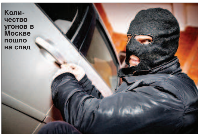
Количество угонов в Москве пошло на спад

Такое серьезное снижение угонов произошло благодаря новым способам работы столичной полиции. Например, начал эффективно работать так называемый план "Перехват". Про него многие слышали. Но даже опытные угонщики его не сильно опасались. Однако после изменения подхода к проведению этого