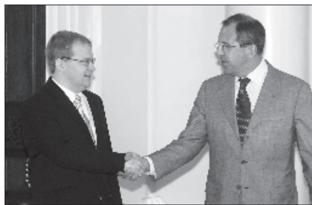
Сергей Лавров (справа) и Урмас Паэт

Работа над документами велась 23 года, их планировали подписать еще в 2000-х годах. Собственно, договор о границе стороны заключили в 2005 году, однако позднее Россия отозвала свою подпись. Поводом для этого стала инициатива эстонского парламента, который во время ратификации документа вставил в соответствующий акт упоминание о Тартуском мирном договоре 1920 года (он был заключен между большевистской Россией и Эстонской Республикой). По документу начала XX века к республике переходили, в частности, волость