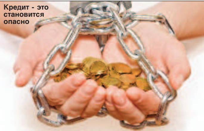
Кредит - это становится опасно

В течение предыдущих 12 месяцев кредитный портфель населения стабильно рос быстрее корпоративного, в среднем на 0,5-1,5 процентных пункта. В период с января по декабрь 2013 г. темпы роста корпоративного кредитования сократились на 0,2% и 0,7% соответственно. Январскую статистику экс-