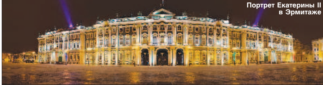
Эрмитаж ночью, вид с Дворцовой площади

ние дальнейшему развитию музея: они закупают уже не только коллекции, но и отдельные произведения художников, среди которых были работы Караваджо, Боттичелли, Джорджоне. Жозефина Богарне, императрица Франции в 1804-1809 гг., первая жена Наполеона, подарила Александру I знаменитую камею Гонзага, а после ее смерти была приобретена и вся галерея дворца Мальмезон. В 1814 г. было