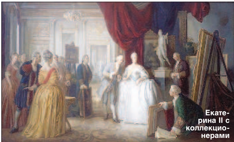
Екатерина II с коллекционерами

По окончании войны в Эрмитаж стало поступать трофейное искусство из музеев Берлина, включая Пергамский алтарь. В 1954 г. была организована постоянная выставка этих поступлений, затем советское правительство по просьбе правительства ГДР вернуло их в