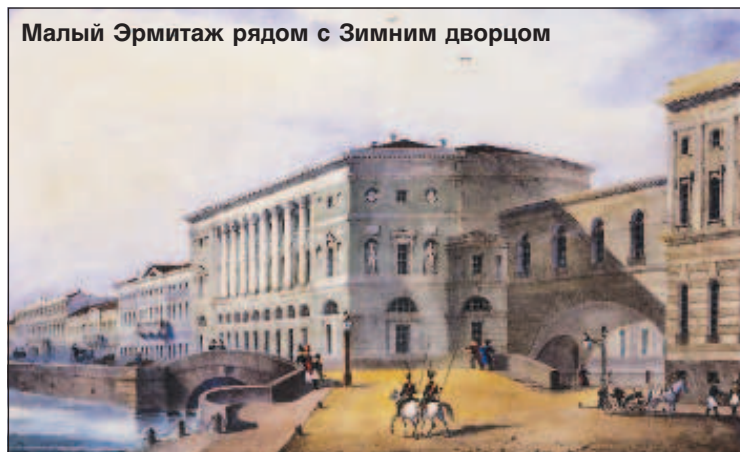
Малый Эрмитаж рядом с Зимним дворцом

голландских и фламандских художников, которые она приобрела в Берлине через агентов у германского купца Гоцковского.