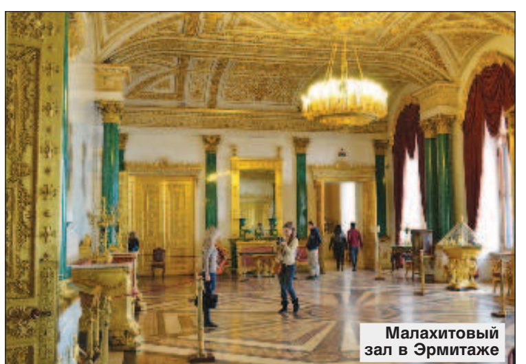
Малахитовый зал в Эрмитаже

Именно при Николае I была реализована идея превращения Эрмитажа в публичный музей: в 1852 г. Эрмитаж был открыт для посещения. Так, Новый Эрмитаж - первое в России здание, специально построенное для широкой публики. Оно является частью музейного комплекса Эрмитажа и известно своим портиком с десятью гигантскими статуями атлантов. Николай I внес существенный вклад в пополнение картинной галереи Эрмитажа. В 1845 г. по завещанию выдающегося русского дипломата и знатока изящных искусств Дмитрия Павловича Татищева к собранию прибавилась его огромная коллекция работ старых мастеров - более 20 полотен. К этому времени в музее хранились уже богатейшие коллекции памятников древневосточной, древнеегипетской, античной и средневековой культур, искусства Западной и Восточной Европы, археологических и художественных памятников Азии, русской культуры