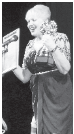
Победителем в номинации "Лучший клуб ФСС-2015" стал Русский клуб "Встреча" (г.Перник)

Специальная награда Координационного совета российских соотечественников в Болгарии "Горячее сердце" была вручена тем, кто