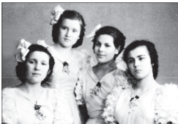
В ансамбле "Трудовые резервы", 1951 год

бежала в госпиталь, а там - радость и веселье! Гуляли целый день. После войны я поступила в художественно-ремесленное училище, при котором существовал ансамбль "Трудовые резервы", я туда пошла танцевать. Мы много ездили по стране, были в Польше, Будапеште. Выступали в