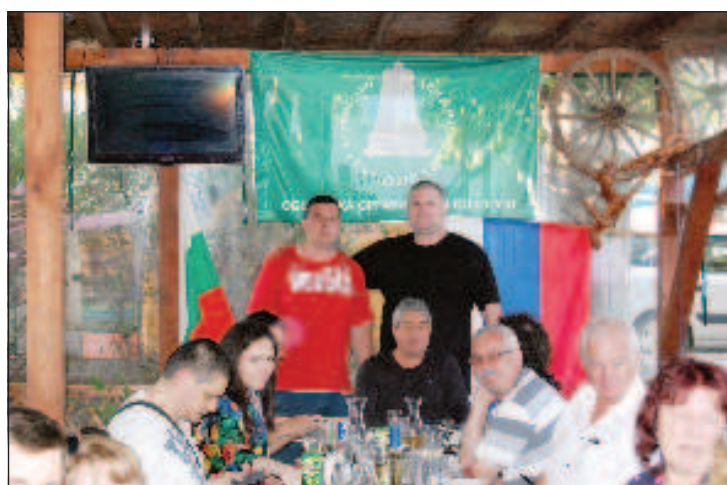
Соотечественники и русофилы отметили День России