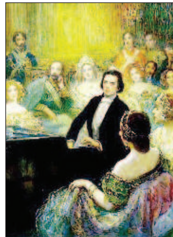
Николай Рубинштейн играет для императорской семьи в присутствии Александра II

После этого Рубинштейн вернулся к своей артистической деятельности. Он стал ежегодно давать концерты в Москве, Петербурге и Лондоне. Многие богатые представители английского общества нередко приглашали его играть на своих музыкальных