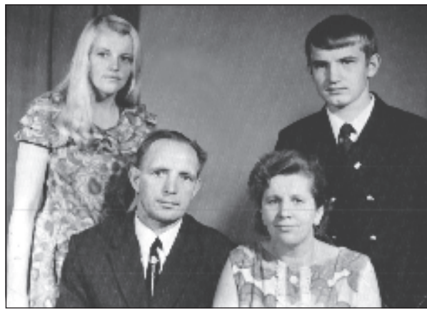
1972 год, С семьей