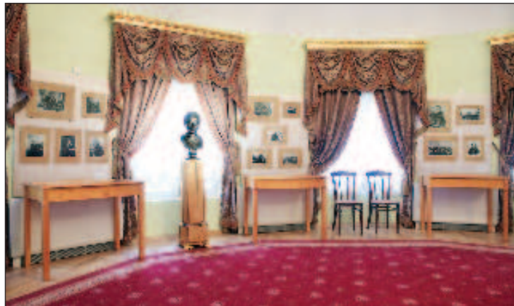
В музее Николая Рубинштейна при Московской консерватории

В начале 1881 г. музыкант стал хворать, однако, по-прежнему продолжал неутомимо нести свои обязанности. Еще в феврале он давал, хотя и совсем больной, концерт в Петербурге, а затем, возвратившись в Москву, несмотря на то, что ему делалось все хуже, решил дирижировать на симфоническом концерте Музыкального Общества. Он был так слаб, что не мог уже стоять на ногах и дирижировал сидя. К концу концерта ему сделалось так худо, что его пришлось унести на руках. В то же время ему было предложено руководить русскими концертами на Всемирной Выставке в Париже. Туда же, для совета с специалистами, его послали и московские врачи. В конце февраля Рубинштейн выехал в Париж, но ему не пришлось уже выступать: несмотря на усилия лучших французских врачей, болезнь быстро двигалась вперед, и 11-го марта 1881 г. великий музыкант скончался в Париже. Ему было неполных 46 лет.