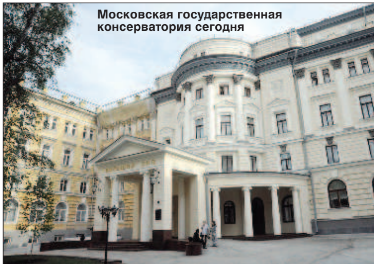
Московская государственная консерватория сегодня

тельный экзамен и был принят на Юридический Факультет. В это время ему было только 16 лет.