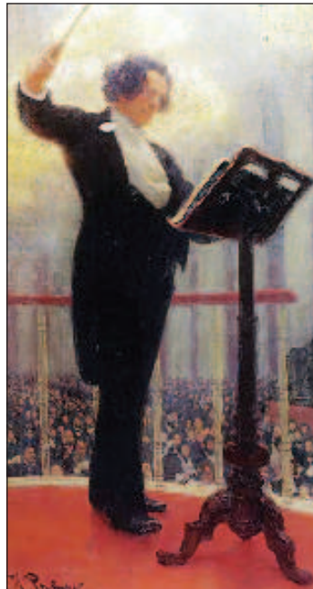
Антон Рубинштейн за дирижерским пультом

Несмотря на свои 20 лет, он пользовался уже широкой известностью, как прекрасный виртуоз и преподаватель музыки. Поэтому его желание взять все расходы по дому на себя было бы легко выполнимо, если бы он мог устраивать концерты, но он был связан словом, данным родным жены, - не появляться на концертных подиумах. Поэтому ему приходилось довольствоваться одними уроками. Чтобы хватало на большие домашние расходы, ему пришлось ездить по урокам по 12 часов в день. Все это