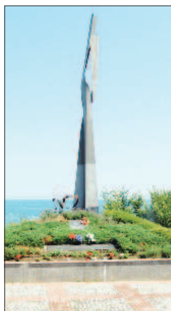
Памятник советским морякам-подводникам в Созополе

присутствующих были георгиевские ленты, государственный флаг Российской Федерации и Знамя Победы - штурмовой флаг 150-й ордена Кутузова II степени Идрицкой стрелковой дивизии. Кстати, государственные флаги Болгарии и России присутствуют на каждом празднике, организованном созопольскими русофилами, в знак братской любви и дружбы двух православных народов.