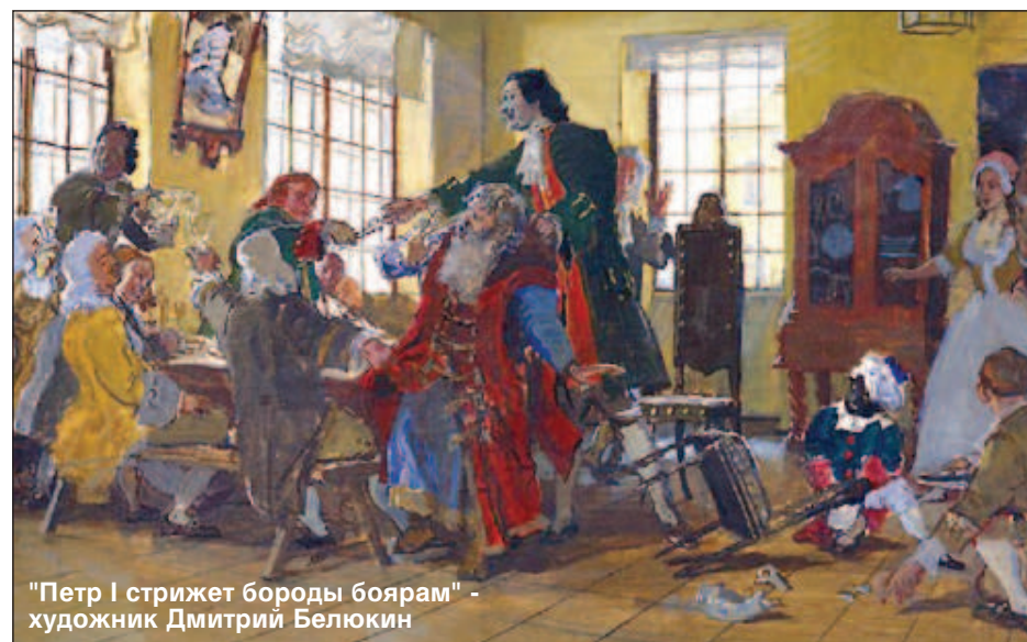
"Петр I стрижет бороды боярам" - художник Дмитрий Белюкин

"Боярам и окольным и Думным и Ближним людям и Стольникам и Дворянам и Дьякам и Жильцам и городским Дворянам и приказным людям и драгунам и солдатам и стрельцам и чёрным слобод всяких чинов людям Московским и городским жителям, и которые помещиковы, и вотчинниковы крестьяне, приезжая, живут на Москве для