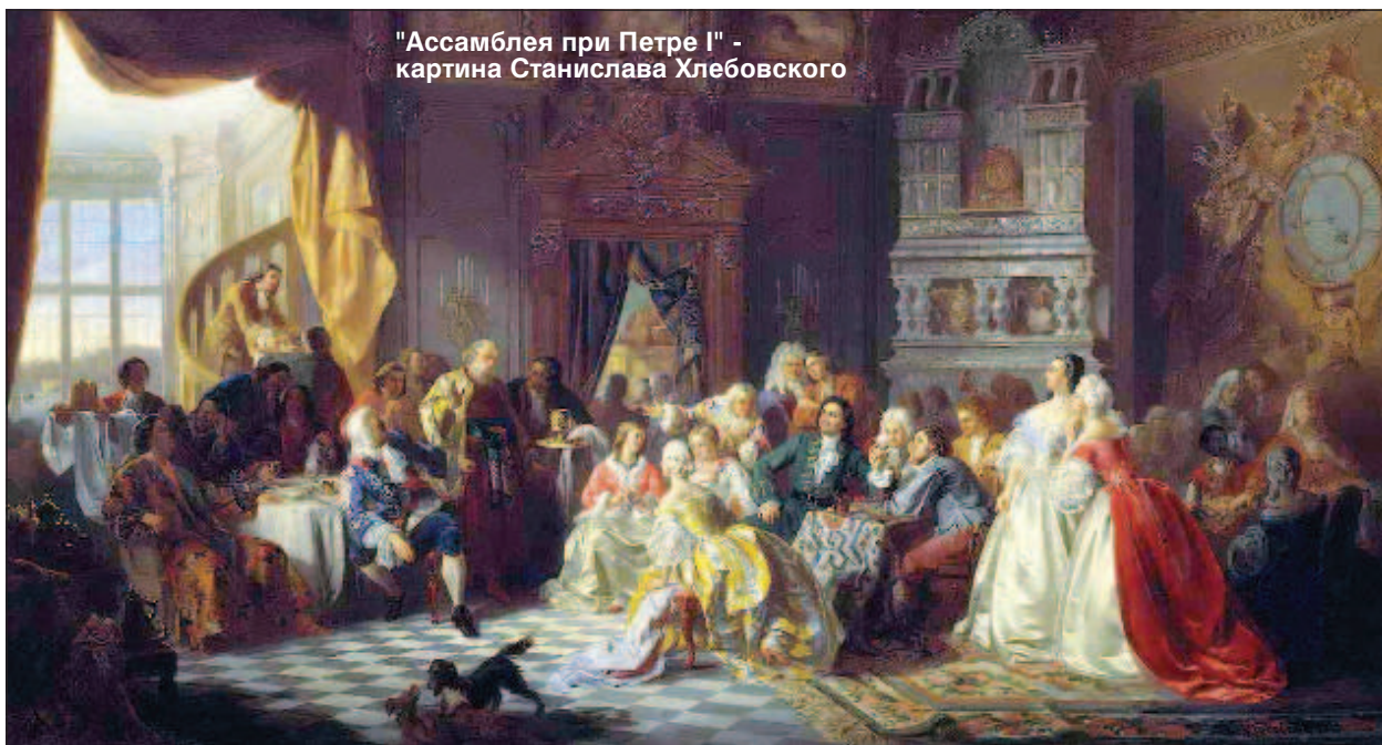
"Ассамблея при Петре I" - картина Станислава Хлебковского

шении европейских платьев Петр "озвучил" еще в 1699 году, но их восприняло только царское окружение. Указ 1700 года царь, как говорится, выносил и выстрадал. Поэтому, объявив, стал жестко добиваться выполнения. Всего в период своего правления Петр издал 17 указов, в разной степени регламентировавших внешний вид подданных и правила ношения различных видов одежды. Первый указ был относительно коротким и давал именитым людям какое-то время "на раскачку". В декабре следующего года появился очередной указ "О ношении всякого чина людям Немецкого платья и обуви и об употреблении в верховой езде Немецких седел", бывший более конкретным и детальным, поэтому стоит привести его полностью.