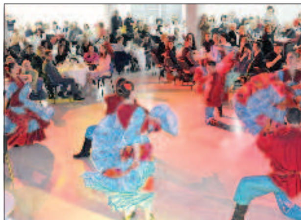
Танцевальный состав из Пловдива - "Этноритмы"