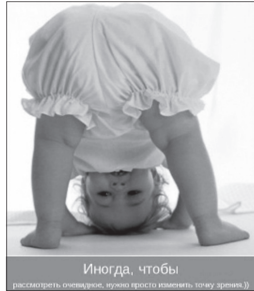
Иногда, чтобы рассмотреть очевидное, нужно просто изменить точку зрения.))

Медицина - это та область, в которой без юмора не обойтись. Потому что от всех этих диагнозов, больных, справок, анализов, медосмотров, "мне только спросить" и прочей суматохи, которой наполнены рабочие будни врачей, можно