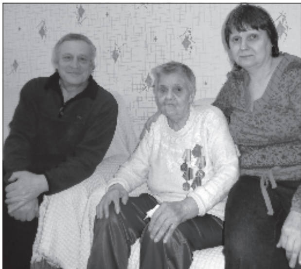
С дочерью и зятем

1938 и 1940 года рождения. Вот и упростила, чтобы брата вместо меня в Германию угнали. После войны он вернулся домой.