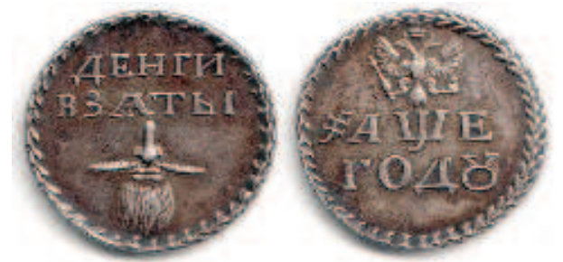
Бородовой знак - своего рода квитанция об уплате налога за ношение бороды

Нововведение приживалось тяжело, приходилось не только неоднократно объявлять и разъяснять указ, но даже вывешивать в людных местах специальные "чучела", обряженные в иноземные платья, чтобы показать, как теперь необходимо выглядеть. Понятно, что в одночасье всех переодеть не получится, поэтому царь дал отсрочку неумиленным на два года, чтобы доносить старую одежду. Но с 1705 года повелено было всем появляться в людных