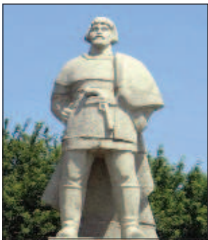
Единственный на территории всей России памятник Пугачеву находится в Саранске

21 января 1775 года состоялась самая известная публичная казнь в России. Хотя в тот день стоял жесточайший мороз, вся Болотная площадь была забита людьми. Это была казнь века. На эшафоте перед палачом стоял Емельян Иванович Пугачев.