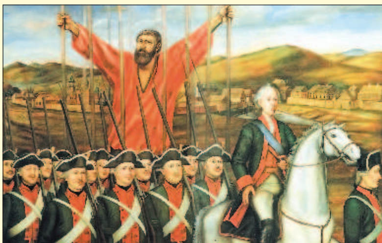
Поверженного Пугачева конвоировал в Москву сам Суворов

В сентябре 1774 года Емельян Пугачев был передан властям некоторыми своими соратниками. Сначала он содержался под следствием в Яицком городке, где его лично допросил генерал-поручик Александр Васильевич Суворов, а затем был отправлен в Симбирск. Здесь Пугачева вновь допрашивали в течение нескольких дней и впервые к нему применили пытки, в результате которых он оговорил себя и своих сподвижников (правда, позднее на следствии в Москве эти оговоры были опровергнуты). Допрос вели командующий карательными войсками граф Петр Иванович Панин и