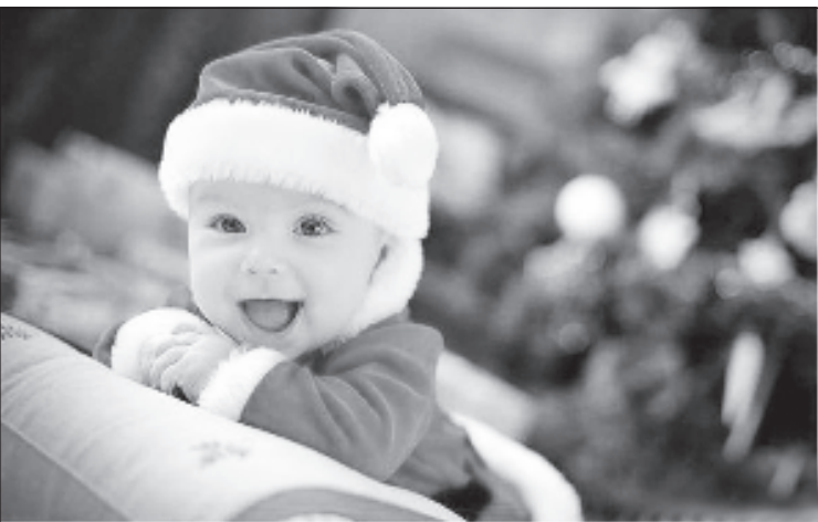
Все только начинается...

23 января Мраморный зал. 18.00 Концерт лауреата международных конкурсов, пианиста Дениса Громова (см. подробнее) Большой зал. 19.30. Спектакль по произведениям А.П. Чехова „Конец сада“ 24 января Большой зал. 19.00. Авторский спектакль болгарского режиссера Димитра Кабакова „Любовь. com“ Малый зал. 11.00. Детское киноутро. „СНЕЖНЫЕ ДОРОЖКИ“, сборник мультфильмов 26 января Большой зал. 19.00. Авторский спектакль болгарского режиссера Димитра Кабакова „Любовь. com“ 27 января Малый зал. 18.00-19.00. Лекторий „Православное просвеще- ние“. Публицистический сериал „РОМАНОВЫ: ЦАРСКОЕ ДЕЛО“ Фильм второй "ВПЕРЕД - К ВЕЛИКОЙ ИМПЕРИИ" (от Петра Первого до Елизаветы Петровны) 28 января Малый зал. 18.00 – 20.10 Премьера „МЕТРО“ (2012 г.) Фильм-катастрофа, снятый по мотивам одноименного романа Дмитрия Сафонова 29 января Зал №204. 17.30. Презентация книги Цвети Пчелинского „Истоки истории почты и телекоммуникаций в Болгарии“, посвященной 135-летию создания почты и телеграфа в Болгарии. Муз. салон. 17.30. Заседание Клуба любителей русской книги Малый зал. 18.00-19.50. Посвящается 70-летию Победы. Док. экран «БЛОКАДА ЛЕНИНГРАДА», «НА ВОСТОК»