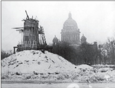
Замаскированный Медный всадник

Второй раз мне все-таки удалось пробраться в город: я взяла кое-какие вещи, оставленные у знакомых - и обратно. Когда отец приехал в Ленинград, то обнаружил, что наша квартира занята другими людьми. Папе удалось освободить одну комнату, хотя люди, проживающие в нашей квартире, говорили: "У нас такие связи, что мы отсюда не уедем". Оказывается, управдом сказал, что наша семья вся погибла. Таких случаев было