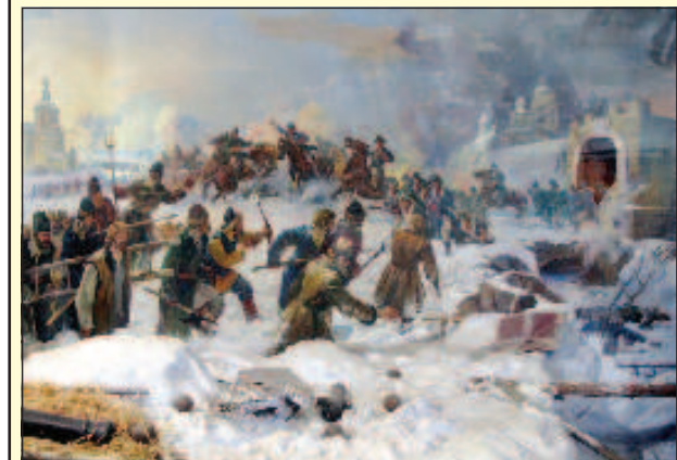
"Штурм Оренбурга Пугачевым". Фрагмент диорамы в музее истории города

Жесткий курс стал проводиться правительством и в отношении казачества. В Донском, Волжском, Терском и Яицком казачьих войсках вводилось "регулярство" с постоянной и обременительной для казаков службой, постепенной ликвидацией старинных казачьих прав. Имея такие оправданные причины для протеста, восставшие,