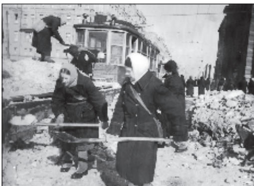
Очистка трамвайных путей