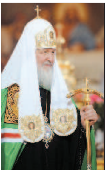
Святейший Патриарх Московский и всея Руси Кирилл выразил надежду на то, что участие Российской