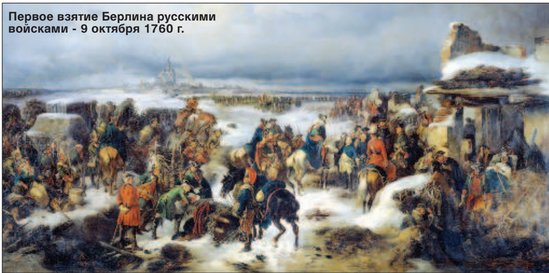
Первое взятие Берлина русскими войсками - 9 октября 1760 г.

Вслед за этим на помощь Берлину подошел прусский корпус принца Евгения Вюртембергского, что заставило Тотлебена отступить. В столице Пруссии ликовали рано - к Берлину подошли основные силы союзников. Генерал Чернышев стал готовить решительный штурм. Вечером 27 сентября в Берлине собрался военный совет, на котором было принято решение - ввиду полного превосходства противника город сдать. Так 28 сентября (9 октября по но-