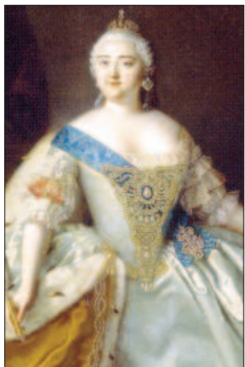
"Союз трех баб" - императрица Елизавета Петровна, Мария-Терезия австрийская и маркиза де Помпадур

согласованность. В битве при Лигнице пруссаки нанесли поражение австрийцам. Французы и австрийцы, обеспокоенные ситуацией, призвали активизировать свои действия русскую армию. В качестве цели для нее был предложен Берлин. Столица Пруссии не представляла собой мощную крепость. Слабые стены, переходящие в деревянные палисад, - прусские короли не рассчитывали, что им придется сражаться в собственной столице. Сам Фридрих был отвлечен борьбой с австрийс-